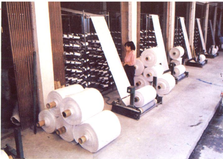
苍南县塑料二厂一角