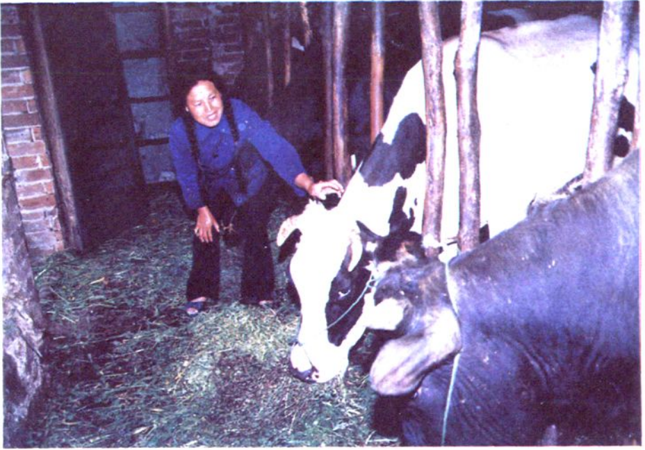
凤池乡饲养奶牛专业户