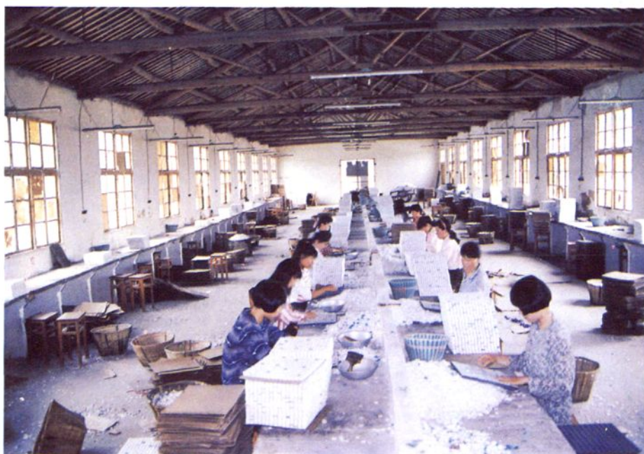
苍南县玻璃马赛克厂