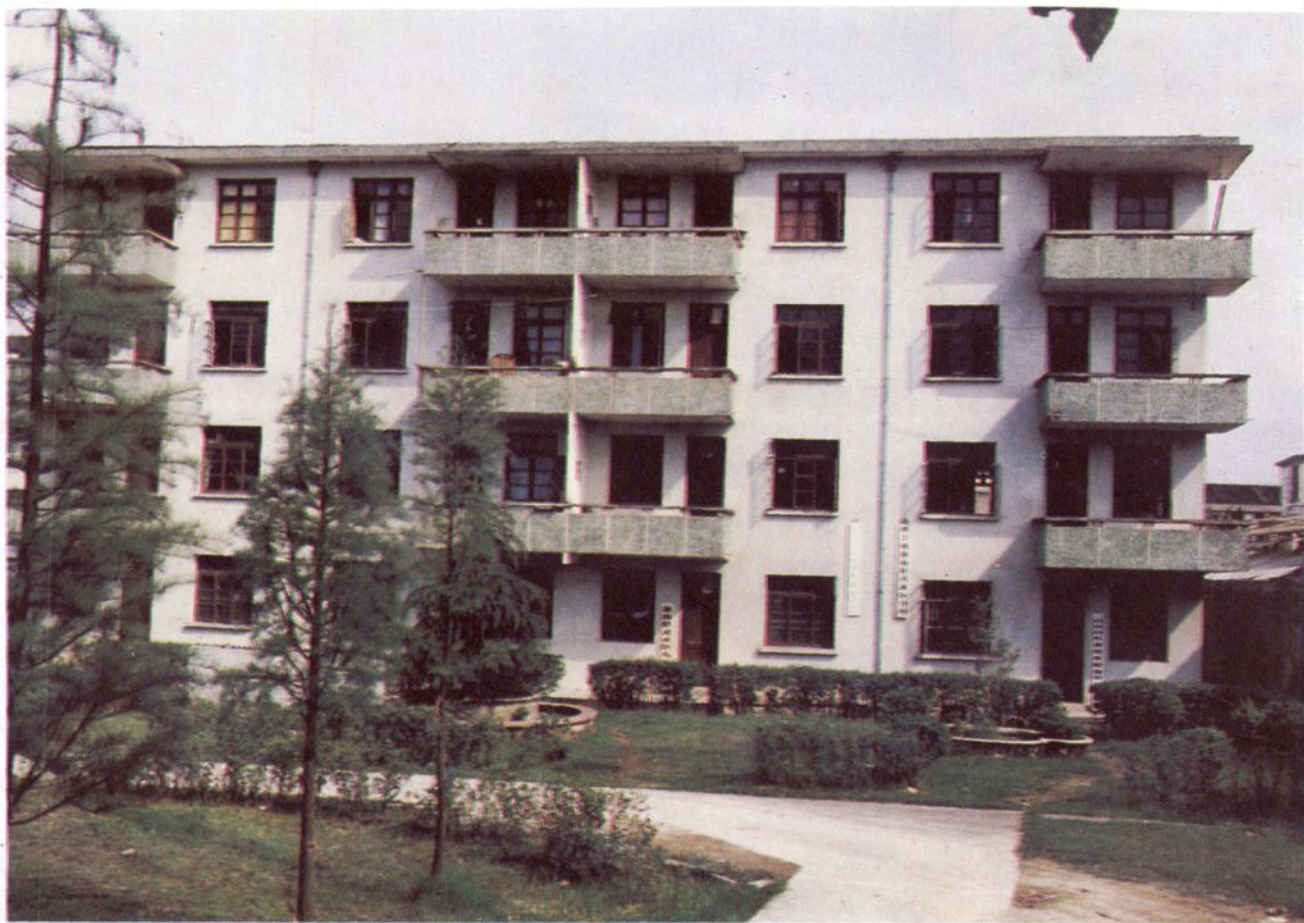
中共灵溪区委、区公所办公楼