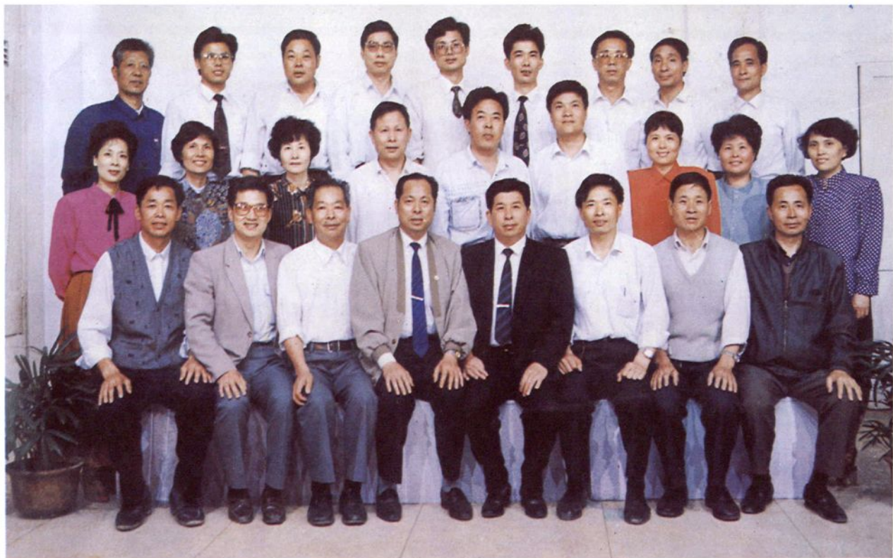
灵溪区机关全体工作人员留影（从左至右）