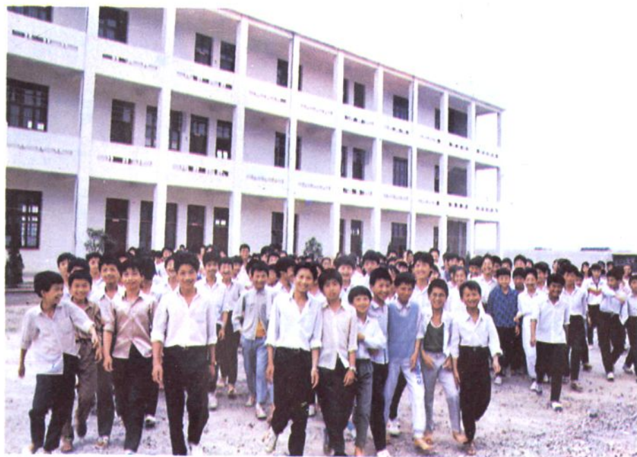
灵江镇中学教育楼