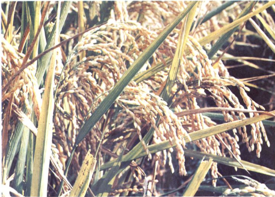
灵溪区水稻吨粮田