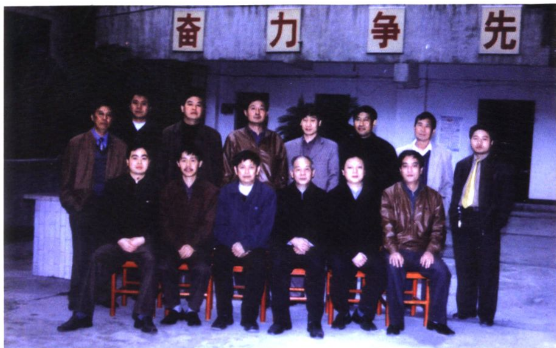
审稿会全体成员合影