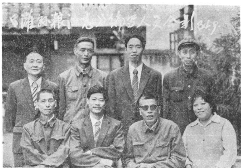
《灌县粮油志》编写人员合影