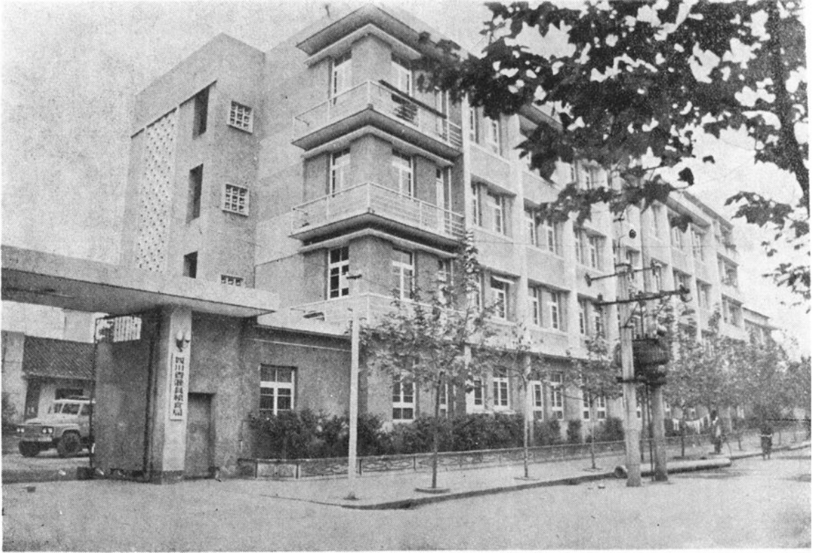
灌县粮食局机关近影