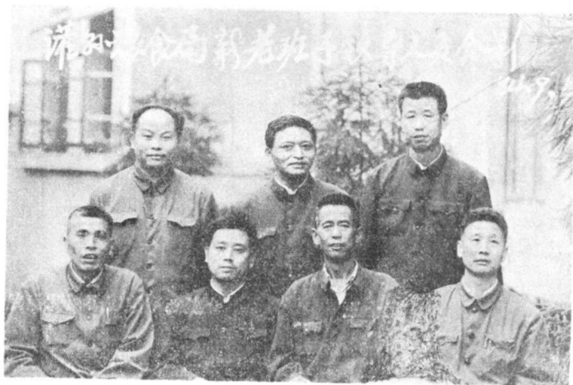
灌县粮食局新老班子领导成员合影