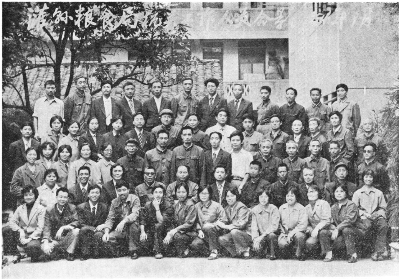
灌县粮食局机关人员合影