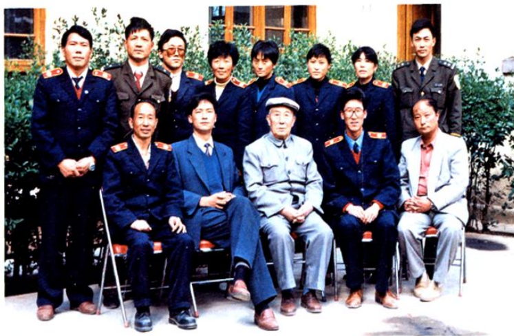
1997年4月9日，省高院原副院长孙志能（前排中）来院指导工作。