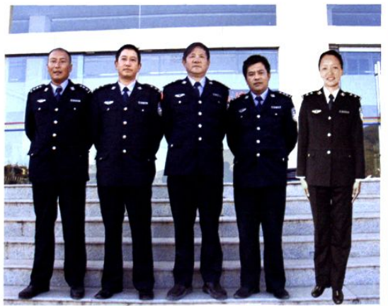
2011 年法警大队成员合影