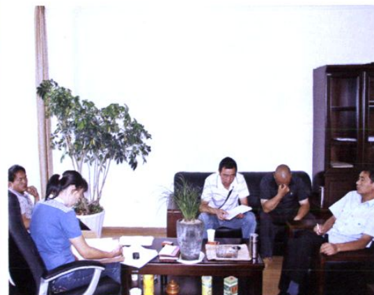
2011年，县纪工委来院考核党风廉政建设情况。