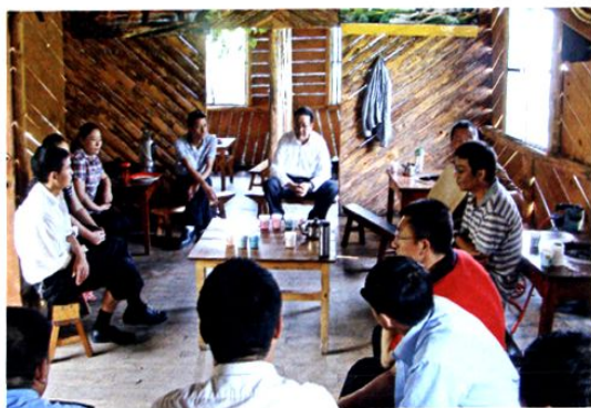
2011年，州中院常务副院长彭跃群（右中）来院指导工作。