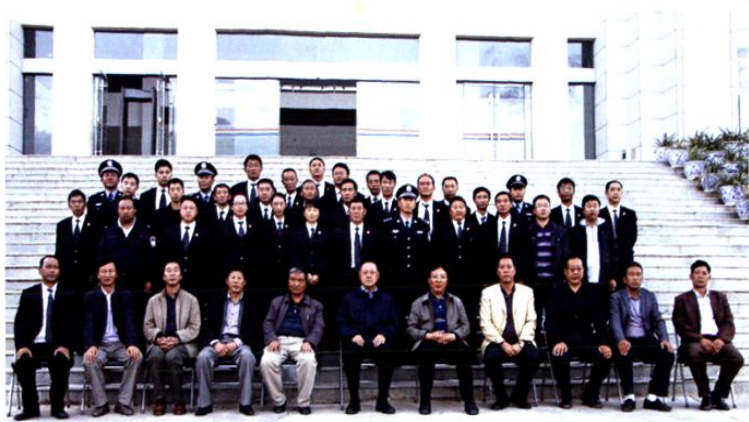
2011年10月，省高院党组书记、院长许前飞（前排中）与院部分干警合影。