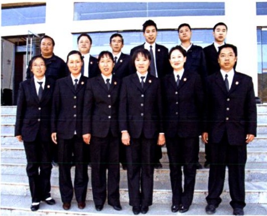
2011 年院办公室成员合影