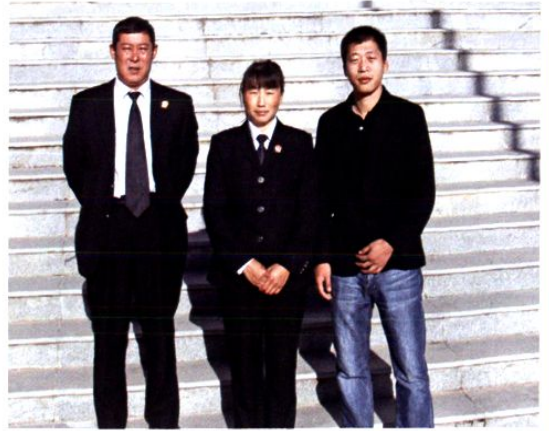
2011 年政治处成员合影