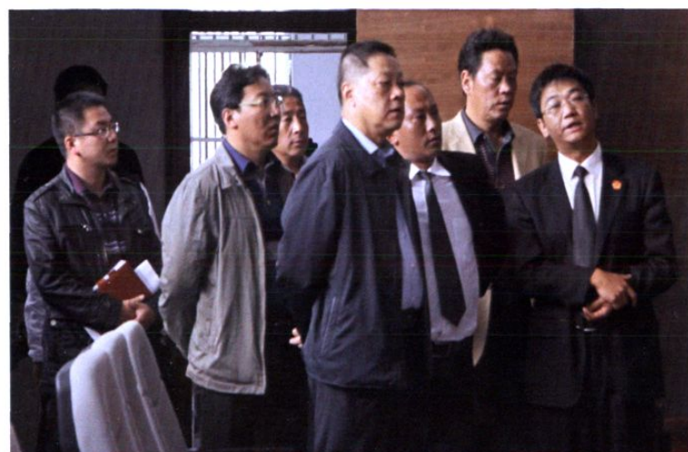
2011年10月，省高 院党组书记、院长许前飞 （左四）到院视察法庭工作。