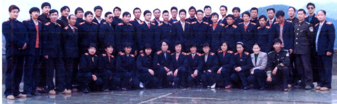
1997年县人民法院全体干警合影