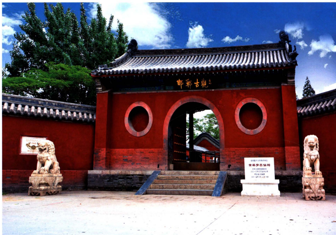
黄梁梦吕仙祠（2015年摄）