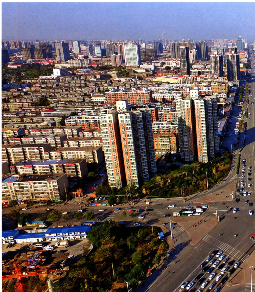
滏东大街与南环路、渚河路交叉口周边鸟瞰图（2016年摄）