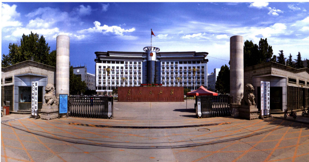
邯鄲縣機關大院（2016年9月攝）