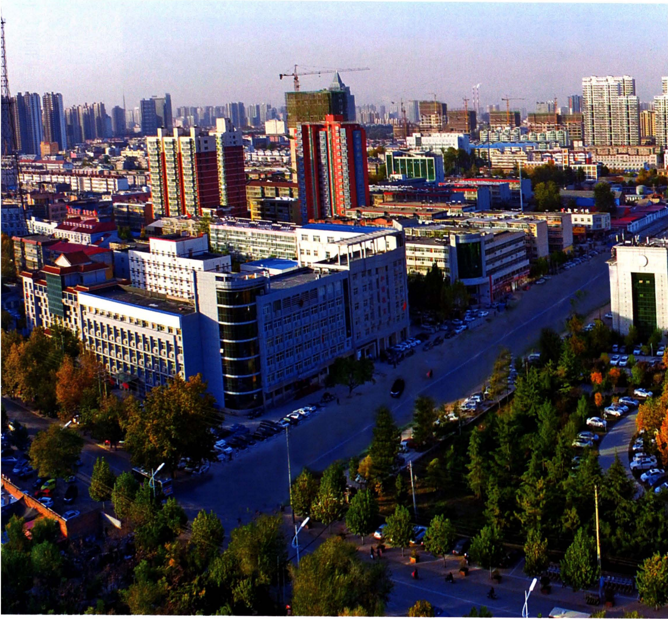
邯郸县机关大院周边鸟瞰图（2016年9月摄）