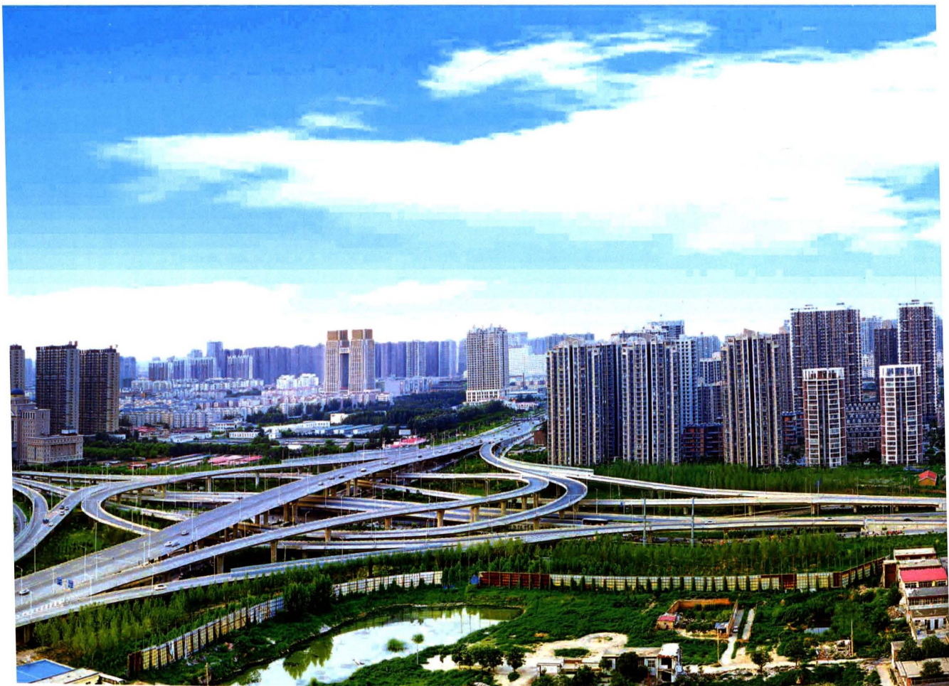
人民路（东环路以东段）鸟瞰图（2014年摄）