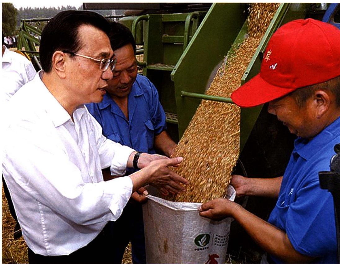
2013年6月7日国务院总理李克强视察邯郸县裴东堡村麦收情况