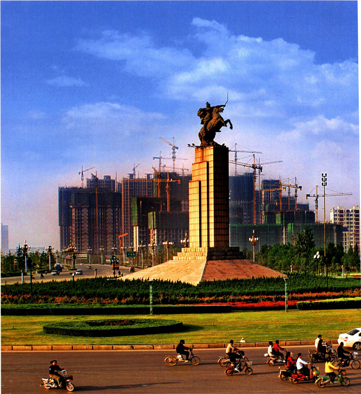
东环路与邯临路交叉口（2009年摄）