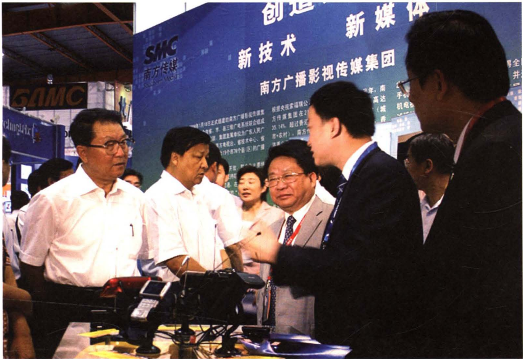
时任中共中央政治局常委李长春同志在视察中国国际广播电视博览会集团新媒体展区。