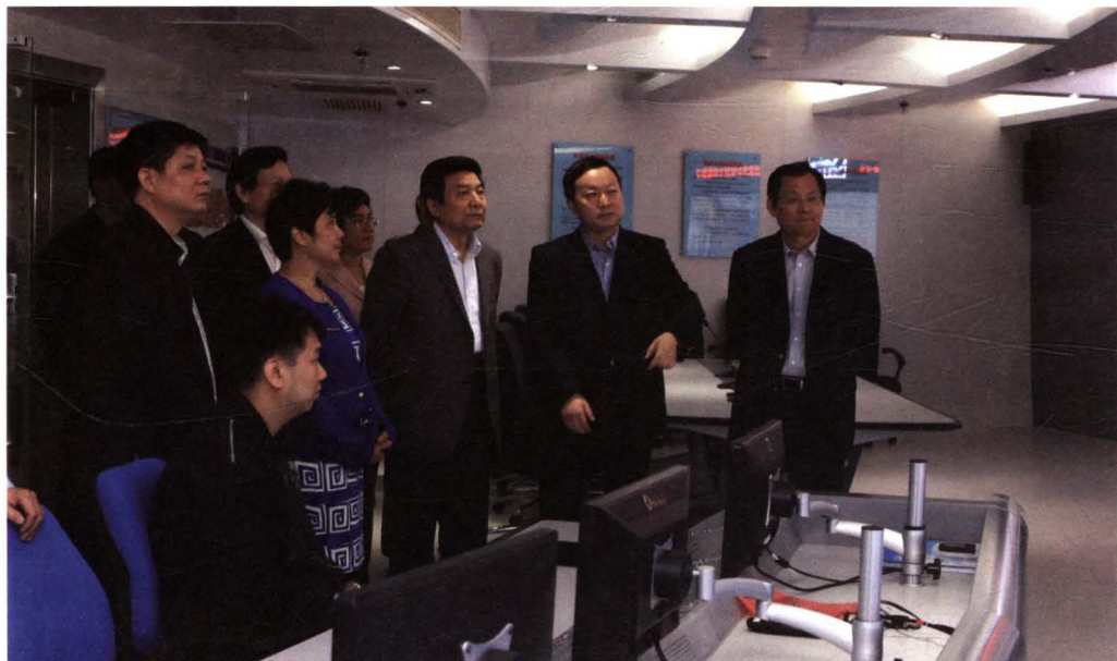
国家新闻出版广电总局蔡赴朝局长在广州视察指导集团工作。