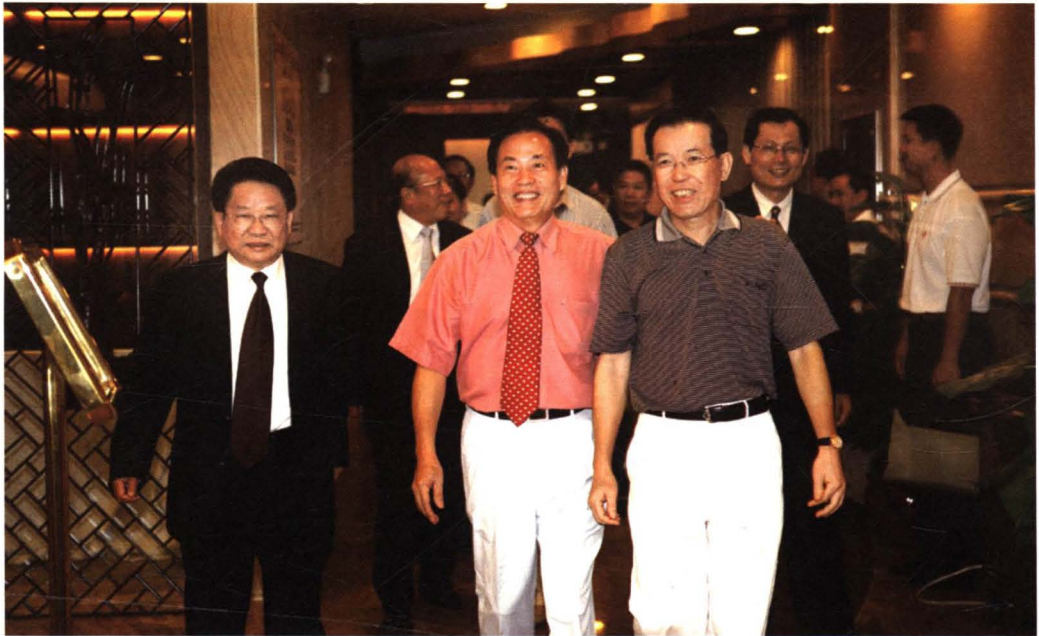
原广东省省长卢瑞华同志等参加广东省电视艺术家协会中秋联谊会并获赠省视协高级顾问聘书。