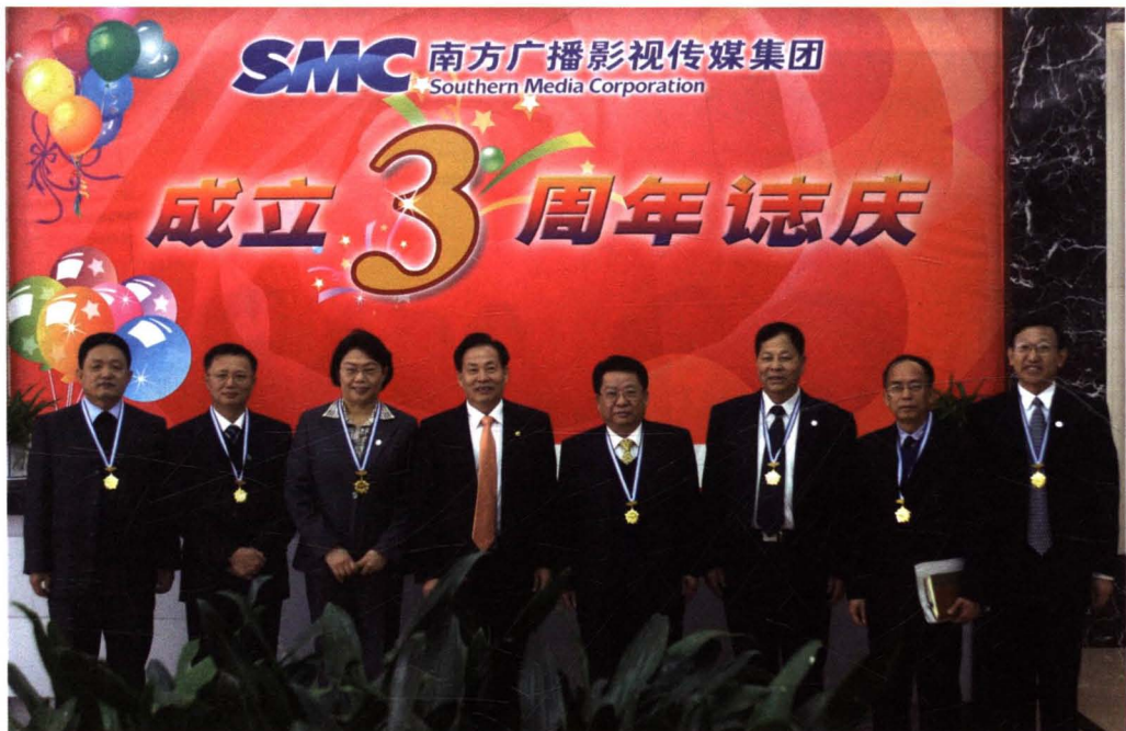
时任广东省副书记蔡东士同志在参加集团三周年志庆活动。