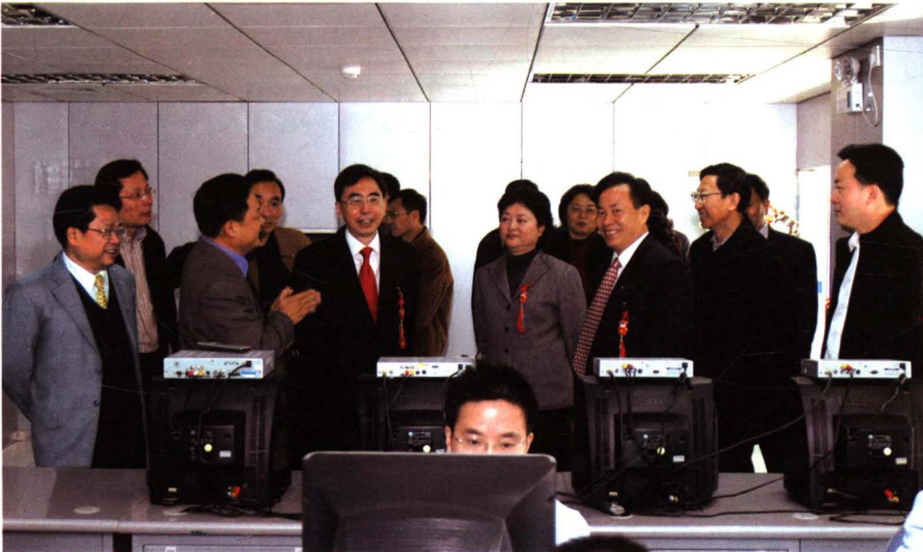
时任省委常委、宣传部朱小丹部长等省领导春节慰问集团干部职工。