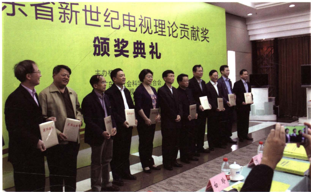
原省委常委、宣传部长、副省长钟阳胜同志等参加广东省新世纪电视理论贡献奖颁奖典礼。