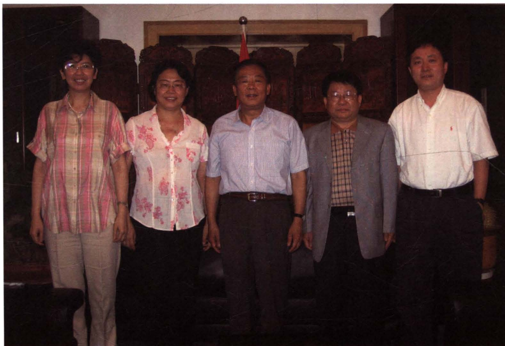
时任国家广电总局王太华局长等在京听取集团工作汇报。