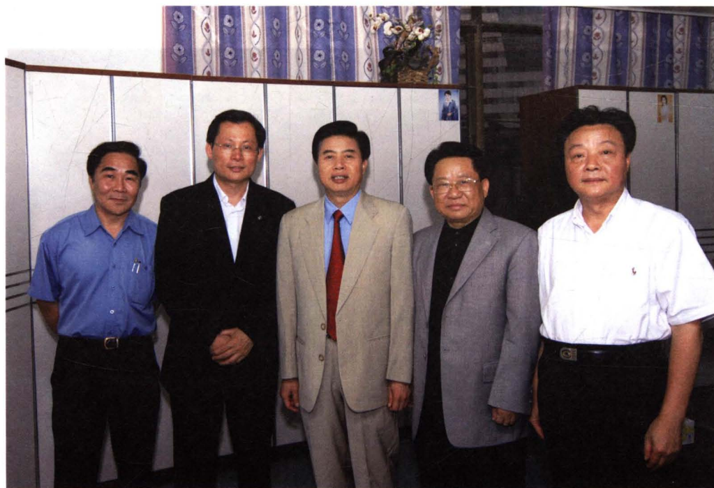
时任广东省省长黄华华同志在广东电视台接受采访。