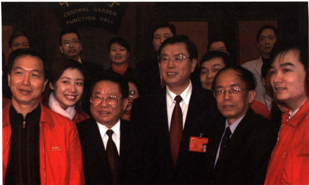
时任中共中央政治局委员张德江同志在看望集团领导和“两会”新闻报道人员。