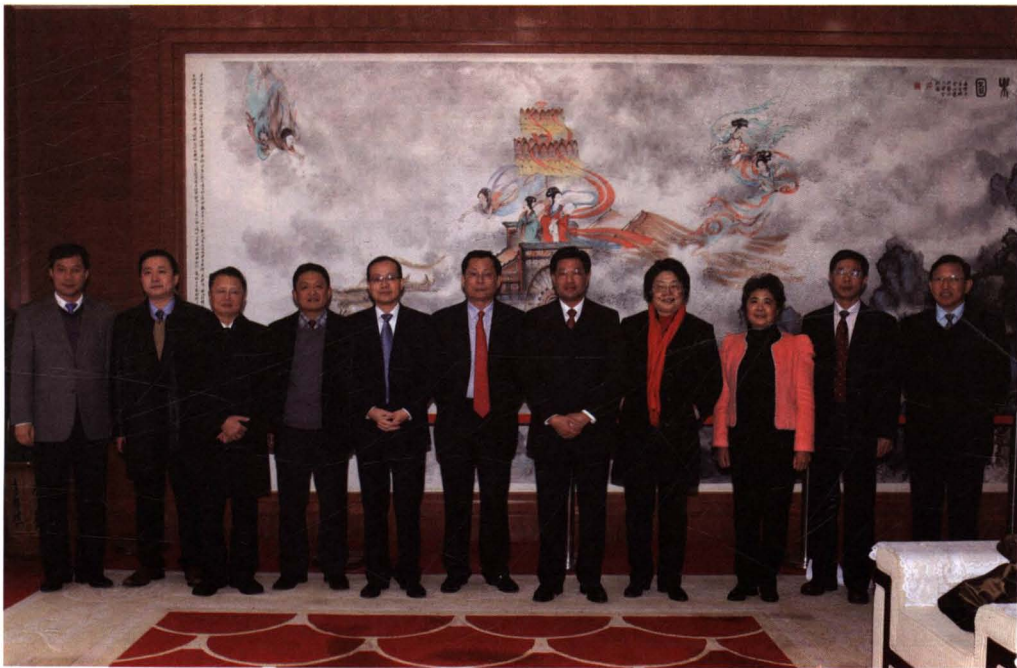
时任省委常委、宣传部林雄部长在参加集团总结表彰大会前会见集团领导。