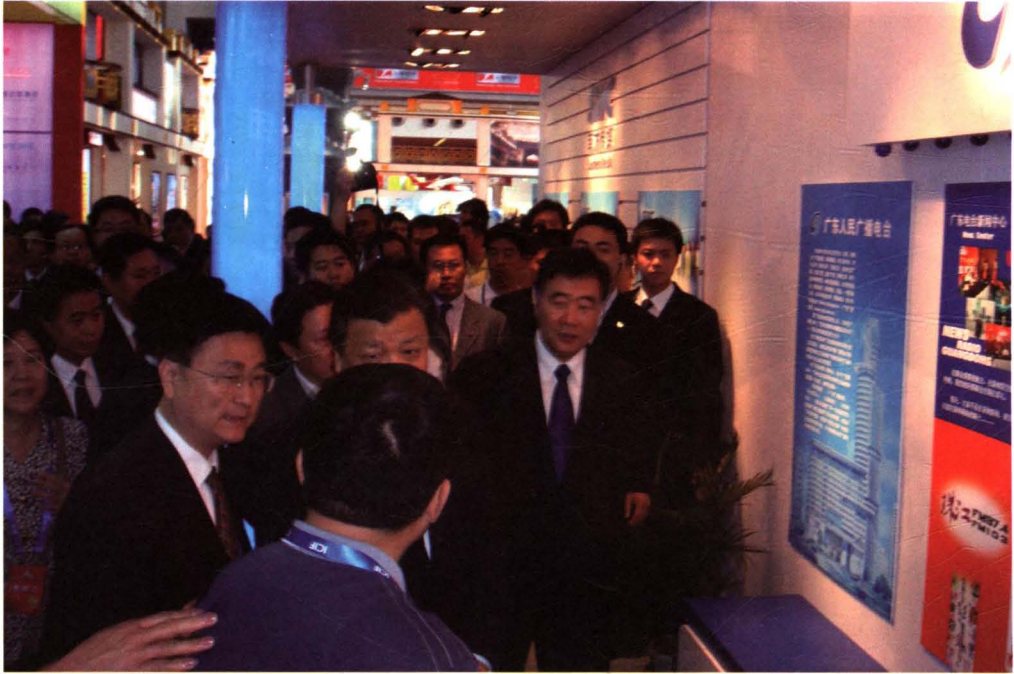
时任中共中央政治局委员刘云山同志在视察深圳“文博会”集团展台。