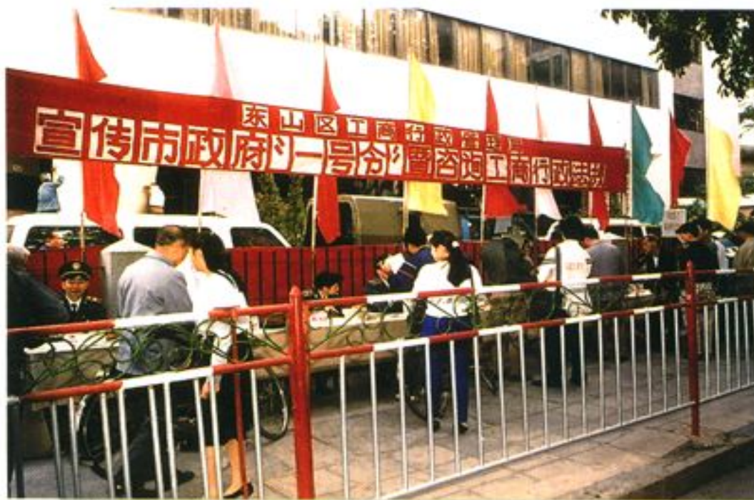
宣传政府有关的法律、法规