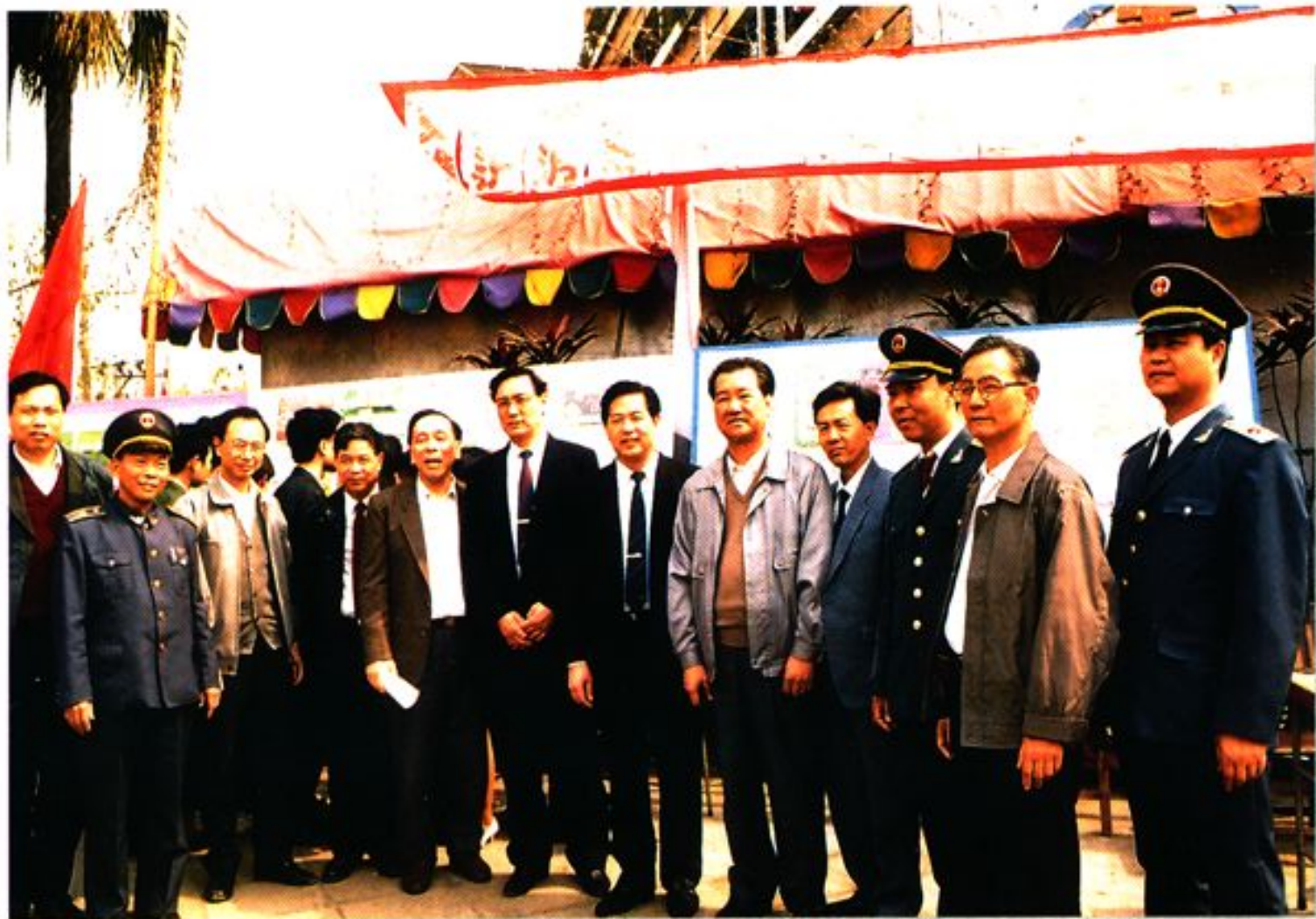
省、市、区领导视察我局工作留影