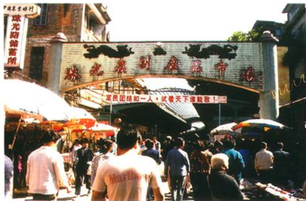
连续三届获全国文明市场称号的珠光农贸市场