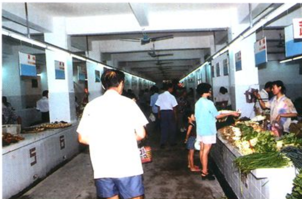
光亮整洁的室内农贸市场