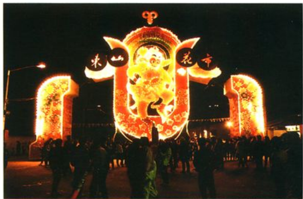
由我局承办的东山迎春花市