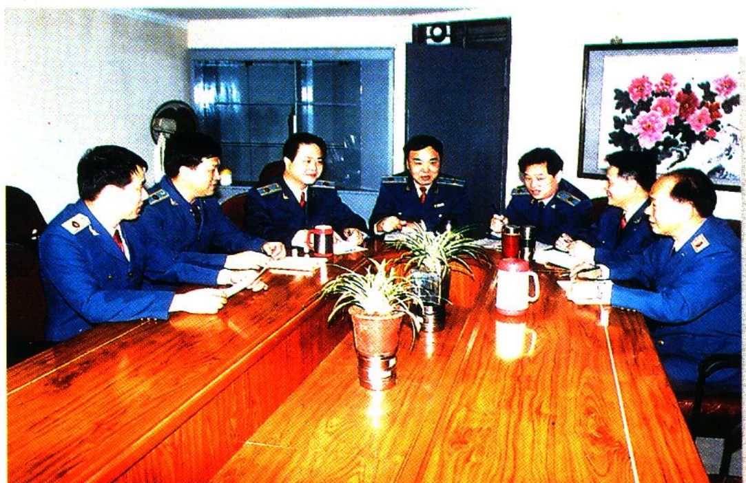
局党委成员在研究工作