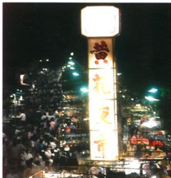
名闻全国的黄花（工业品）夜市