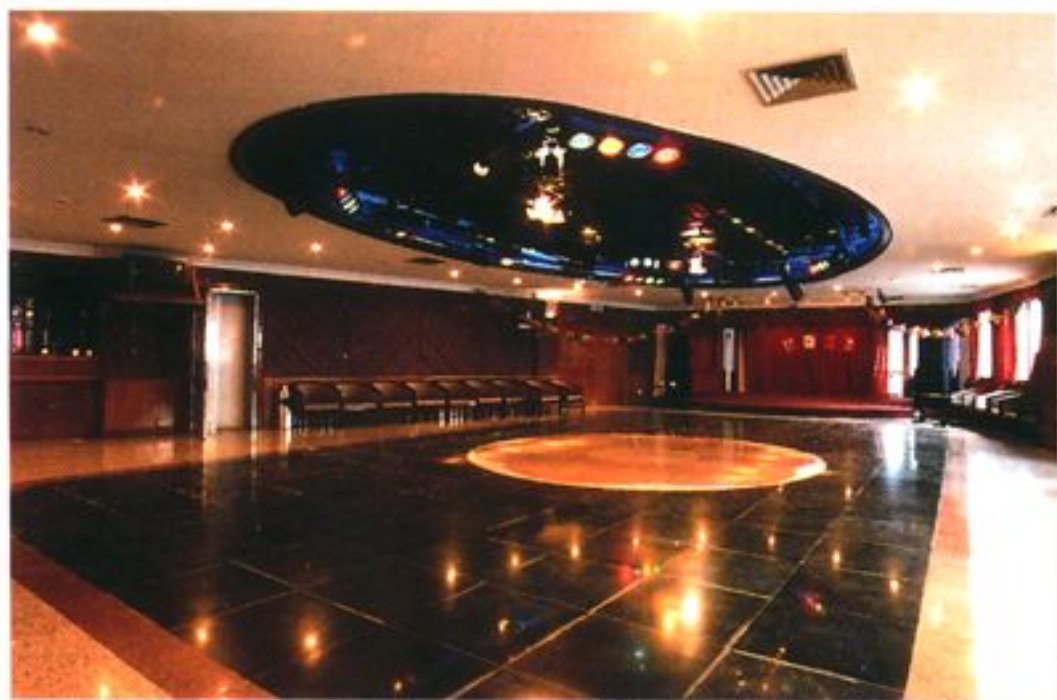
局办公大楼的多功能会议室