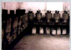
70年代的中药煎药房