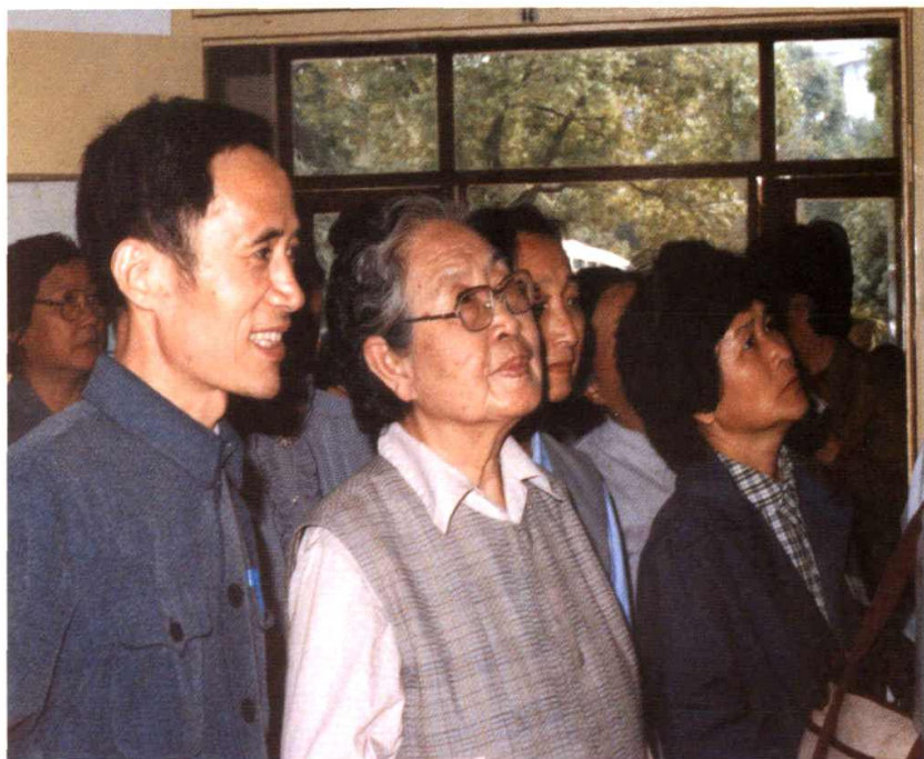
1986年10月，全国妇联副主席、中华护理学会副理事长王琇瑛来院视察。