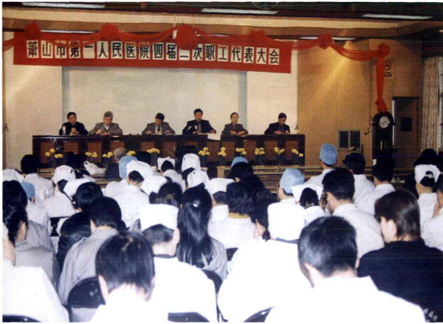
职工参与民主管理 (1999年)