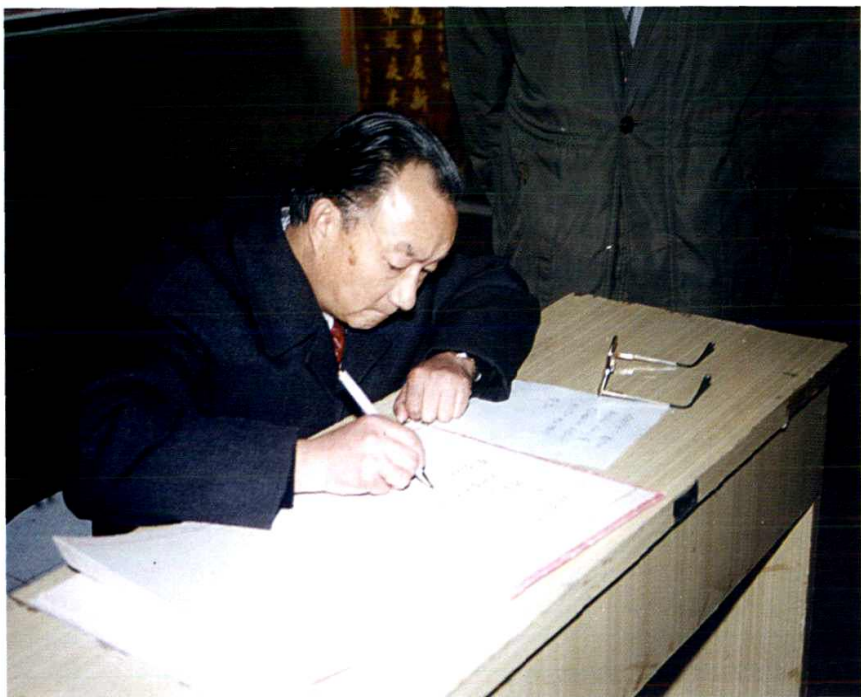
1995年，浙江省卫生厅厅长张承烈来院视察。