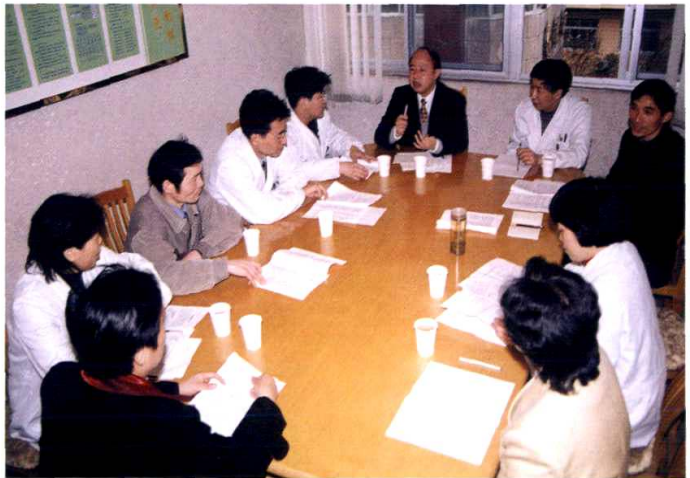
职工代表在讨论医院重大问题