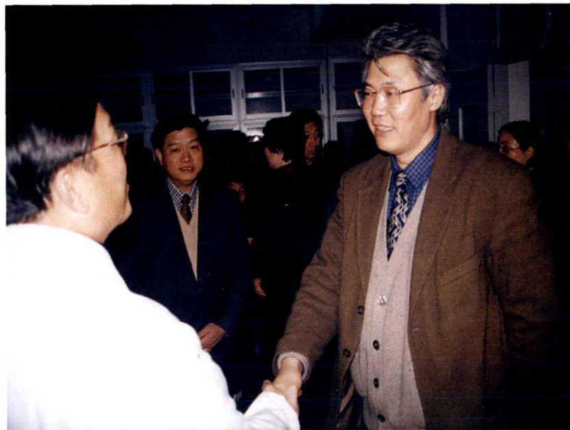
1999年春节，中共杭州市常委、萧山市委书记史久武来院视察。