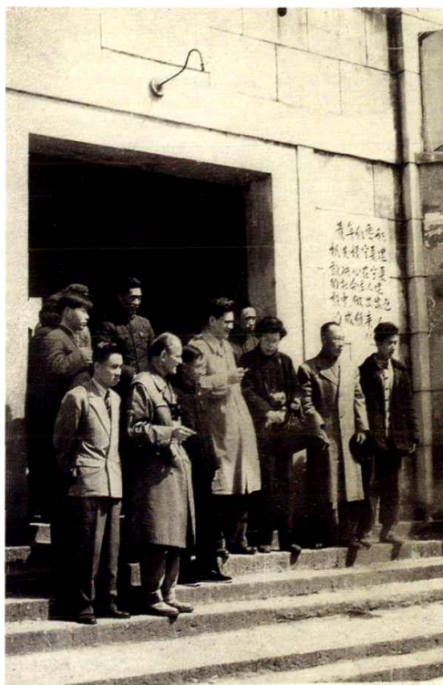
1959年波兰医学考察组来院考察（摄于医院大门口）