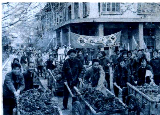
医院组织送肥下乡支援农业（70年代）