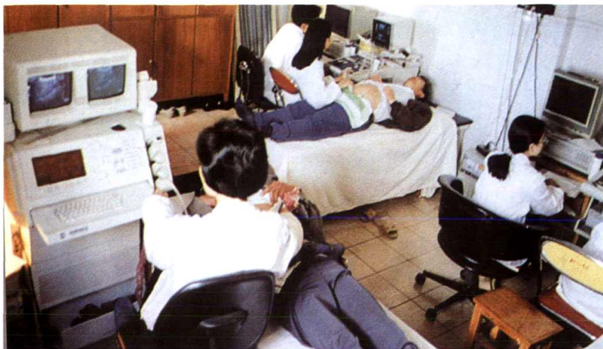
彩色多普勒超声诊断仪