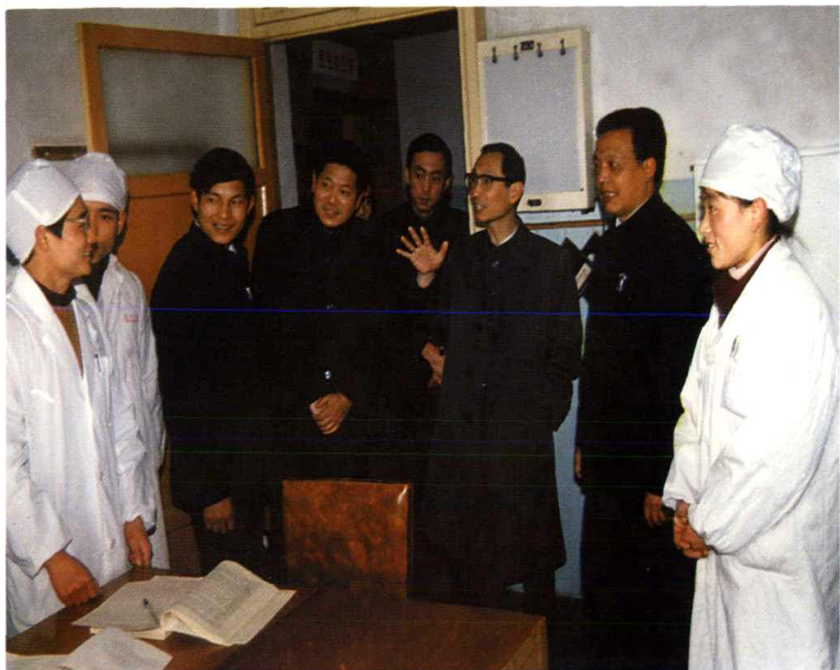
1987年3月，国家卫生部副部长陈敏章视察我院。