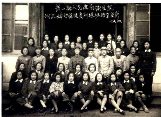
县人民政府卫生院领导与妇幼保健员训练班学员合影（50年代）