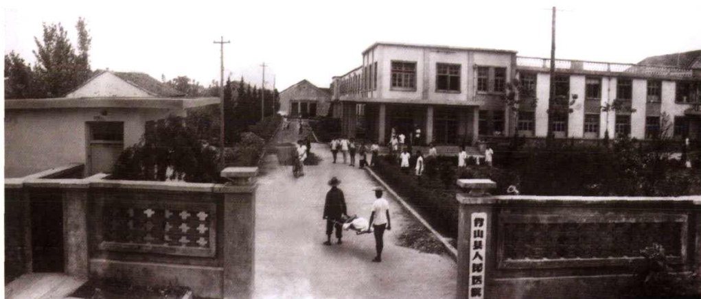
60年代的医院门诊楼