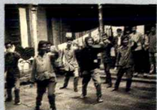
60年代医疗队在农村