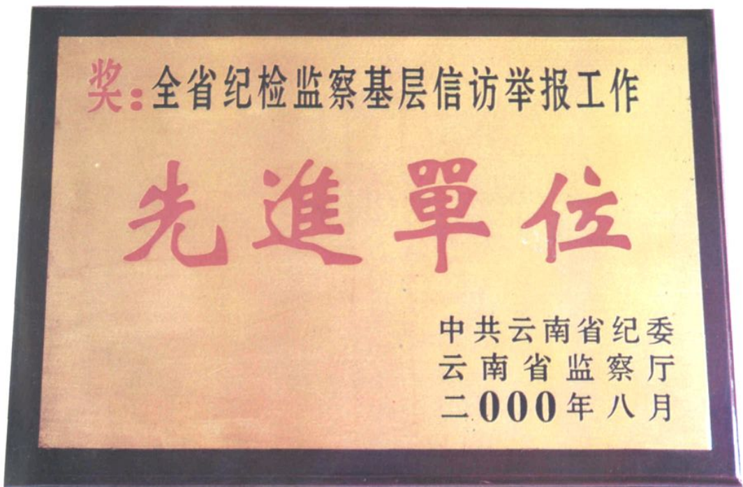
2000年8月区纪检监察机关被中共云南省纪委、省监察厅授予全省纪检监察基层信访举报工作先进单位