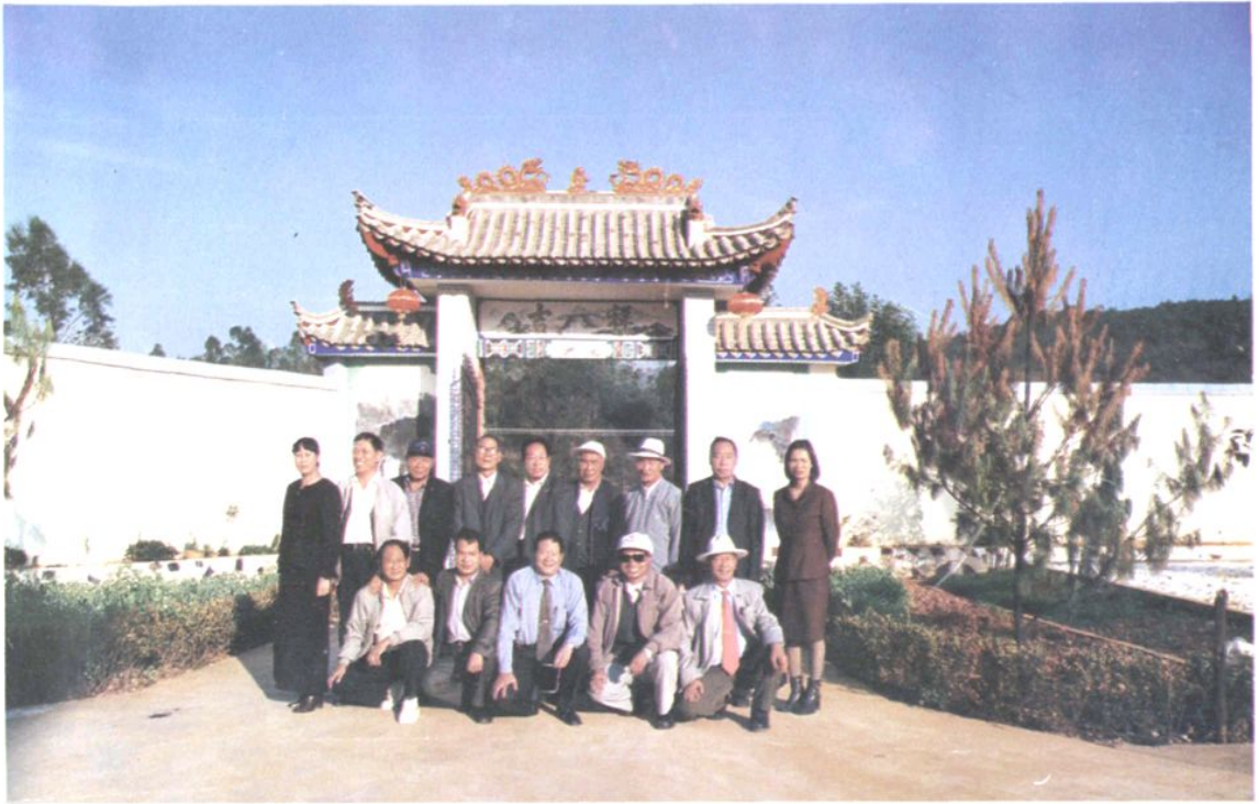
组织退休干部到厂口乡活动