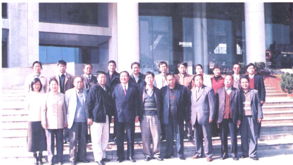
区纪检监察机关全体干部