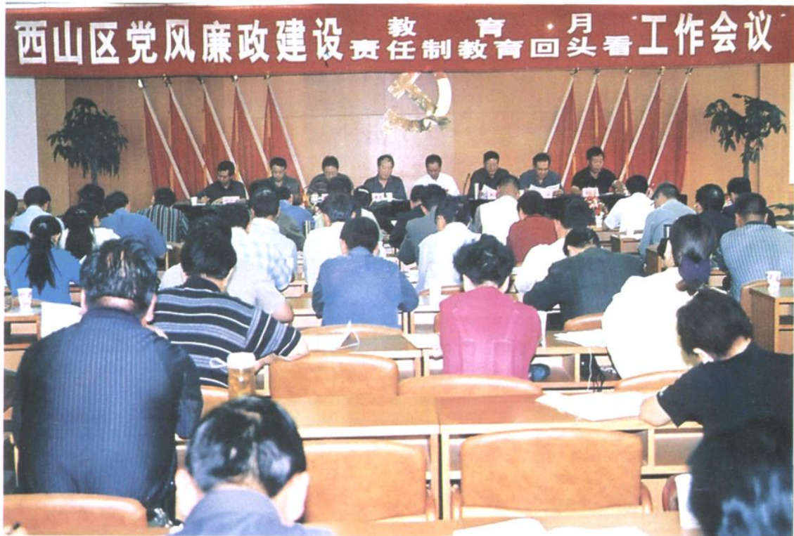
召开全区党风廉政建设“教育月、责任制教育回头看”工作会议