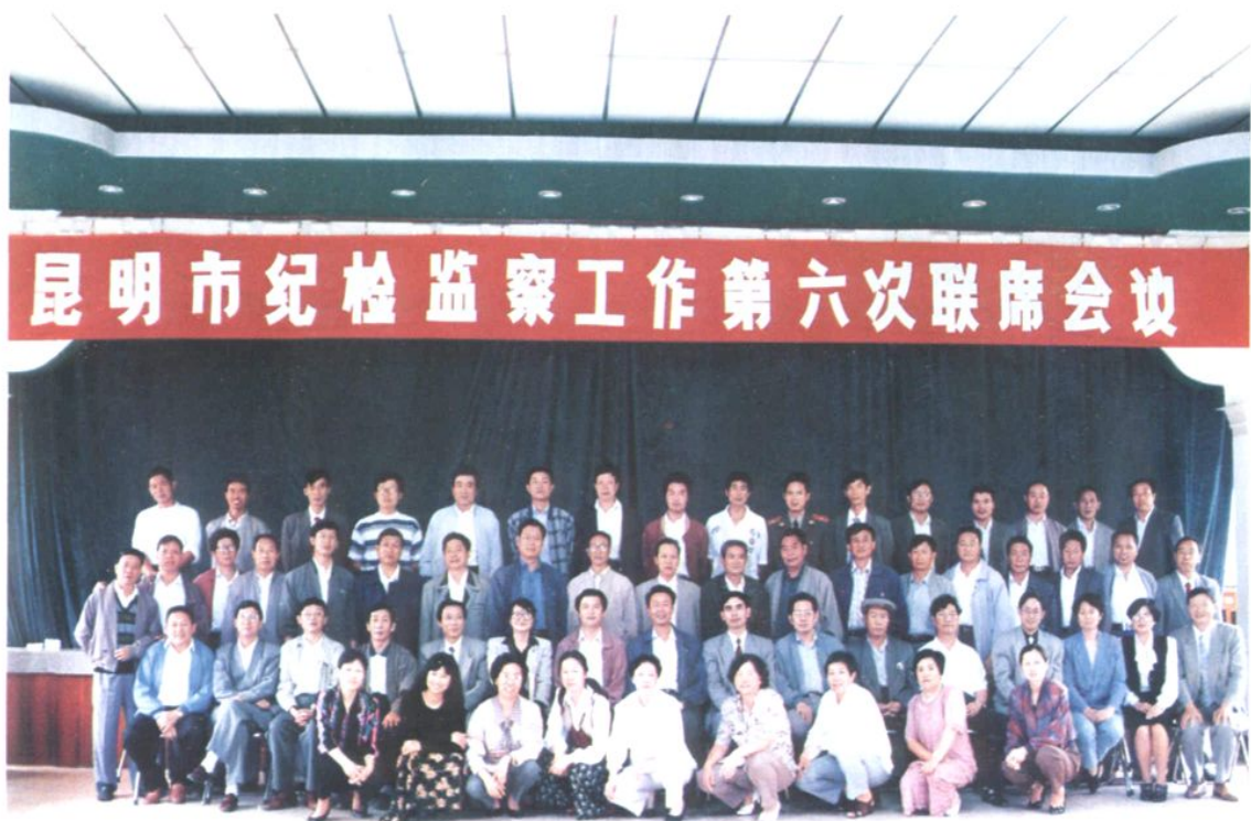
区纪委成功举办昆明市纪检监察工作第六次联席会议