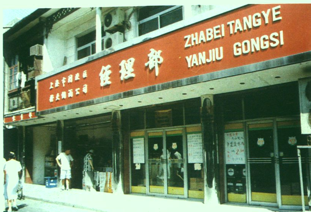
上海市闸北区糖业烟酒公司经理部