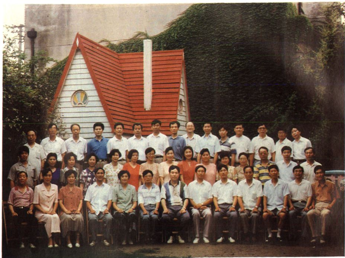
上海市闸北区糖业烟酒公司 本部全体工作人员 (1995年)