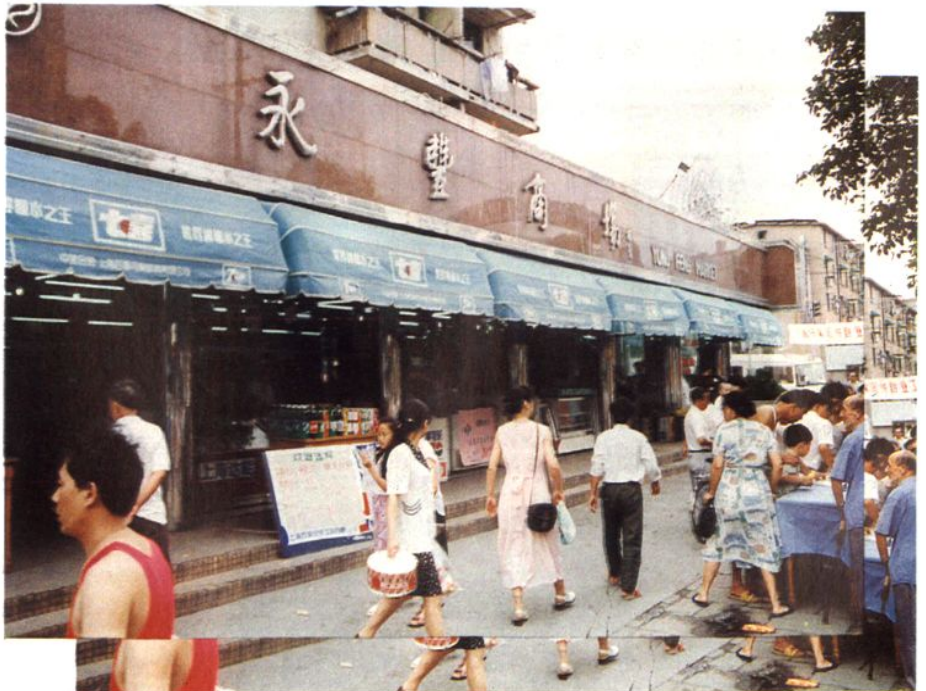
永 丰 商 场