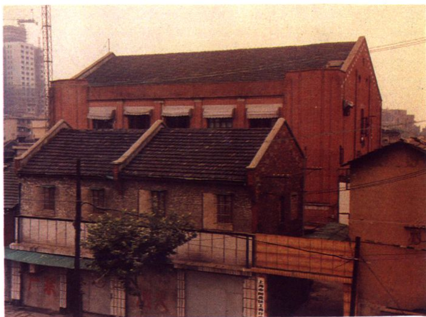
上海友谊食品厂老厂房