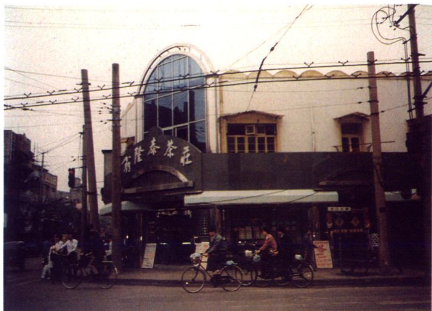
翁 隆 泰 茶 莊