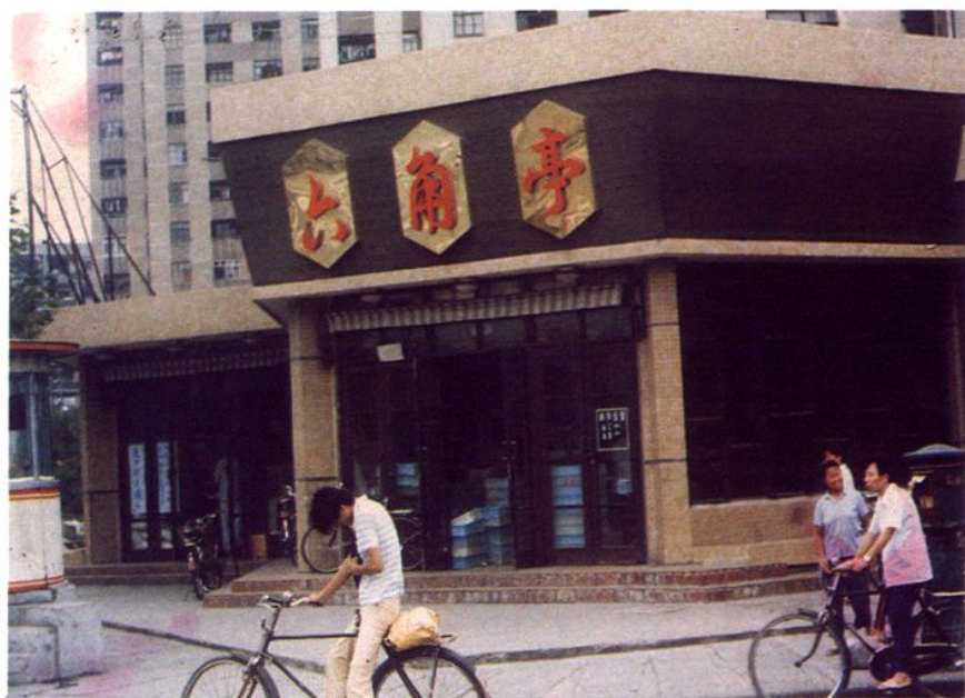
六 角 亭