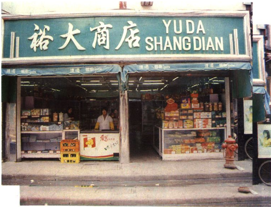
裕大食品商店, 创设于清光绪二十五年(1899年) 福建北路64号