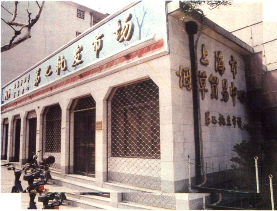
上海市烟草贸易中心第七批发市场