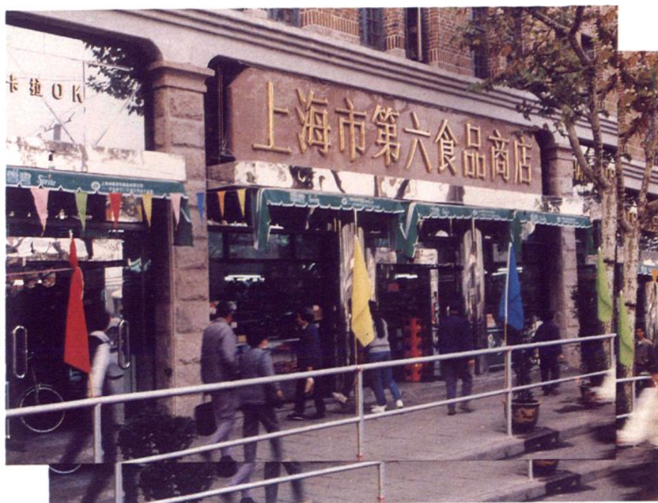
上海市第六食品商店