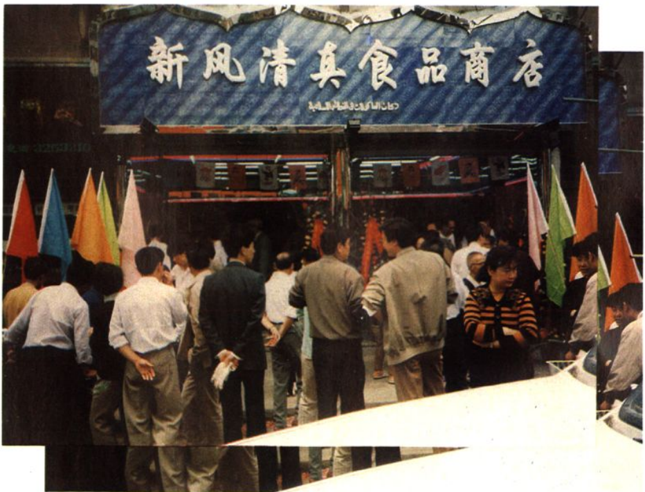
新风(清真)食品商店