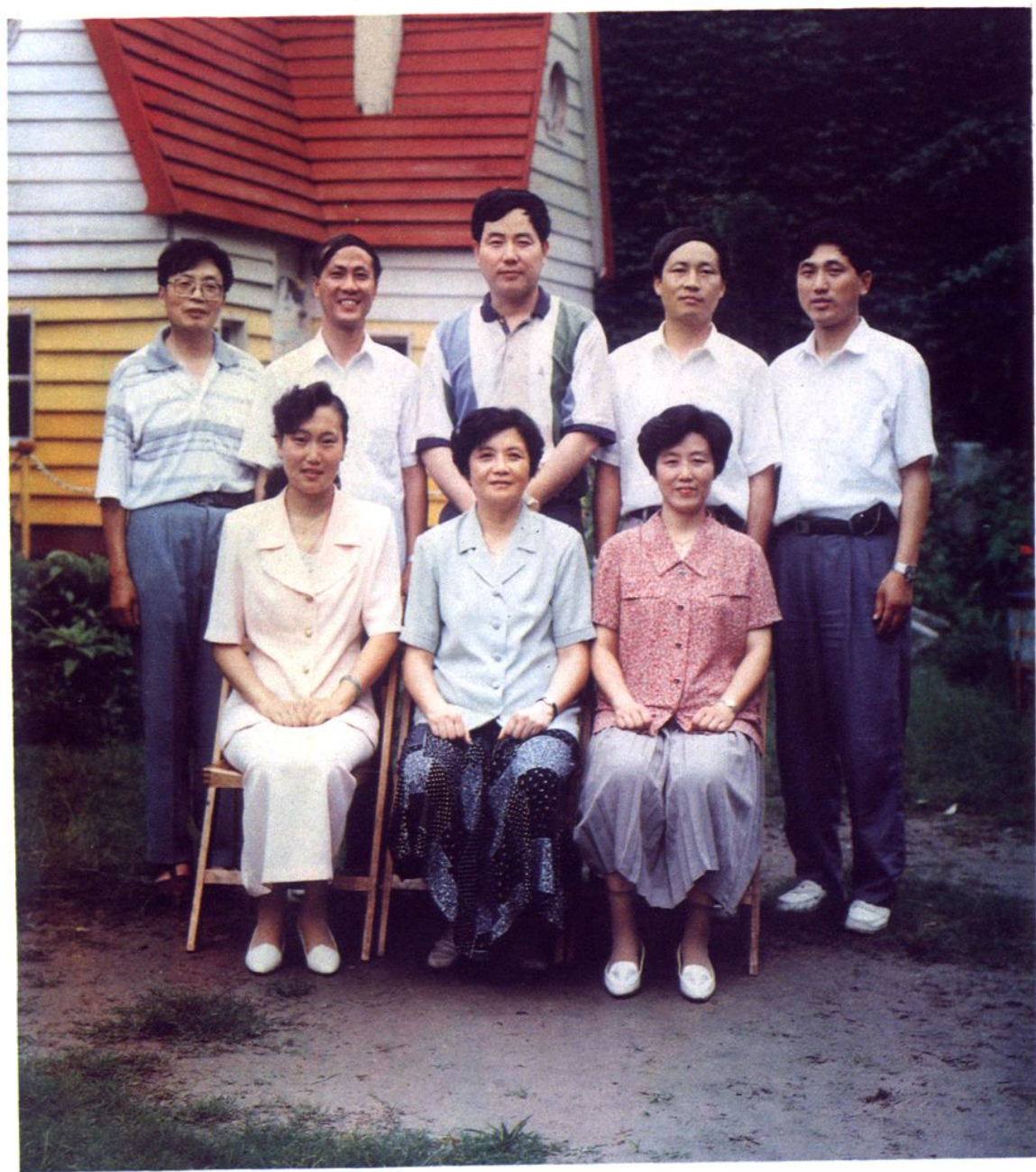
上海市闸北区糖业烟酒公司 党政工团领导干部 (1995年)