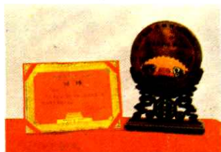
1988年获农牧渔业部奖