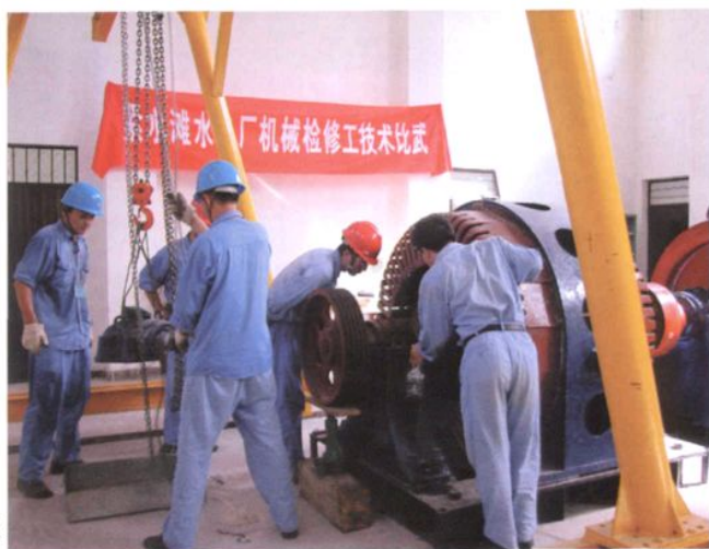
开展机械检修工技术比武