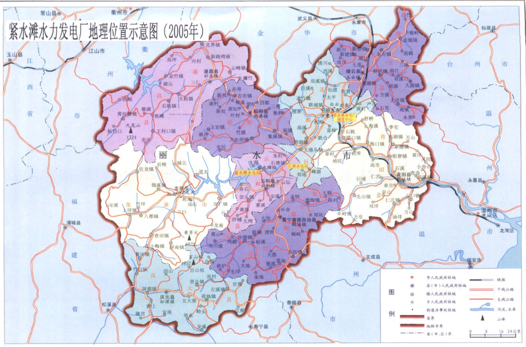
紧水滩水力发电厂地理位置示意图 (2005年)