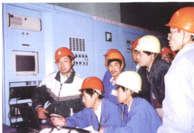
工程技术人员在进行继电保护调试