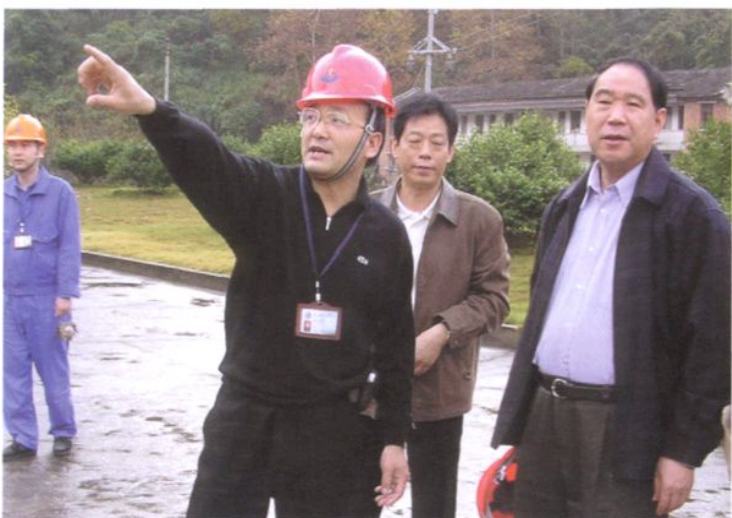
2004年11月11日，中共浙江省委副书记、纪委书记周国富（右一）考察紧水滩水电站