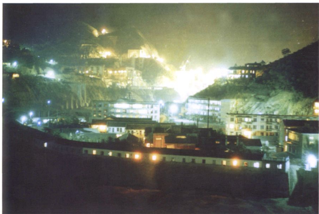
紧水滩水电站夜景