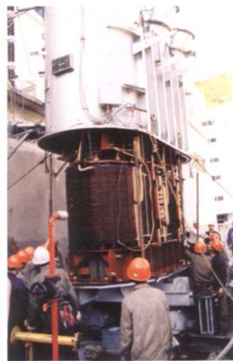
检修人员在紧站对 220 千伏主变压器吊钟罩