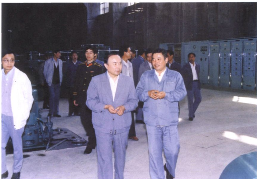
1989年10月11日,中共浙江省委书记李泽民(右二)视察紧水滩水力发电厂