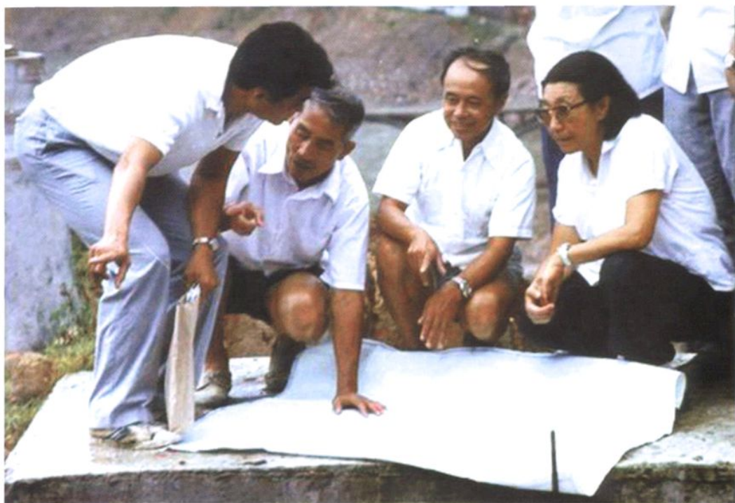
1984年8月7日,水利电力部部长钱正英(右一)视察紧水滩水电站工程