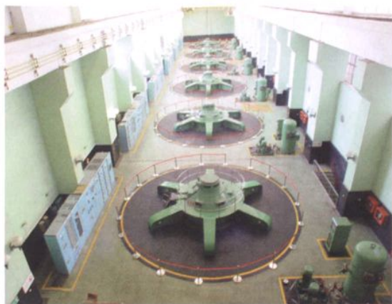
紧水滩水电站发电机组