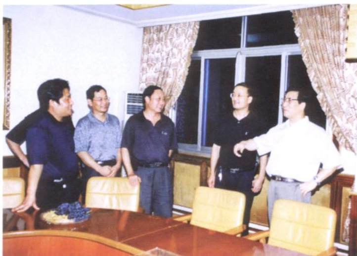
1996年8月5日，中共浙江省委副书记、常务副省长柴松岳（右一）视察紧水滩水电站