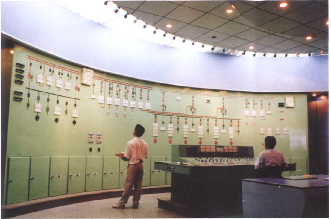
紧水滩水电站中控室