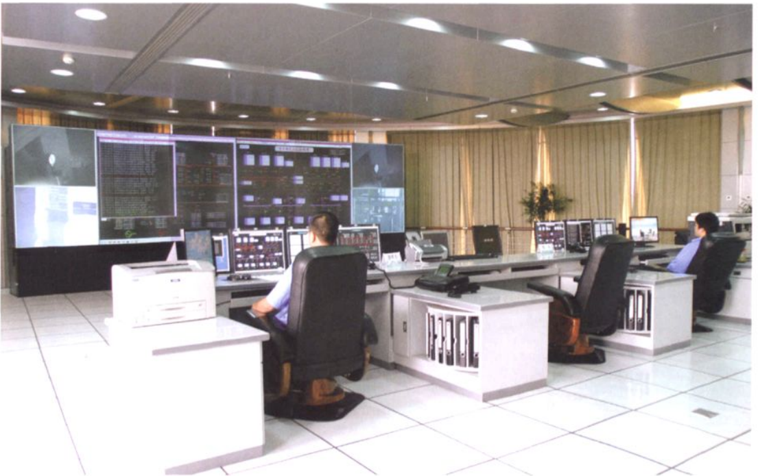
紧水滩水力发电厂调度中心