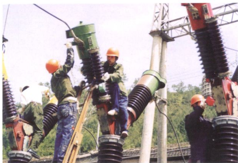
检修人员正在检修 220 千伏断路器