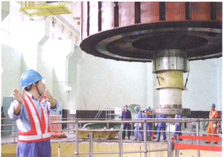
2005年，执行机组检修“红马甲”制度