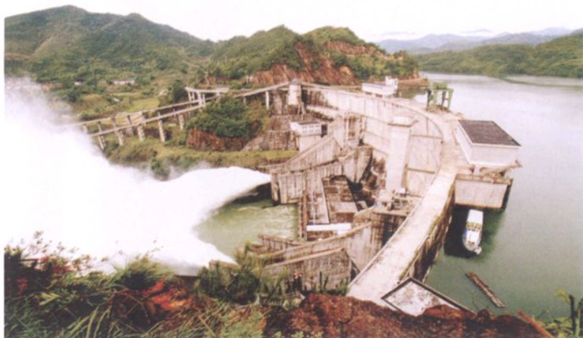
紧水滩水电站大坝泄洪