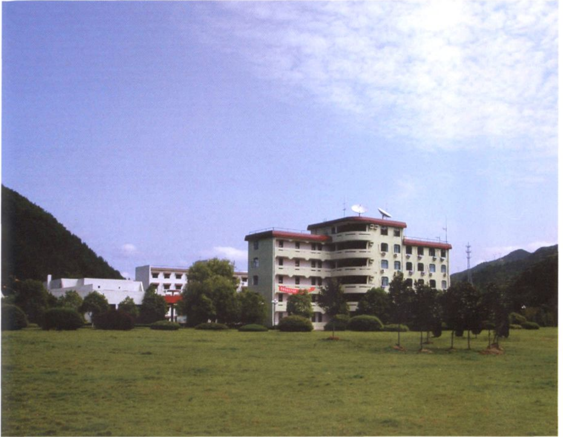
石塘水电站办公楼