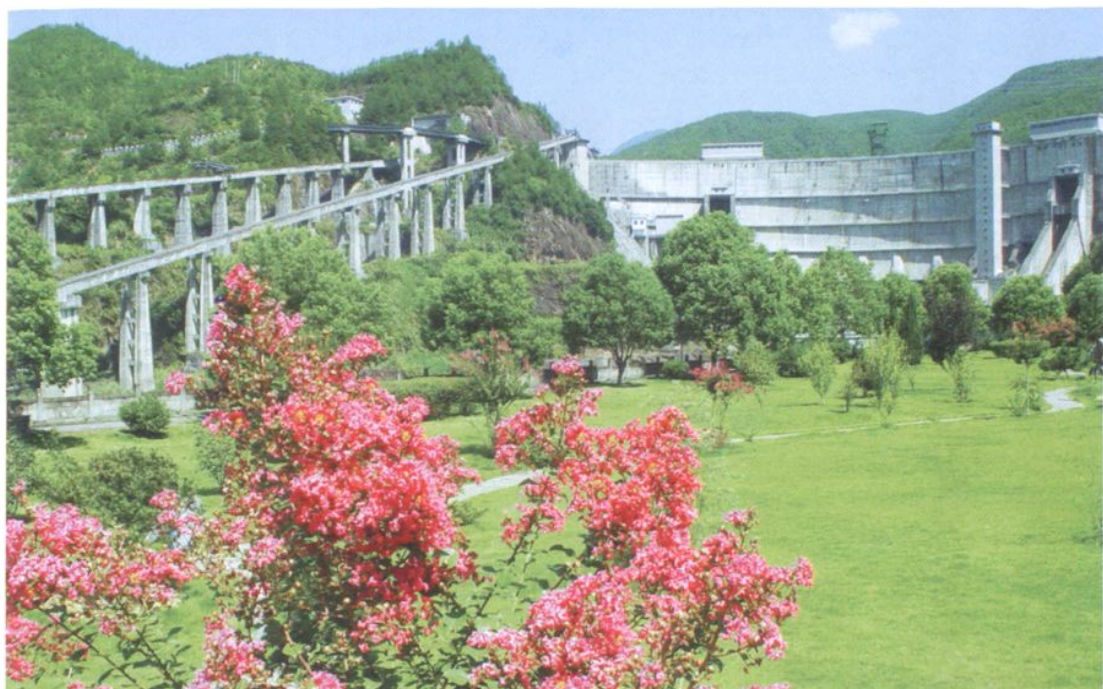
紧水滩水电站厂区一角