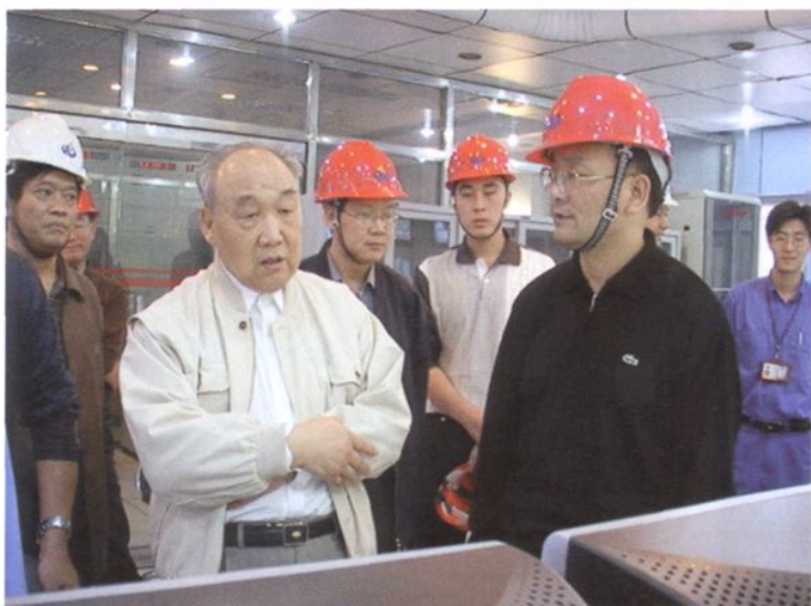
2004年10月12日，原浙江省省长葛洪升（前排右二）到紧水滩水电厂调研