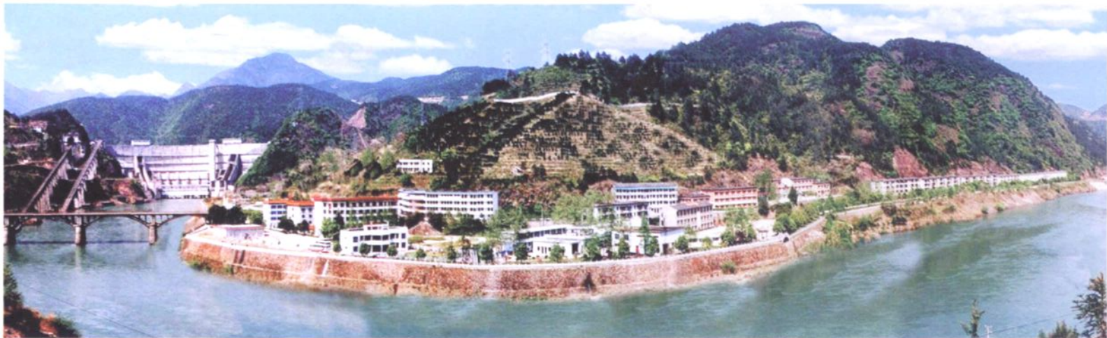
紧水滩水电站全貌