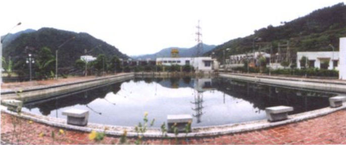
石塘水电站游泳池