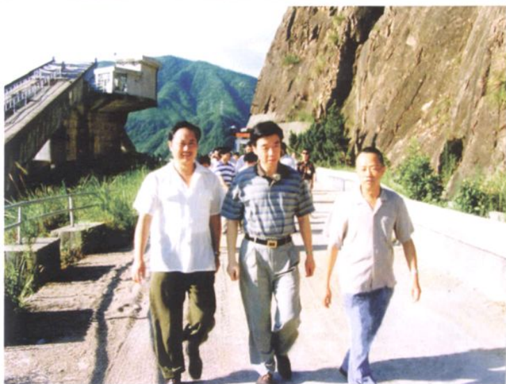
1995年8月4日，中共浙江省委副书记卢展工（中）视察紧水滩水电站