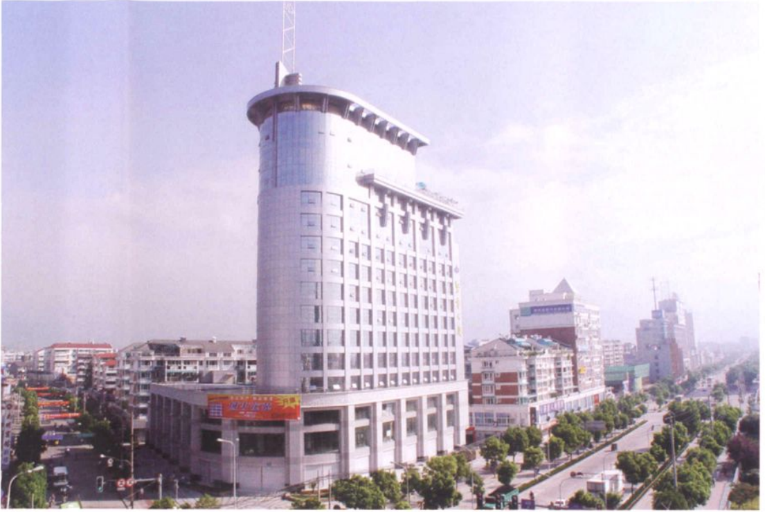
紧水滩水力发电厂丽水市调度中心——紧电大厦