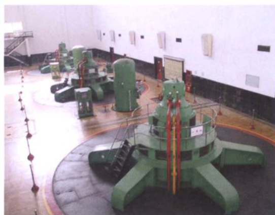
石塘水电站发电机组