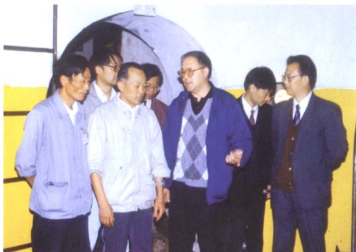
1992年10月13日，浙江省副省长万学远(右三)到石塘水电站视察