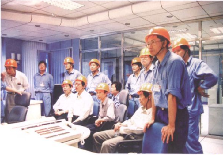
1997年8月，紧水滩水电厂计算机监控专家组在石塘水电站梯调考察设备运行情况