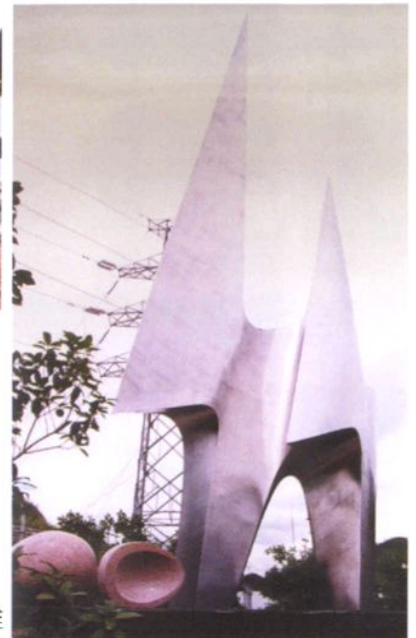
石塘水电站电力浮雕