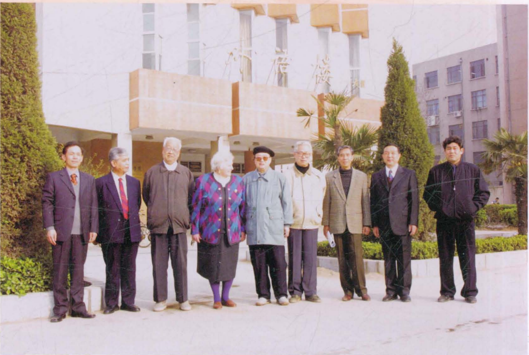
英语语言文学专业部分专家合影