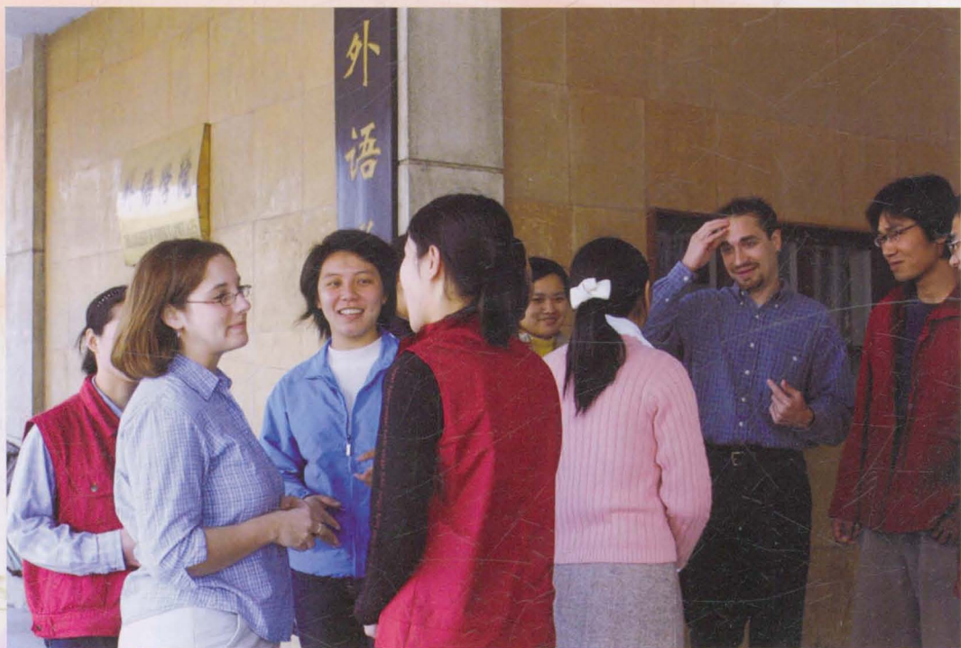
外教与我院学生亲切交流