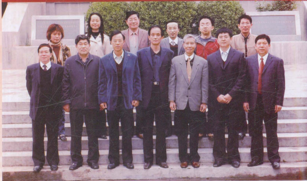
认知语言学高层论坛专家合影