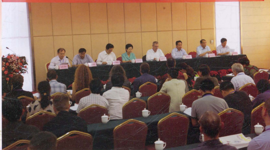
我院承办的德勒兹国际研讨会