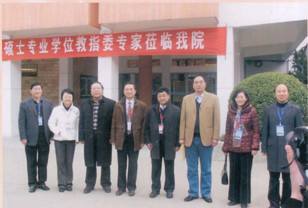
教育部专家莅临我院指导工作