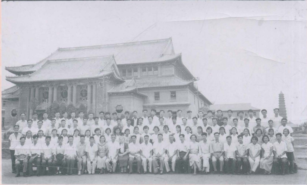
解放后我院首届本科毕业生合影