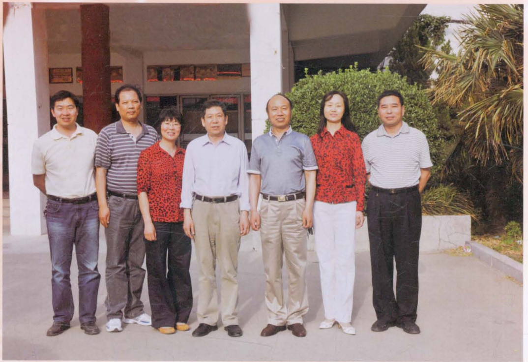
团结务实的学院现任领导班子