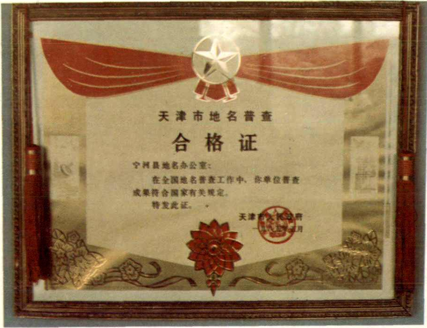
天津市地名普查合格证书