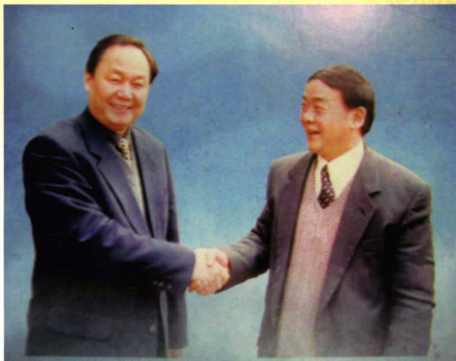
宜昌原市委书记李佑才（左）祝贺史久坤当选为市科协第二届委员会主席