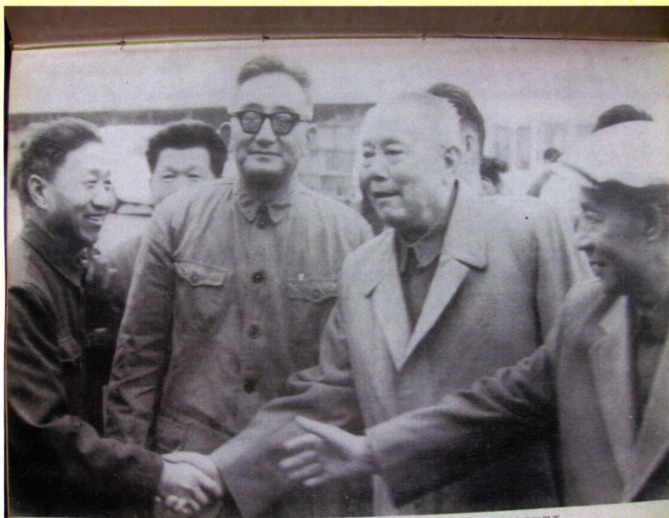
原国家主席李先念（右二）、中央原书记处书记陈丕显（右一）接见水电工程专家、（原）宜昌市第四届科协主席岳荣寿