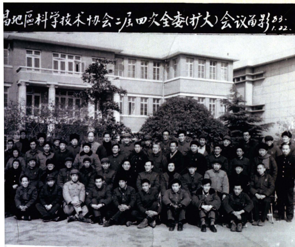
原宜昌地区科协二届四次全委（扩大）会议参会代表合影