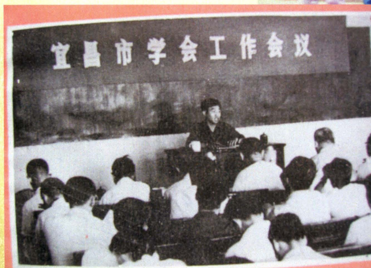
原宜昌市科协召开学会工作会议（1980年）