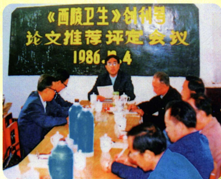
原宜昌市卫生界学会召开《西陵卫生》创刊暨论文评定会议（1986年）