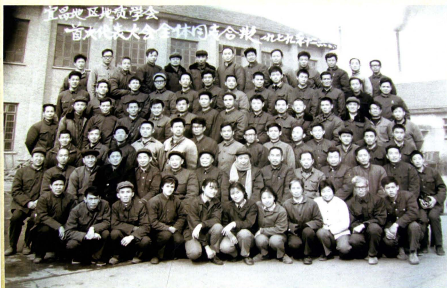
宜昌地区地质学会首届代表大会代表合影（1979年）