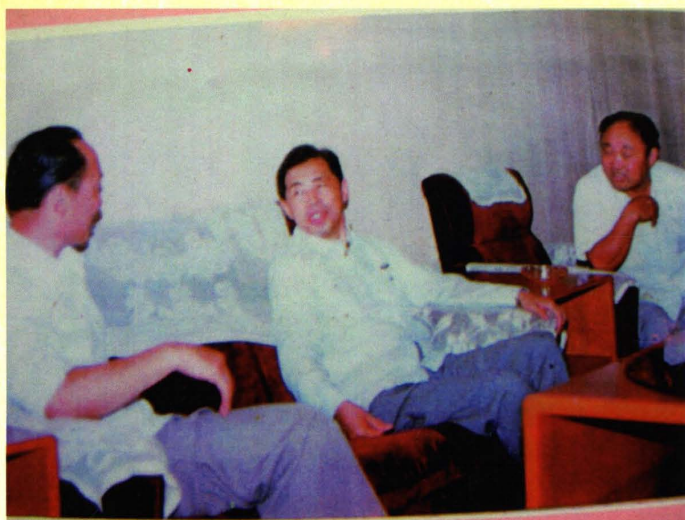
中国科协原党组书记、常务副主席高镇宁（中）来宜调研地市科协工作（1987年）