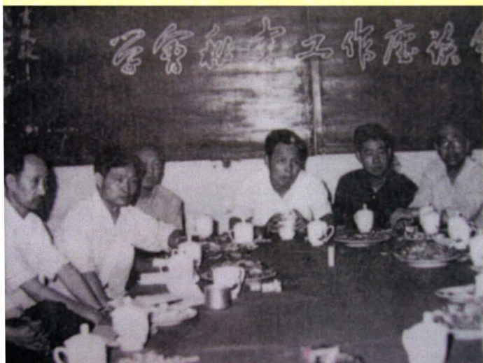
原宜昌市科协召开学会秘书工作座谈会（1981年）