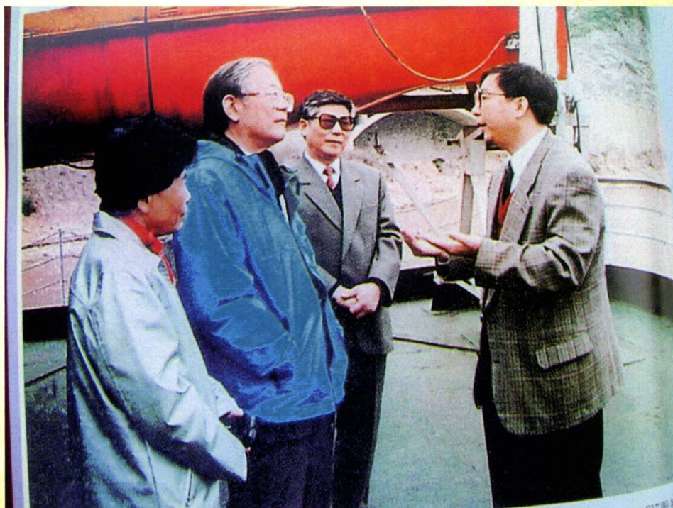
全国人大常委会原副委员长周光召（左二）、湖北省科协原党组书记、常务副主席刘会永（左三）听取科技人员开展科技咨询工作情况汇报