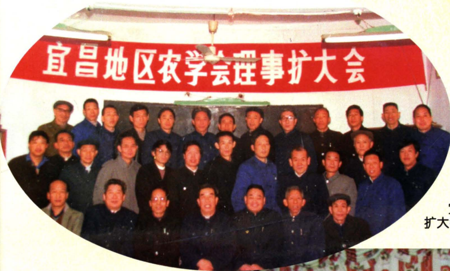
宜昌地区农学会召开常务理事扩大会议暨学术交流会议