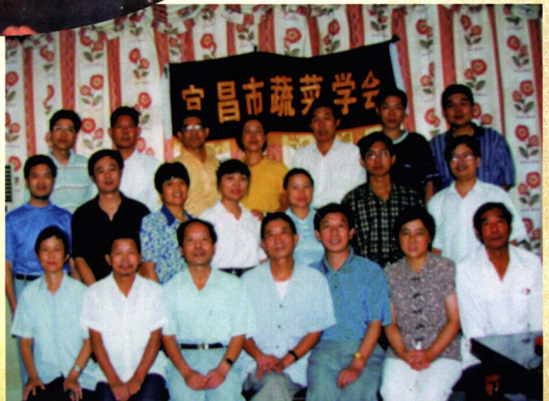
宜昌市蔬菜协会召开理事会议（1993年）