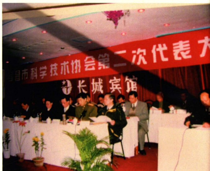
宜昌原市委书记孙志刚为大型科普展览题词