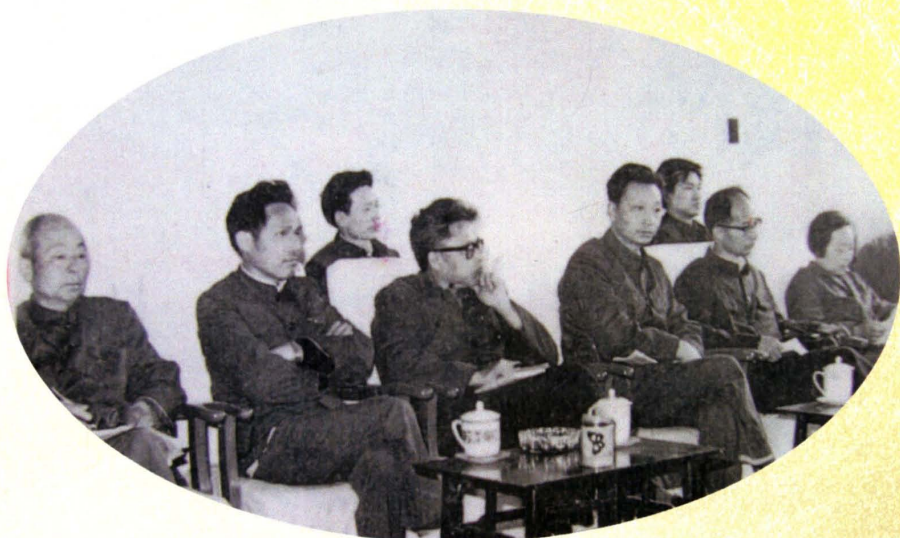
原宜昌市科协召开军民结合发展地方经济研讨会（1983年）