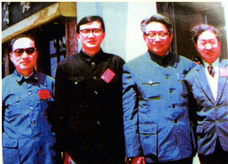
中国科协原党组副书记高潮（右二）和宜昌市委原副书记李泉（右三）、市科协第四届主席岳荣寿（右一）、市科协原党组书记梁继坪（左一）在湖北省科协“三大”期间合影