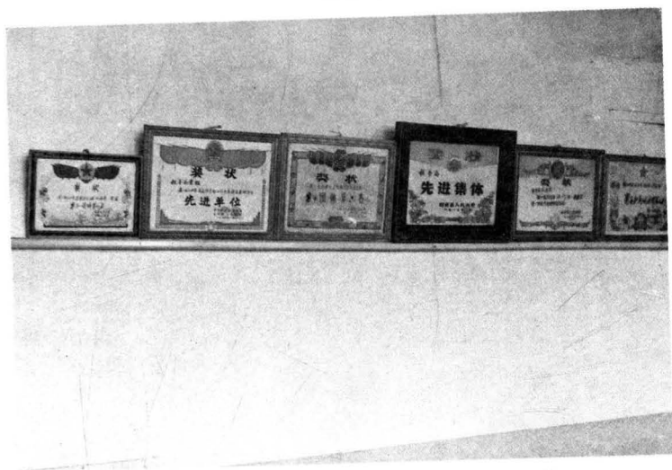
△1983—1985年连续三年县税务局被命名为先进集体