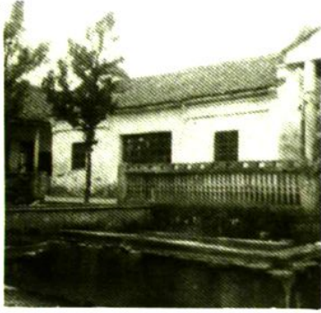
显净寺, 抗日期间迁址之一