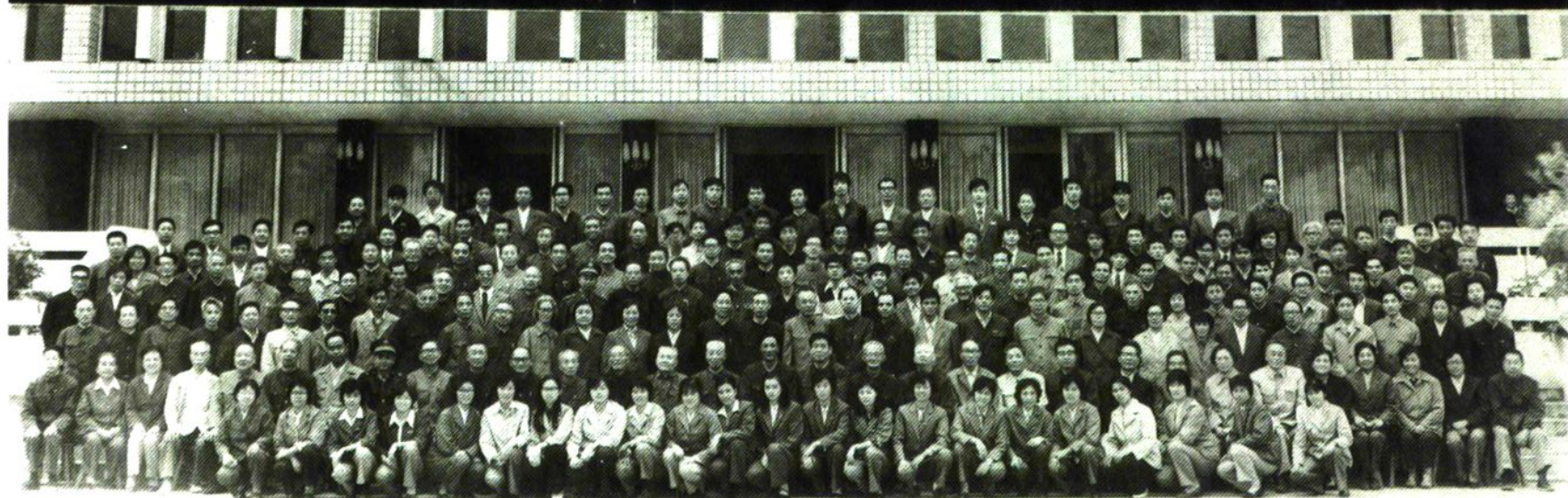
建校 70 周年校庆来宾校友及在校教工合影