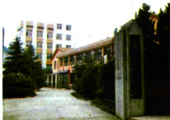
校办厂(晨钟服装厂)