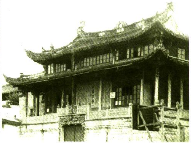
城隍庙溪山第一楼, 五十年代校舍