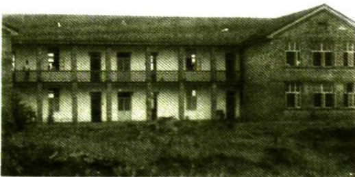
六十年代北郊校舍