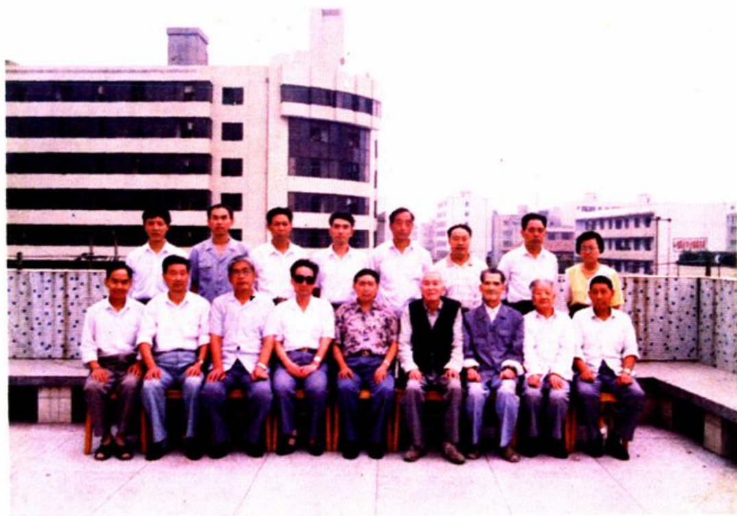
绵阳市中院老领导和审判志编委成员讨论志稿合影