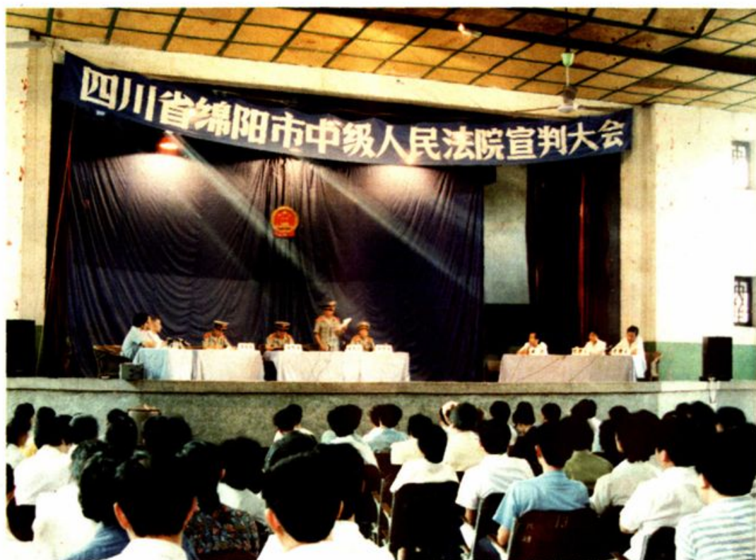
绵阳市中级人民法院宣判大会