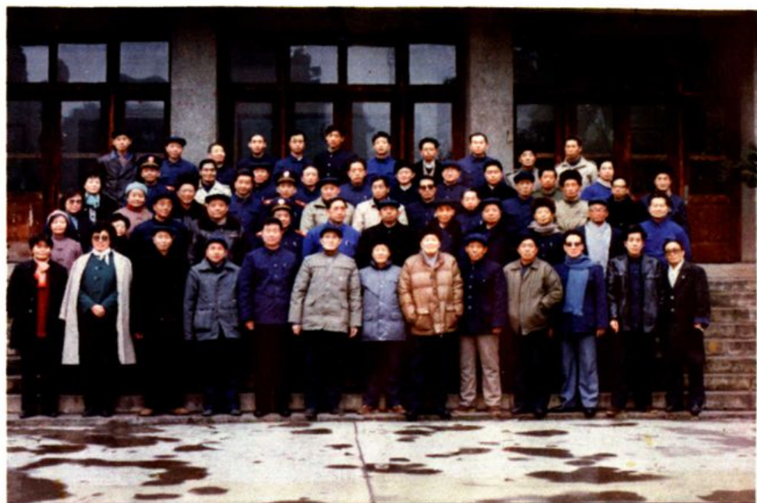
绵阳市中院中层以上干部、县院领导和市、县法院离退休人员和老领导合影(1990·3)