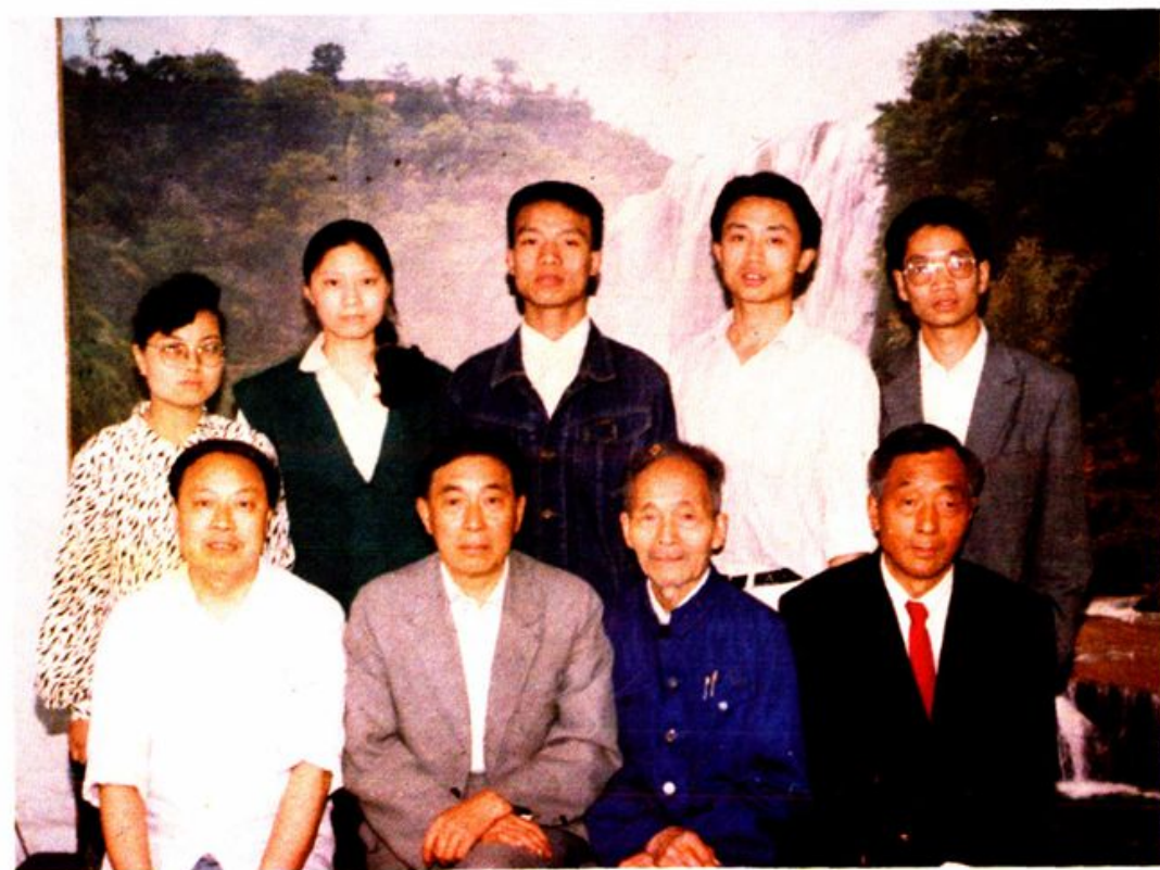
《绵阳市审判志》办公室工作人员