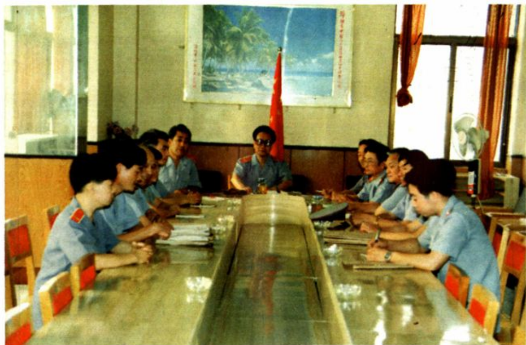
审判委员会讨论案件