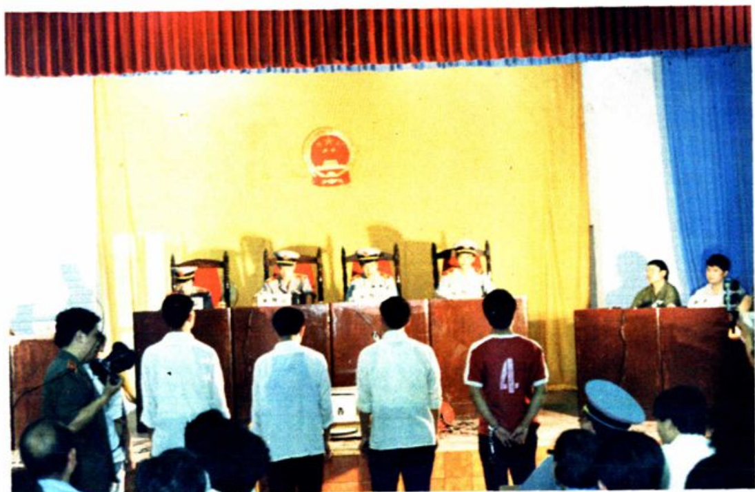
绵阳市中院刑一庭开庭审理刑事案件