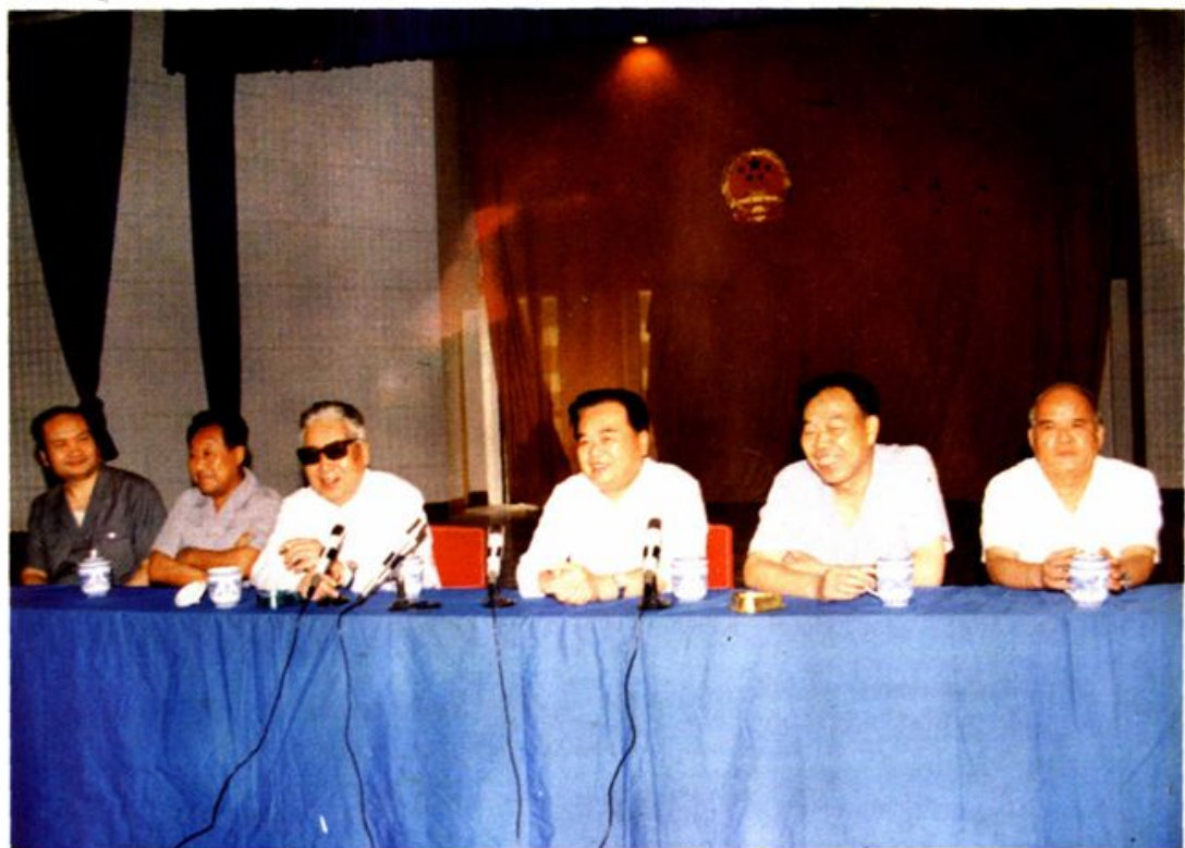
全国法院审理经济犯罪案件会议在绵阳召开