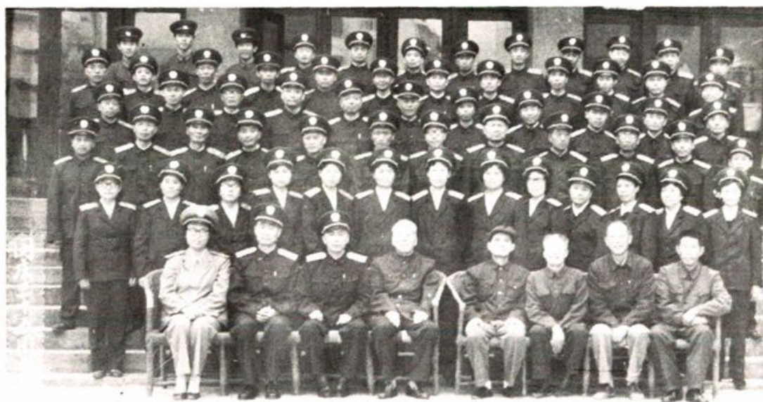
绵阳中级法院干警 1984 年着装合影