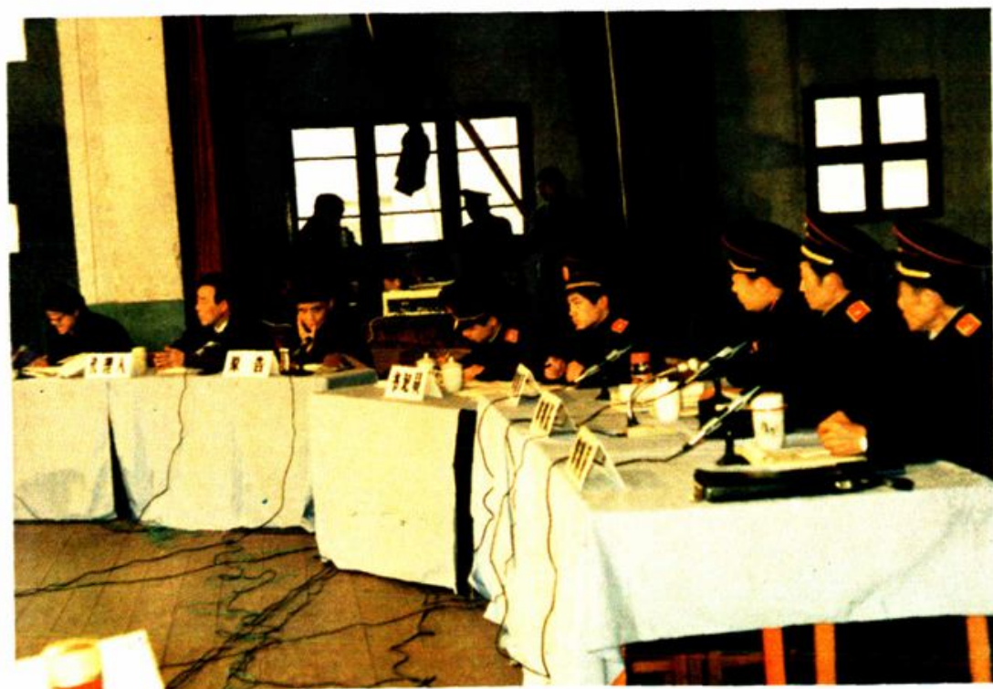
绵阳市中院经济审判庭开庭审理经济纠纷案件