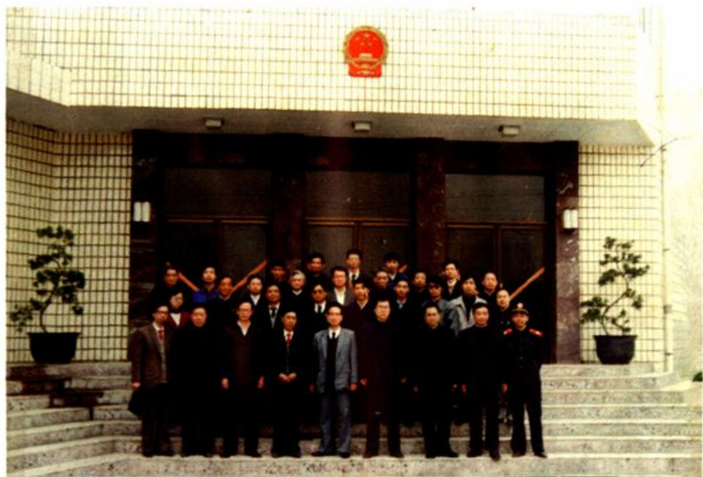
绵阳市法院系统修志工作会议在三台召开 最高法院、省法院、市方志办有关领导参加留影