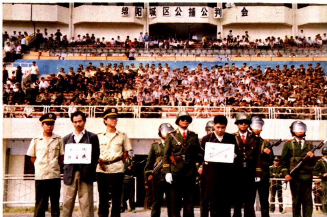
绵阳城区公捕、公判大会