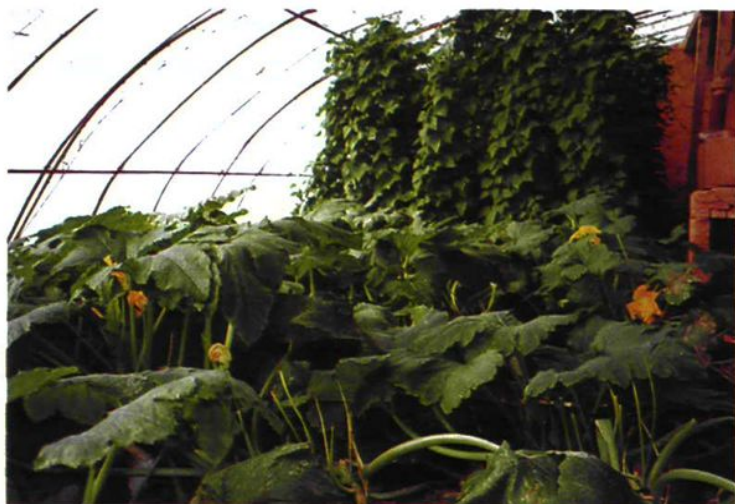
图为支队生产基地温棚蔬菜