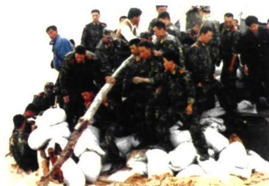
1987年5月28日，永宁县唐徕渠杨显段决口80余米，图为官兵奋力堵决口时的情景。