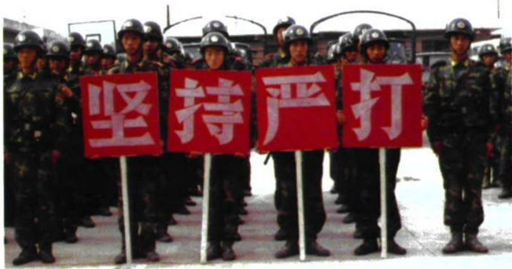
图为支队官兵在「严打」出动前整装待发。