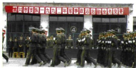
1992年，支队进行军事、政治、后勤业务竞赛前的开幕式。