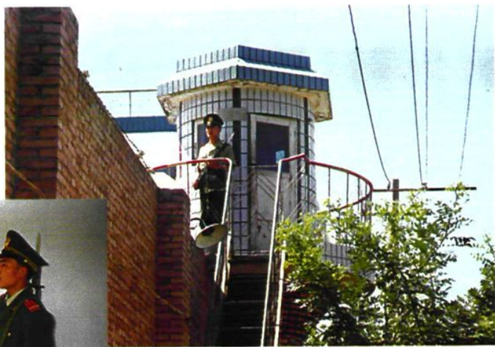
区看守所哨兵正在执勤