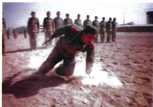
图为支队官兵进行战术训练。