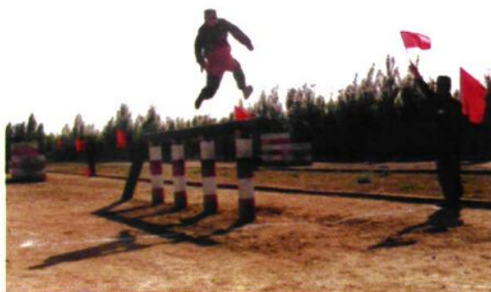
图为400米障碍训练穿越独木桥。