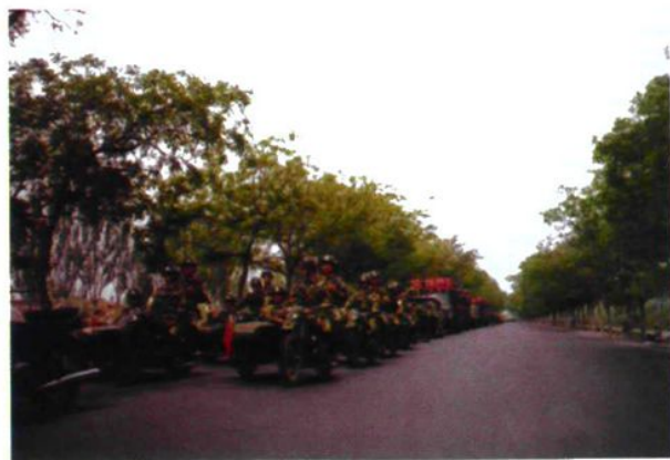
1996年6月1日,支队出动150名兵力进行震慑性武装巡逻,为“百日严打”助威。