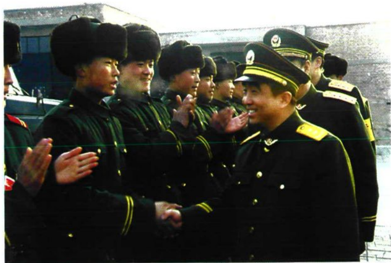
总部首长看望新训队官兵