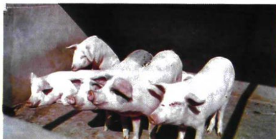
图为支队生产基地猪舍一角