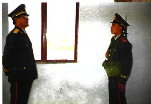
总部首长视察执勤哨兵