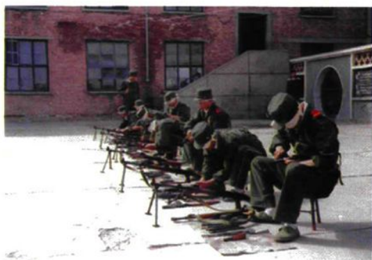
图为在军事竞赛中官兵进行武器分解结合。