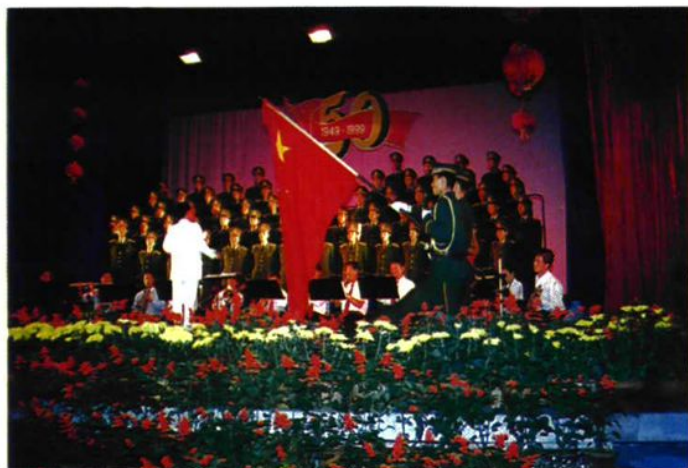
图为1999年,支队参加总队“庆七一”歌咏比赛演出时的场景。