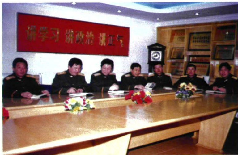
图为支队党委「一班人」在学习讨论。