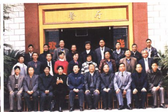
▲楚雄州乡(镇)人大换届选举工作汇报会,省、州人大领导与南华县领导和机关全体干部职工合影。