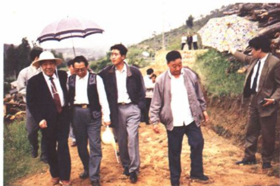
▲全国人大常委会副委员长布赫、省人大常委会副主任刀国栋于1995年6月8日到天申堂乡看望农户。