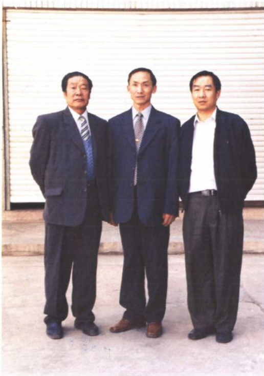
◀《南华县人民代表大会志》撰写人员合影。