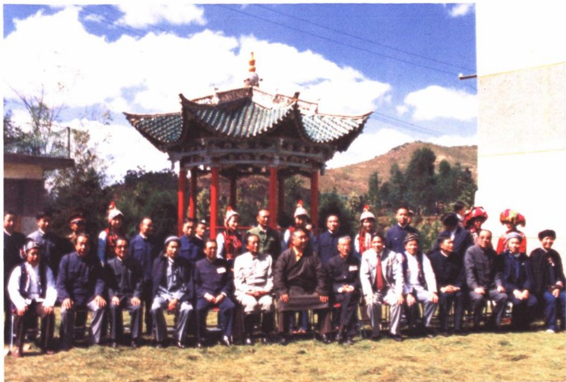
▲1987年10月,全国人大常委会副委员长班禅额尔德尼·确吉坚赞到南华视察。