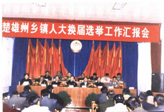
▲2002年1月5日,全州乡级人大换届选举工作汇报会在南华县人大常委会举行。省人大常委会副主任黄维彬、选联工委主任冯建昆、州委书记丁绍祥、副书记张怀德等领导到会作指导。