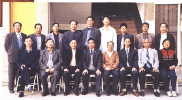
▲《南华县人民代表大会志》编纂领导小组全体成员合影。