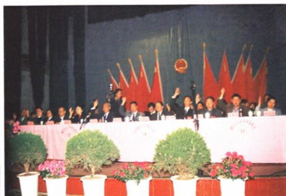
▲南华县第十三届人大第四次会议主席团表决大会各项决议。