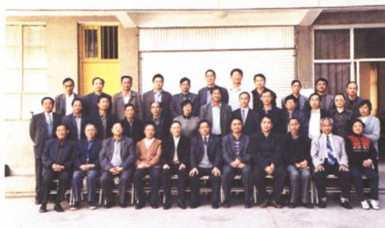
▲《南华县人民代表大会志》终审会议全体审稿人员合影。