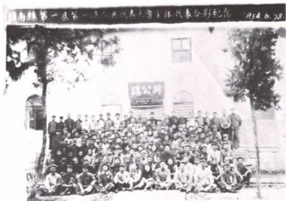
▲镇南县(今南华县)第一届第一次人民代表大会全体代表合影。