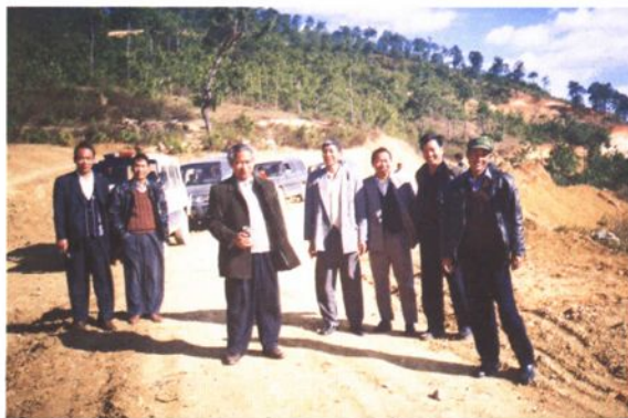
▲2000年2月14日，县第十三届人大常委会组织部分州人大代表，对南华哀牢山公路建设情况进行视察。