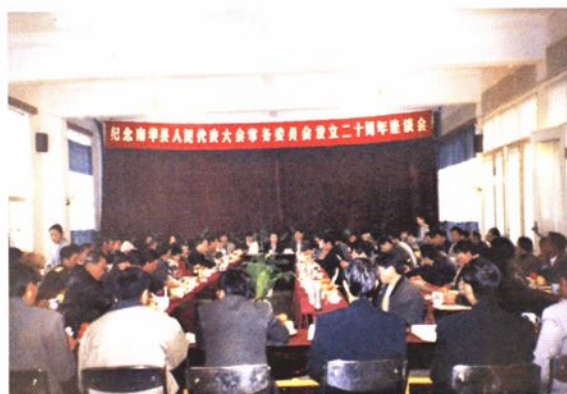
▲2001年1月17日,在县招待所举行纪念南华县地方人大常委会设立20周年座谈会。