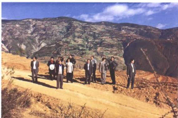
▲2002年11月29日，县第十三届人大常委会组织部分人大代表，对南华易地扶贫搬迁工程实施情况进行视察(图为五顶山搬迁点)。