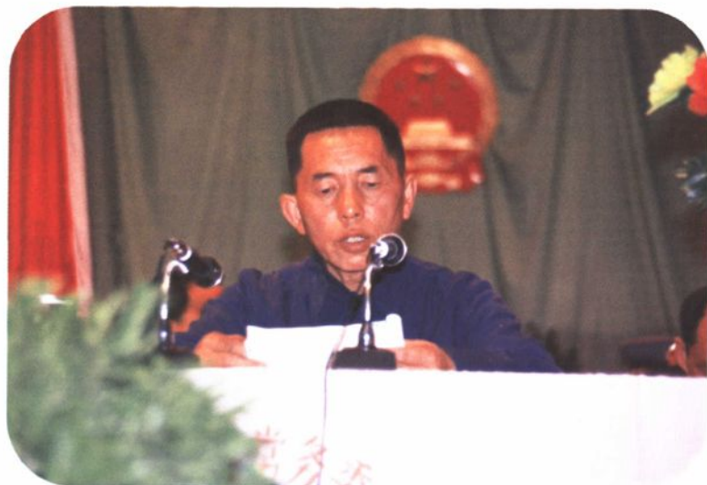
▲南华县第八届、第九届人民代表大会 常务委员会主任自宗贤。