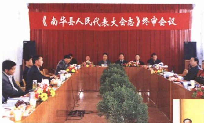
▲《南华县人民代表大会志》终审会议。