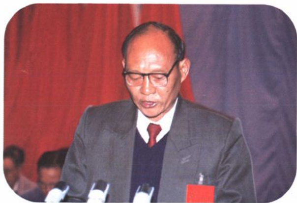
▲南华县第十一届、第十二届人民代表大会 常务委员会主任李凤朝。