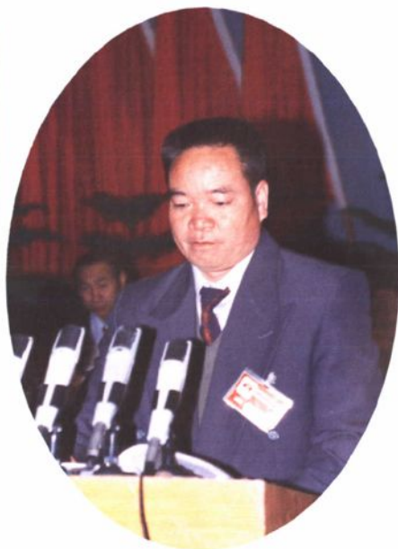
▲南华县第十三届人民代表大会常务委 员会主任何兆芹。