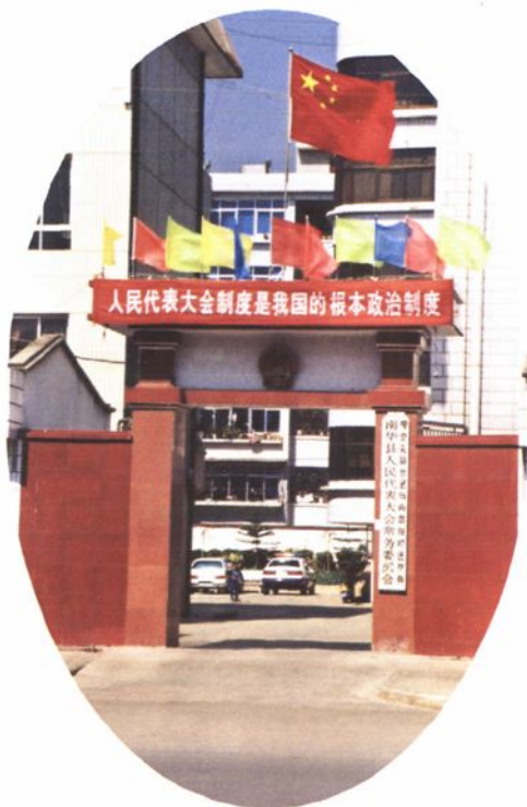
◀南华县人民代表大会常务委员会会址