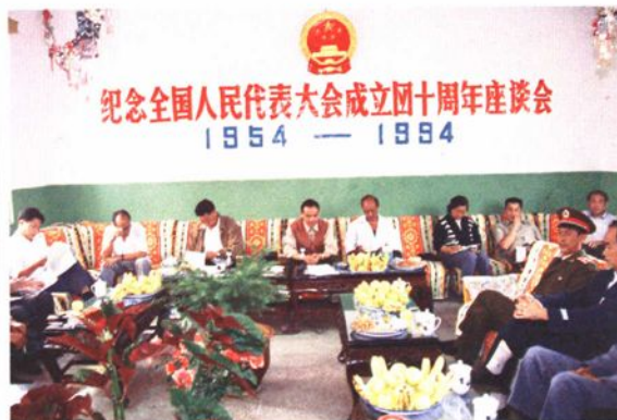
▲1994年9月12日,县人大常委会在机关会议室召开纪念全国人民代表大会成立40周年座谈会。