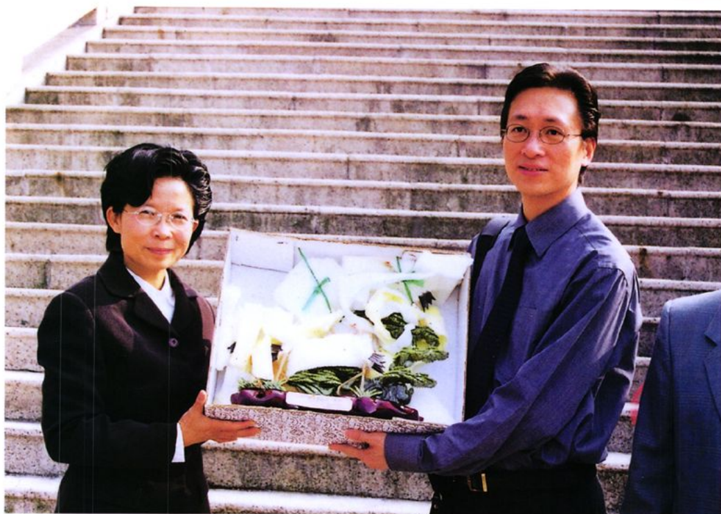
澳门财政司友人与陈灵局长互相交流