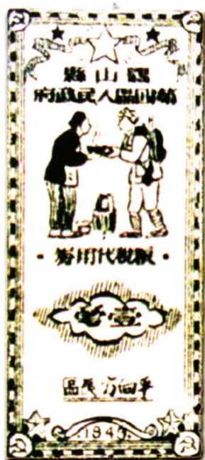
壹毫 5.5 × 9.5 (cm)