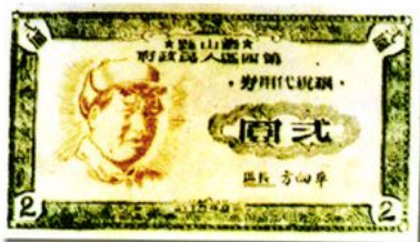
貳圓 12 × 7.1 (cm)