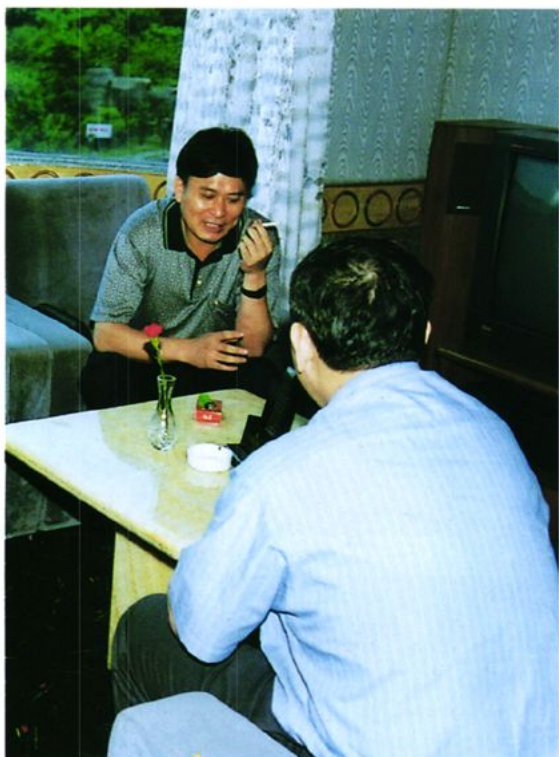
原财政厅厅长陈继兴到鹤山视察