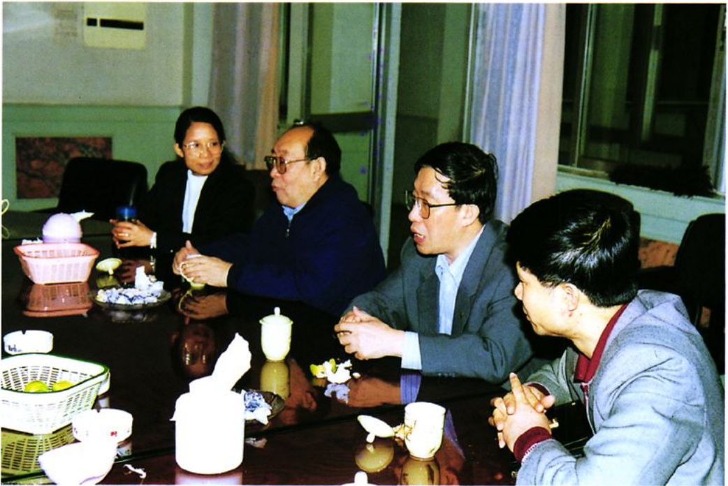
时任财政部副部长田一农（左二）在原省财政厅曾寿喜副厅长（左三）的陪同下到鹤山视察