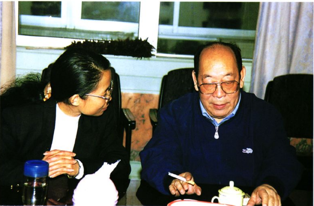
时任财政部副部长田一农（右）到鹤山视察时与陈灵局长亲切交谈