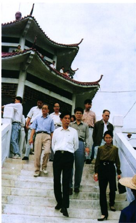
原财政厅副厅长罗妹珠到鹤山视察