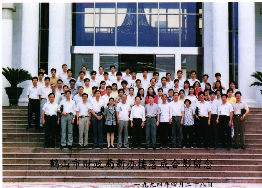
1994年鹤山市财政局新办公楼落成合影