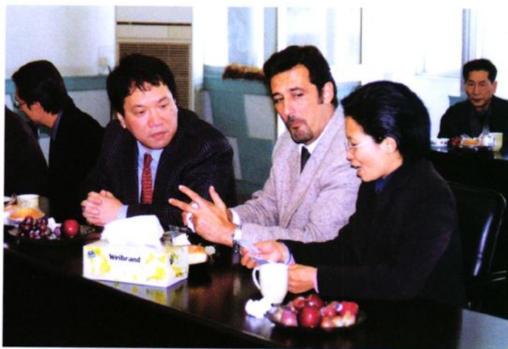
澳门财政司友人与陈灵局长互相交流