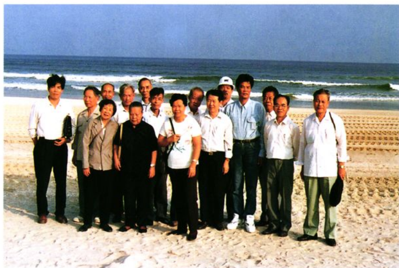
组织老干部到外参观