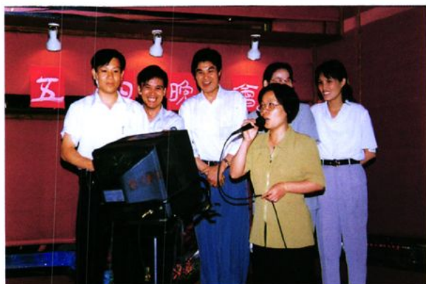
局“五四”青年节活动