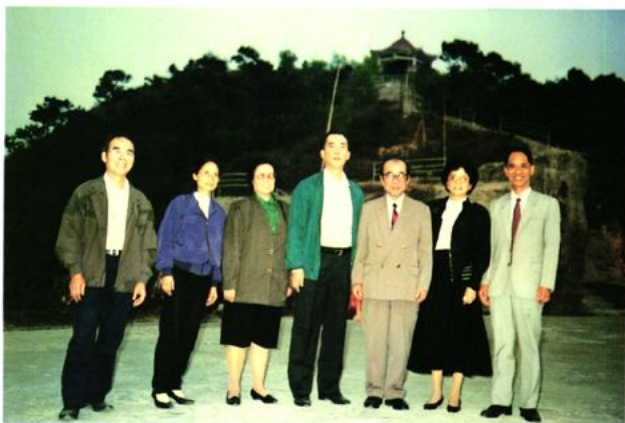
原财政部国债司司长张加伦（右三）到鹤山视察