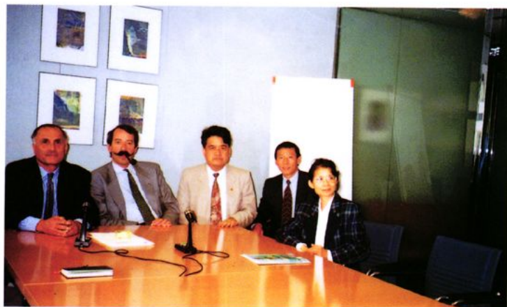
巴黎大尼会计师协会友人到鹤山交流