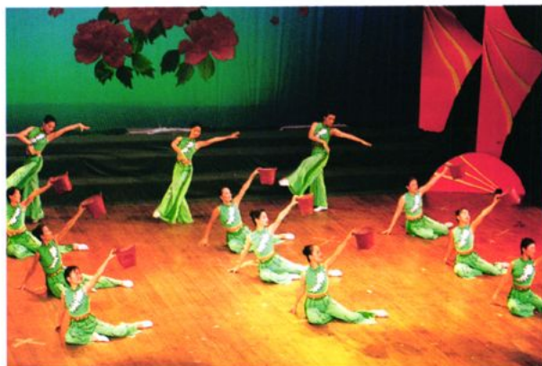
参加鹤山市“庆祝 国庆五十周年”庆典晚 会节目“荔园飘香”