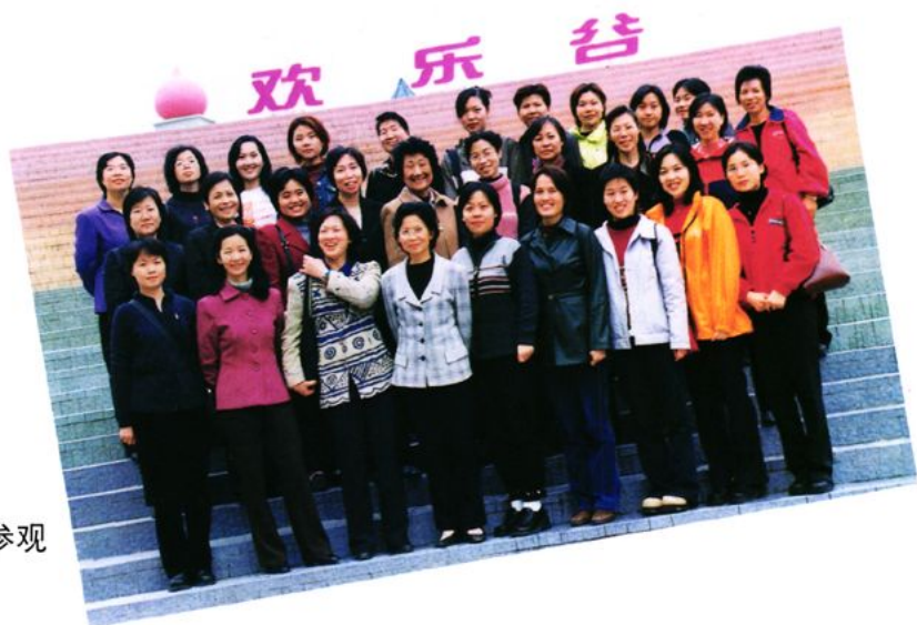
组织妇女干部到外参观