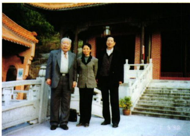
著名财政专家许毅、黄菊波莅临鹤山指导