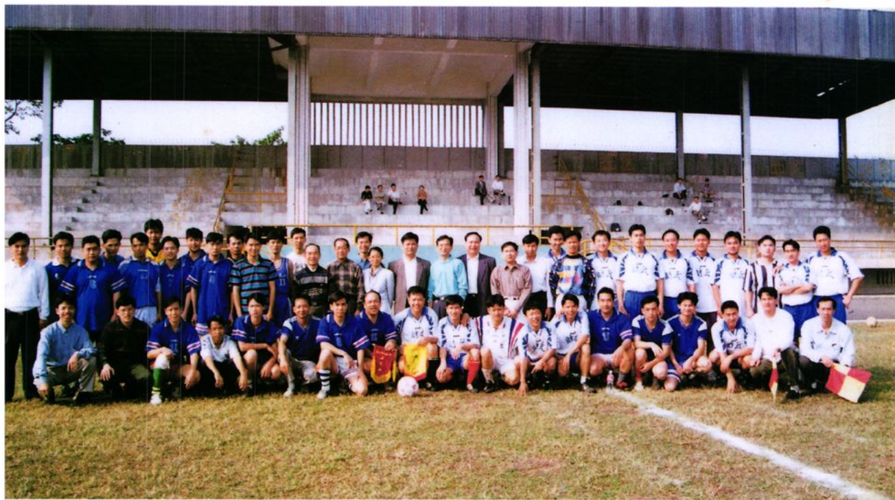
与兄弟单位进行体育交流