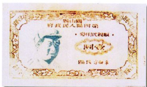
壹圓 12.5 × 7.1 (cm)