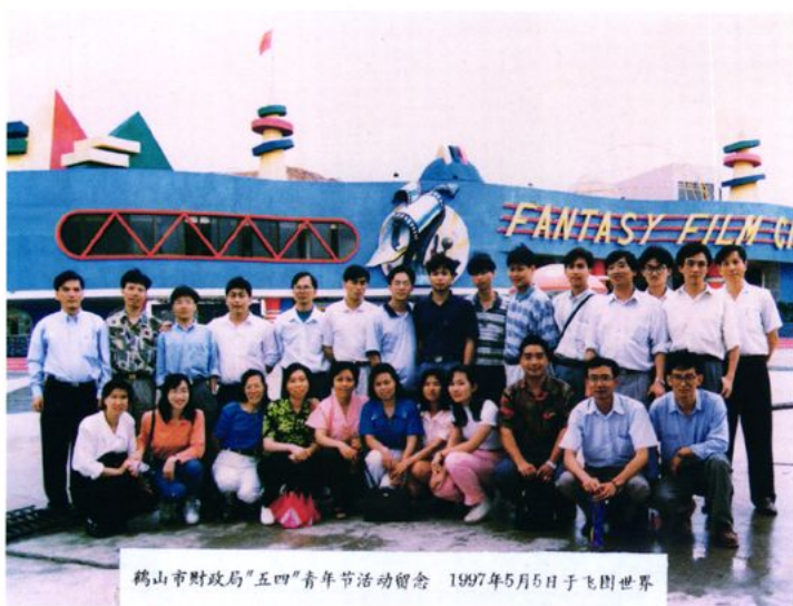
组织青年干部到外参观