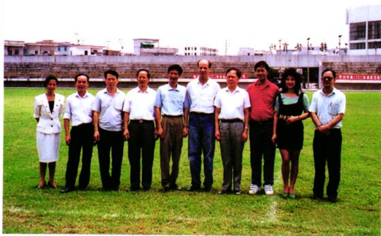
澳门财政司、省财政厅与我局进行体育交流