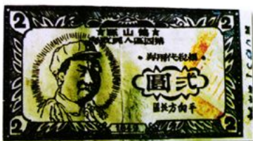
貳圓 12.8 × 7 (cm) 高鶴縣第一區人民政府糧稅代用券