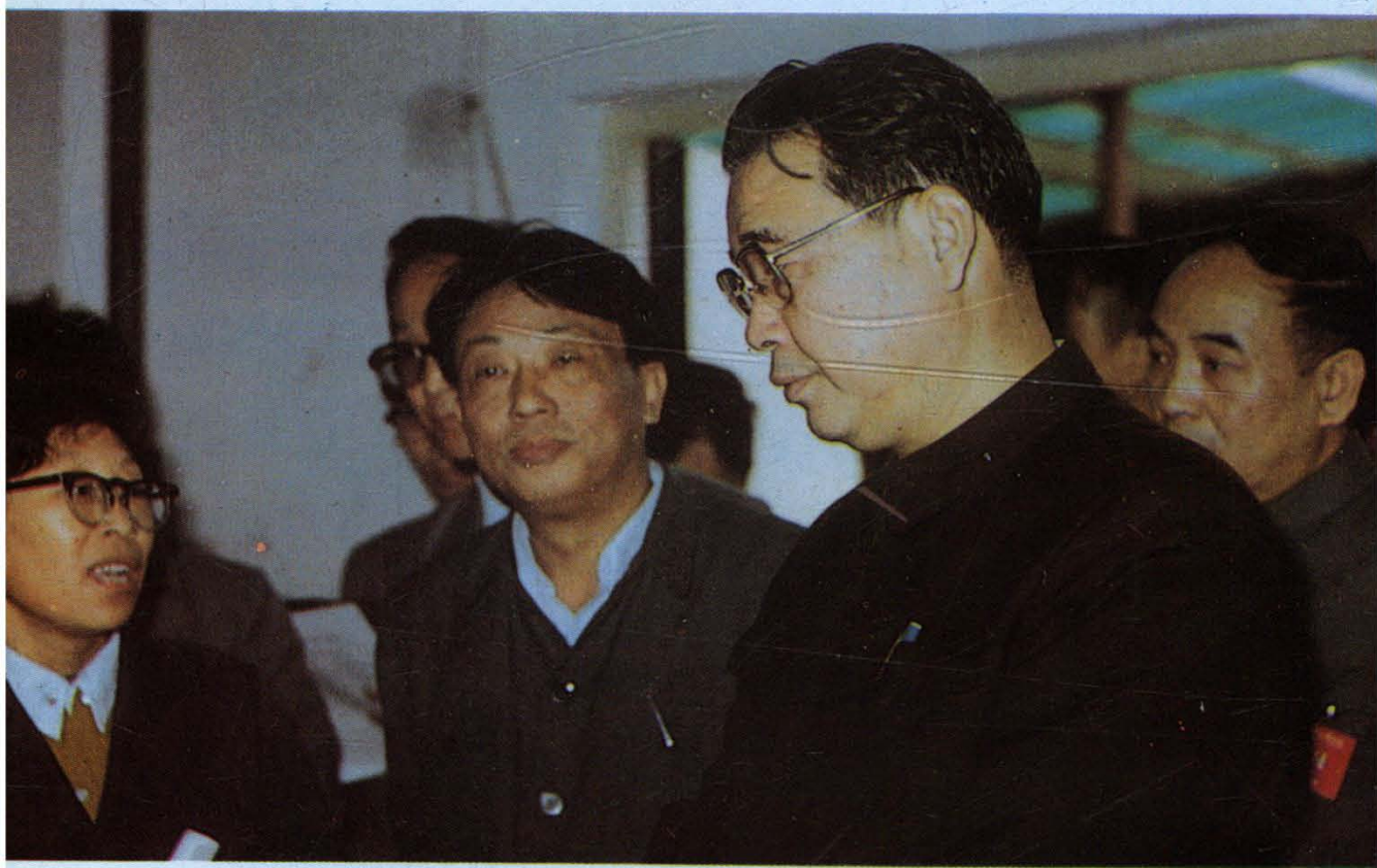
1985年10月12日，李鹏同志视察洛轴