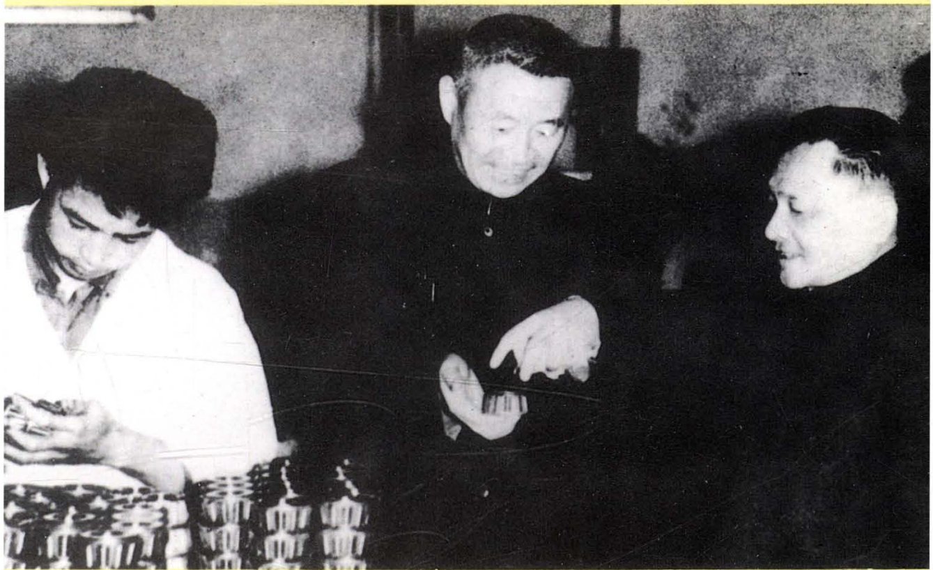
1964年4月17日，邓小平同志视察洛轴