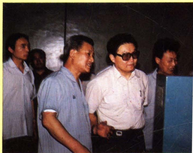
1990年8月4日，李长春同志视察洛轴