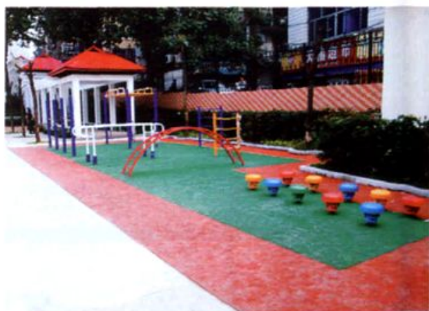
操场体育教学设施