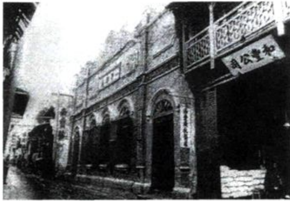
柴桑小学原校址：1904年迁入梅花庵巷口，原义学旧址（图一）