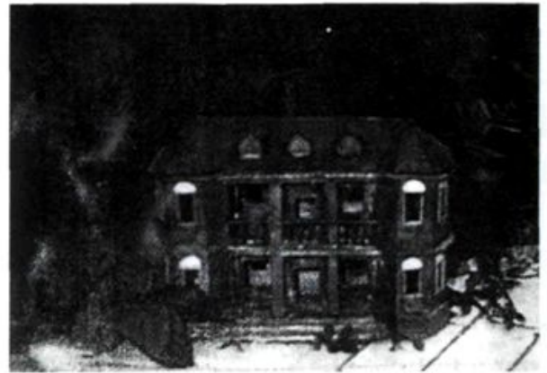
原校址：旧府城隍庙（图二）