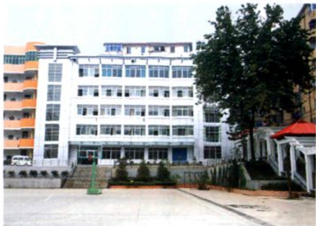
教师办公大楼——光彩楼