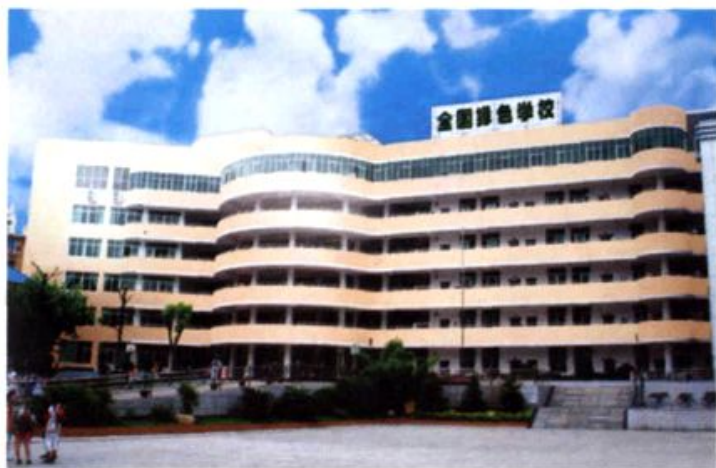
教学综合大楼——逸夫楼