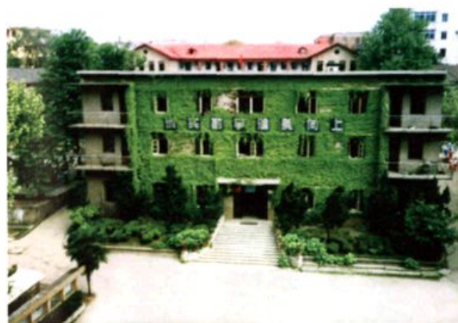
八十至九十年代办公楼