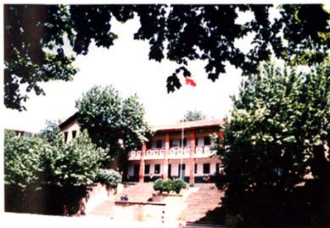
五十至七十年代教学楼