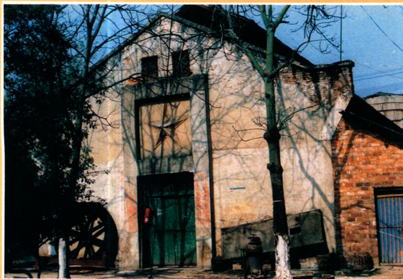
1962、12 — “文化大革命” 黨校在益陽市石壁湖校址，學員宿舍樓。