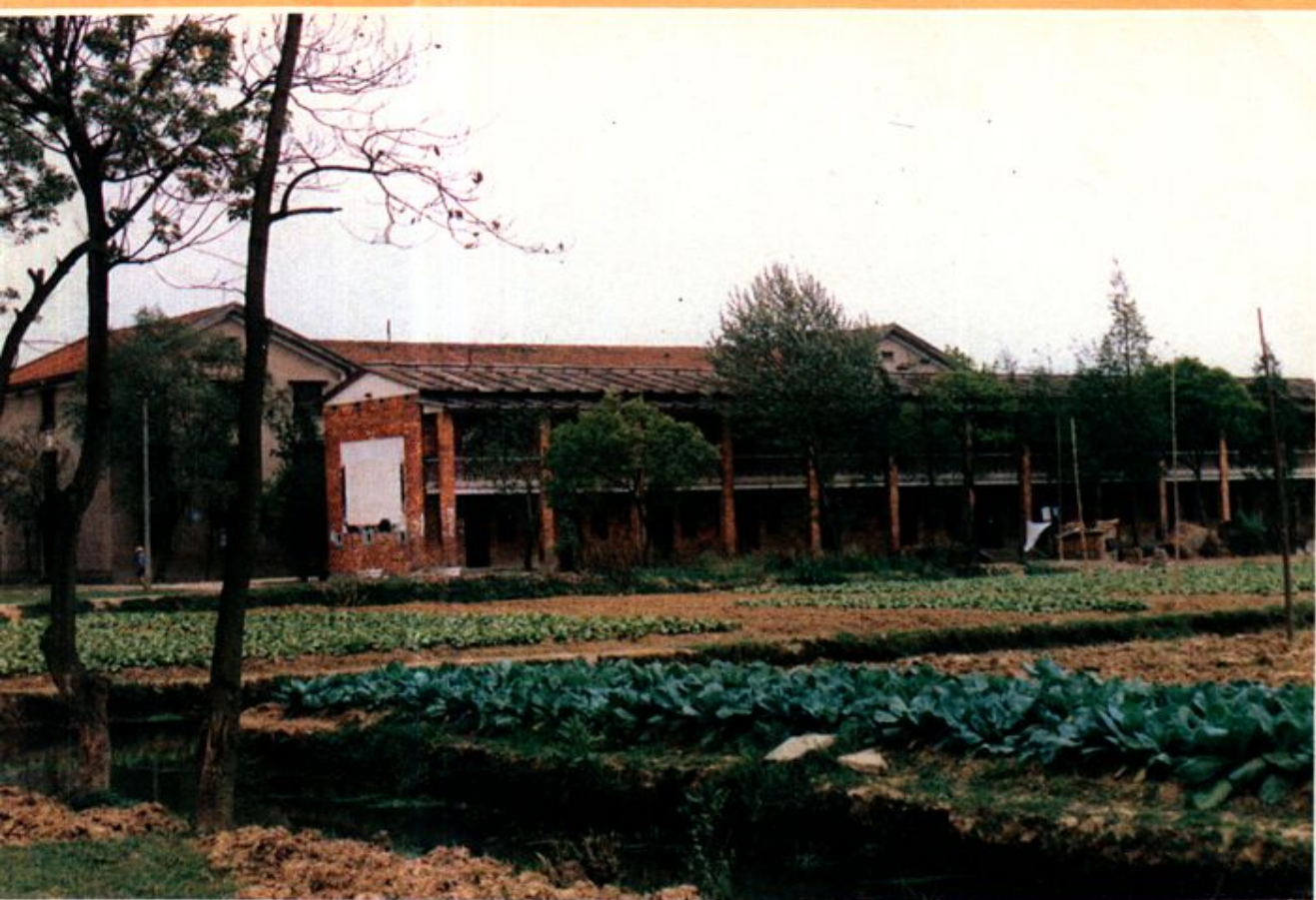
1977、6—1981年底黨校在益陽縣注瀾湖校址，學員宿舍樓。