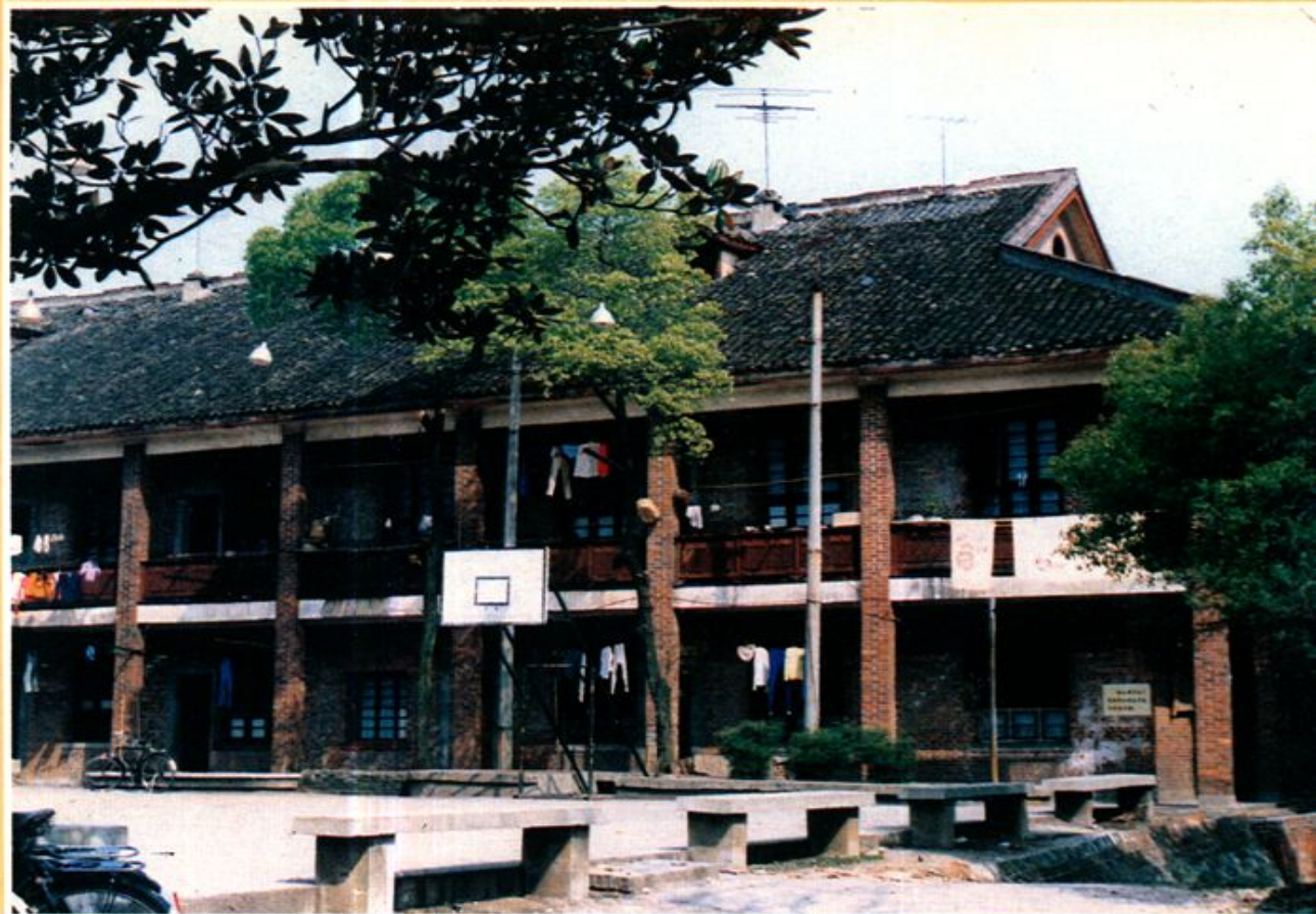
1951、12 — 1952、10 黨校在益陽市大渡口校址，學員宿舍樓。