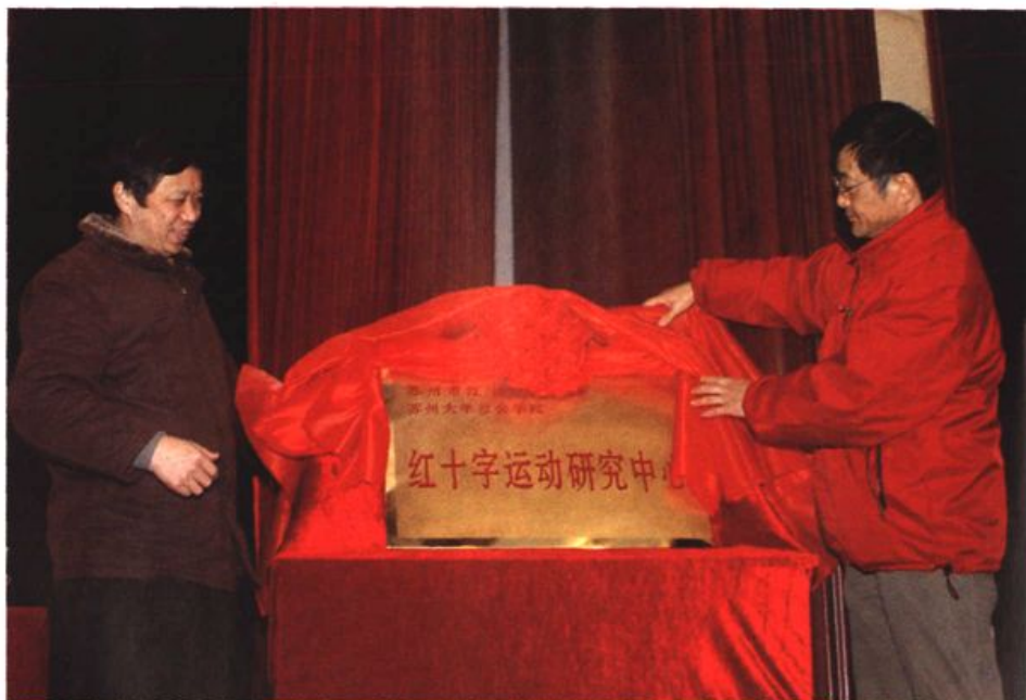
图17 苏州市红十字会和苏州大学社会学院合作成立全国首家红十字运动研究中心。