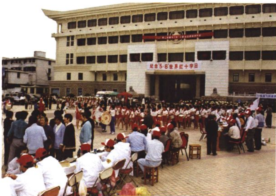
图13 每年，苏州市、区两级红十字会都开展多场大型宣传纪念活动。这是市区的一次活动场景。