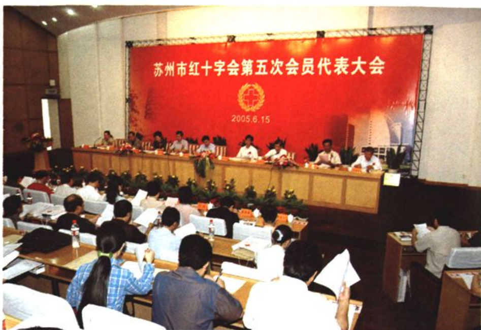
图12 苏州市红十字会第五次会员代表大会 2005年6月15日隆重举行。