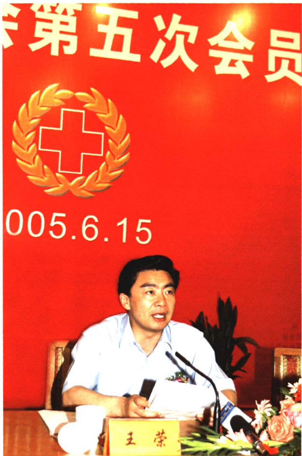
图7 中共江苏省委常委、苏州市委书记、市红十字会第五任名誉会长王荣在市红十字会第五次会员代表大会讲话。