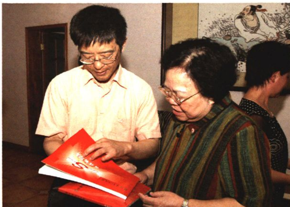
图3 中国红十字会会长、前全国人大常委会副委员长彭珮云(中)接受苏州市红十字会画册，并对苏州红会工作予以高度评价。