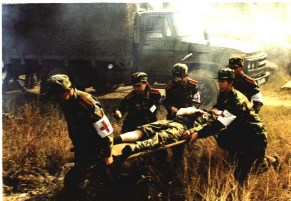
图18 国际红十字运动起源于战地救护。这是发生在苏州的一场战地救护模拟演练。