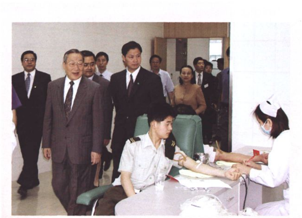
图2 时任中共中央政治局常委、国务院副总理李岚清(左二)视察苏州红十字事业暨无偿献血工作。