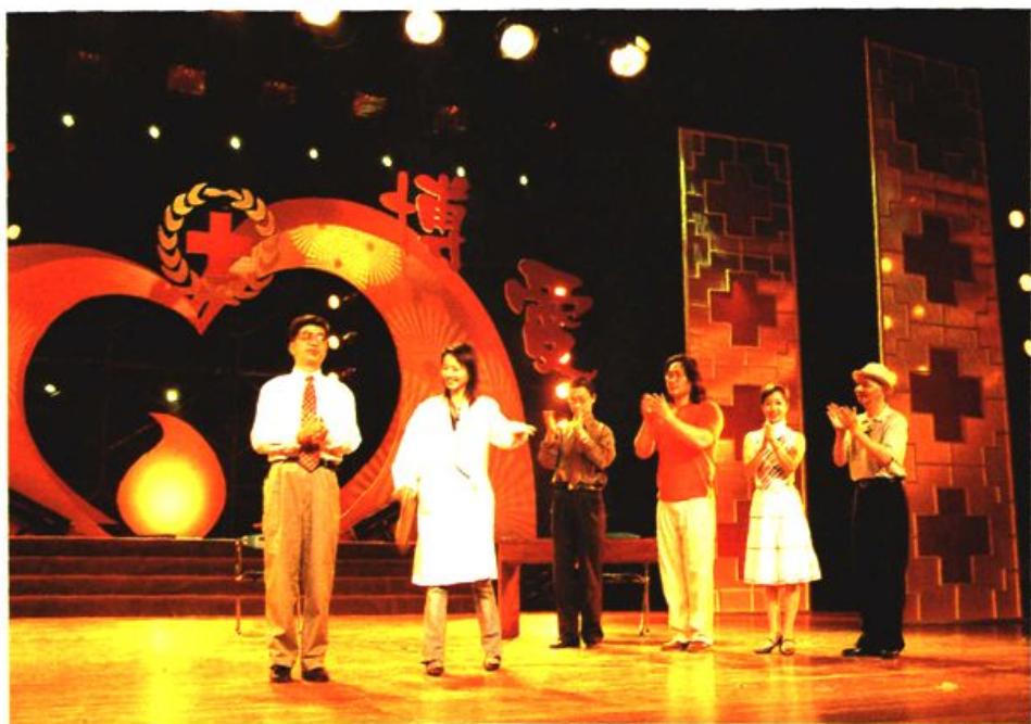
图14 苏州市红十字会举办弘扬人道博爱精神的文艺演出。