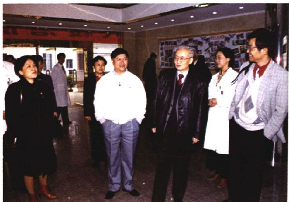
图4 时任中国红十字会常务副会长顾英奇(右三)视察苏州市红十字会老年康复医院。