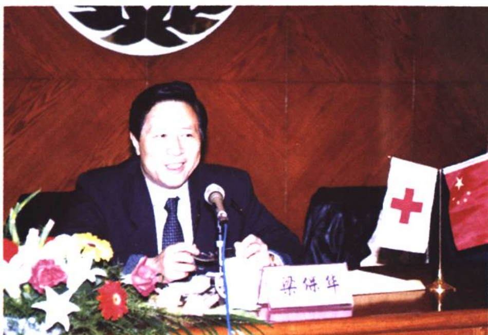
图5 时任中共江苏省委常委、苏州市委书记、市红十字会第二任名誉会长梁保华在纪念苏州市红十字会建会75周年大会上讲话。