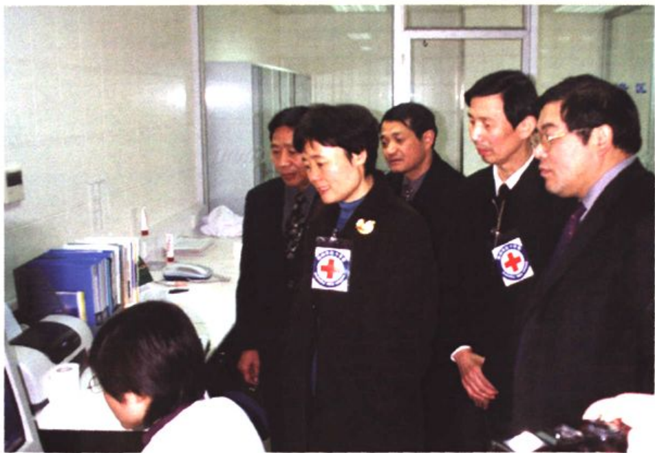
图9 苏州市人大常委会主任杜国玲(右四)视察骨髓捐献配型实验室。