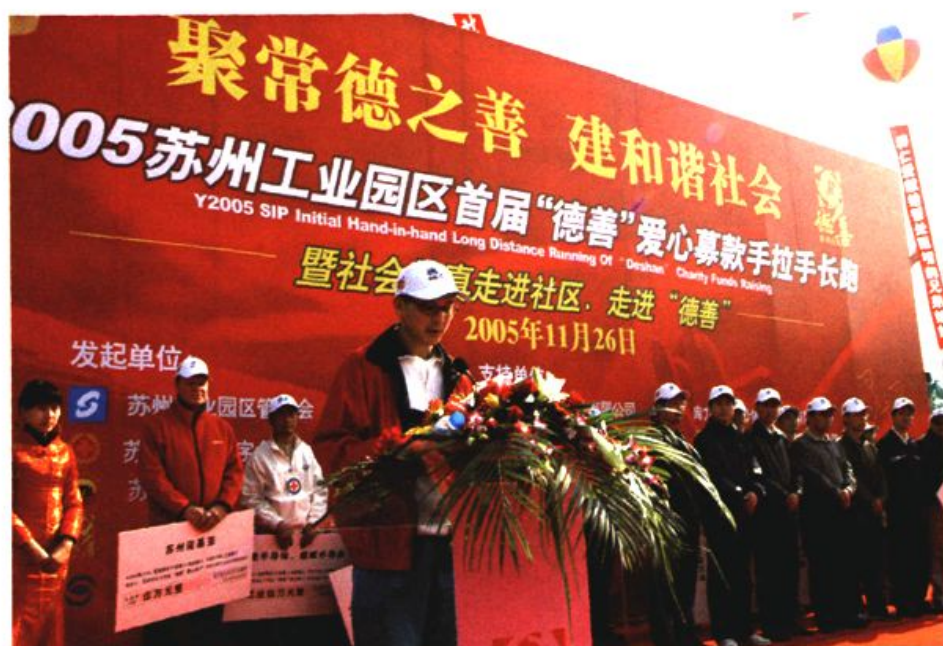
图19 以“德善”为龙头的“善字系列救助计划”得到许多爱心企业的大力支持和参与，成为一项募捐救助的创新工作。