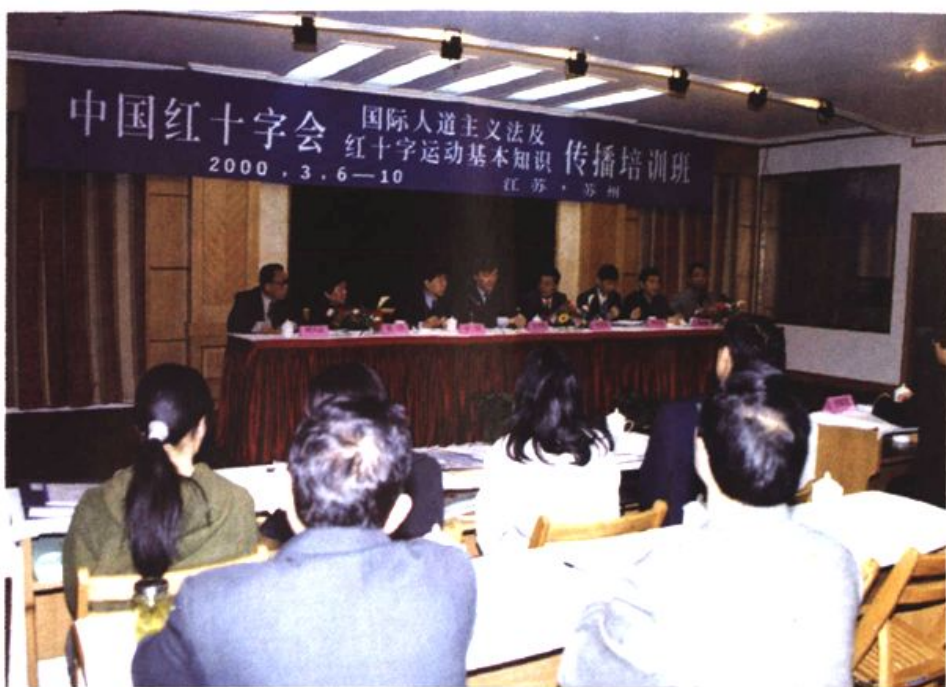
图16 苏州市红十字会人道法传播和宣传、理论工作居全国领先水平，全国在苏州举办培训班推广。