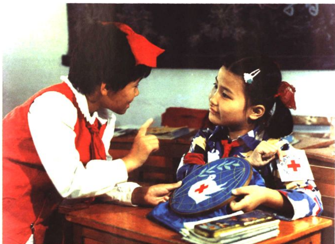
图20 苏州的学校红十字工作居全国全省前列，同学们积极参加丰富多彩的红十字青少年活动。