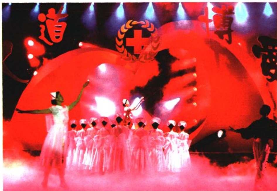
图15 苏州市红十字会举办弘扬人道博爱精神的文艺演出。