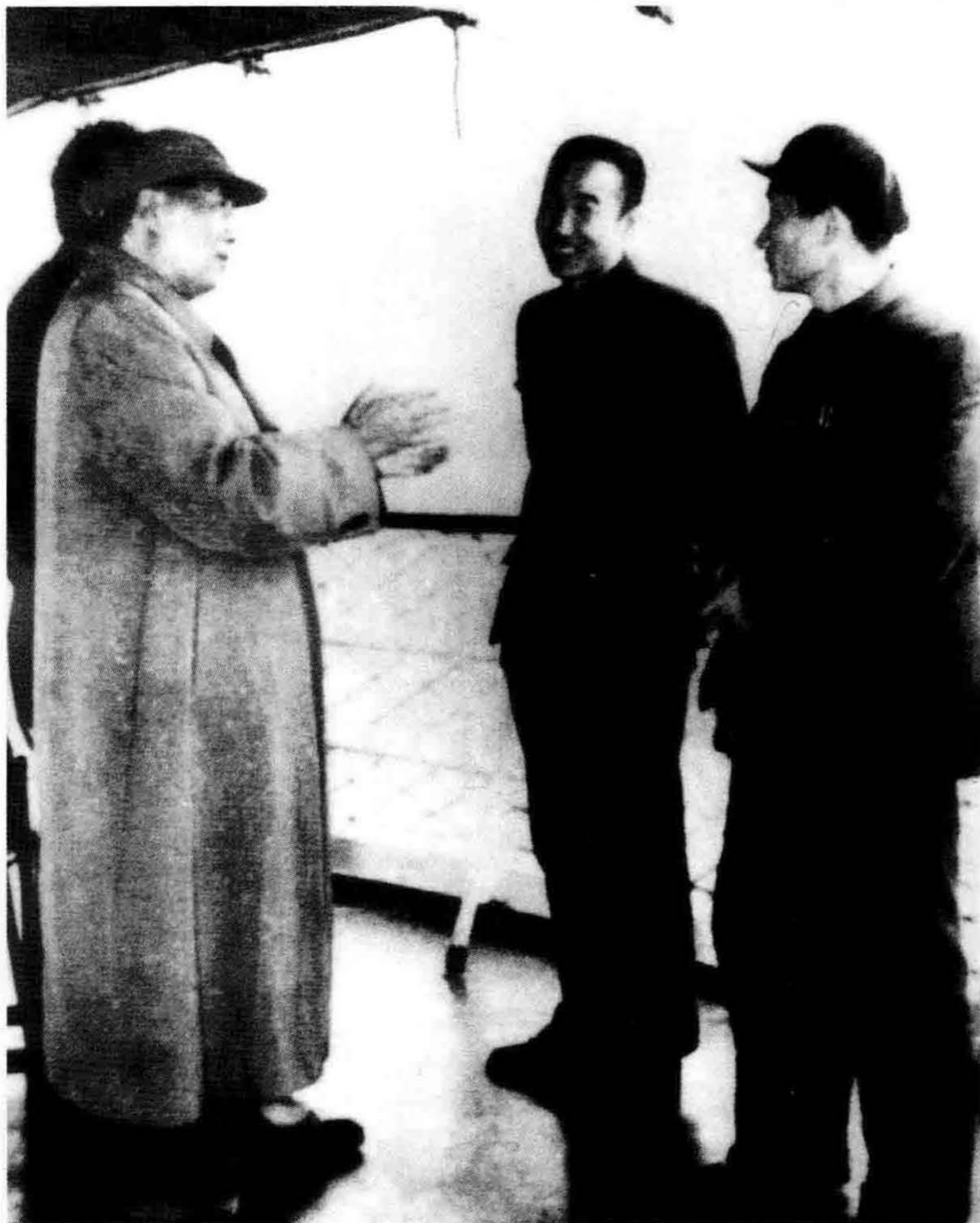
1958年3月29日，毛泽东乘“江峡轮”巡视荆江大堤，并听取中共荆州地委第二书记陈明（右一）的汇报，详细询问荆江堤防情况