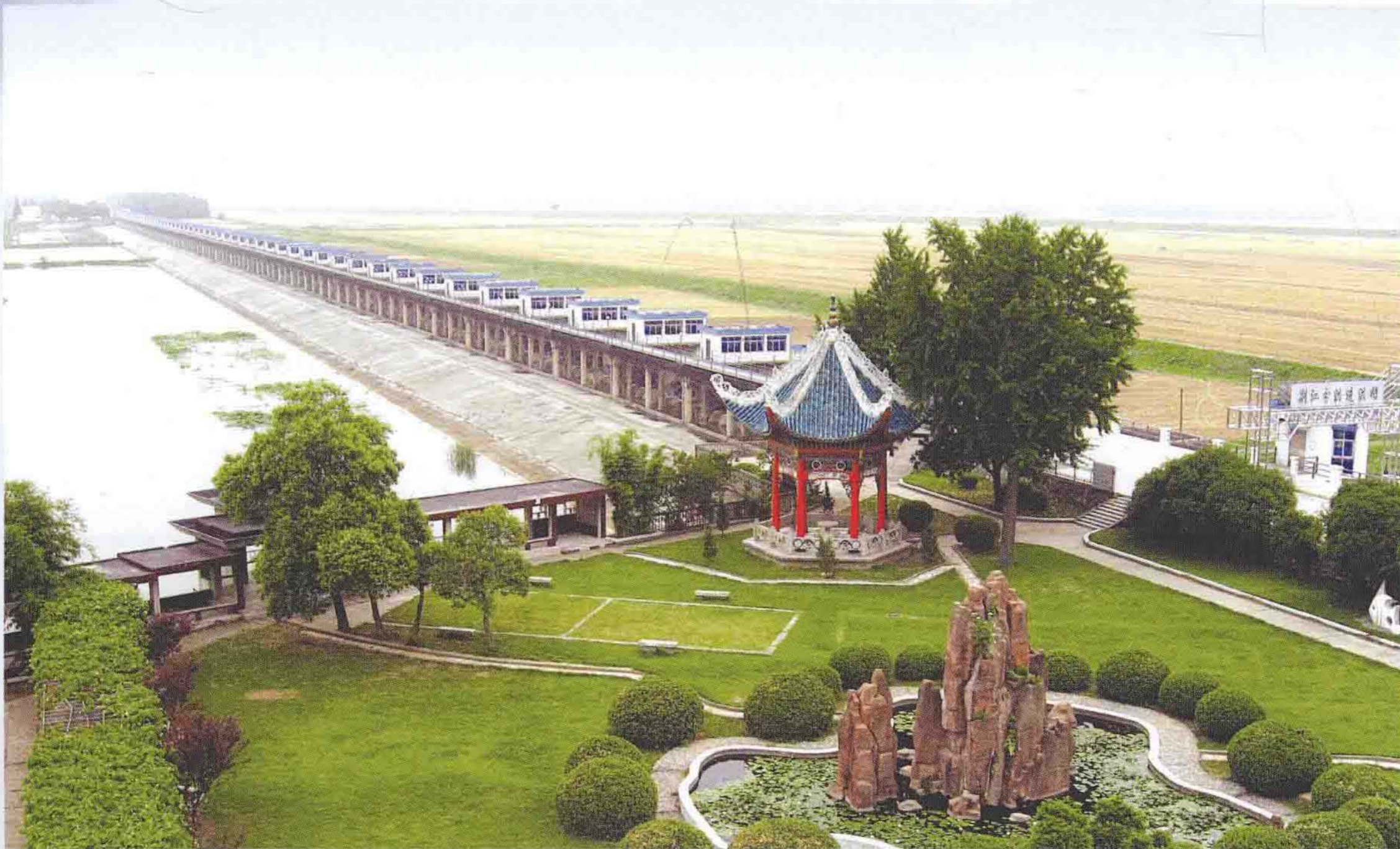
荆江分洪工程进洪闸——北闸