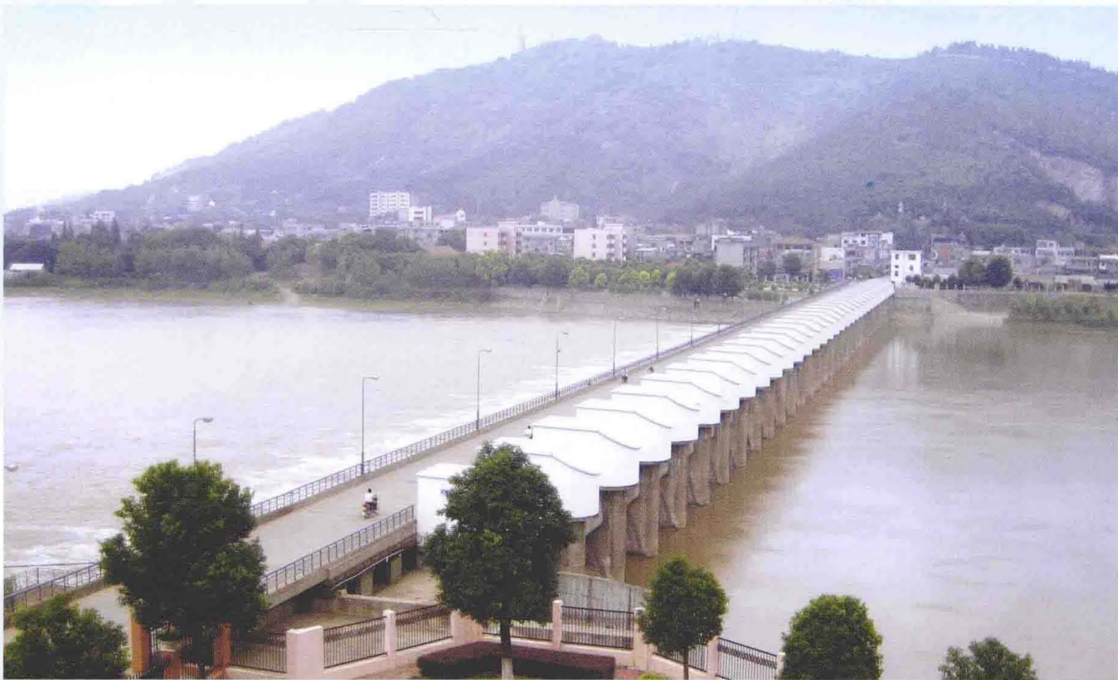
荆江分洪工程节制闸——南闸