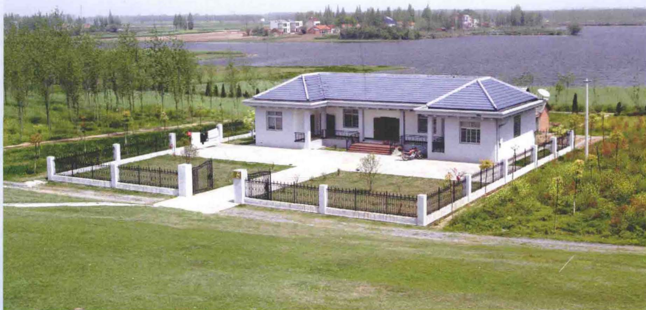
堤防管养组——荆江大堤闵家潭