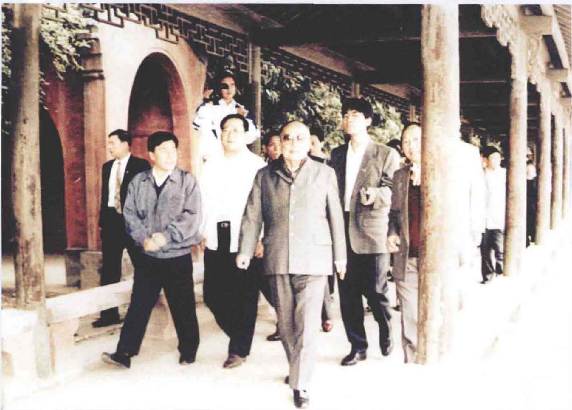
1988年10月，杨尚昆视察荆江大堤观音矶