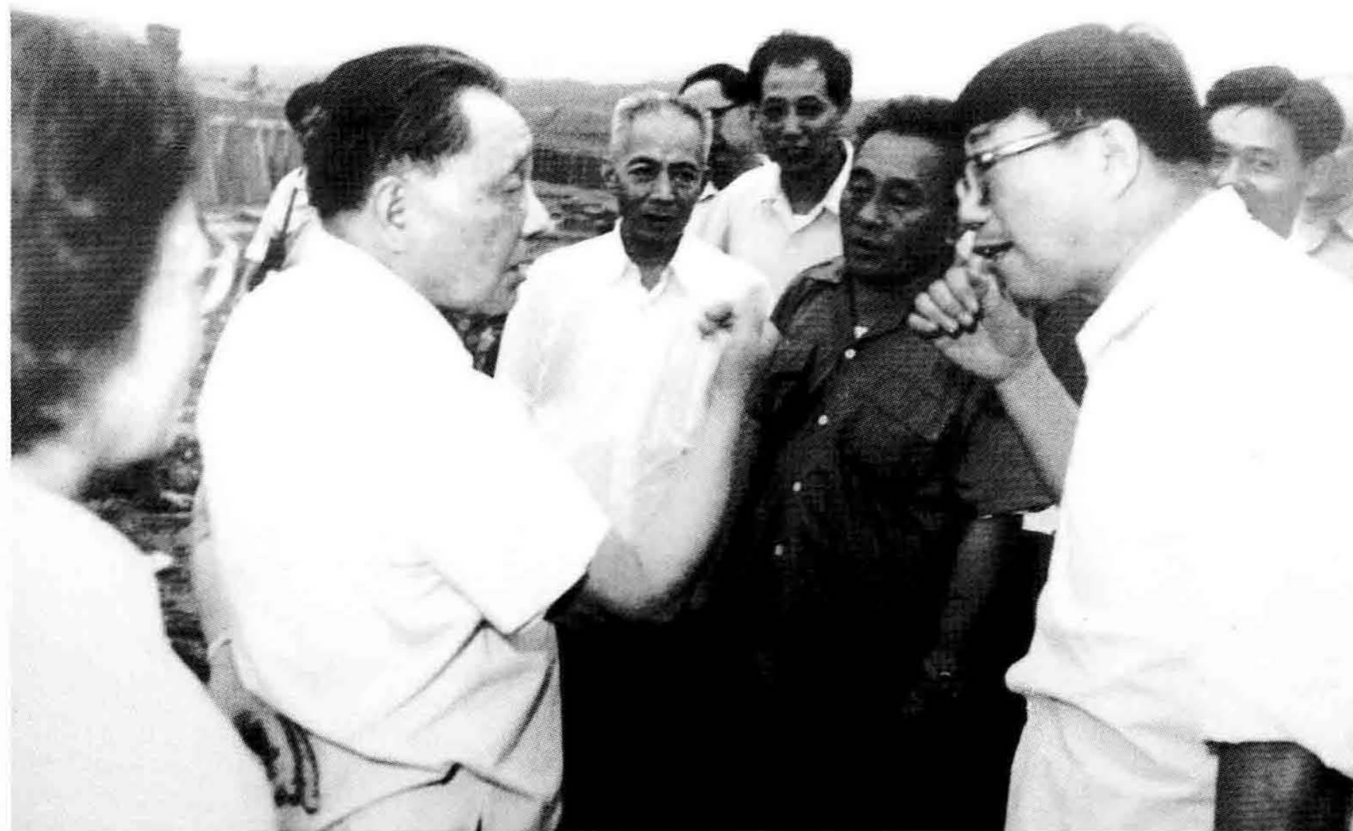
1980年7月，邓小平在中共湖北省委第一书记陈丕显陪同下考察三峡时，详细了解荆江防洪问题