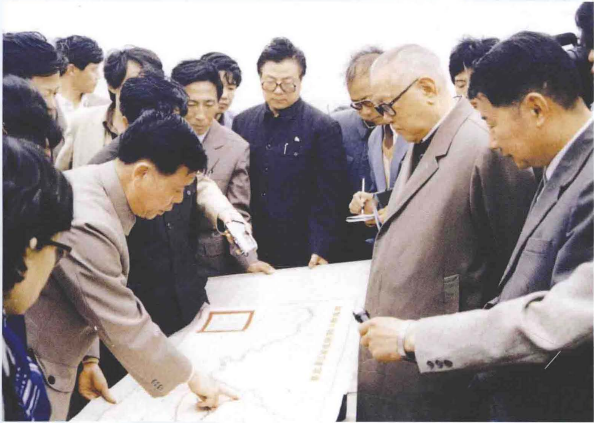
1988年4月26日，李先念视察荆江大堤