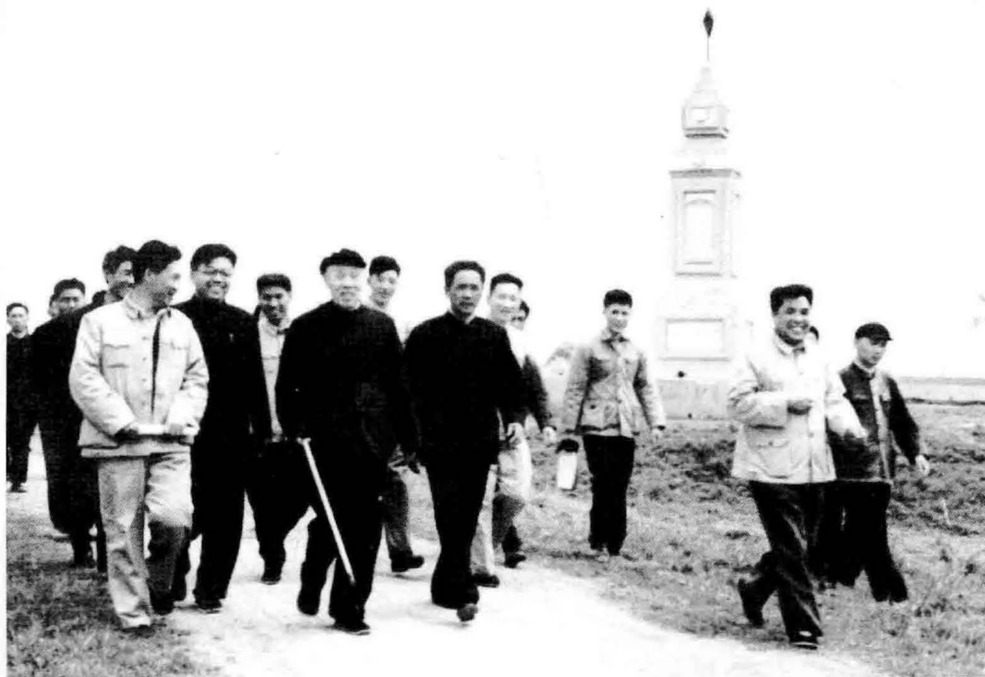
1965年5月，董必武在湖北省省长张体学等陪同下视察荆江分洪工程及荆江大堤