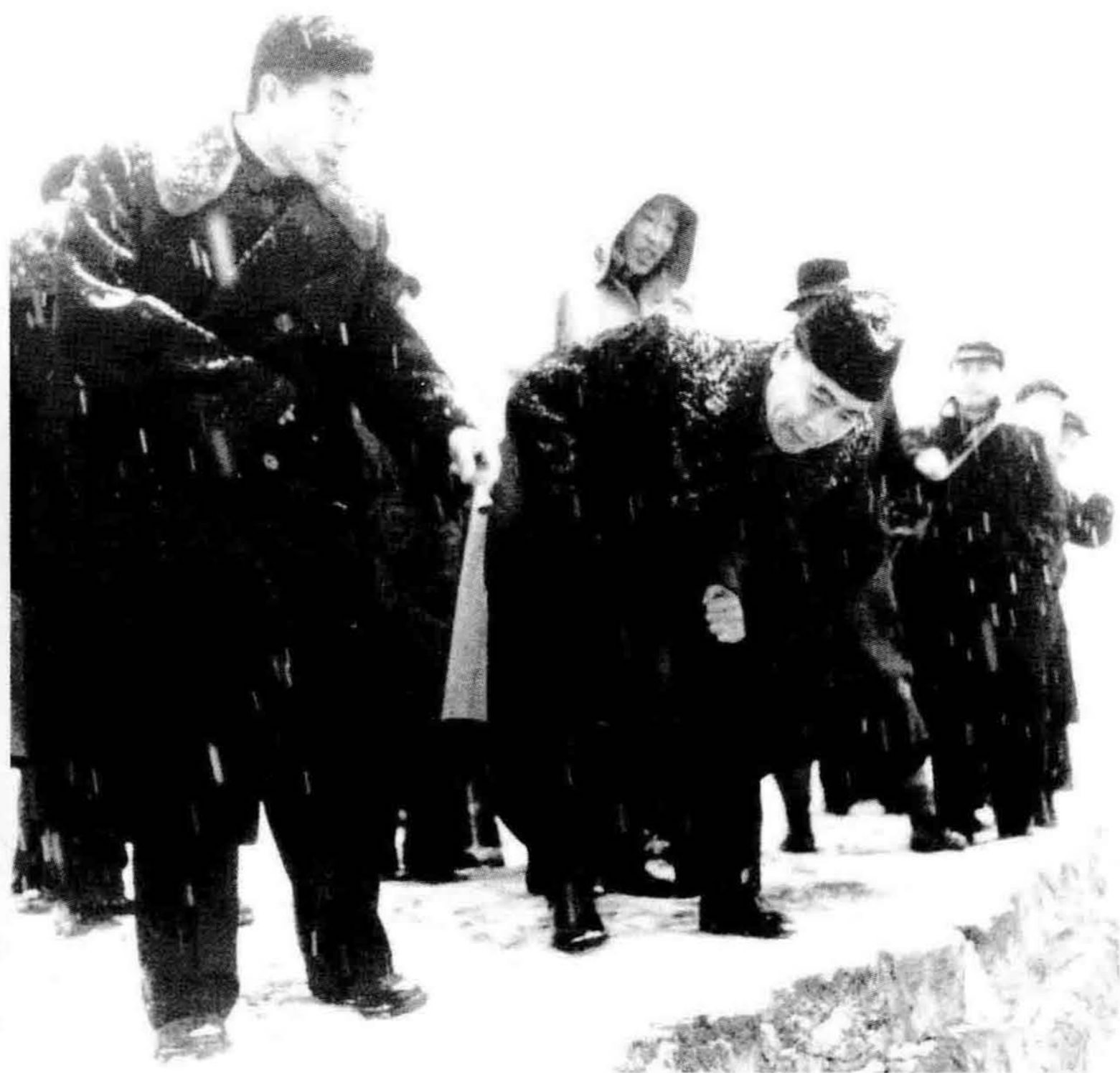
1958年2月28日，周恩来在李富春、李先念及长办林一山（左一）等陪同下，乘“江峡轮”从武汉溯江而上，抵达江陵郝穴后，冒雪视察荆江大堤