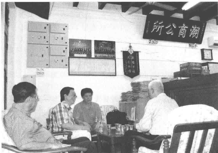
槟榔屿潮州会馆中潮学者与潮侨进行多语种交流

海外潮人的社会文化生活，从他们在居住地拓展经济业务、创造社会效益、促进文化交流的方式，以及融入当地社会、适应生活环境的决心中可略见一斑。