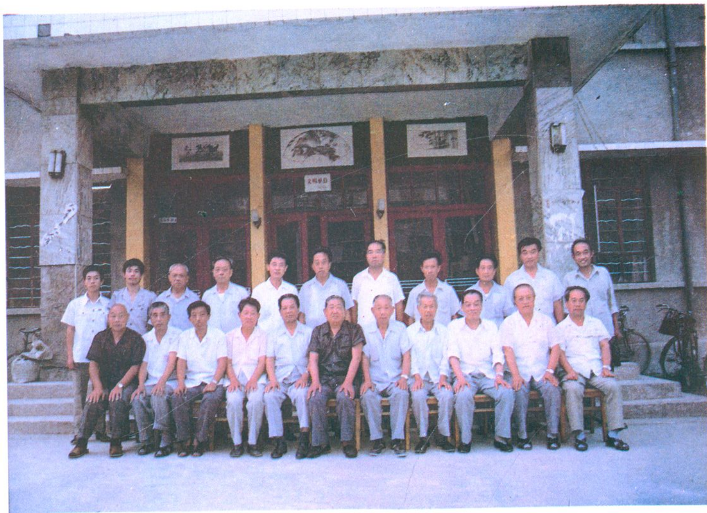
1990年7月26日召开了对本志的评审会议。