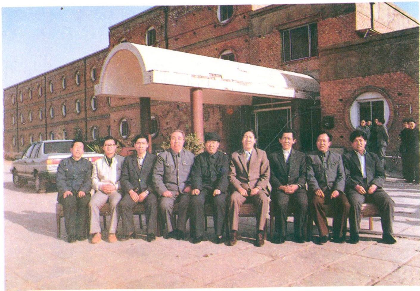
1988年4月10日至15日中国农业银行总行副行长戴相龙，在禹城召开黄、淮、海平原、三江平原地区农业开发信贷工作座谈会。（右四总行副行长戴相龙、右三省行副行长彭汉民、左五禹城县委书记李宝贵、左四本行副行长李宗甫）