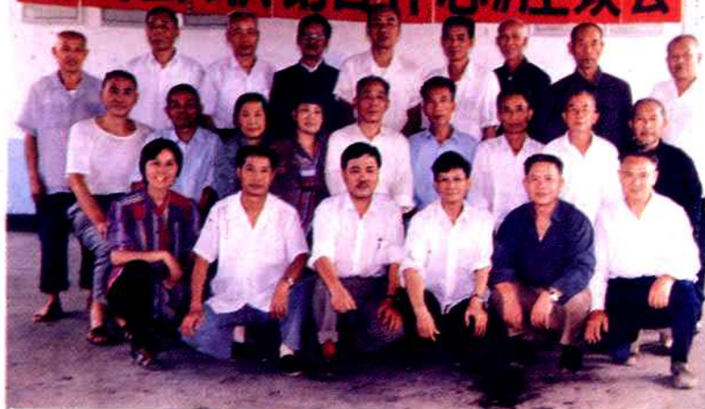
老同志座谈会合影