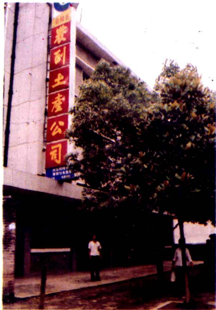
县农副土产公司办公楼