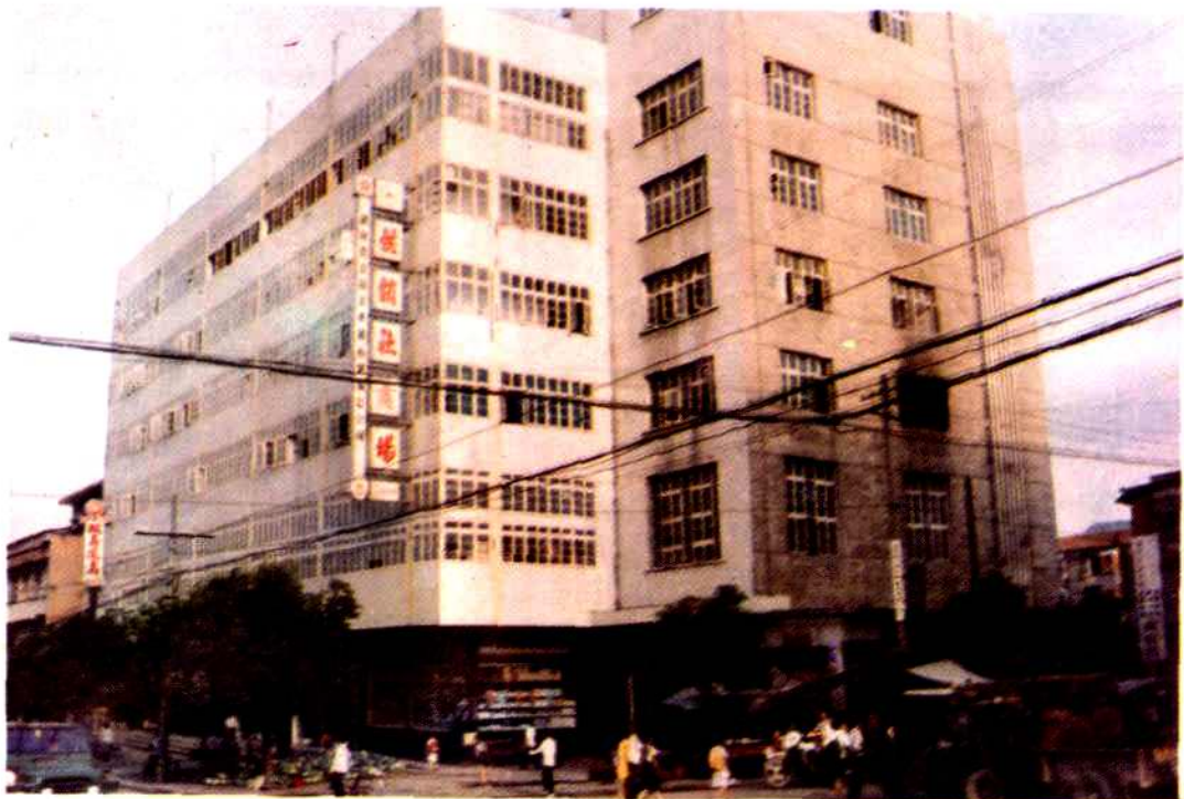
县供销社贸易总公司大楼