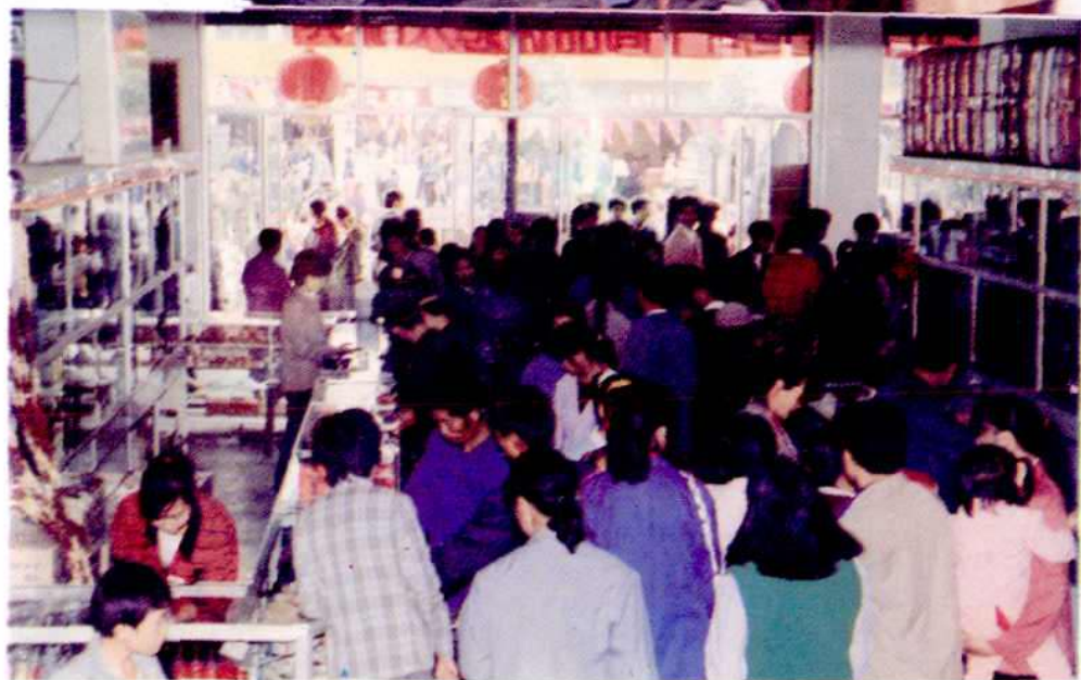
县供销社贸易总公司商场一角