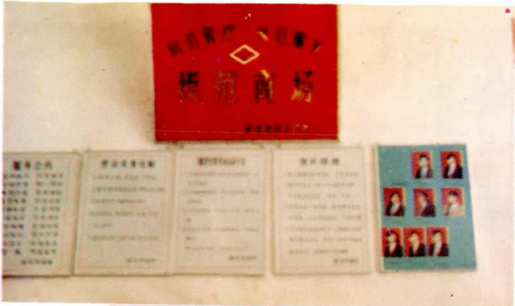
攀龙桥供销社商场一角