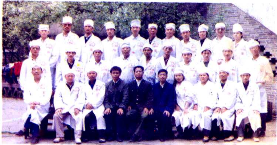
1992年县供销系统首批庄稼医生培训班结业合影