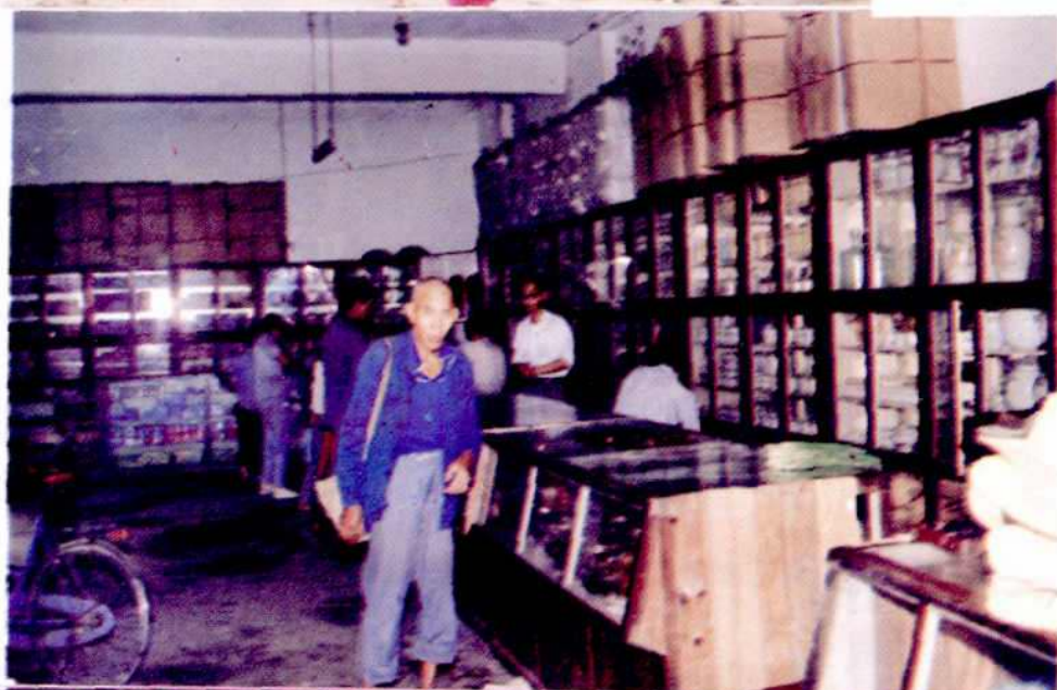
县日杂公司门市部一角