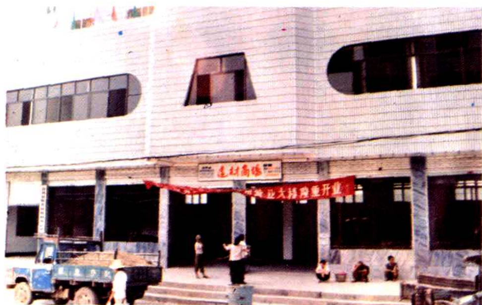
县废旧物资回收利用公司营业大楼