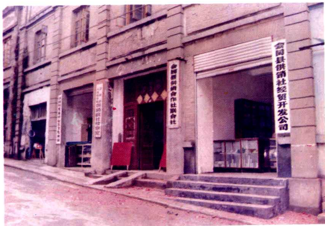
会同县供销社联合社办公楼