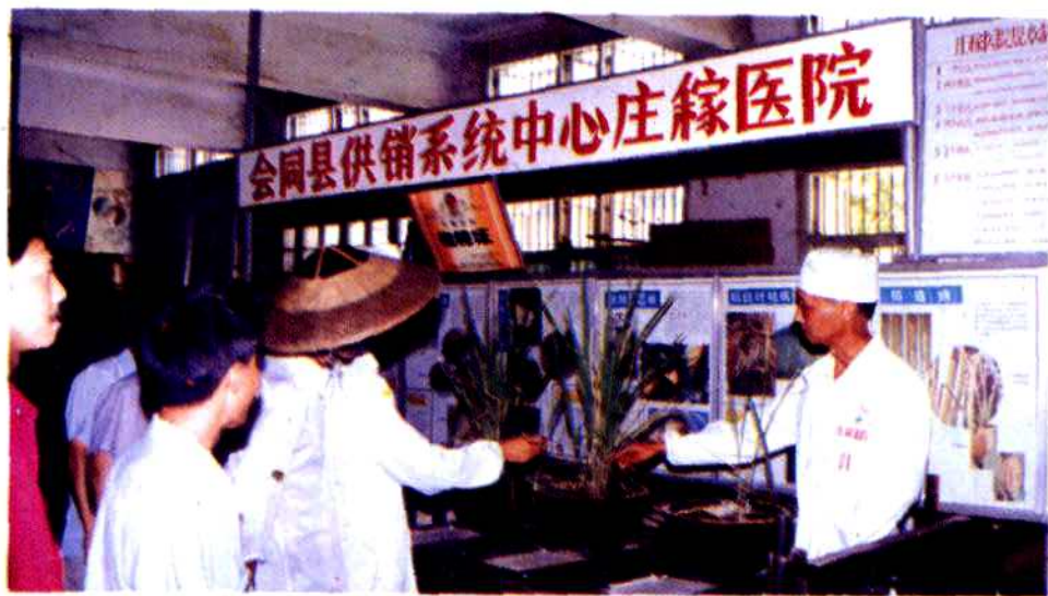
县生产资料公司中心庄稼医院