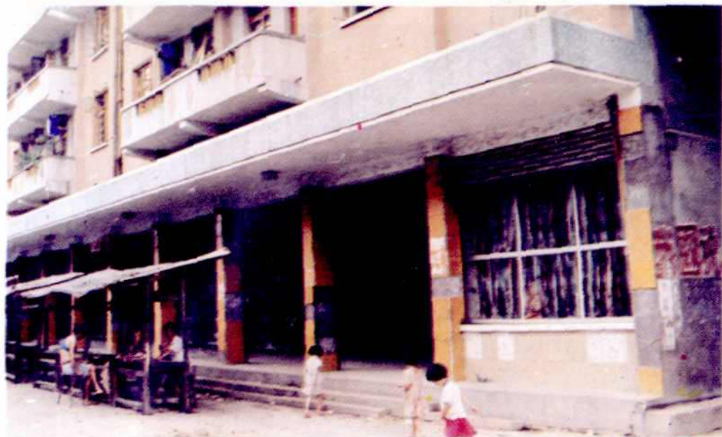
若水供销社商场外貌