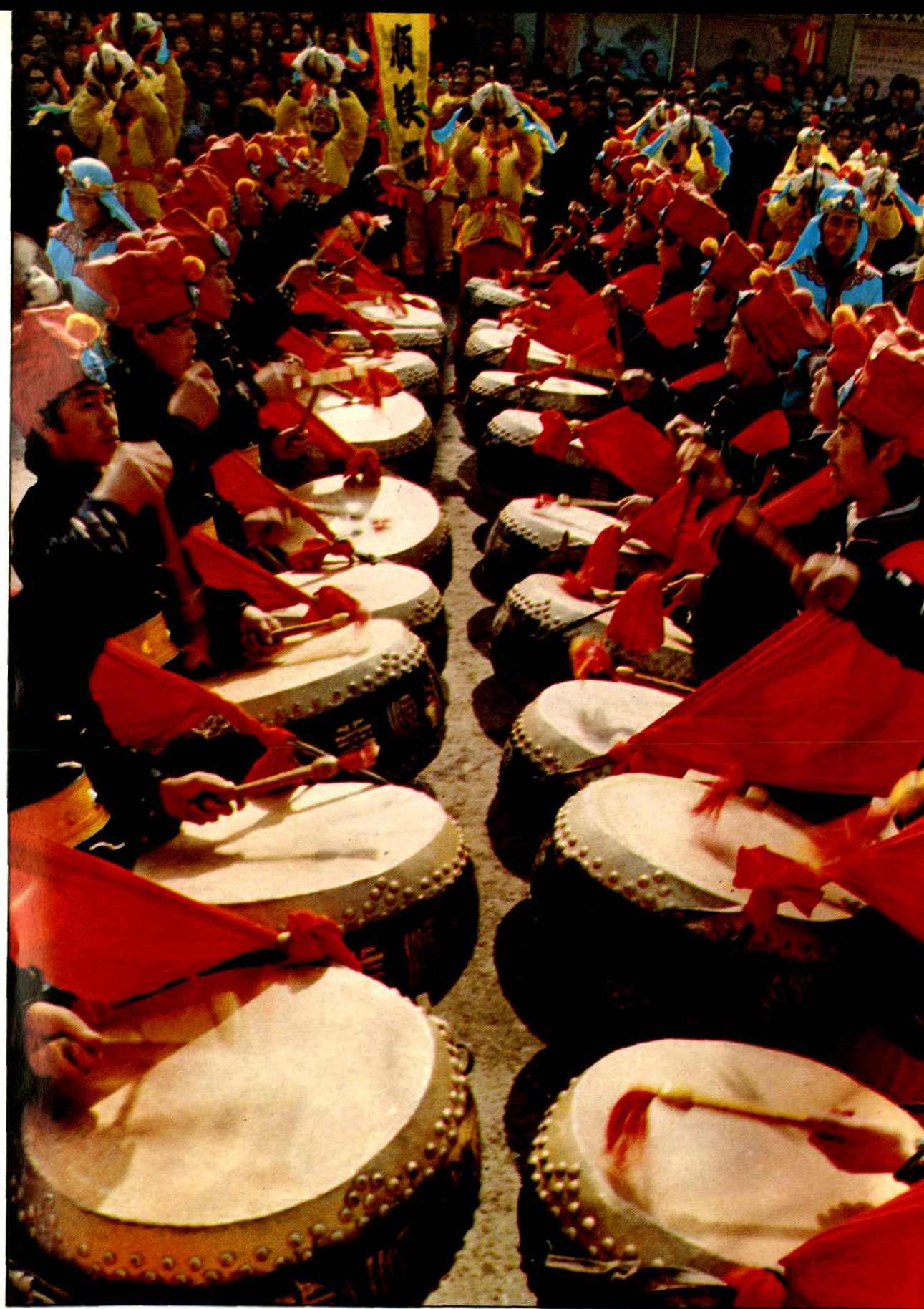
雄风 Valiant Spirit