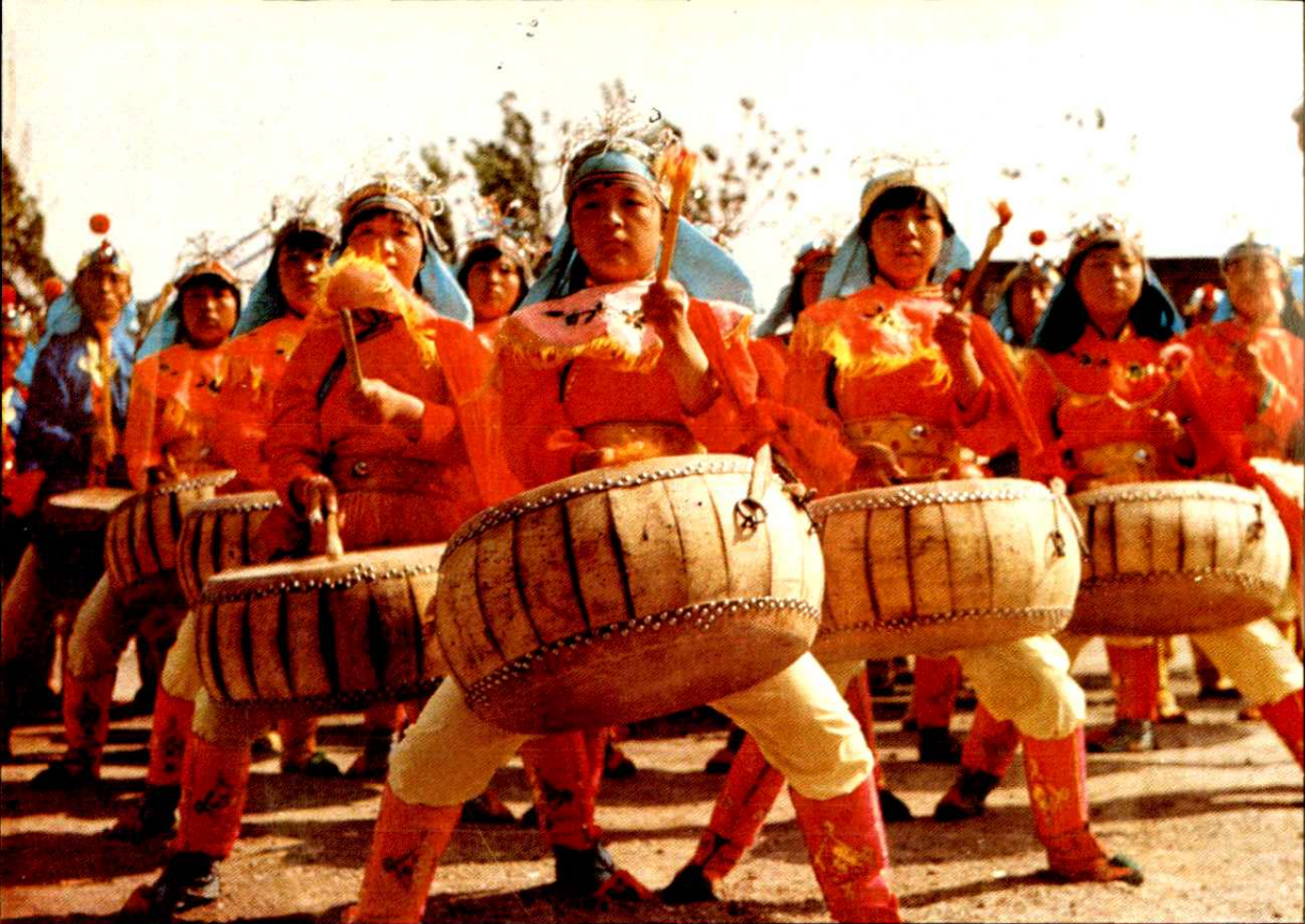
飒爽英姿 Valiant and Heroic Bearing