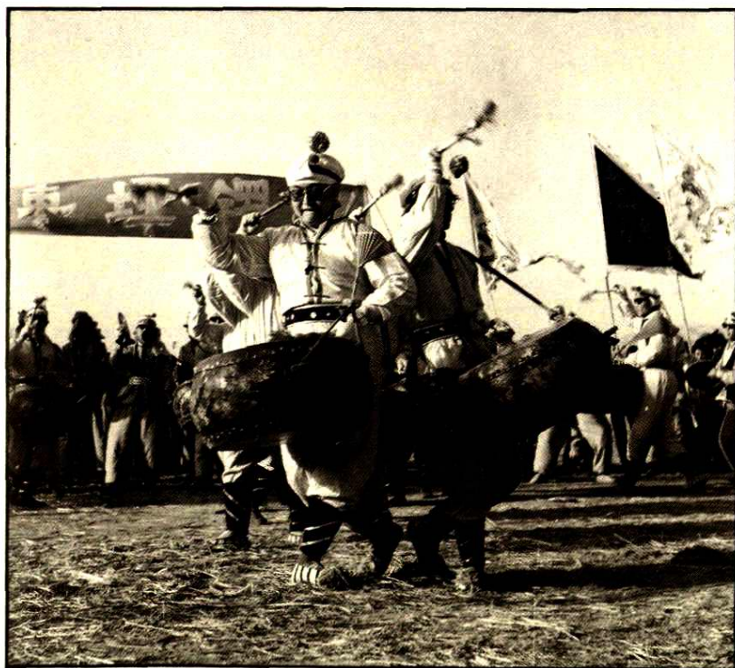
威风锣鼓中的队形组合 “梅花点”

“Wintersweet Array”—an array of the players weifeng drum and gong performance