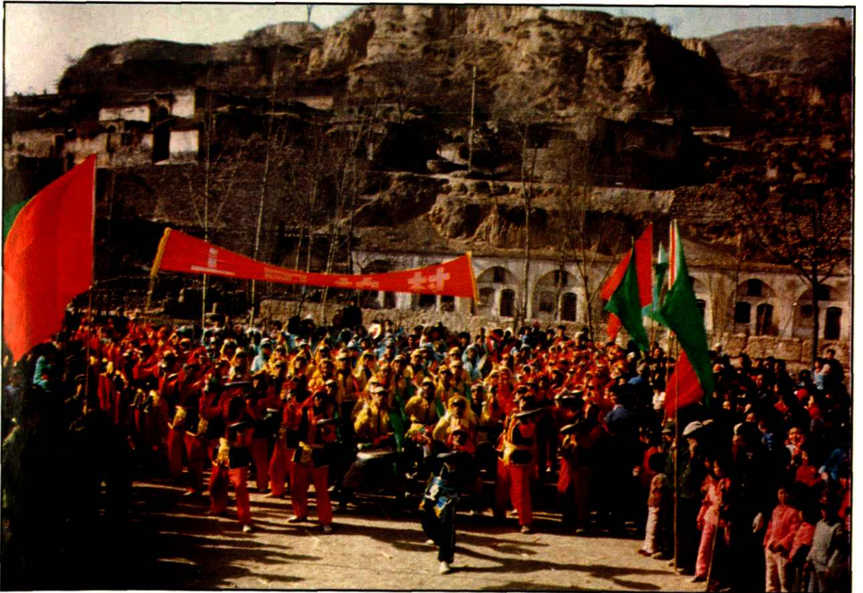
山乡锣鼓 Mountain-Village Drum & Dongs