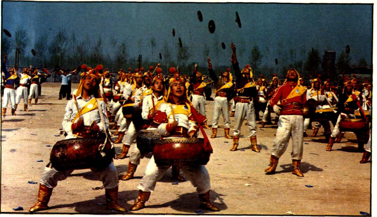
抛镲特技 Stunt Flying Cymbals