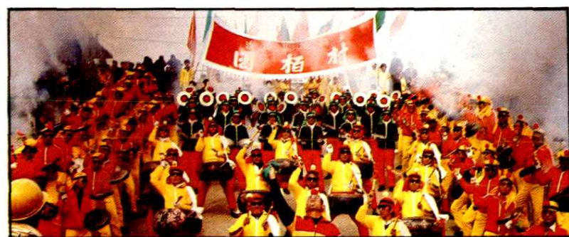
风采 Elegant Bearing