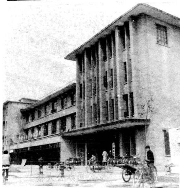
县粮食局办公大楼