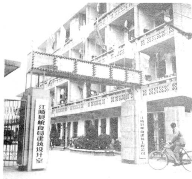
粮食建筑公司办公楼