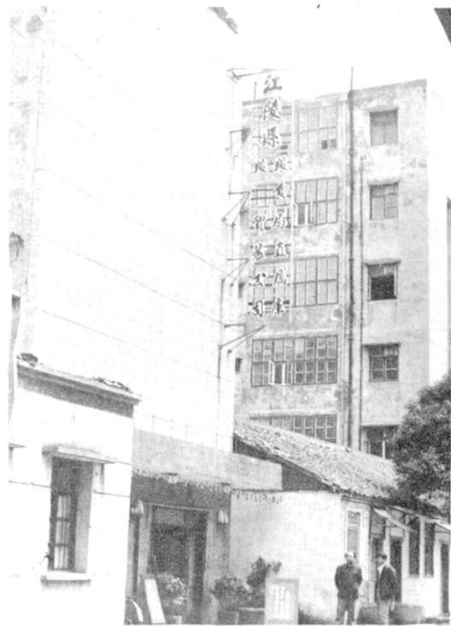
粮油贸易公司办公楼