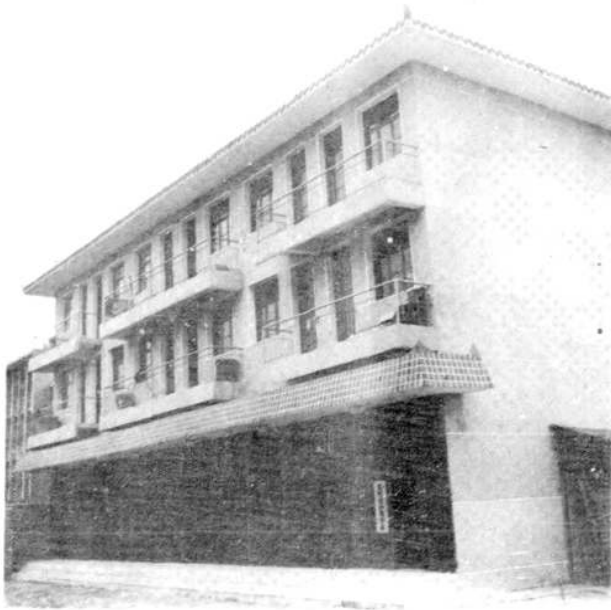
县油脂公司办公楼