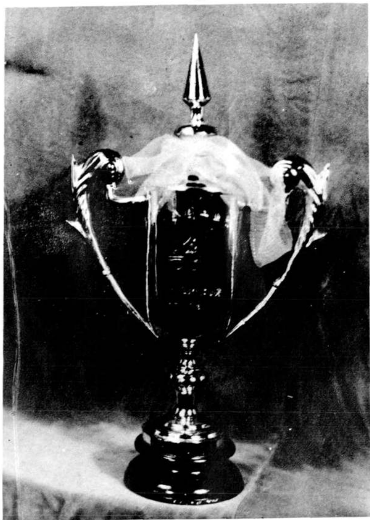
县粮油食品工业公司荣获 1986 年荆 州地区行政公署颁发的第二次全国工业 普查金杯奖