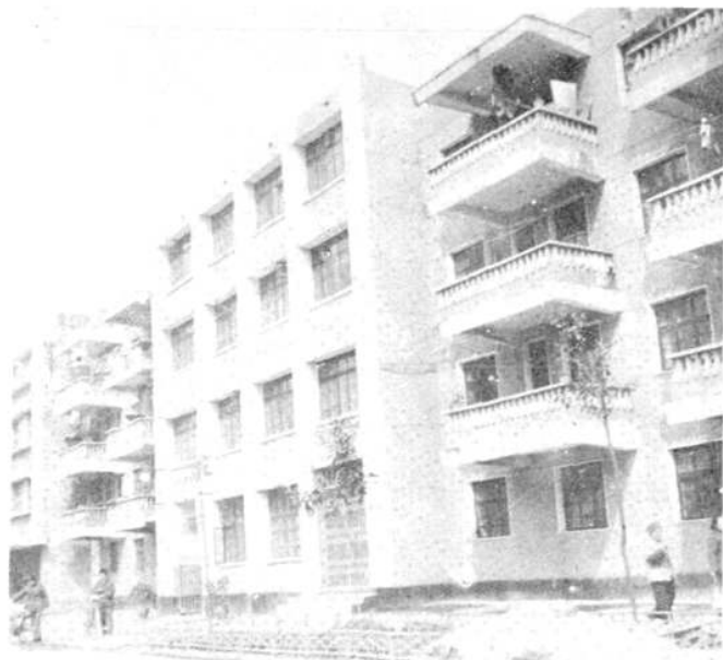
粮食汽车营运公司办公楼