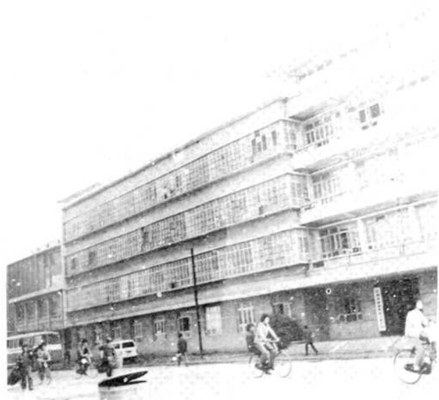
粮油食品工业公司办公大楼