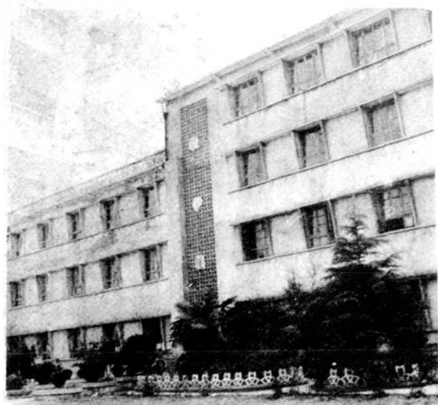
粮食职工学校教学大楼