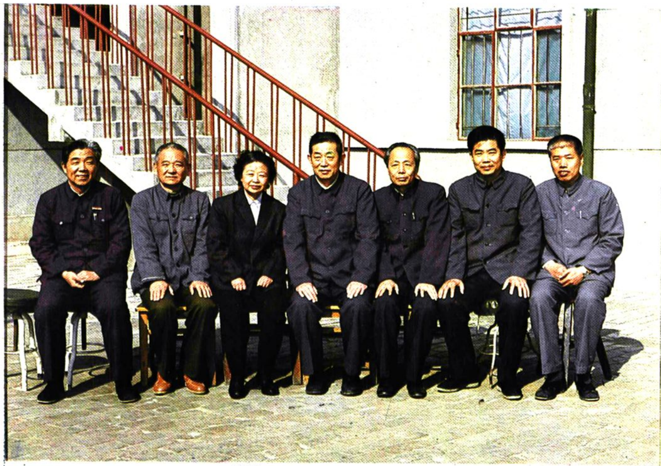
德州地区人民医院 现任领导