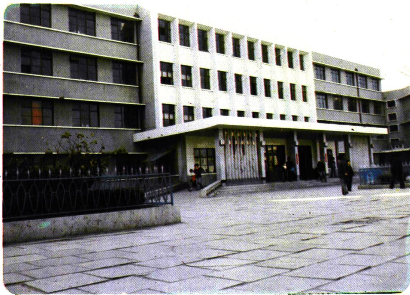
德州地区人民医院门诊楼