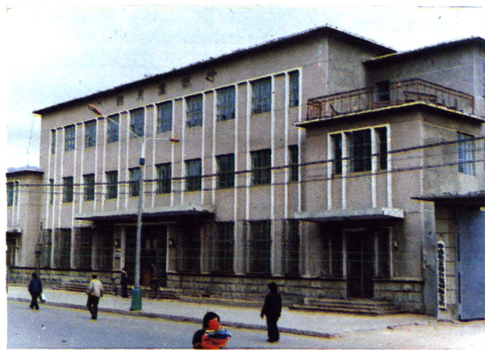
中国农业银行宽甸县支行办公楼地址：宽甸镇中心路 194 号