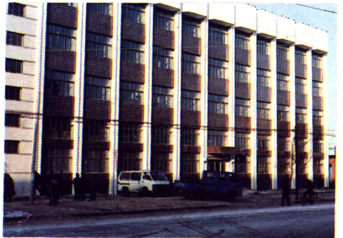
中国农业银行东沟县支行办公楼地址：大东镇黄海路 167 号