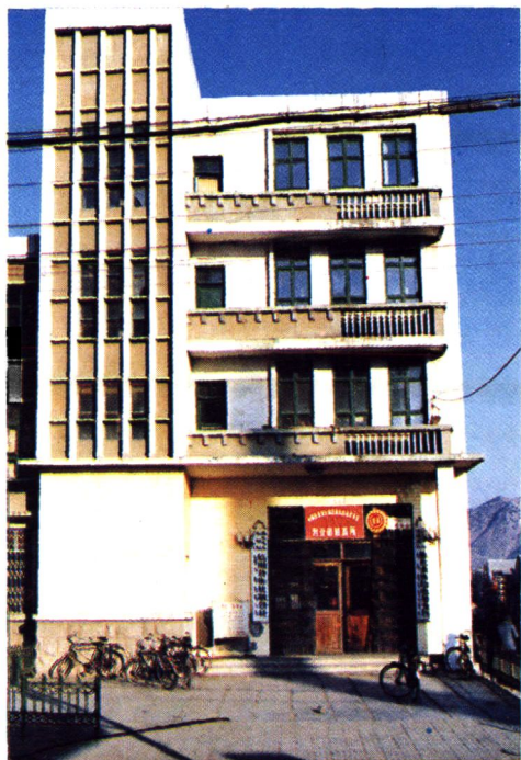
农业银行岫岩县支行办公楼 地址：岫岩镇阜昌路 45 号