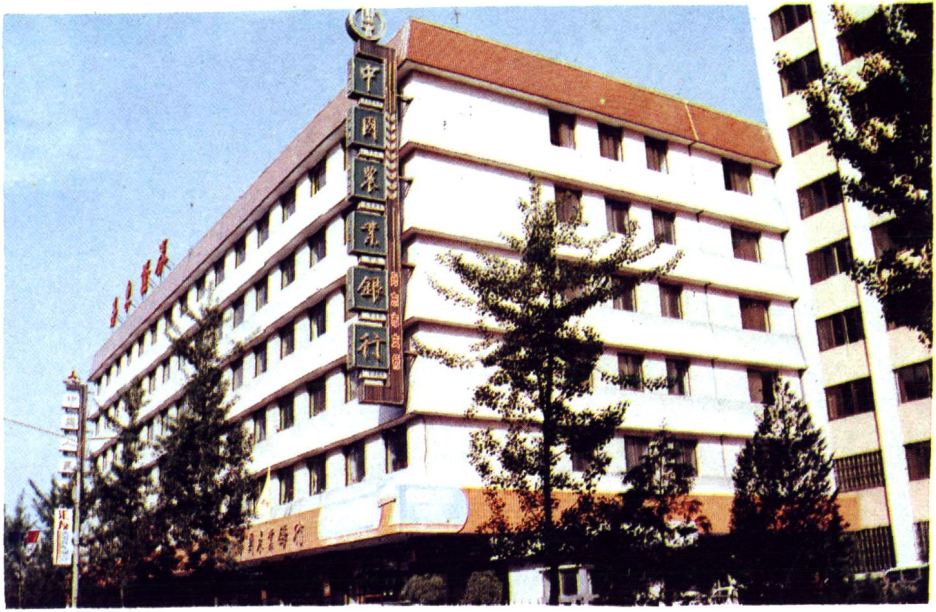
中国农业银行丹东支行办公楼地址：锦山大街 81—2 号