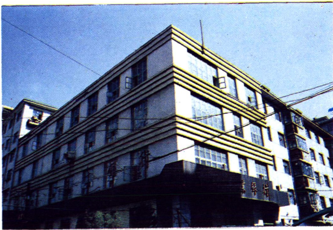
中国农业银行丹东市支行旧办公楼和振安区办事处办公楼 地址：振兴区二经街 84 号