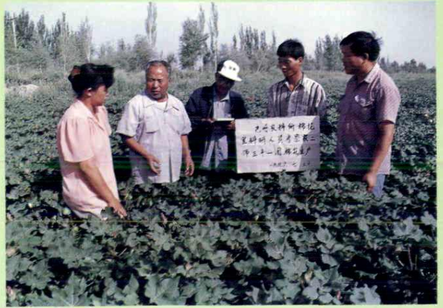
▲ 巴州农科所棉花科研究人员考察三十一团棉花生产