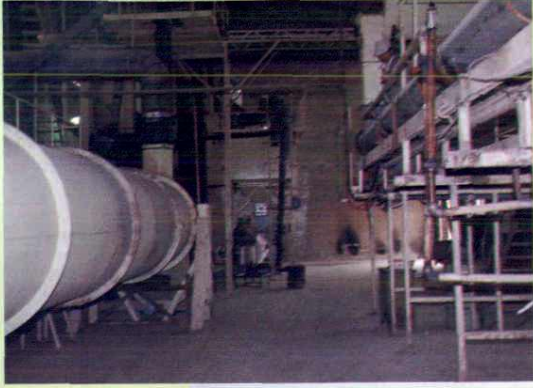
▼ 三十一团棉种加工厂车间一角