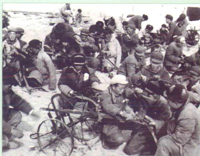
▲ 建场时大搞技术革新,农机人员在检修农具