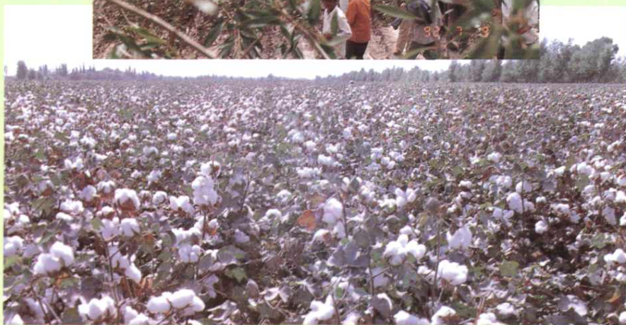
▼ 1984年，棉花丰收，皮棉亩产最高 达150公斤以上