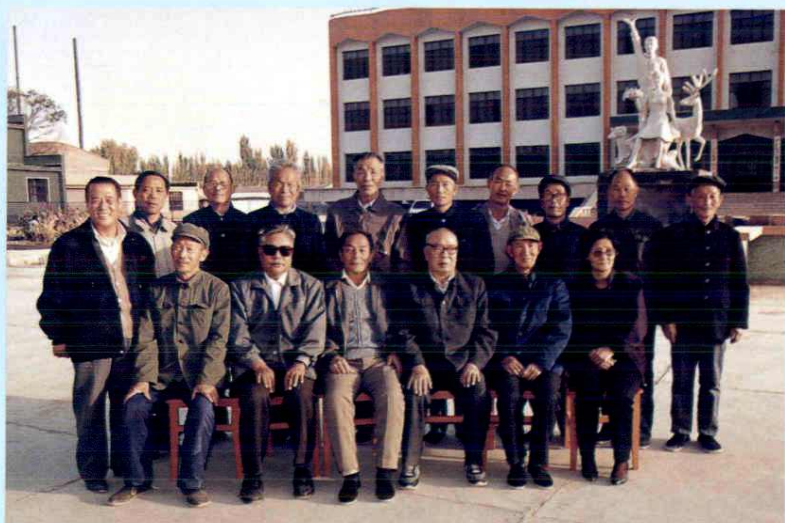
原兵团副司令员谢高忠 和团部分老同志合影