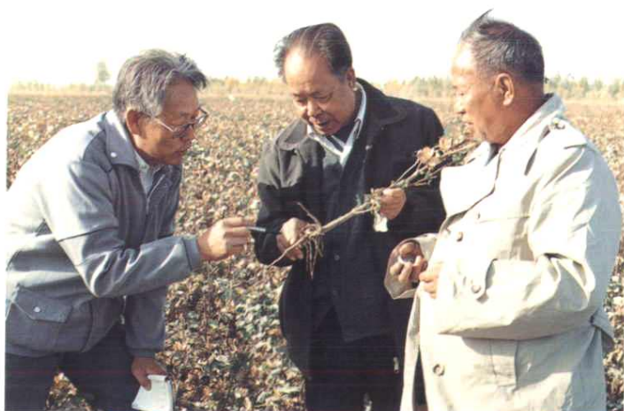
▲ 1990年，农业部在我团六连30-7条田测产