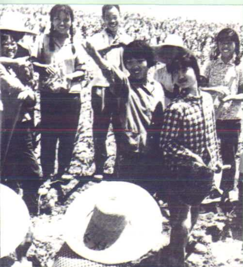
▲ 上海支边青年业余演出队在田间为职工演出