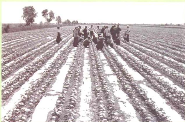
▼ 1982年，全团推广地膜植棉