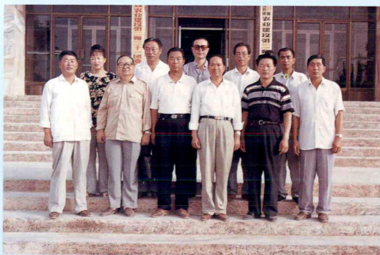
兵团副司令员胡兆璋 和团领导合影