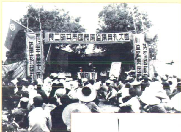
◀ 1958年5月4日,共青团农场典礼大会