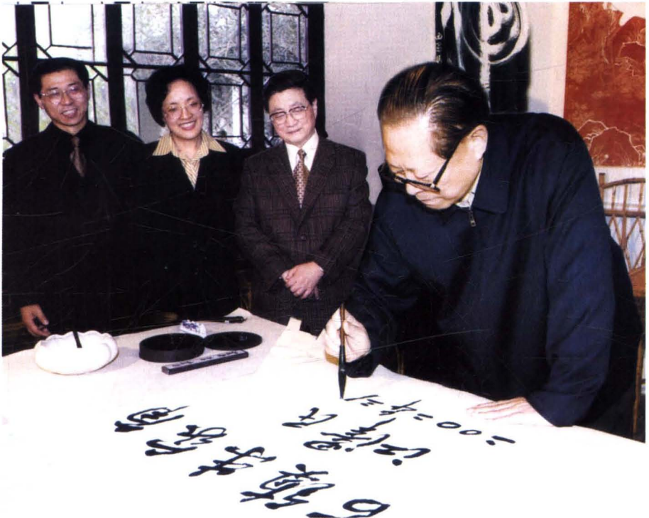
2002年3月19日，中共中央总书记江泽民视察朱家角镇，并题词：“江南古镇朱家角”