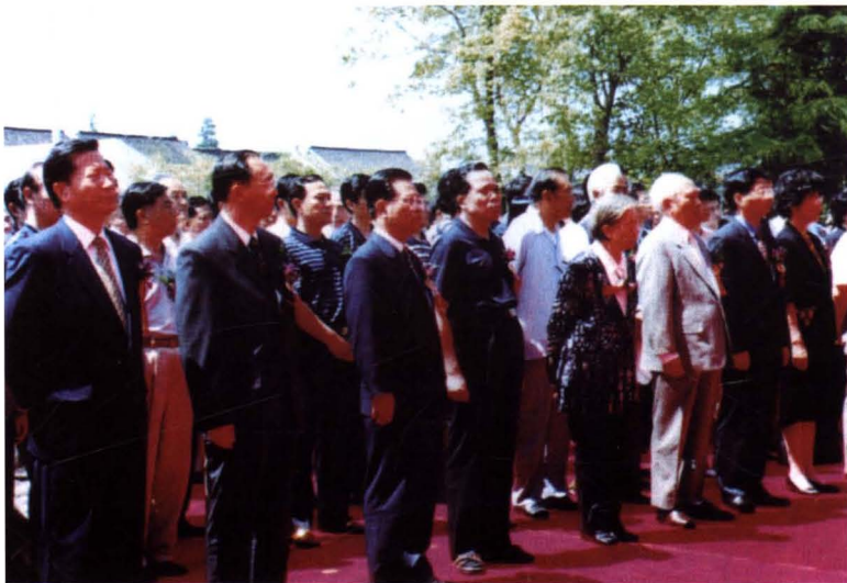
2000年6月6日，陈云故居暨青浦革命历史纪念馆（简称陈云纪念馆）开馆（上）；中央文献研究室及市有关领导，陈云夫人于若木及其子女出席开馆仪式（下）