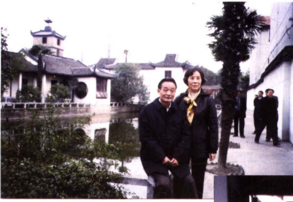
2002年2月16日，中共中央政治局委员、国务院副总理吴邦国到青浦视察，和夫人在朱家角古镇课植园（上），并在课植园推磨（下）