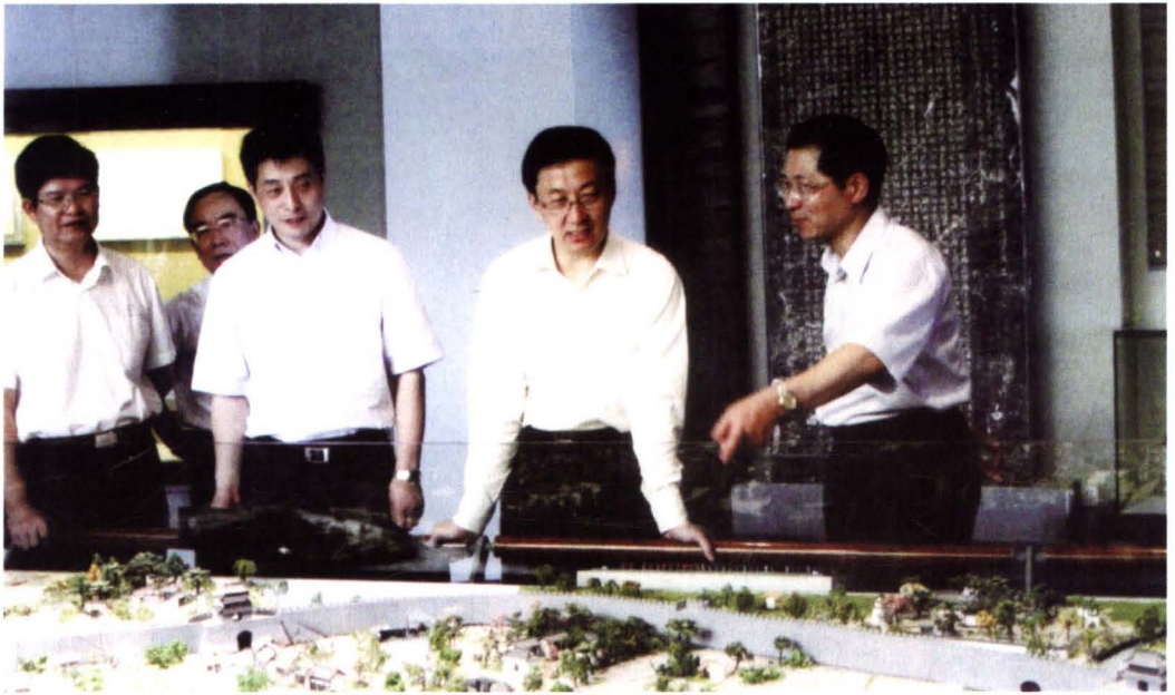
2006年6月21日，中共上海市委副书记、市长韩正（右二）在中共青浦区委书记巢卫林（右一），区委副书记、区长蒋耀（右三）等陪同下视察青浦博物馆