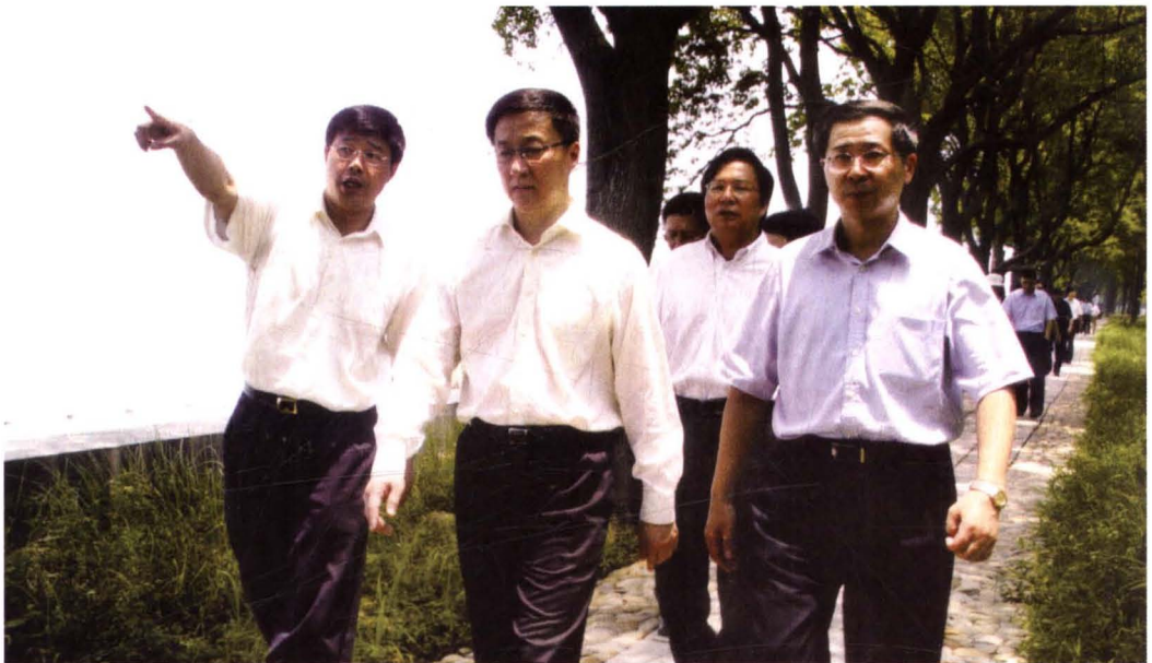
2006年6月21日，中共上海市委副书记、市长韩正（中）在中共青浦区委书记巢卫林（右），区委常委、副区长张汪耀（左）等陪同下视察环淀山湖生态带