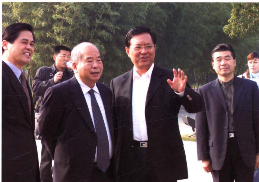
2005年11月28日，尉健行（前排中）到陈云纪念馆参观