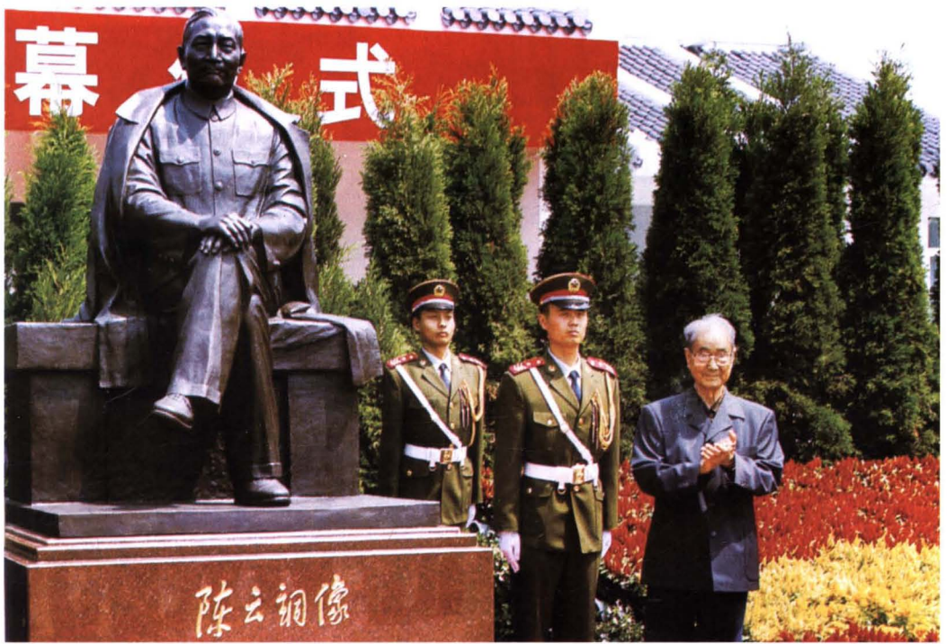
2005年6月8日，宋平为陈云纪念馆陈云铜像揭幕