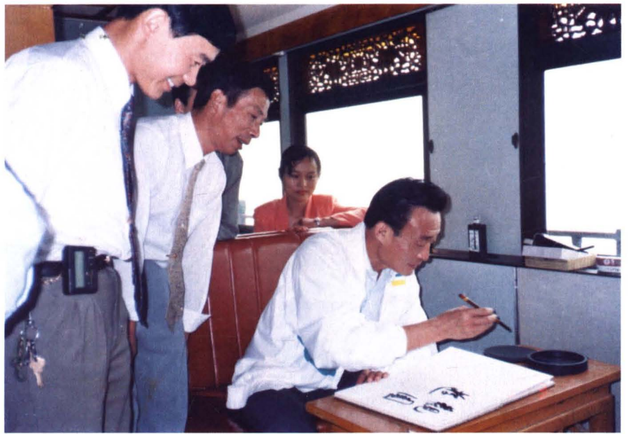
1994年10月3日，中共中央政治局委员、国务院副总理吴邦国到上海大观园参观并题词