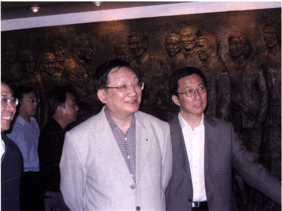
2006年6月1日，国务委员唐家璇到陈云纪念馆参观