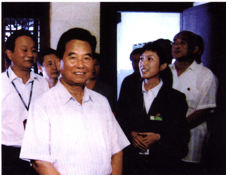
2005年7月5日，中共中央政治局常委、中央纪委书记吴官正视察陈云纪念馆