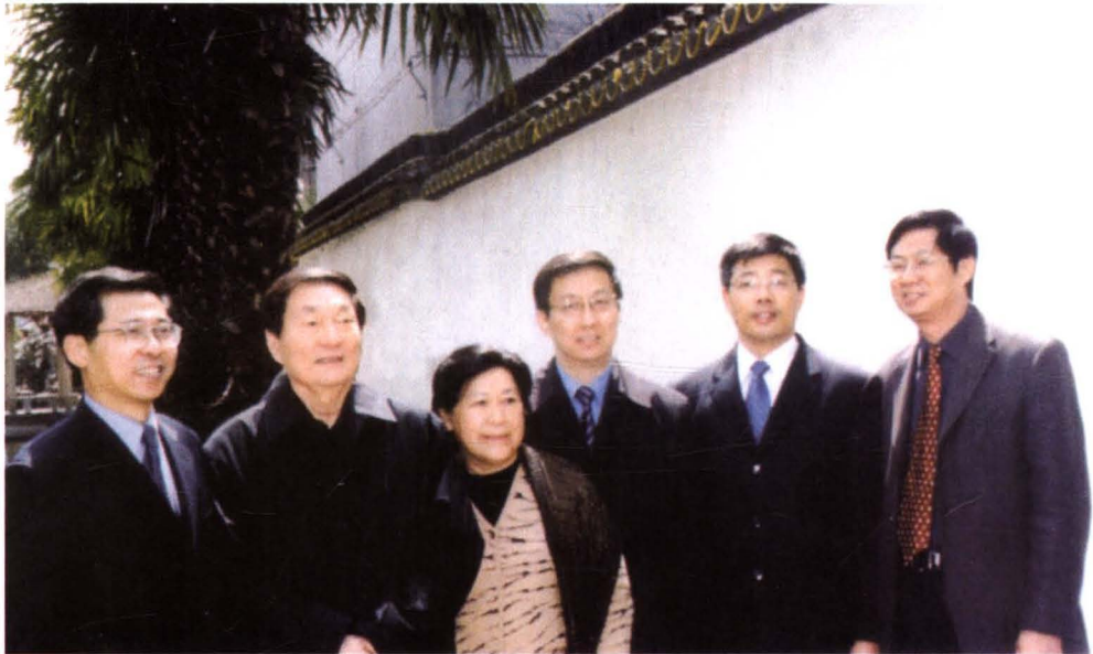
2004年3月30日，原国务院总理朱镕基（左二）与夫人劳安（左三）视察古镇朱家角，上海市市长韩正（右三）、中共青浦区委书记巢卫林（左一）等陪同视察