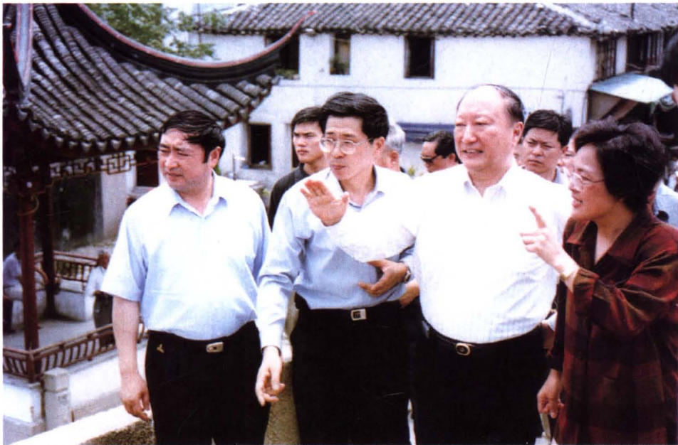
2000年5月24日，上海市市长徐匡迪（前排右二）在朱家角古镇视察