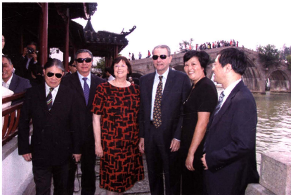
2009年10月，国际奥委会主席罗格（右三）等人参观朱家角古镇