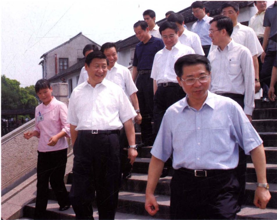
2007年7月11日，中共上海市委书记习近平（前排右二）到青浦调研，在朱家角古镇视察