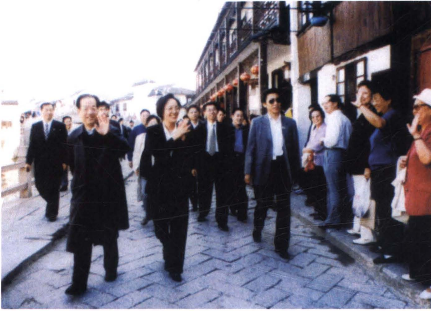
2001年10月17日，国务院副总理钱其琛（前排左一） 视察古镇朱家角，中共青浦区委书记钟燕群（前排左二） 陪同视察