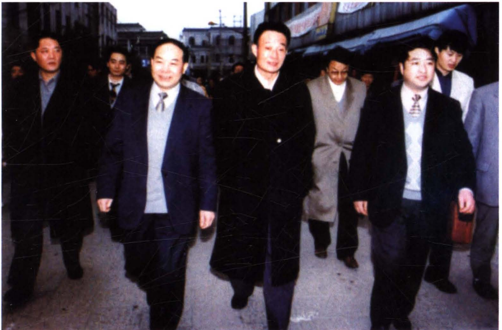
1997年2月15日，中共中央政治局委员、国务院副总理吴邦国（前排中）视察古镇朱家角，中共青浦县委书记李金生（前排左一）等陪同视察