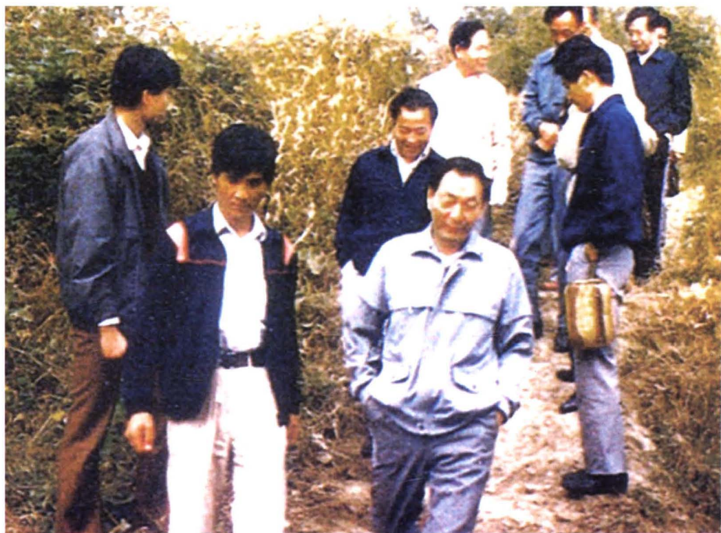
1988年10月13日，上海市市长朱镕基和相关领导视察福泉山古文化遗址