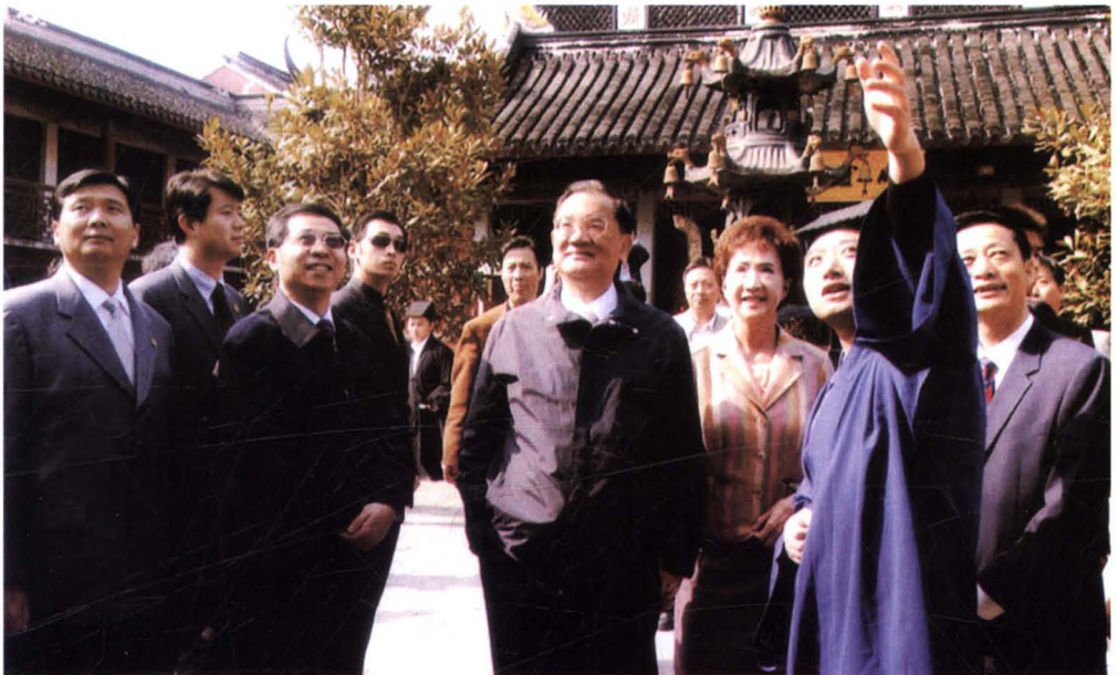
2005年10月22日，中国国民党名誉主席连战（中）和夫人一行游览古镇朱家角城隍庙