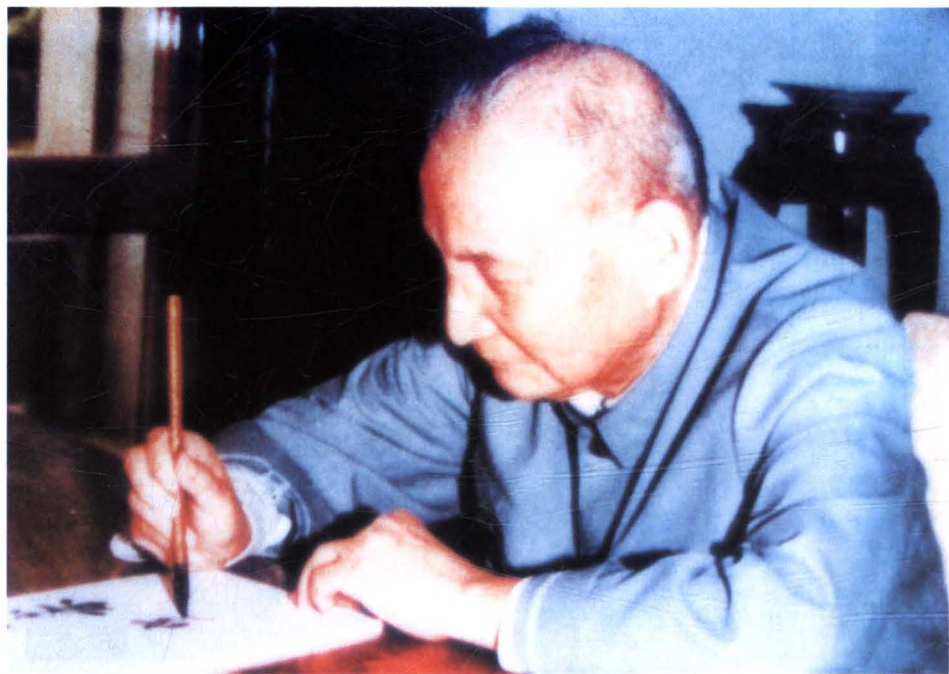
1984年8月，中共中央政治局常委陈云为青浦博物馆题写馆名