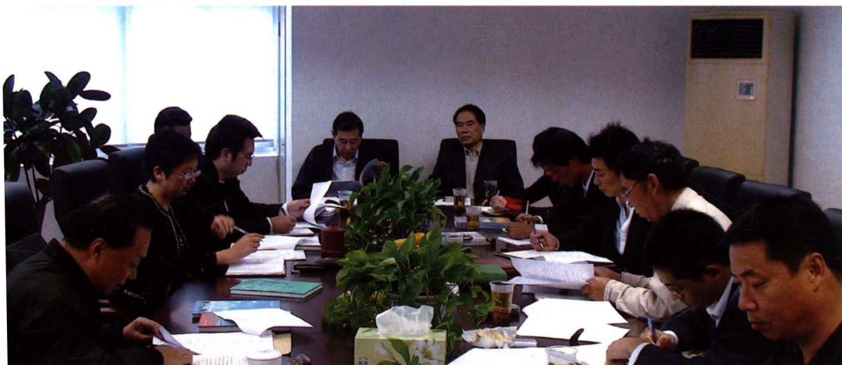
2008年10月30日《青浦旅游志》编纂委员会第一次会议