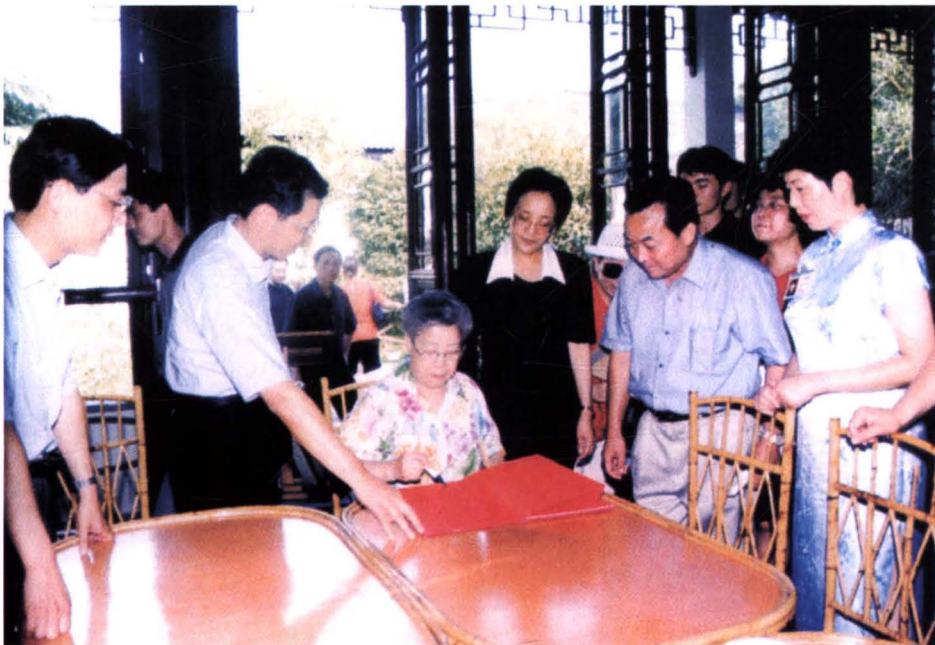
2001年8月15日，国务委员吴仪（左三）视察古镇朱家角， 中共青浦区委书记钟燕群（左四）、青浦区区长巢卫林 （左二）、青浦区副区长彭沉雷（左一）陪同视察