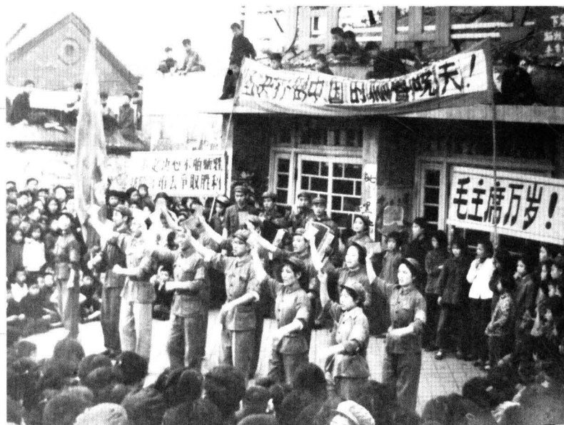
唐院“排除万难宣传队”在唐山站 宣传“文革”(1966年)