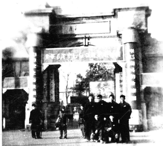
“文革”时期唐山学校大门