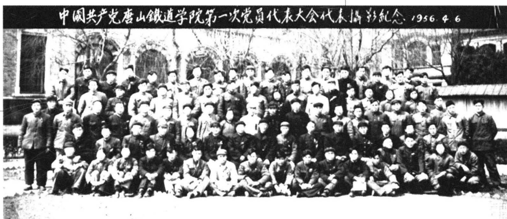
唐院第一次党代会代表合影