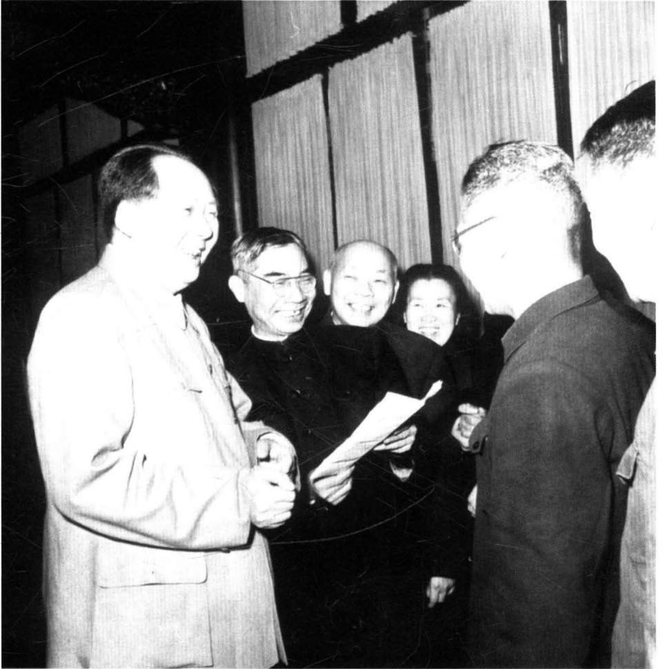
毛泽东主席接见茅以升校长并为我校题写校名(1950年)