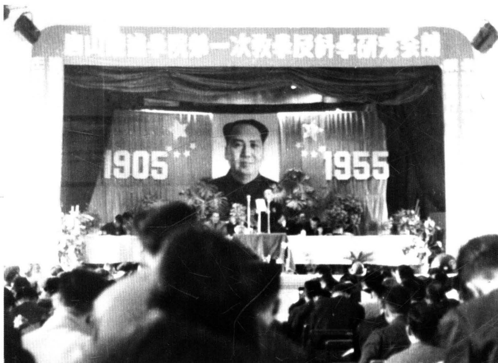
唐院第一次教學、科學研究會議會場（1955年）