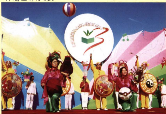
各地通过各种文艺形式宣传人口和计划生育政策,传播科学、文明的婚育观念。图为滨湖区举办的第三届特色家庭文化节。