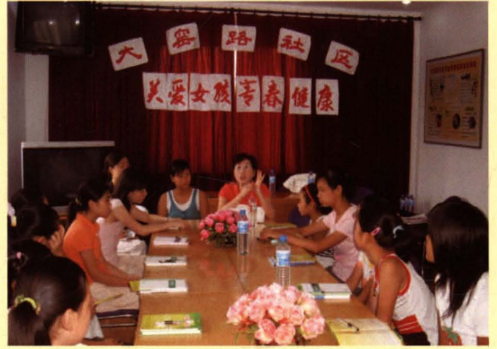
图为南长区大窑路社区举行“关爱女孩青春健康”知识讲座。