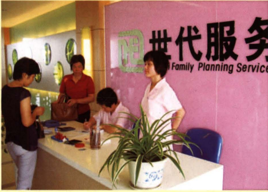
无锡市开展人口和计划生育服务阵地“世代服务”品牌建设。图为惠山区计划生育指导站一角。