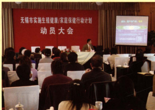
2006年12月28日，市人口计生委召开无锡市实施生殖健康/家庭保健行动计划动员大会。