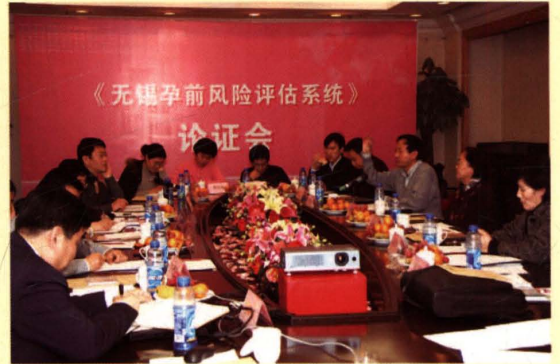
2009年1月17日，由无锡市人口计生委与北京九喜生育健康医学研究院合作开发的《无锡孕前风险评估系统》论证会在北京举行。