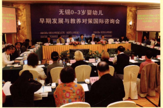
2011年9月30日，由国家人口计生委人事司、江苏省人口计生委主办，无锡市人口计生委承办的“无锡0~3岁婴幼儿早期发展与教养对策国际咨询会”在无锡召开。