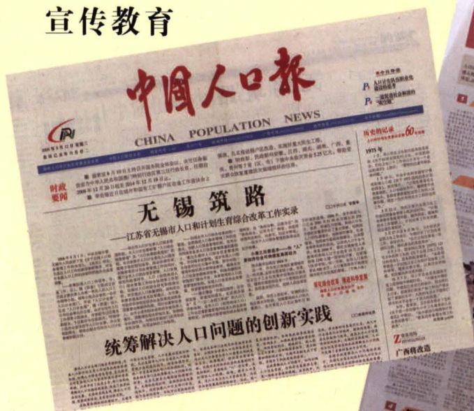
2009年8月12日,《中国人口报》专题报道无锡创新人口服务管理体制工作。