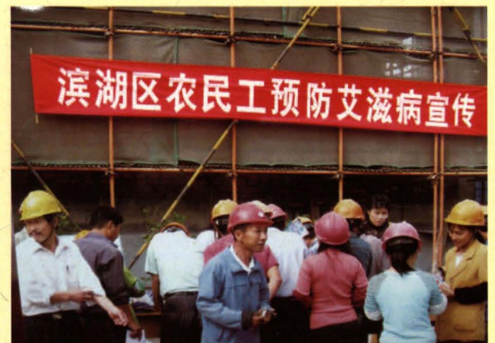
2004年5月，滨湖区被中国计生协定为全国首批“预防艾滋病知识宣传”项目点。图为滨湖区人口计生部门工作人员走进工地开展农民工预防艾滋病宣传。