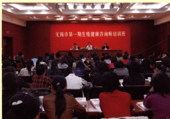
2009年4月19~30日，无锡市人口计生委举办第一期生殖健康咨询师培训班。