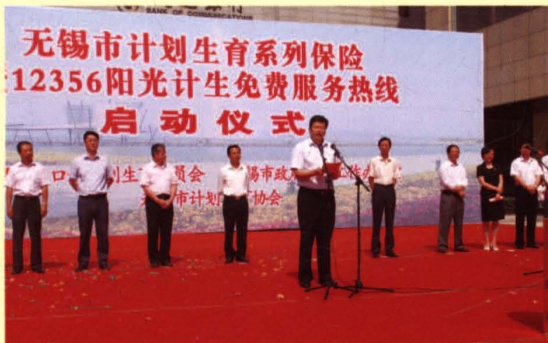
2009年5月27日，无锡市人口计生委、市金融办、市计生协联合举行计划生育系列保险暨12356阳光计生免费服务热线启动仪式。