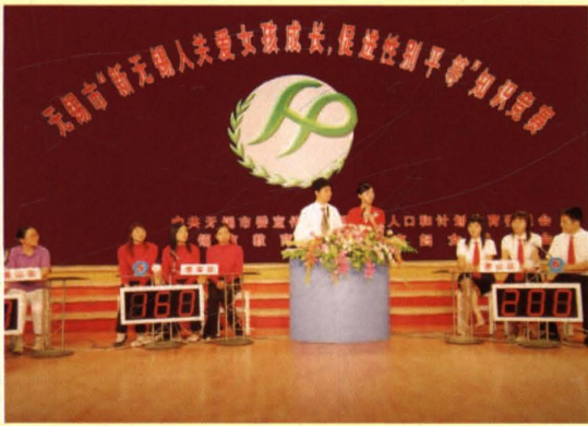
2006年9月，中共无锡市委宣传部、市人口计生委、市教育局、市妇联联合举行“新无锡人关爱女孩成长，促进性别平等”知识竞赛。