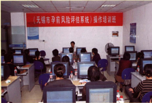
无锡市人口计生委为在全市推广孕前风险评估系统，及时举办操作培训班。