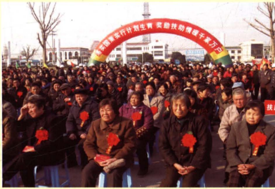
2005年8月，无锡市农村计划生育家庭扶助制度开始实施，图为该年12月8日锡山区奖励扶助金首发式现场。