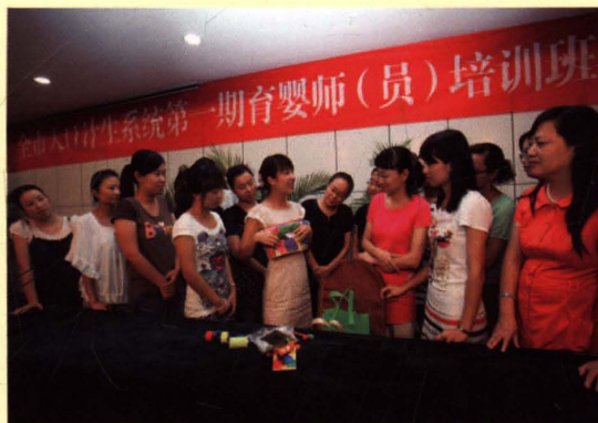
2011年9月3日，无锡市人口计生系统第一期育婴师培训班结业。