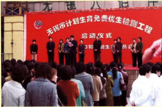
2005年3月17日，无锡市人口计生部门举行计划生育免费优生检测工作启动仪式。