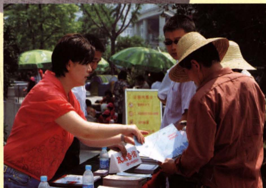
各地利用节、假日和各种纪念日,开展人口和计划生育政策宣传咨询活动。图为市人口计生部门在市民广场组织宣传咨询活动。