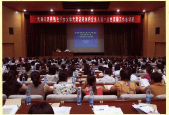
2008年8月18日，为做好无锡市区持独生子女父母光荣证退休的企业人员一次性奖励工作，市人口计生委举办奖励工作培训班。