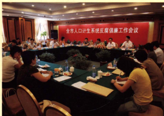
2008年7月8日，无锡市人口计生委召开全市人口计生系统反腐倡廉工作会议。