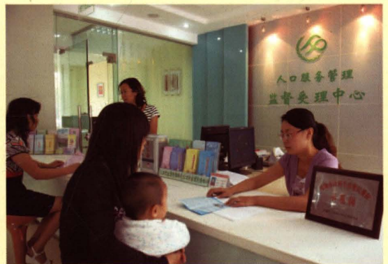
2007年下半年起，无锡市人口计生系统广泛开展便民维权示范岗创建活动。图为锡山区人口服务管理监督受理中心一角。