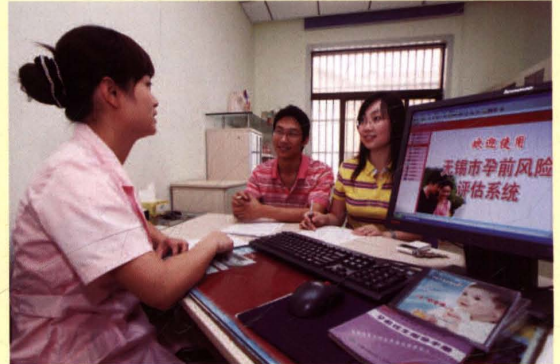
图为锡山区锡北镇社区利用孕前风险评估系统为新婚夫妇免费进行孕前风险评估。