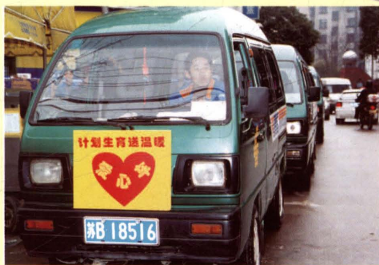
2004年9月24日,无锡市计生委、市财政局出台《无锡市计划生育公益金管理暂行办法》。图为市计生部门通过内设爱心车将公益金送到计划生育家庭。