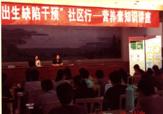
图为滨湖区某社区举办营养素知识讲座。