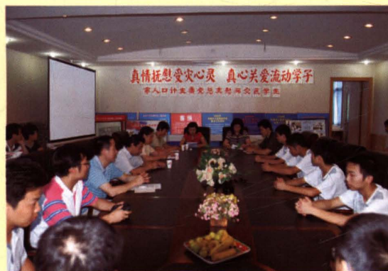
2008年6月20日，无锡市人口计生委机关党总支走进无锡市交通高等职业技术学院，慰问来自汶川地震灾区的学生。