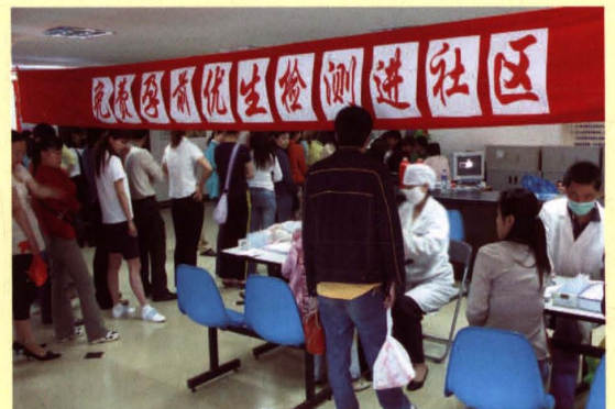
2006年5月19日，市计划生育技术服务机构走进新区旺庄街道开展免费孕前优生检测。