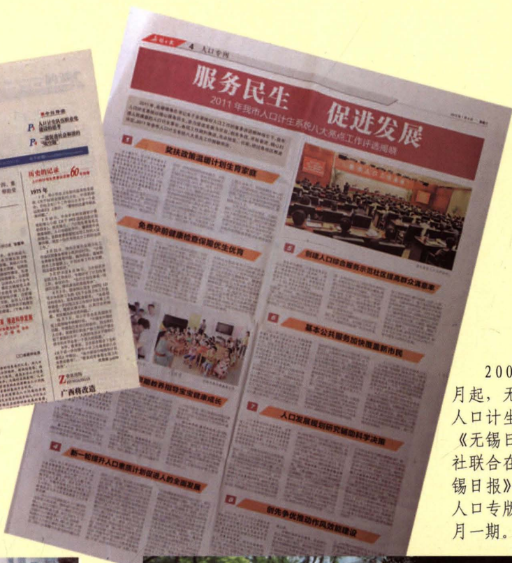
2009年6月起,无锡市人口计生委与《无锡日报》社联合在《无锡日报》开辟人口专版,每月一期。