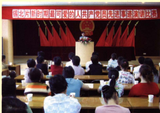
图为20世纪90年代初，锡山市人口计生系统举行“新时期最可爱的人”先进事迹演讲比赛。