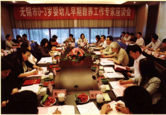
2011年5月21日，无锡市人口计生委召开0~3岁婴幼儿早期教养工作专家座谈会。