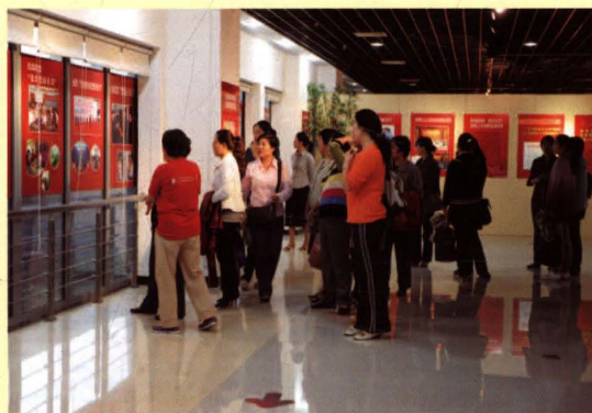
2010年9月21日,无锡市人口计生部门举办纪念中共中央《公开信》发表三十周年成果展。