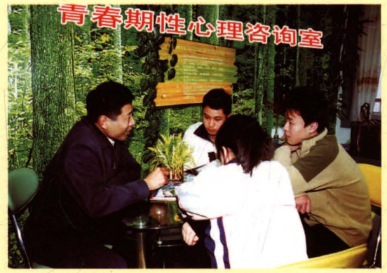
2007年10月8日，无锡市人口计生委、市教育局、市人保局联合发出《关于在全市初中以上学校开展争创青春期教育合格学校活动的意见》。图为宜兴市某中学对学生进行青春期性心理疏导。