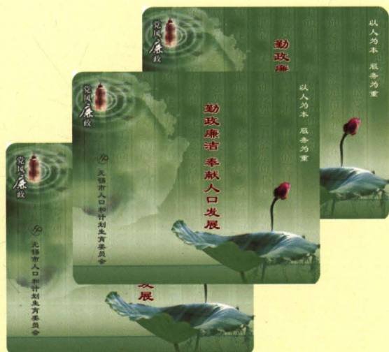
2008年10月，无锡市人口计生委被评为无锡市廉政文化建设示范点。图为市人口计生委制作的部分廉政文化宣传品（鼠标垫）。