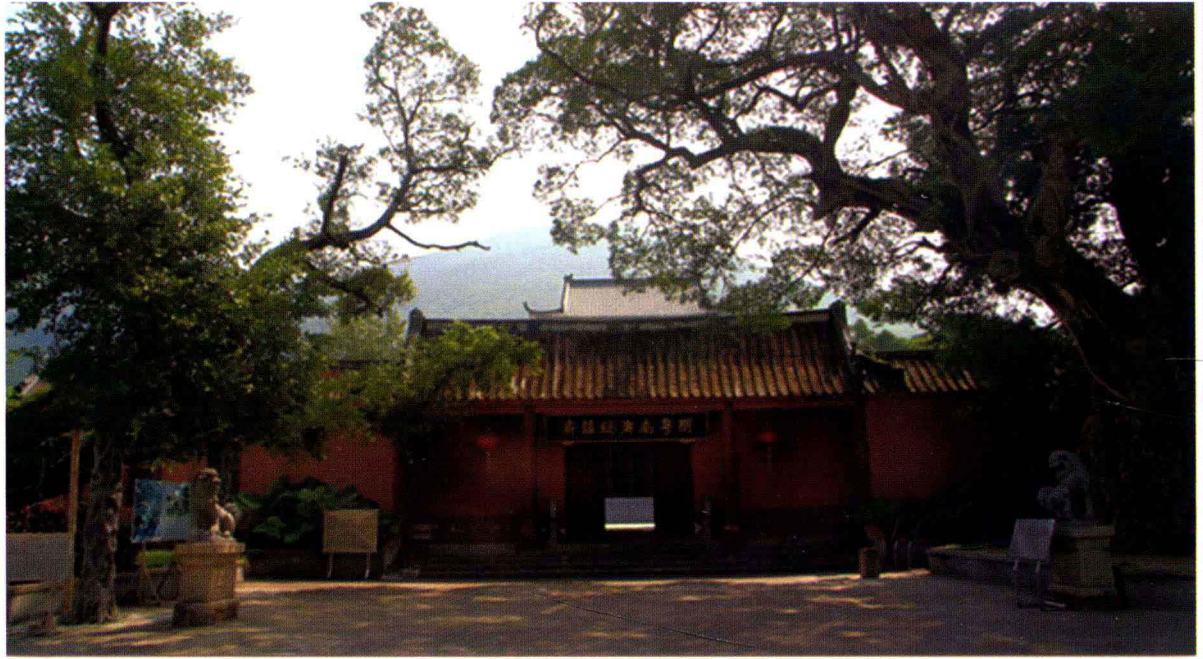
南澳岛郑成功总兵府