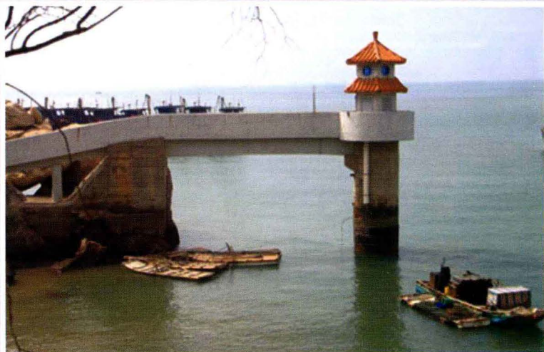
南澳海洋环境监测站 云澳验潮井 (2010年摄)