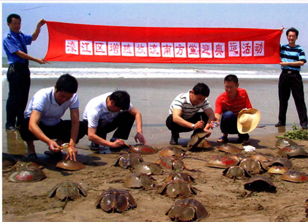
濠江区海洋与渔业局在达濠岛增殖放流南方鲎