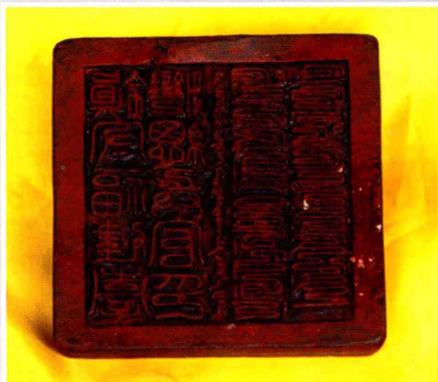
郑成功总兵印 (南澳县海防史博物馆2008年供)