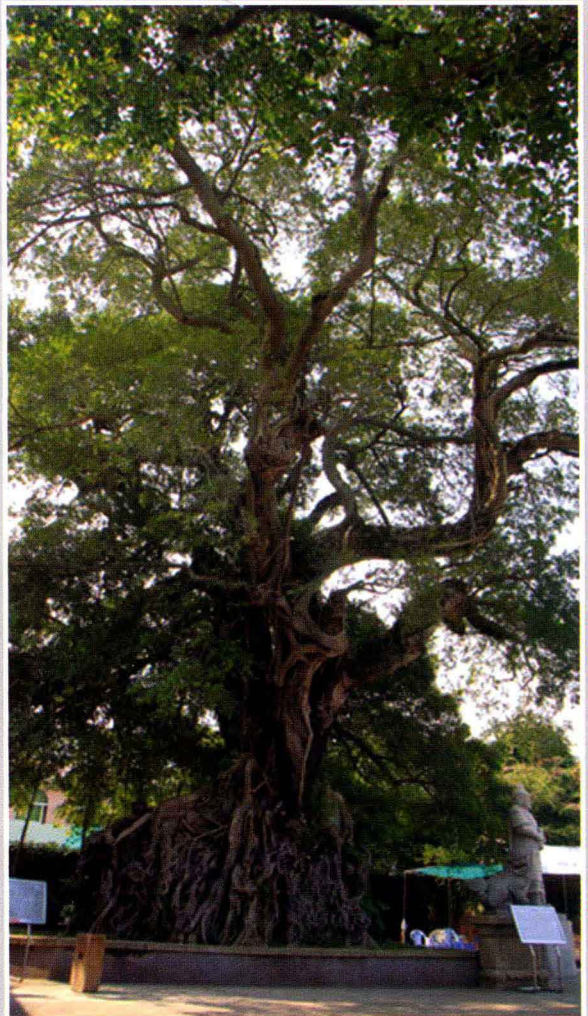
南澳岛郑成功招兵树