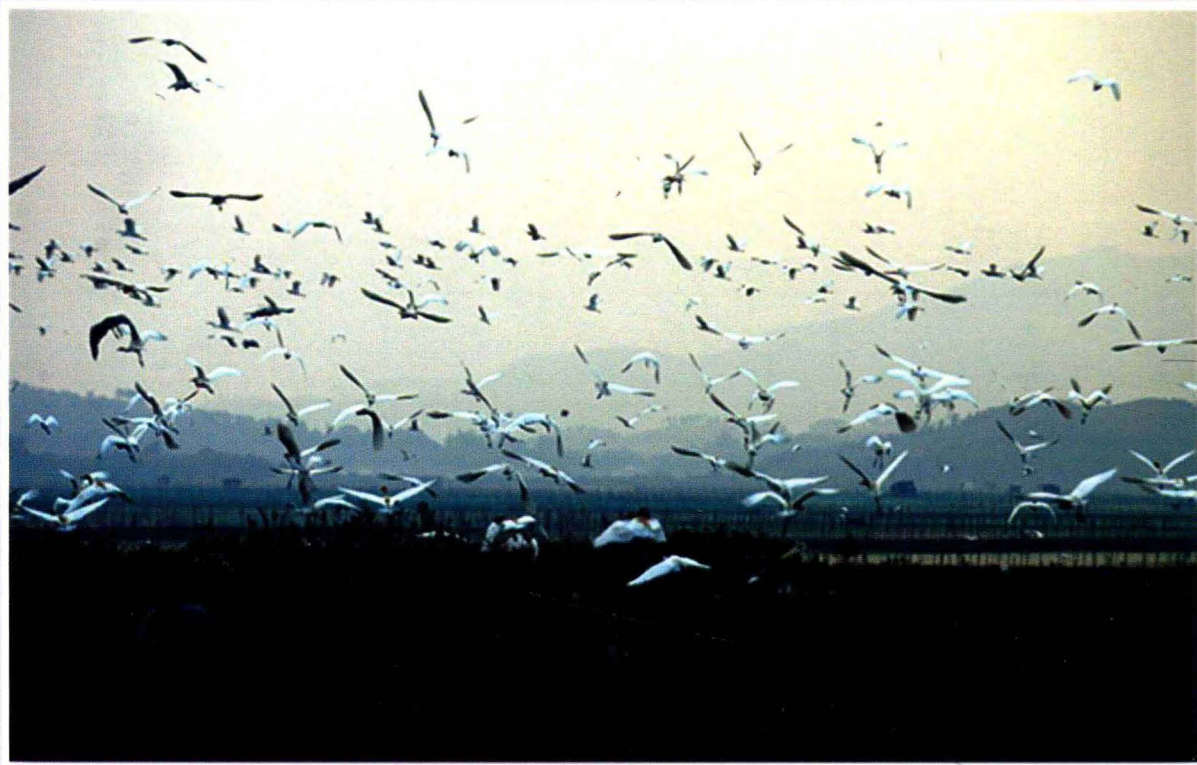
惠州市惠东县盐洲红树林保护区的白鹭