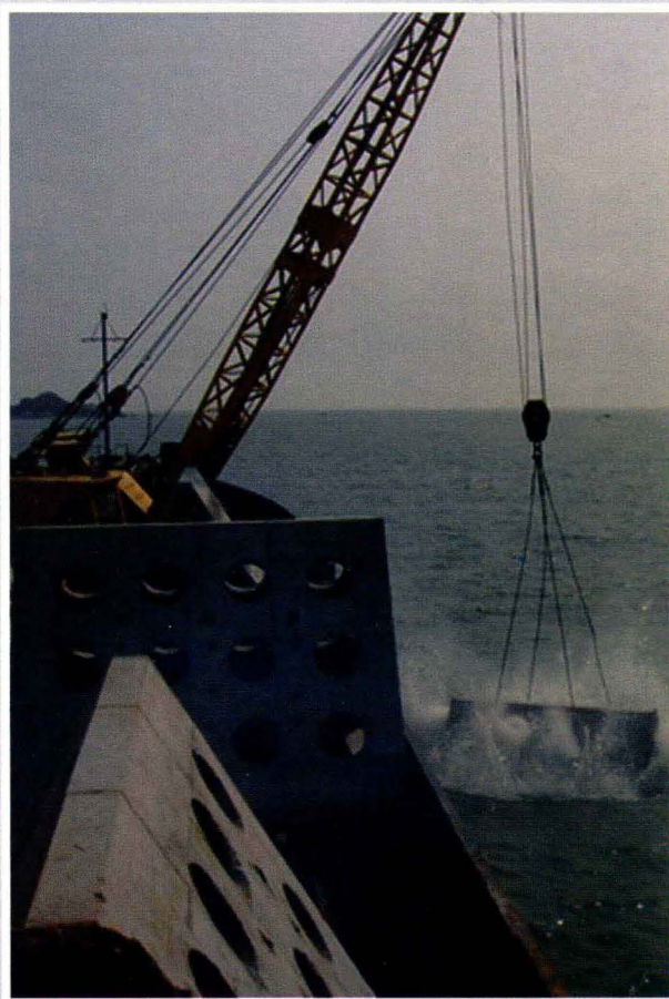
达濠岛海域施放人工鱼礁现场