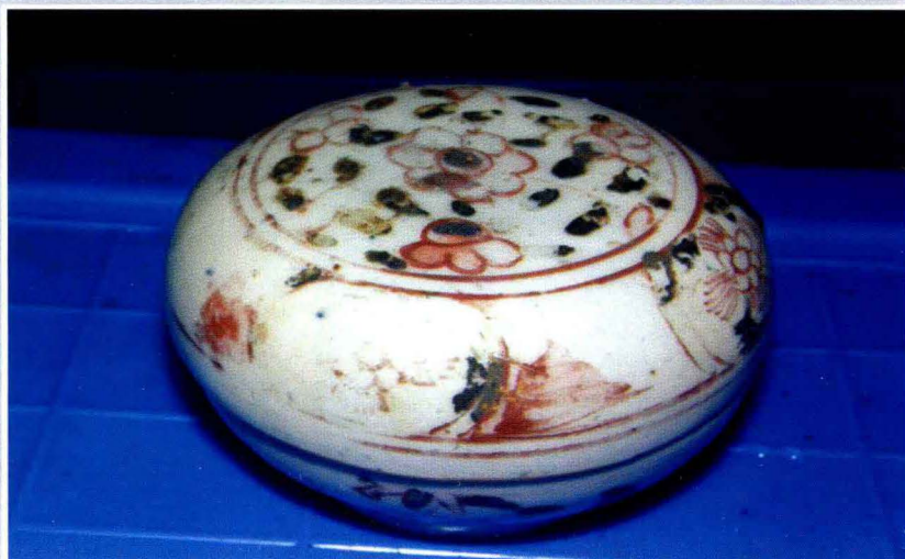
“南澳一号”打捞出水的彩瓷 (南澳县海防史博物馆2010年供)