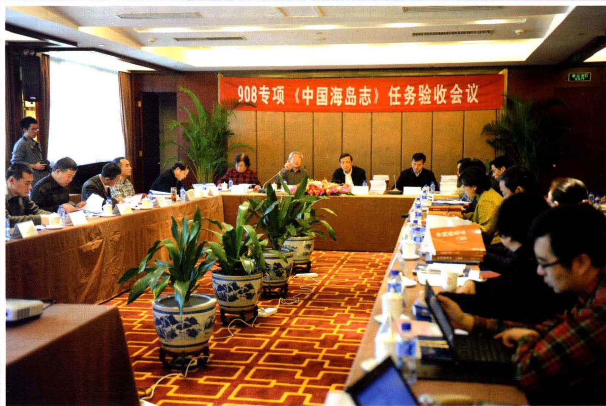
《中国海岛志》验收会议现场