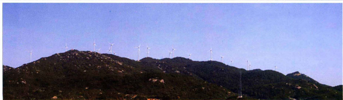
南澳岛风能发电场 (2010年摄)