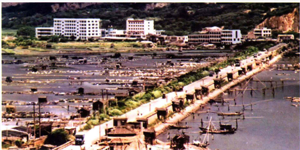
连接海山岛的三百门拦海大堤