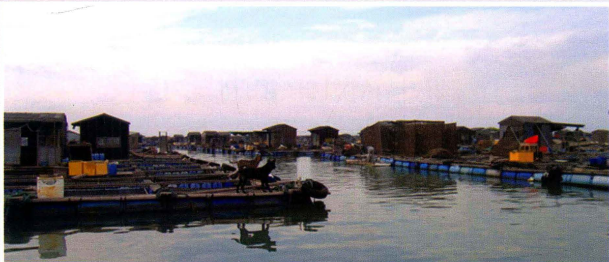
海山岛至汛洲岛海域网箱养殖基地（2008年摄）