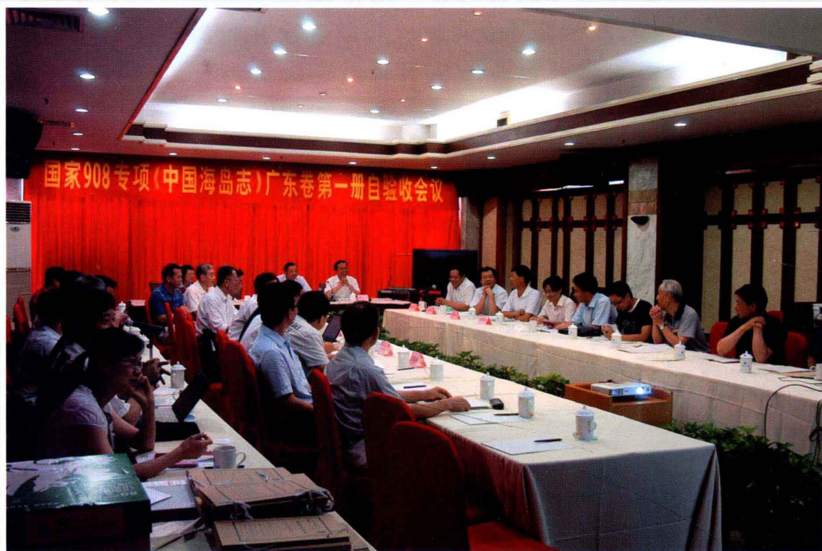
《中国海岛志》广东卷第一册自验收会议 (2011年6月摄)