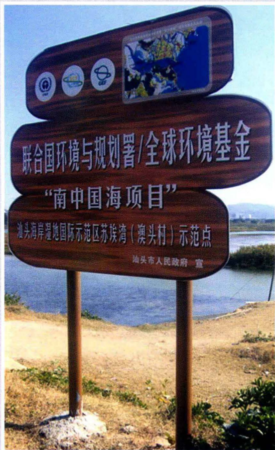
汕头海岸湿地国际示范区达濠岛苏埃湾示范点 (2009年摄)