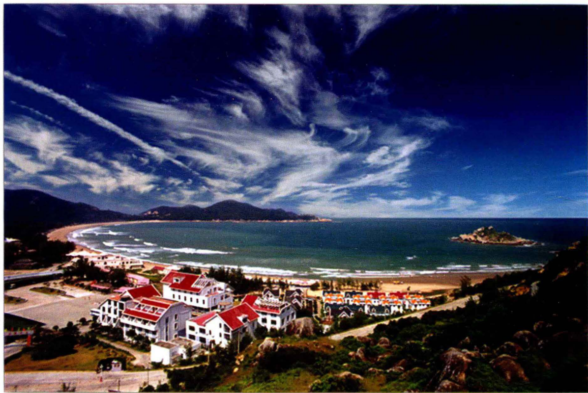
南澳岛青澳湾