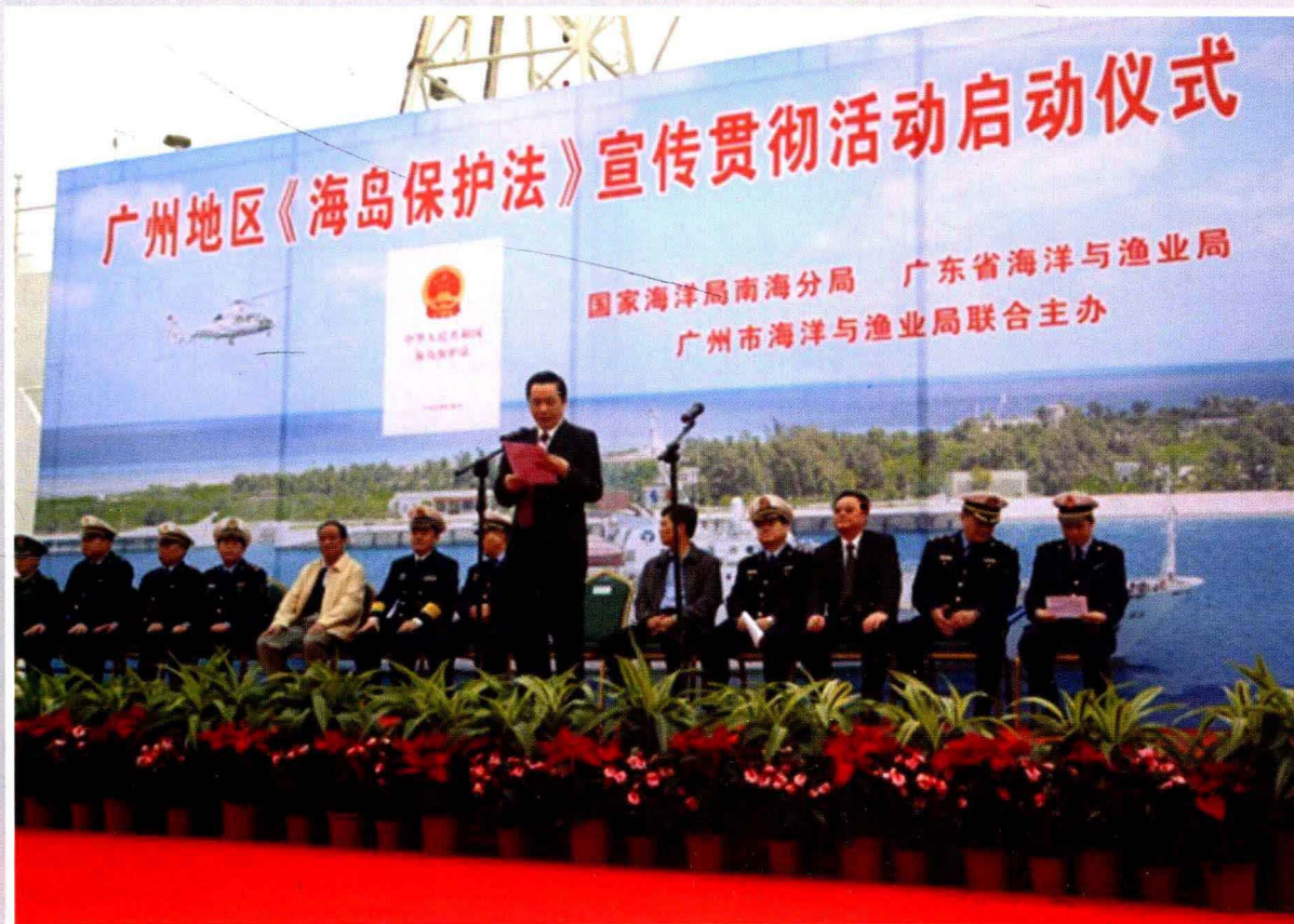
2010年3月1日广州地区《中华人民共和国海岛保护法》宣传活动