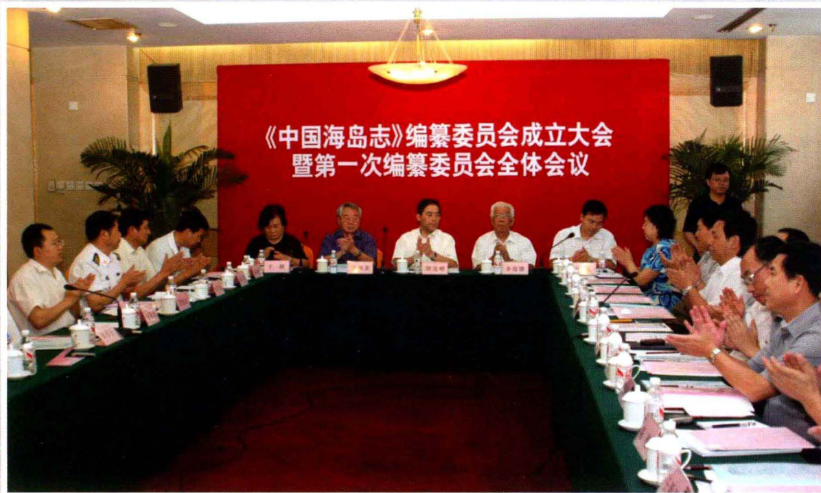
《中国海岛志》编纂委员会成立大会会议现场