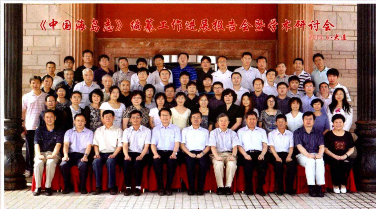
《中国海岛志》编纂工作进展报告会暨学术研讨会与会人员