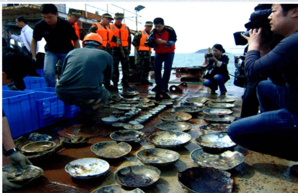
明代古沉船“南澳一号”出水文物 (南澳县海防史博物馆2010年供)