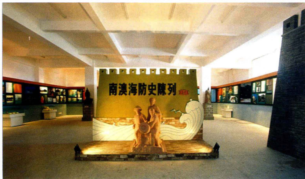
南澳海防史陈列