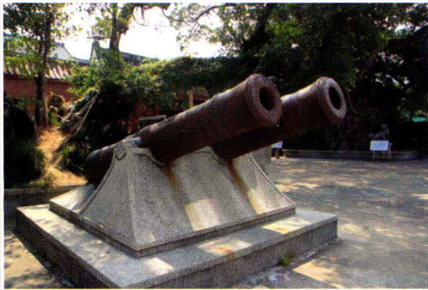
南澳岛总兵府门前大炮