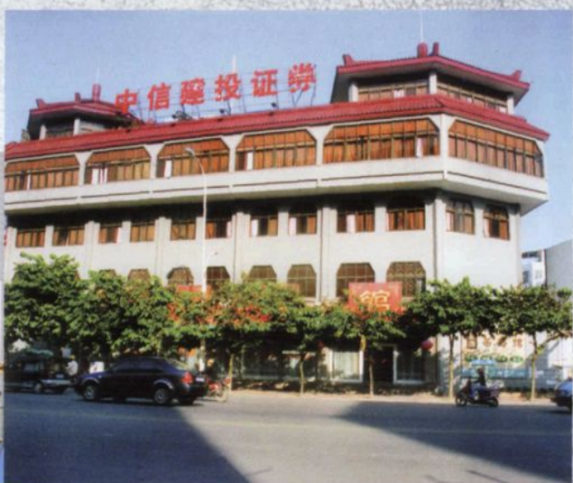
中信建投证券有限责任公司 潮州市潮枫路证券营业部