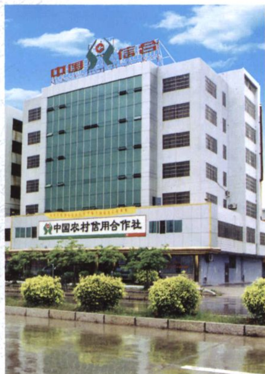
潮安县农村信用合作社联社