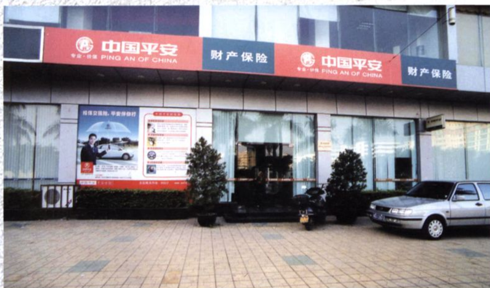
中国平安财产保险股份有限公司潮州中心支公司