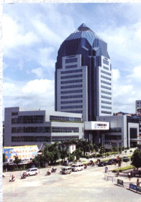
中国建设银行潮州市分行