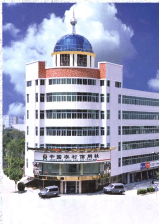
饶平县农村信用合作社联社