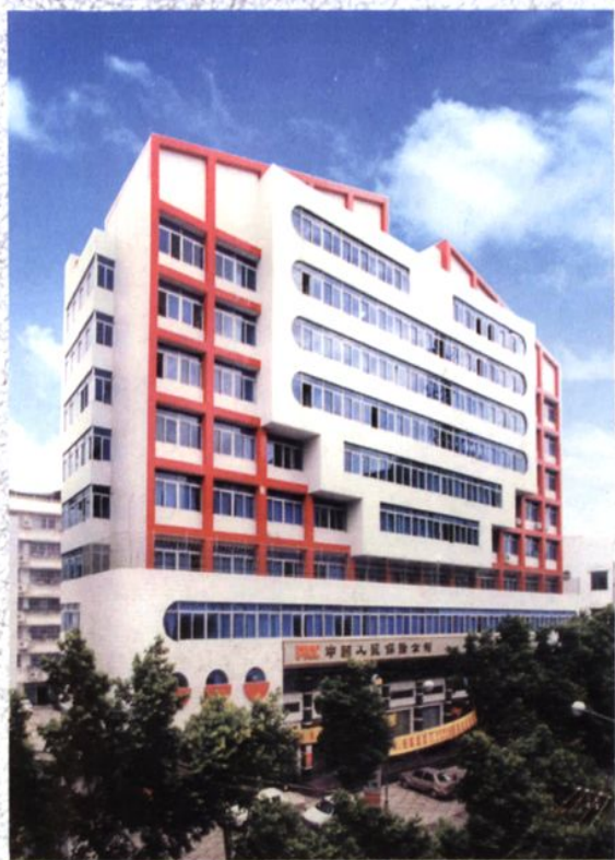
中国人民财产保险股份有限公司潮州市分公司