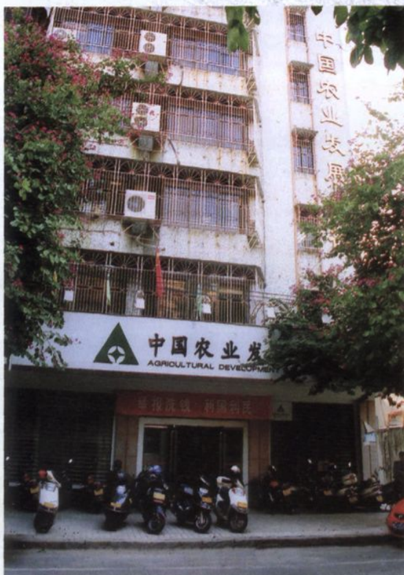
中国农业发展银行潮州市分行