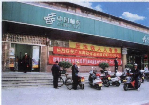
中国邮政潮州储汇分局