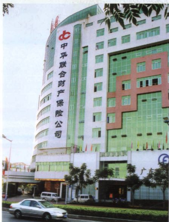
中华联合财产保险公司潮州中心支公司