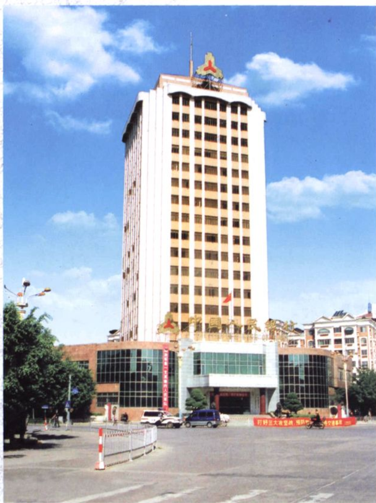
中国人民银行潮州市 中心支行