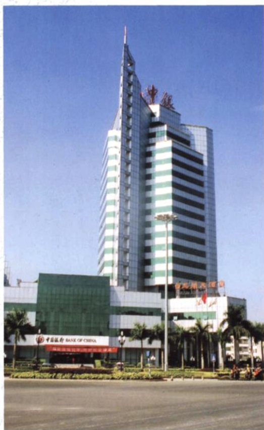
中国银行潮州分行