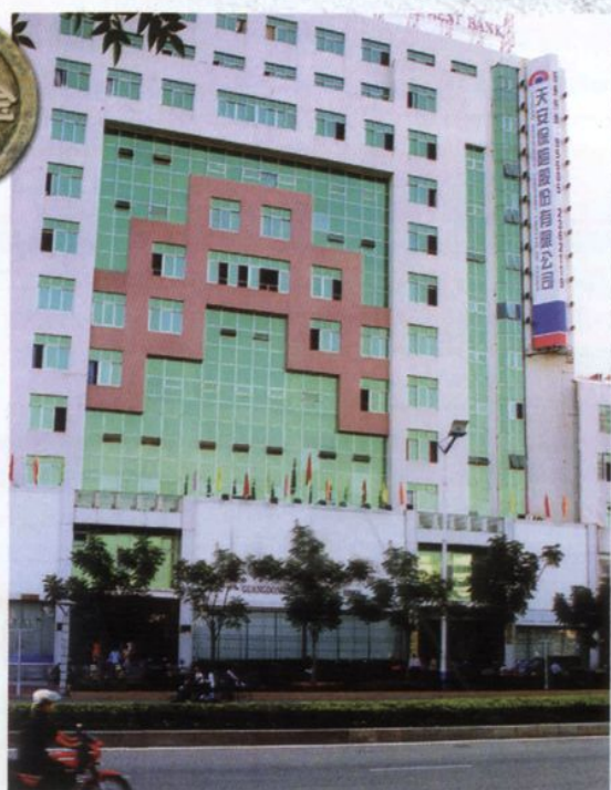
天安保险股份有限公司潮州中心支公司