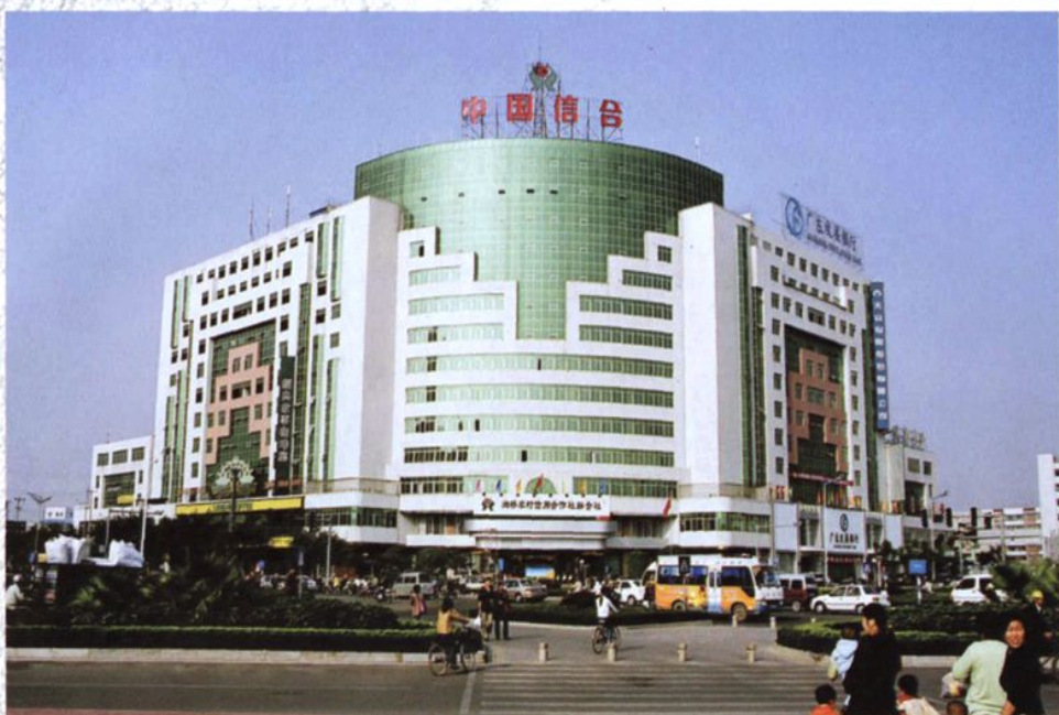
潮州市湘桥区农村信用合作社联社