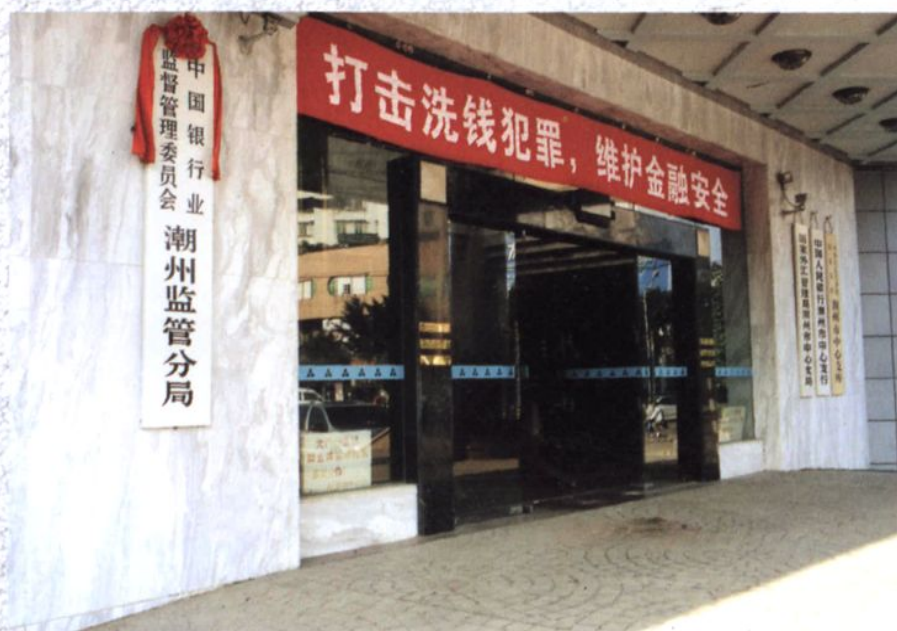
中国银行业监督管理委员会潮州监管分局