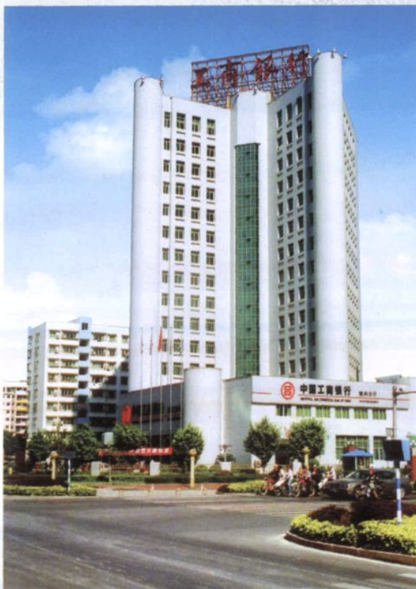
中国工商银行潮州市分行