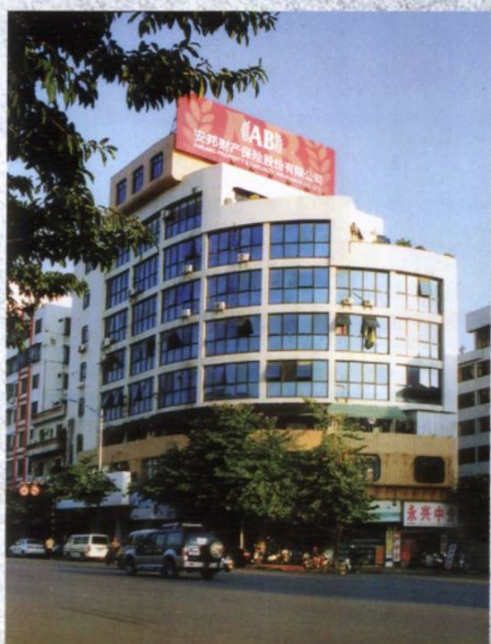
安邦财产保险股份有限公司广东分公司潮州营销部