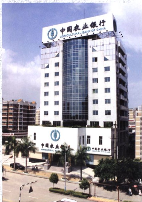
中国农业银行潮州分行