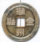
广东证券股份有限公司 潮州城新西路证券营业部