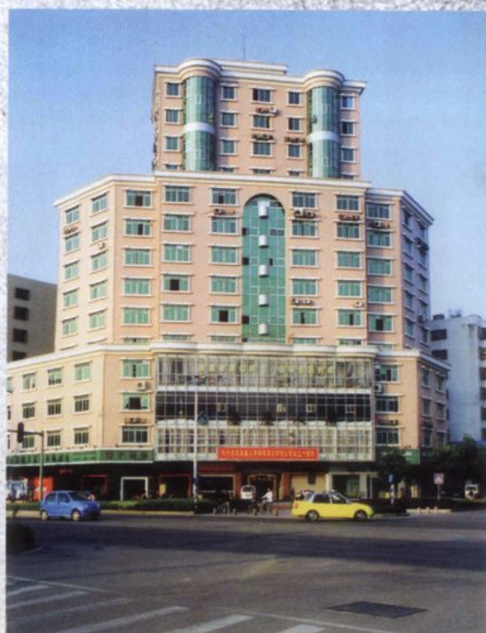
泰康人寿保险股份有限公司潮州中心支公司