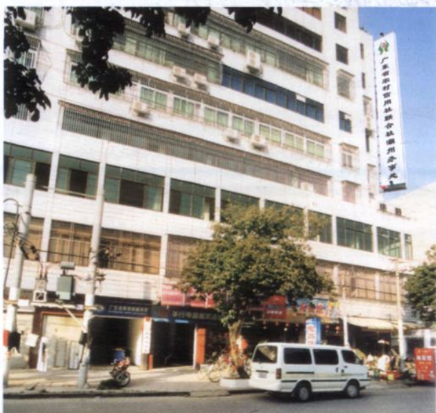
广东省农村信用社联合社潮州办事处