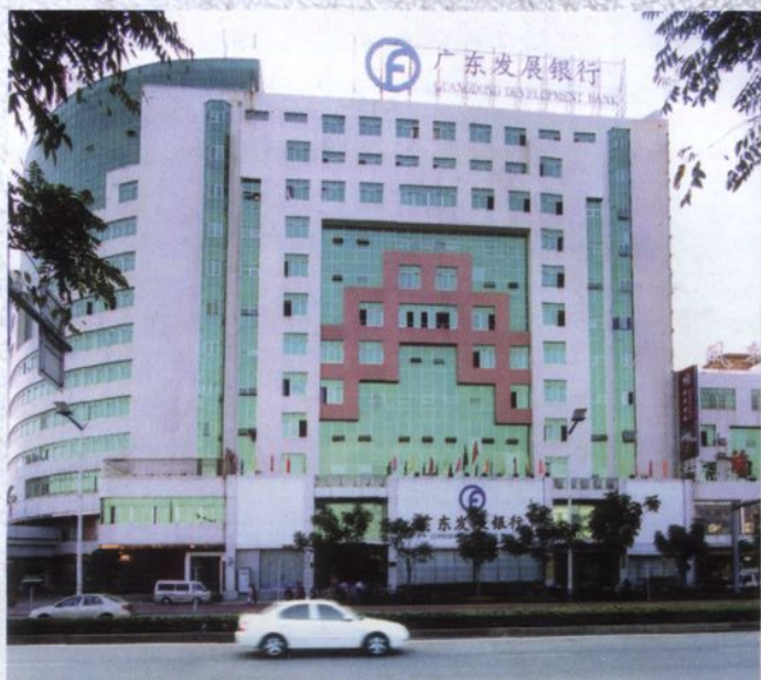
广东发展银行潮州分行