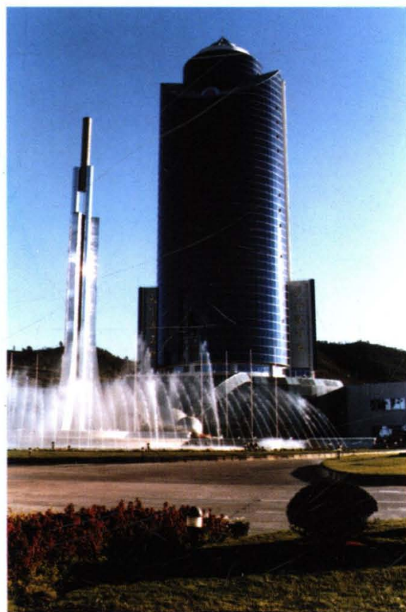
红塔集团办公大楼