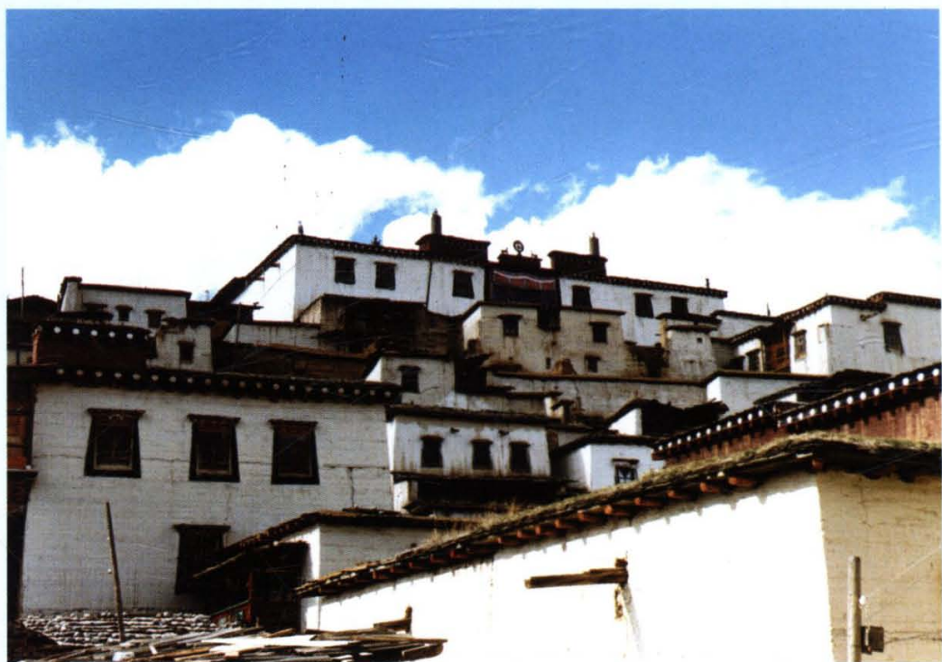
松赞林寺