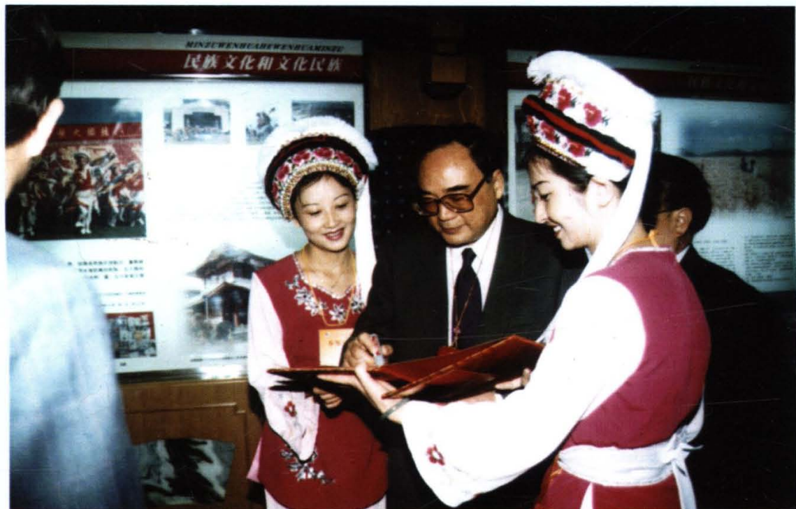
丁关根在云南五十年成就展大理展厅留言