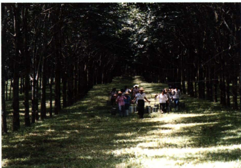
橡胶园收胶