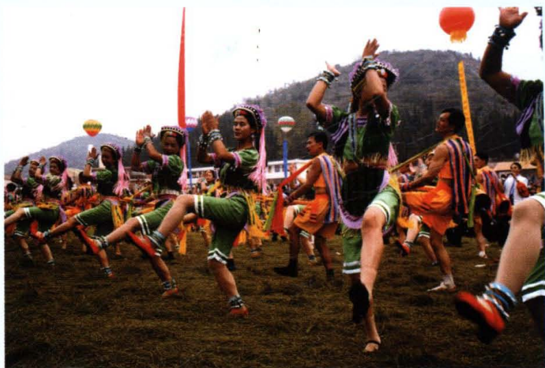
阿细跳月