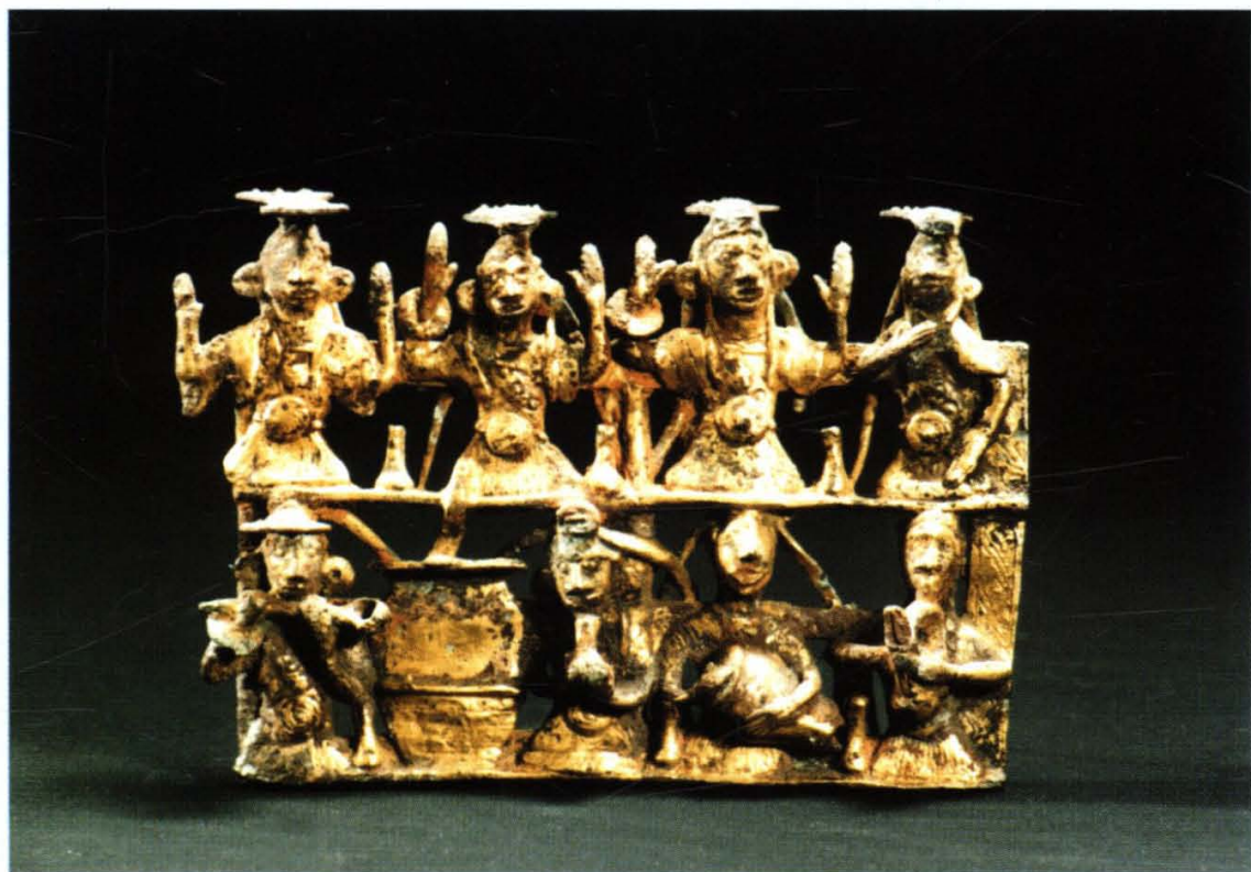
晋宁石寨山出土的家乐舞扣饰