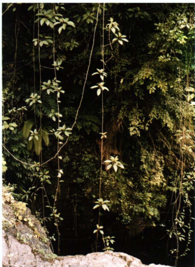
热带雨林中之小景