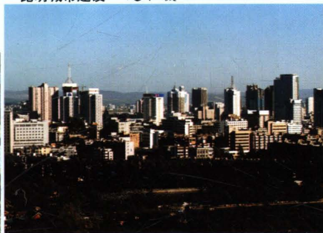
昆明城市建设