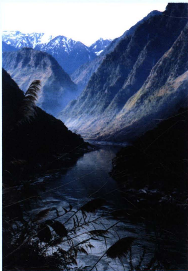
怒江大峡谷