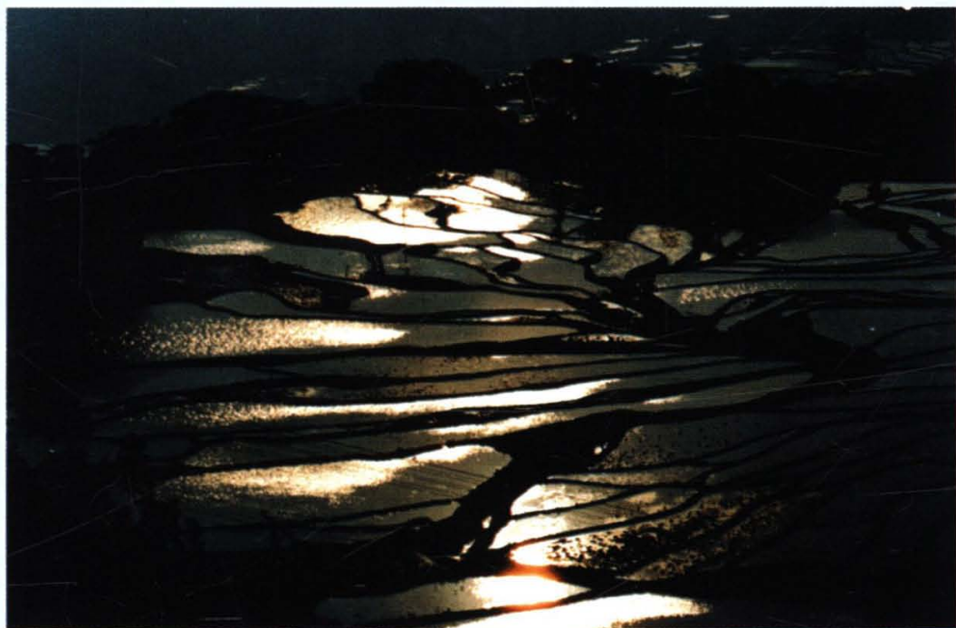
哈尼梯田