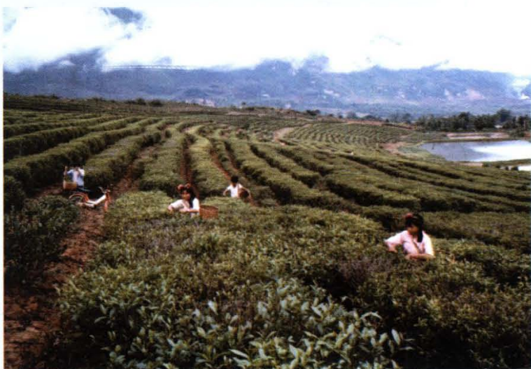
佤山茶园