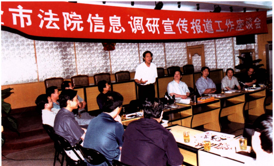
2002年8月，全市法院信息调研宣传报道工作座谈会召开