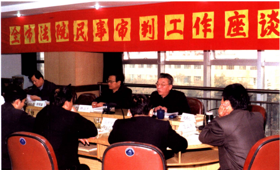
2001年11月，市中院召开全市法院民事审判工作座谈会