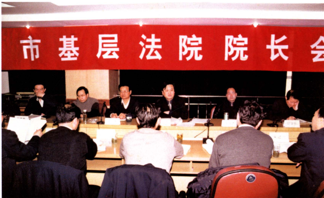
1999年2月，市中院召开全市法院院长会议