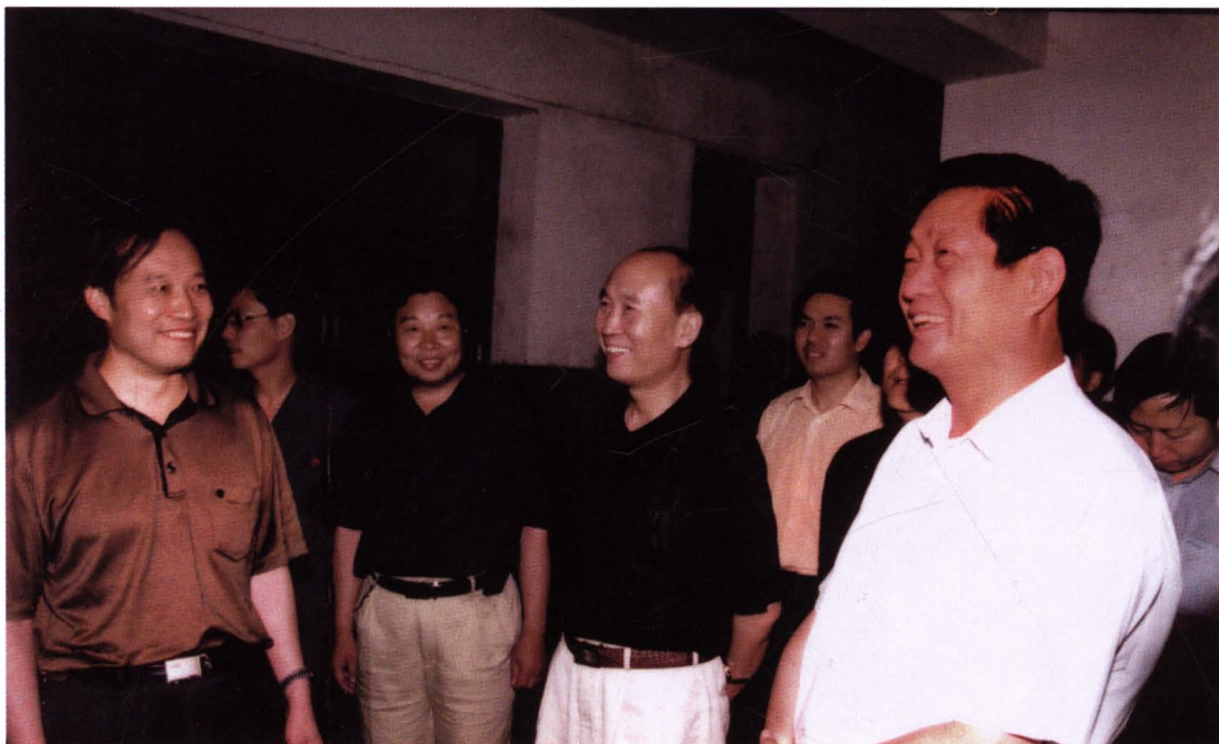
2003年8月，省委常委、省政法委书记赵正永和省高院院长赵郭海在杨陵区法院检察指导工作