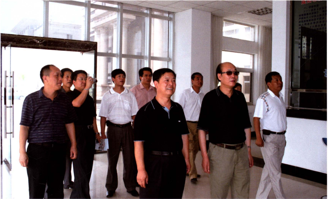
省高院赵郭海院长 2006 年 8 月在渭城区法院调研指导工作