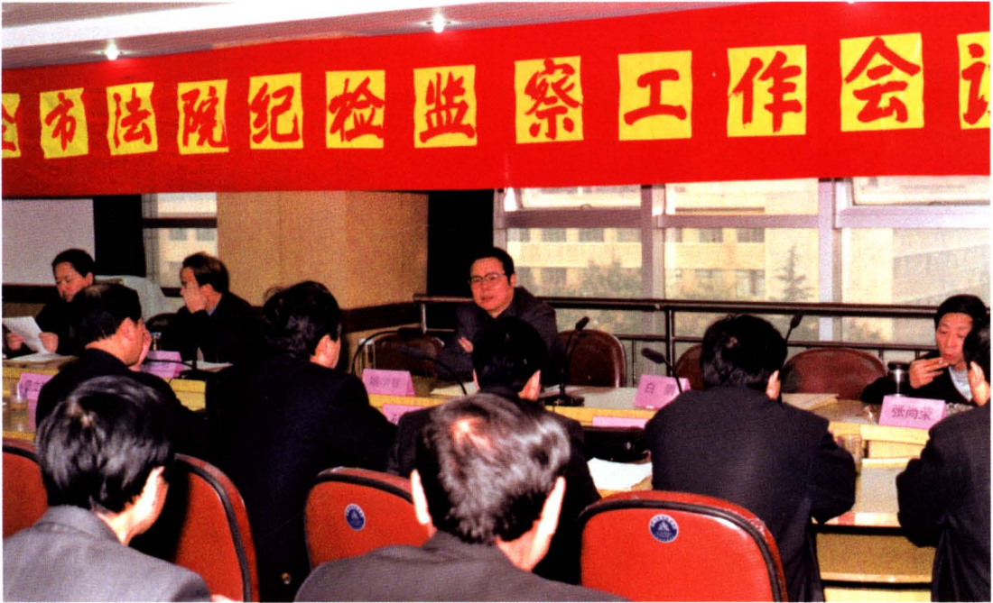
2001年11月9日，全市法院纪检监察工作会议召开