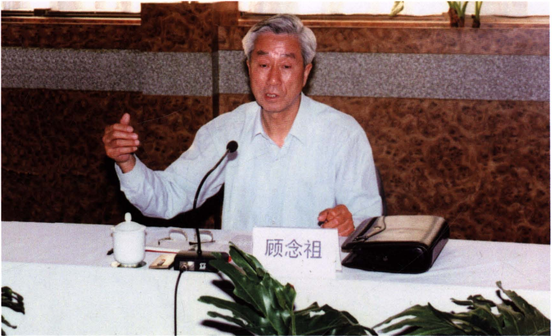
最高人民法院督导员、原上海市人大常委会副主任顾念祖 1999 年 5 月 18-19 日来咸阳市中院调研、视察