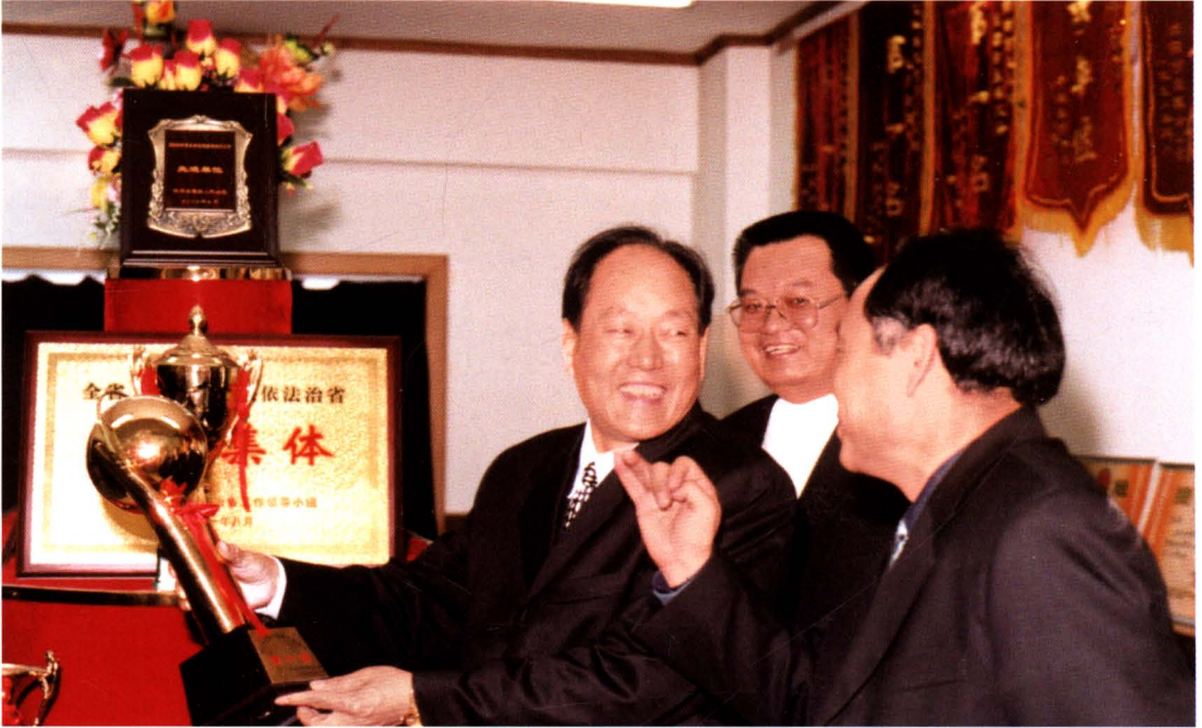
2003年3月10日，省人大副主任王发荣来咸阳市中院视察指导工作