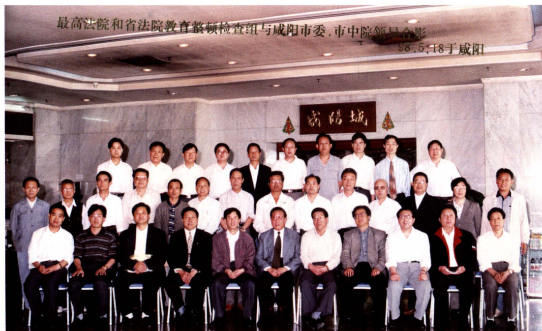
最高人民法院副院长李国光 1998 年 5 月 18 日来咸阳市中院检查指导教育整顿工作