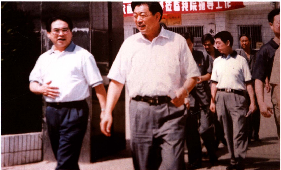
1998 年 5 月，省、市领导在永寿县人民法院调研