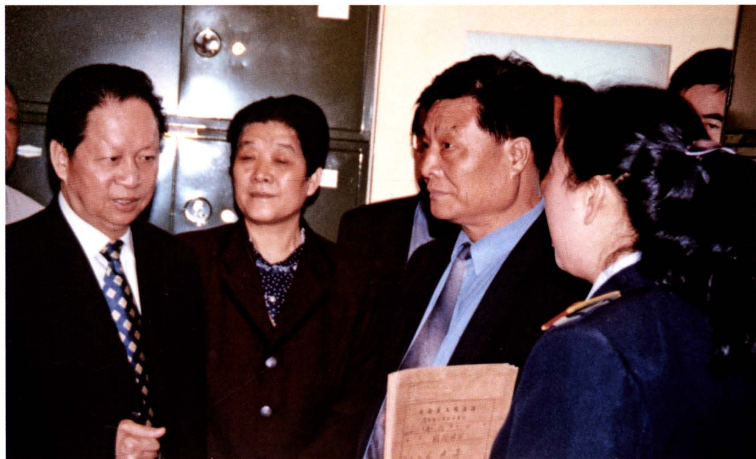
最高人民法院院长肖扬 2001 年 4 月 19 日在永寿县人民法院视察工作