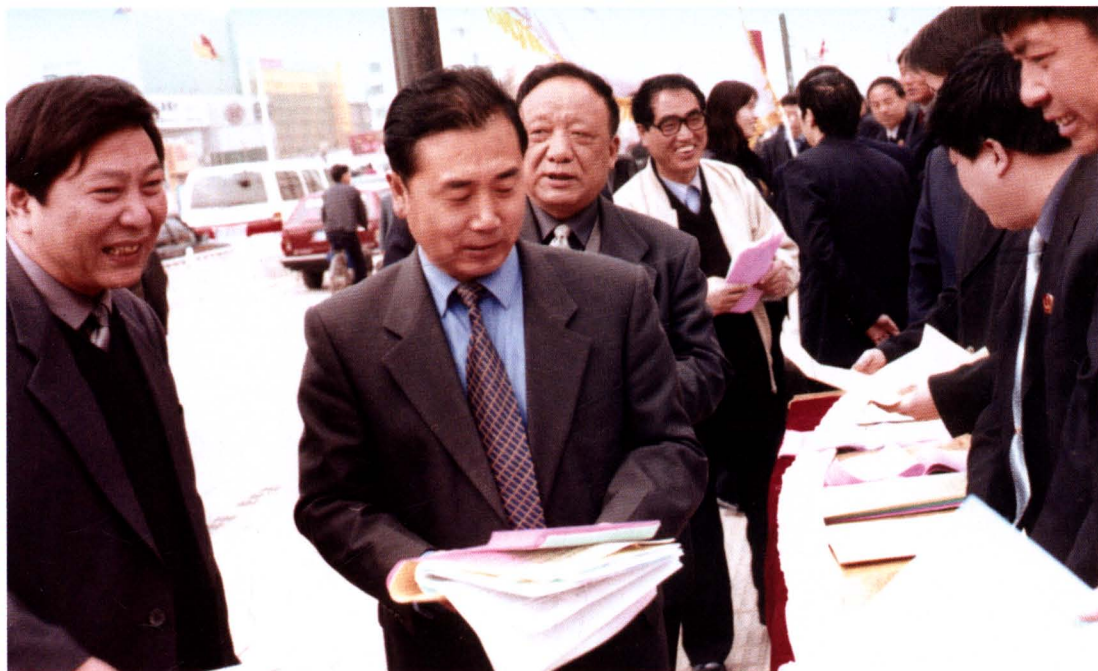
2005年11月，市委书记张立勇、市人大常委会副主任王汉洲检查指导市中院法制宣传活动