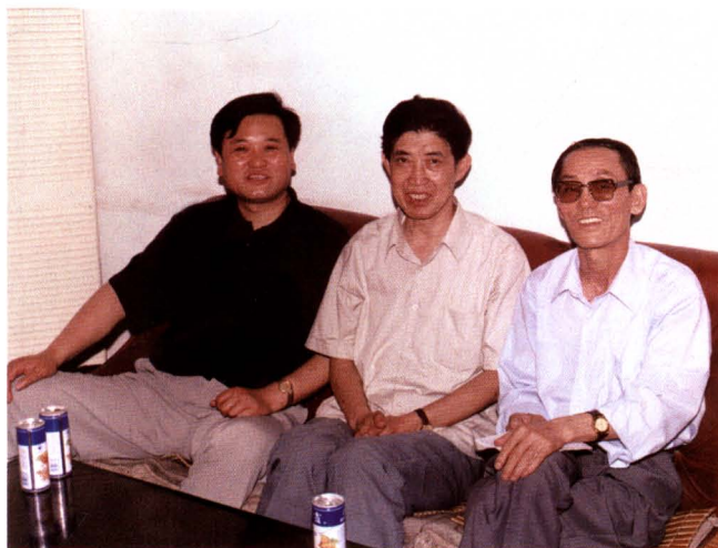
1999年1月13日，康宝奇院长登门征求法律专家顾问组对审判工作的意见