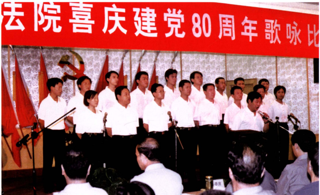
2001年6月29日，市中院机关党委隆重举办庆祝建党80周年歌咏比赛