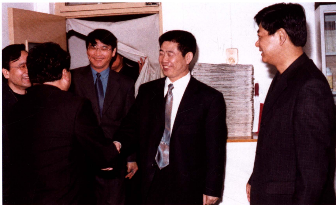
2005年10月，市委副书记徐新荣、市政法委书记郭中秋到市中院检查指导工作