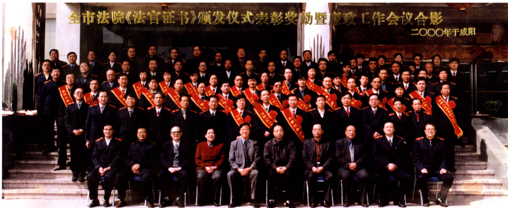
2000年3月，咸阳市主要领导出席全市法院《法官证书》颁发暨表彰奖励仪式