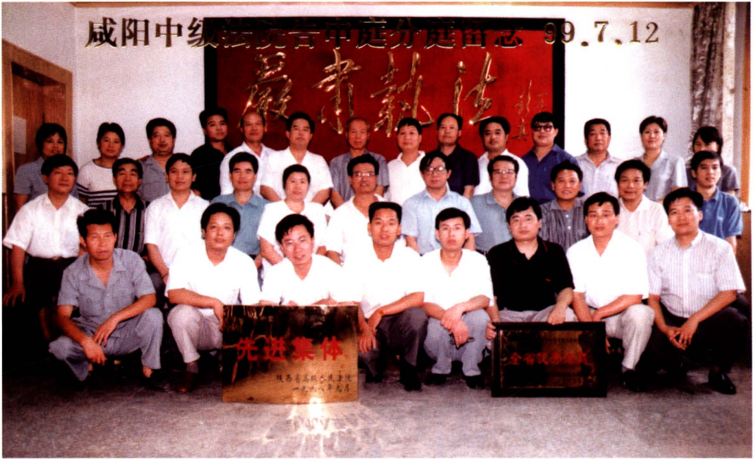
1999年7月，市中院撤销告诉、申诉审判庭，分设立案庭、审判监督庭