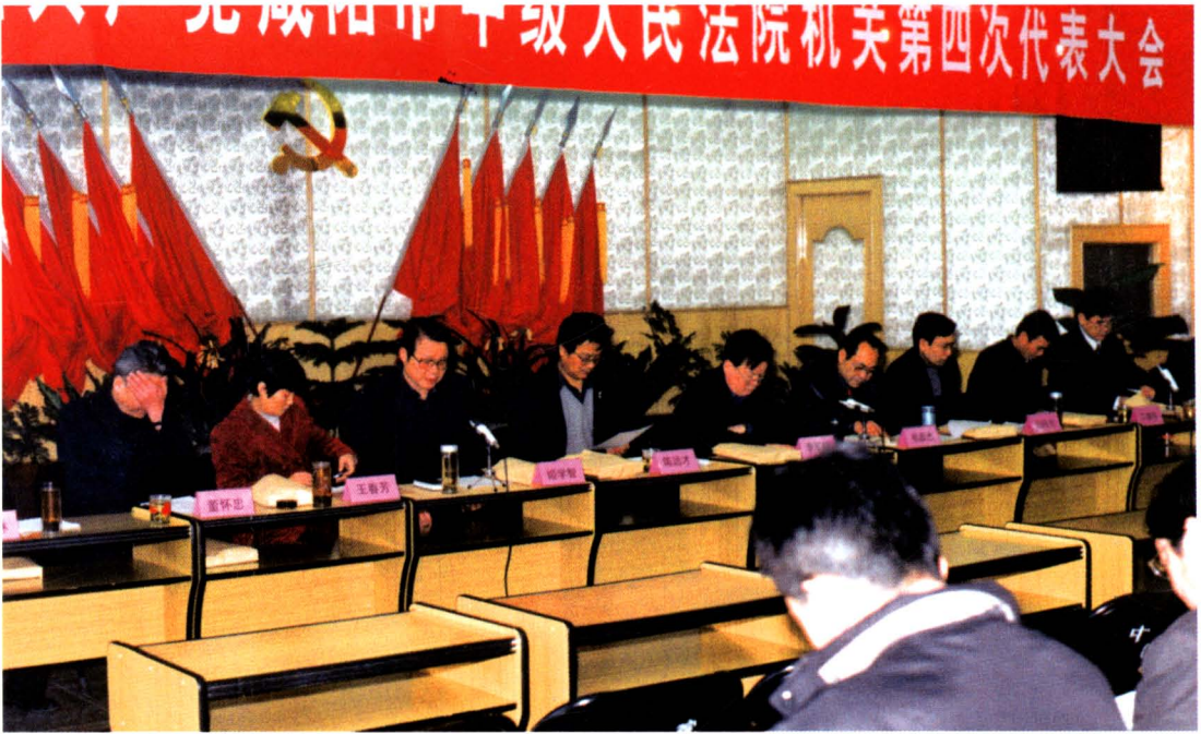
2002年4月20日，中共咸阳市中级人民法院机关第四次党员代表大会召开