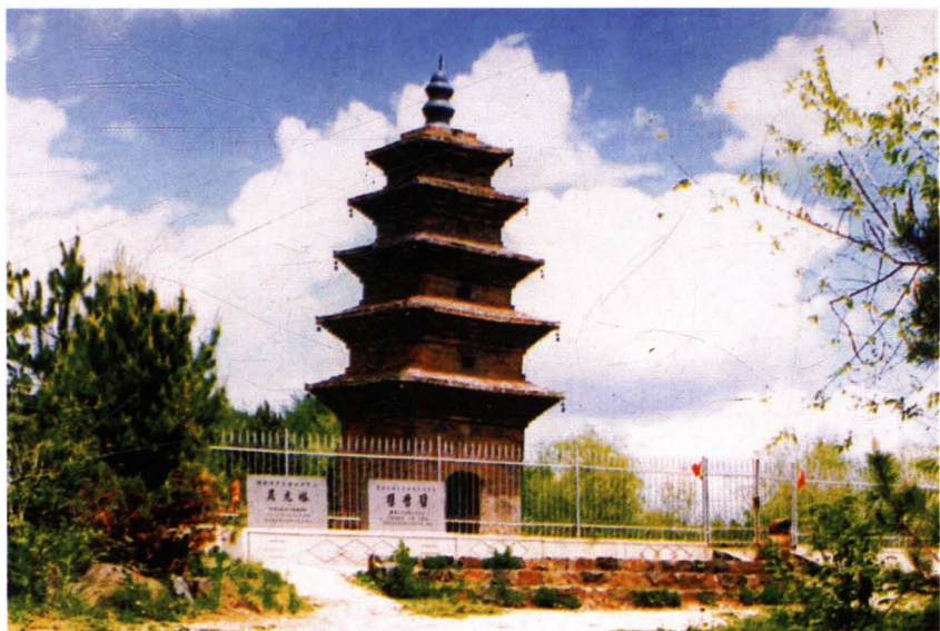
唐代渤海时期的灵光塔