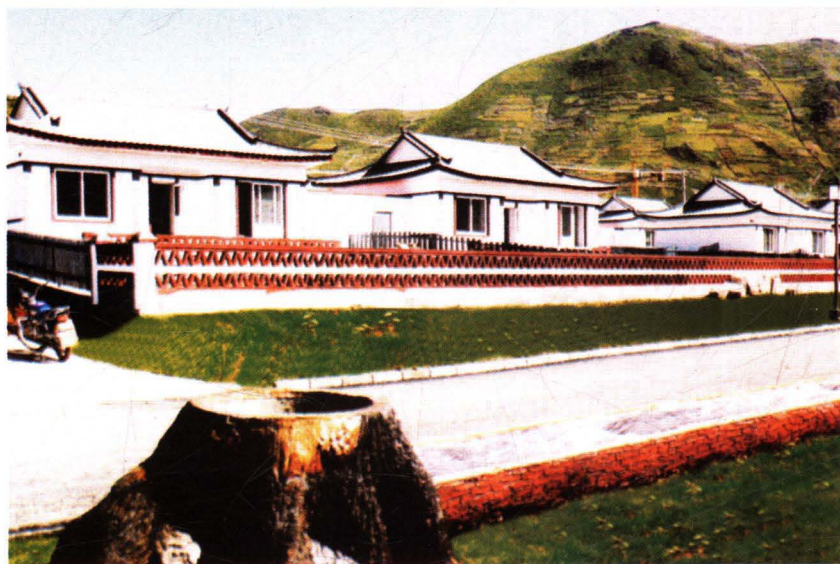
长白朝鲜族小康示范村全景