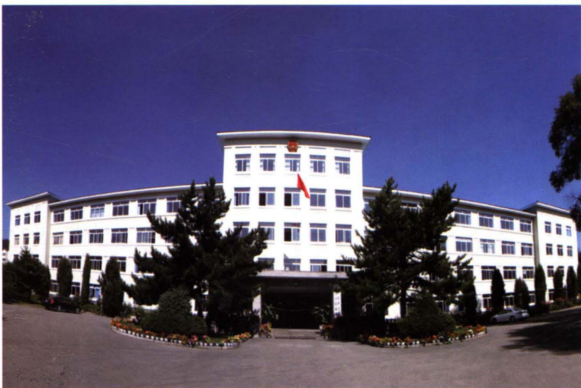
长白朝鲜族自治县人民政府办公大楼