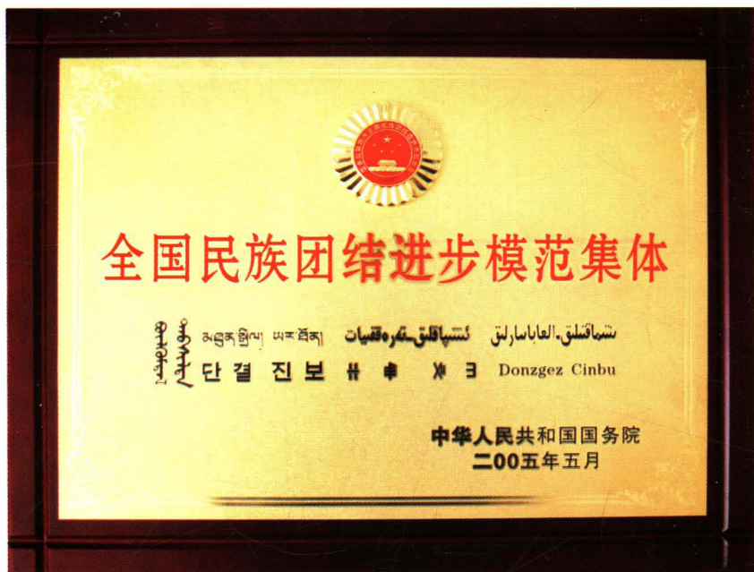
国务院颁发的“全国民族团结进步模范”匾额