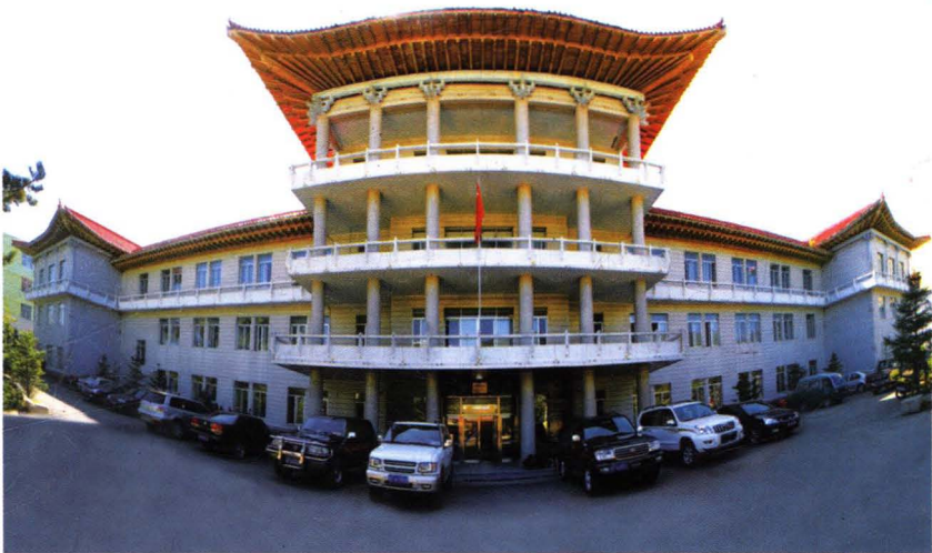
中共长白朝鲜族自治县委员会办公大楼