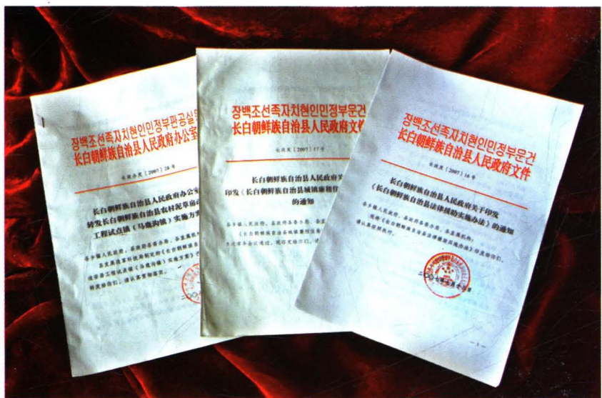
长白朝鲜族自治县文件