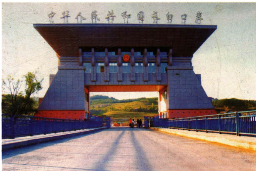
国家一类口岸—长白口岸