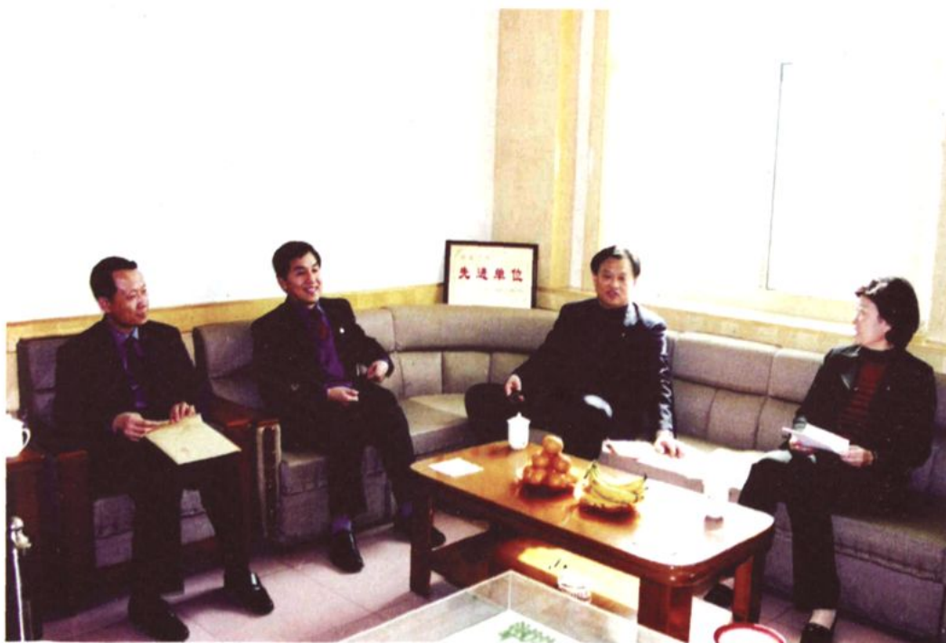
潍坊市委副书记郑金兰（右一）来校视察