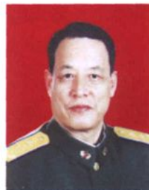
中国军事科学院副政委、中将 冯永生