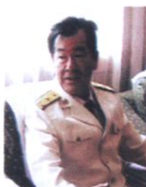
南京海军指挥 学院政委、少将 张仁忠