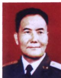
海军气象学院院长、少将 王锡友