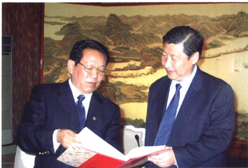
习近平与昌乐一中校友、香港大公报社董事长王国华（左）在一起