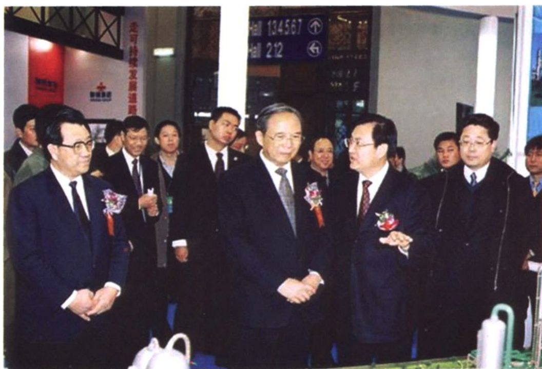
国务院副总理曾培炎与昌乐一中校友、中石化总裁王天普（右二）在一起