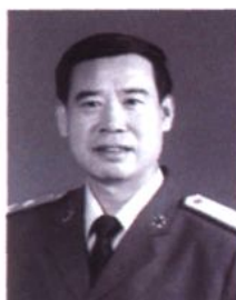
总后勤部参谋长、少将 李长顺