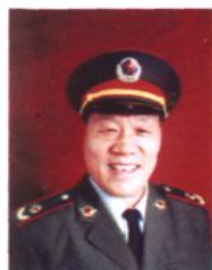
解放军201医院心肾 内科奠基人、少将 赵禄年