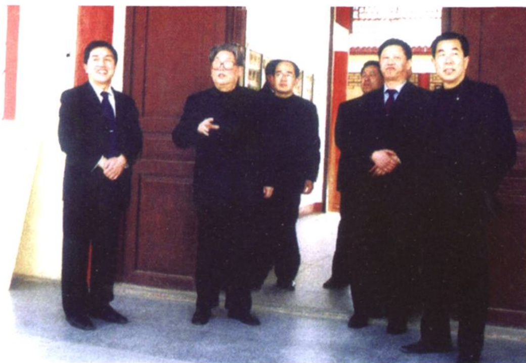
原山东省副省长马连礼（左二）来校视察