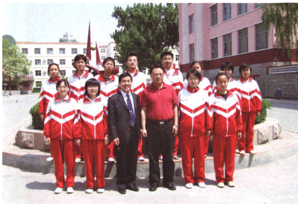
北京大学国际战略研究中心副主任、著名国际问题专家、教授朱锋（右三） 来校访问