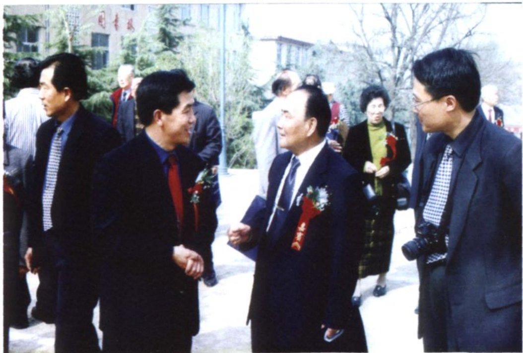
空军气象学院院长、少将王锡友（右二）回母校参加联谊会