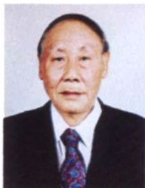
中科院院士、双星 计划首席科学家 刘振兴