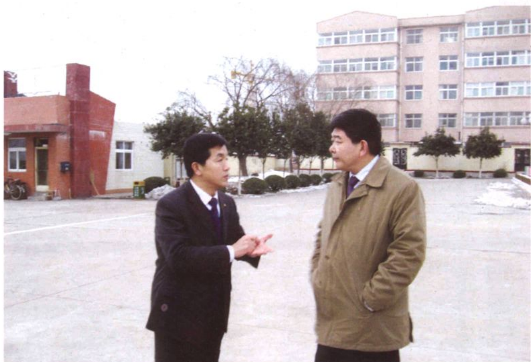
山东省教育厅副厅长张志勇（右）来校视察