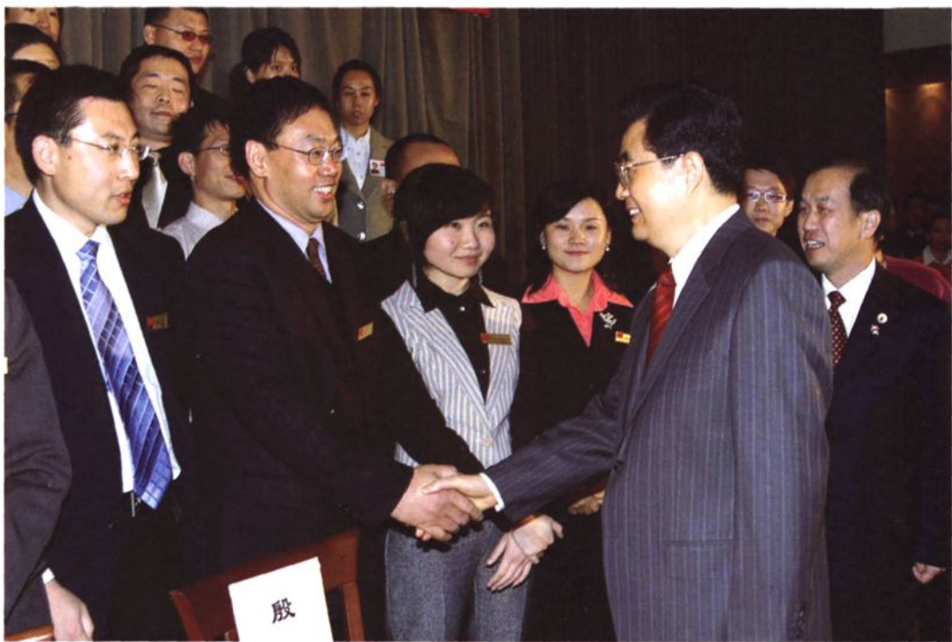
胡锦涛与昌乐一中校友李复新亲切握手 2007年9月，胡锦涛率中国代表团赴澳出席APEC会议，期间，前往中国大使馆看望留澳人员及澳籍华侨