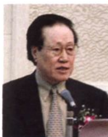
司法部常务副部长、中 国法律援助基金会会长 张秀夫