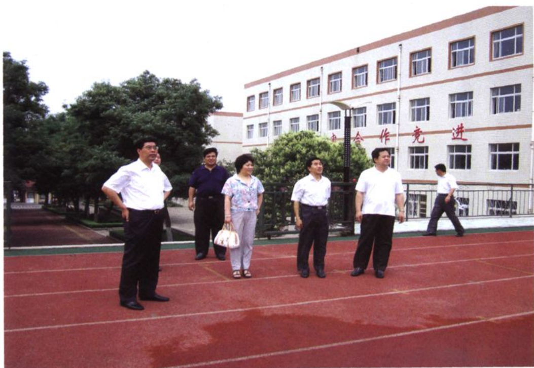
中共昌乐县委书记王树华(左一)来校视察