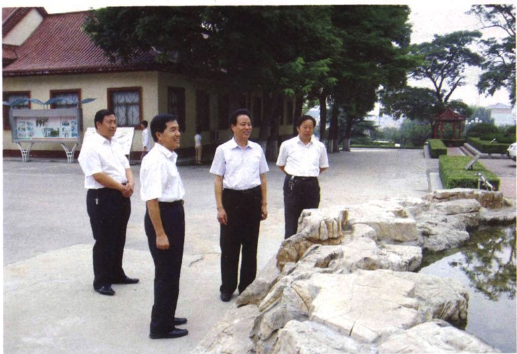
潍坊市副市长邢培彬（右二）来校视察