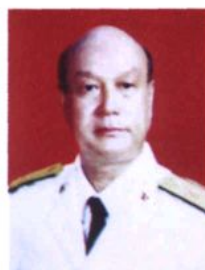
东海舰队基地政委、少将 李宗玉