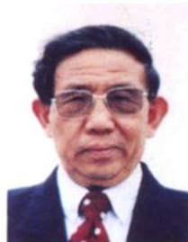
中科院院士 著名生殖生物学家 刘以训