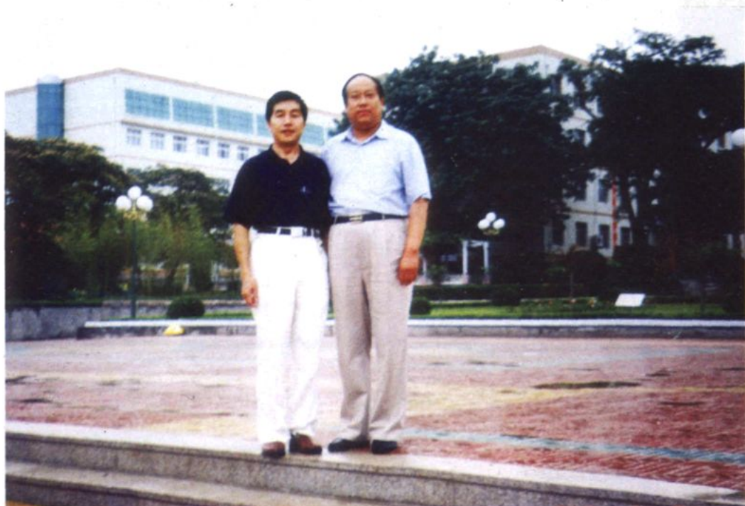
潍坊市委常委、副市长徐振溪（右）来校视察