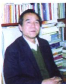
著名文学评论家 刘锡诚