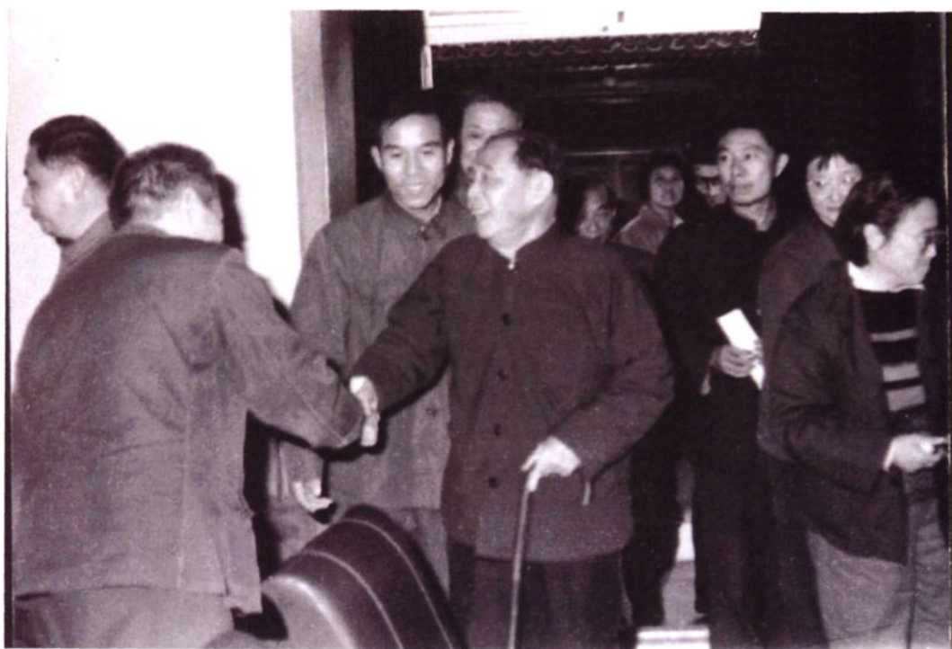
茅盾与一中校友、著名文学评论家刘锡诚（左三）在一起 1977年11月，刘锡诚请茅盾参加《人民文学》小说座谈会。这是文革后《人民文学》召开的第一个座谈会，也是茅盾文革后首次公开露面