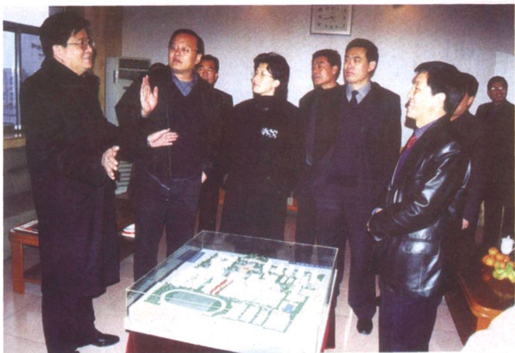
山东省教育厅副厅长陈光华（左一）来校视察