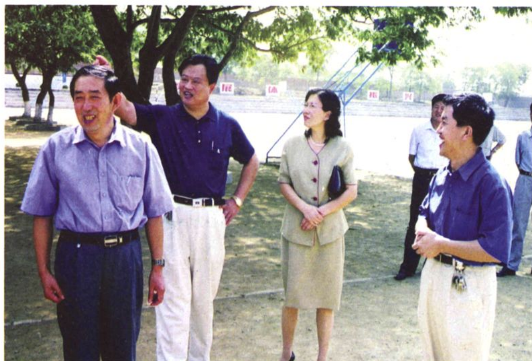
山东省教育厅副厅长马庆水（左一）来校视察