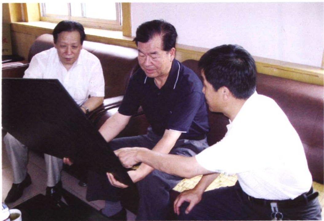
海军指挥学院政委、少将张仁忠（中）回母校走访