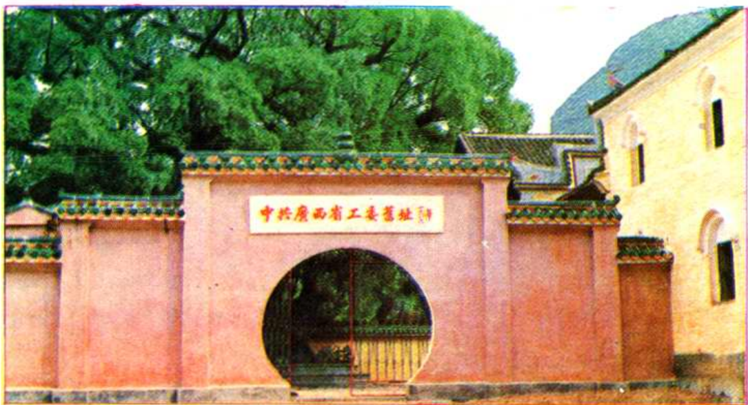
中共廣西省工委舊址——黃姚寶珠觀