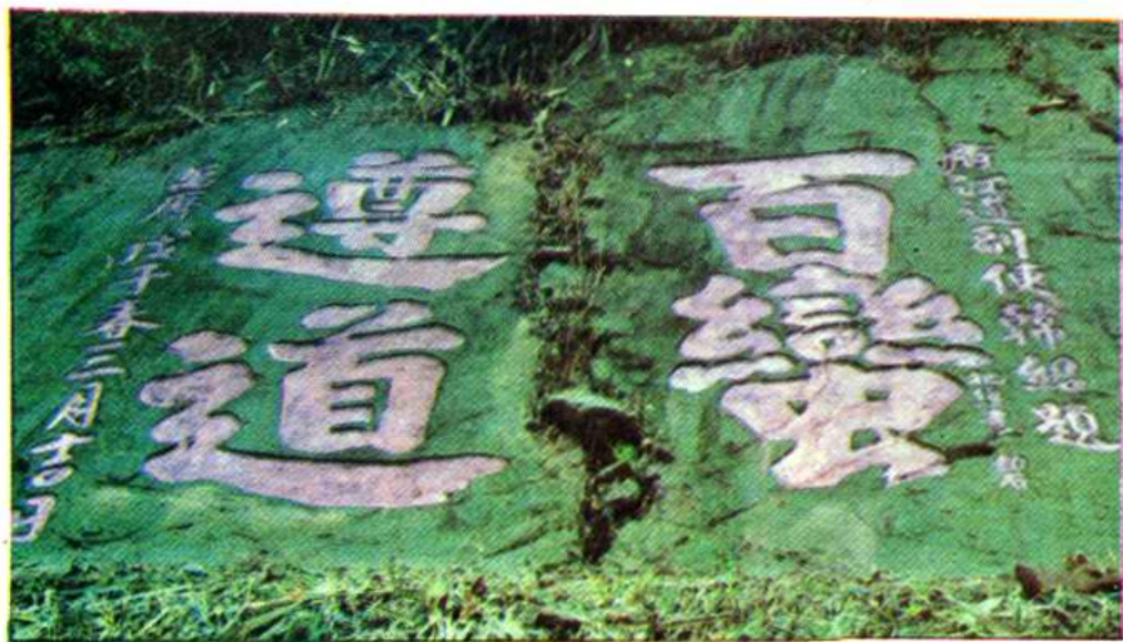
“百蠻遵道” 摩崖石刻