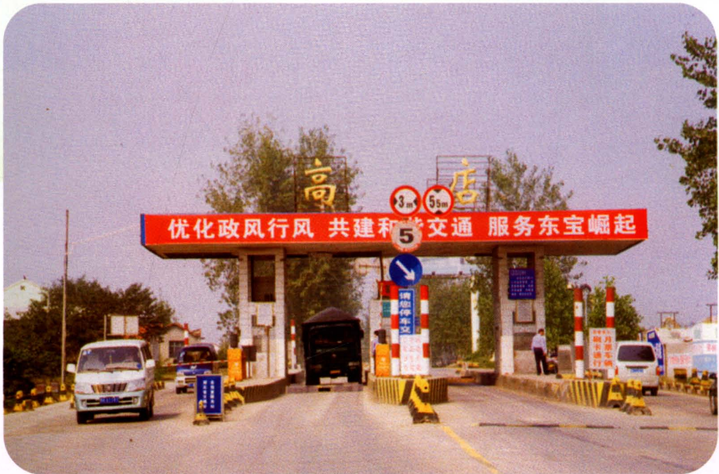
207国道高店公路通行费收费站