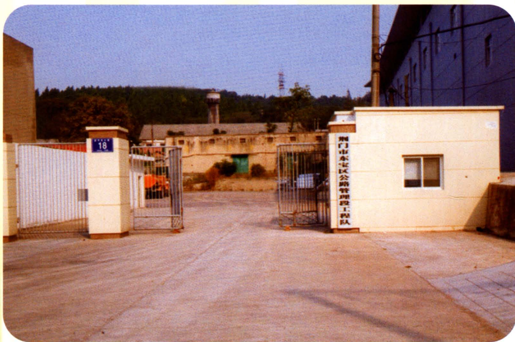
区公路管理段工程队办公楼