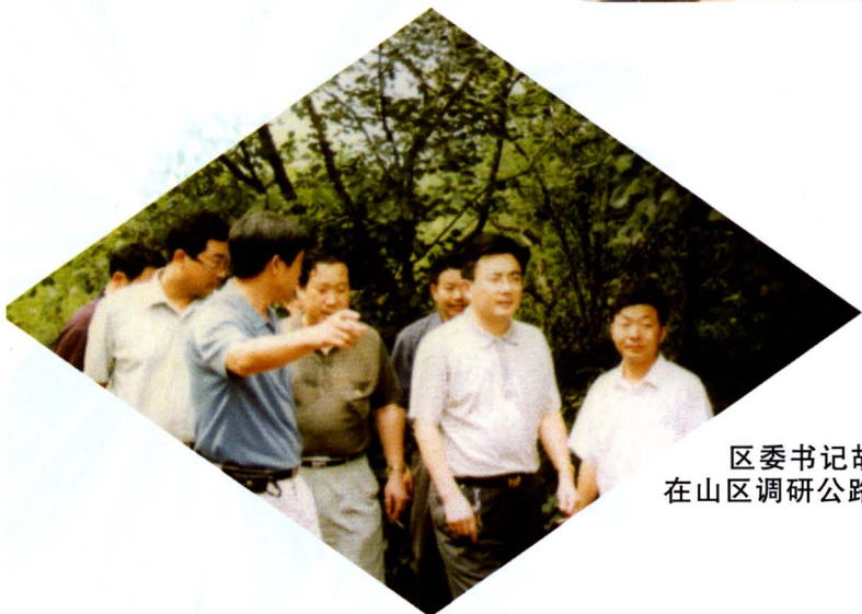
区委书记胡道银(右二)在山区调研公路建设