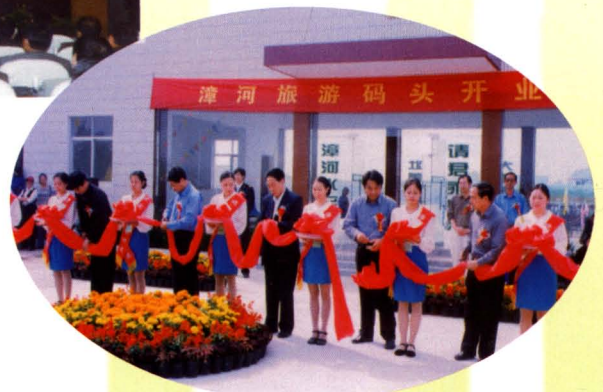
漳河旅游码头开业庆典