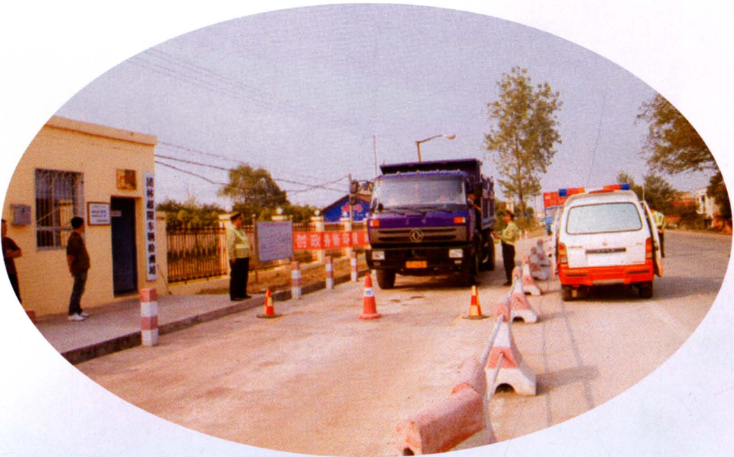
207国道鸦铺超限检测站