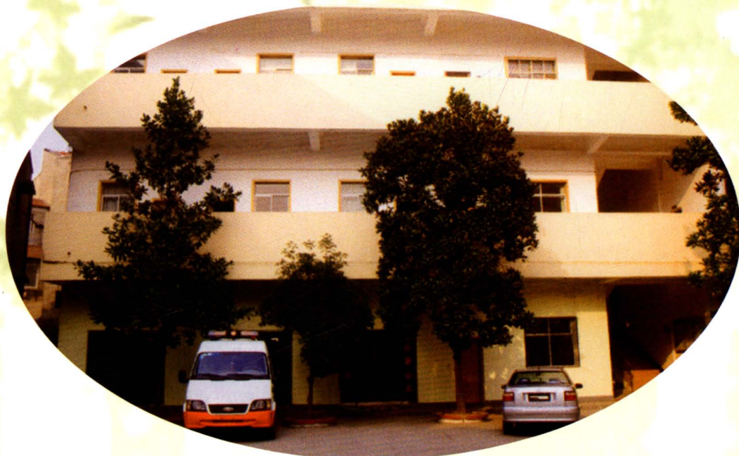
区公路管理段养护中心办公楼