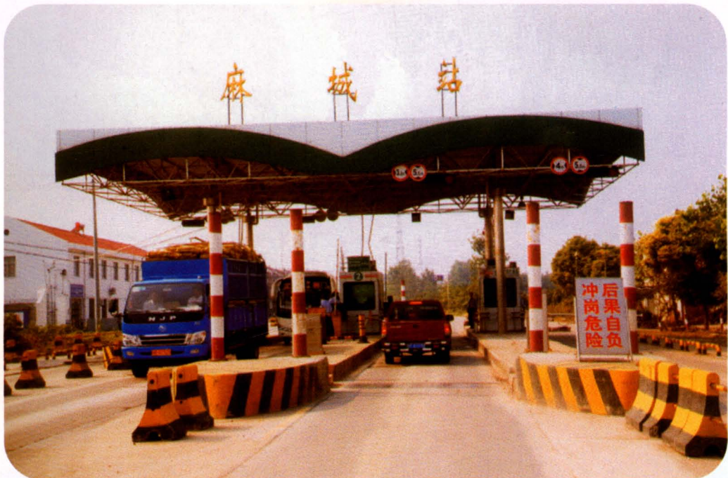
荆新线麻城公路通行费收费站