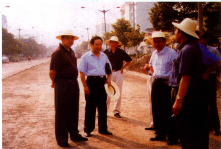
荆门市市长许克振(左一)、 副市长何忠琦(左四)视察南荆线 建设情况