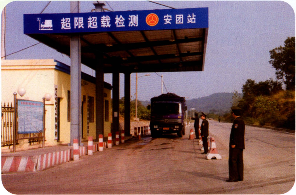
南荆线安团超限检测站