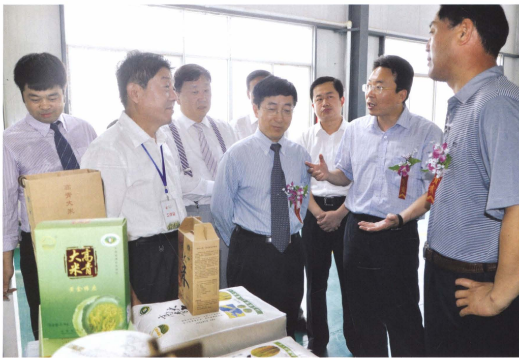
县长刘忠远（右二）视察农业产业化生产经营工作