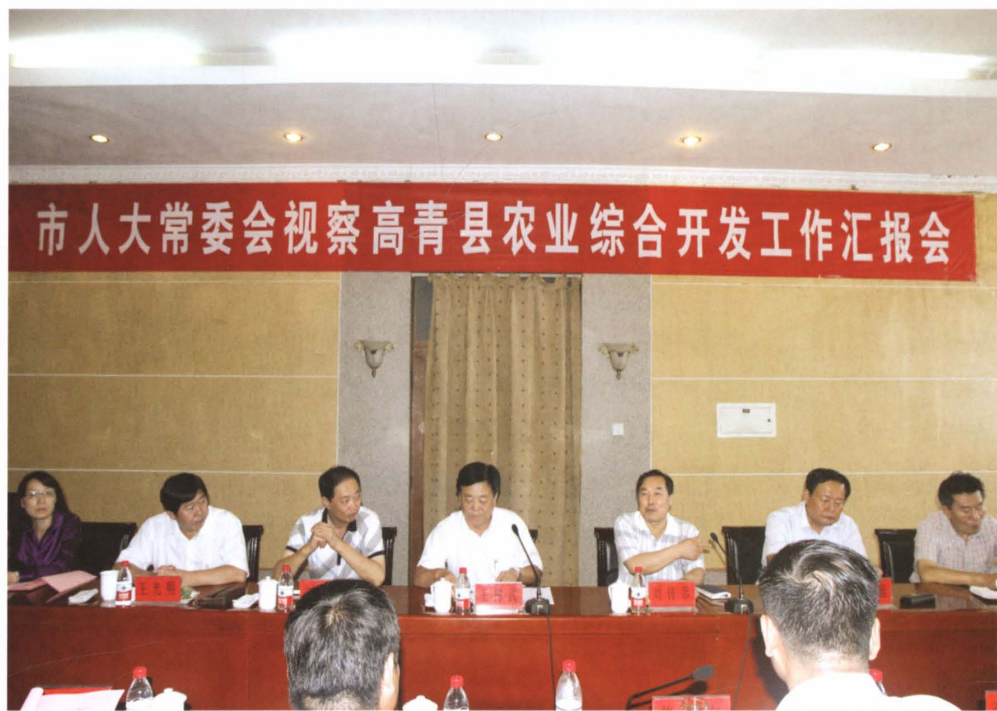
淄博市人大常委会副主任王树武（左四）视察高青农业综合开发工作