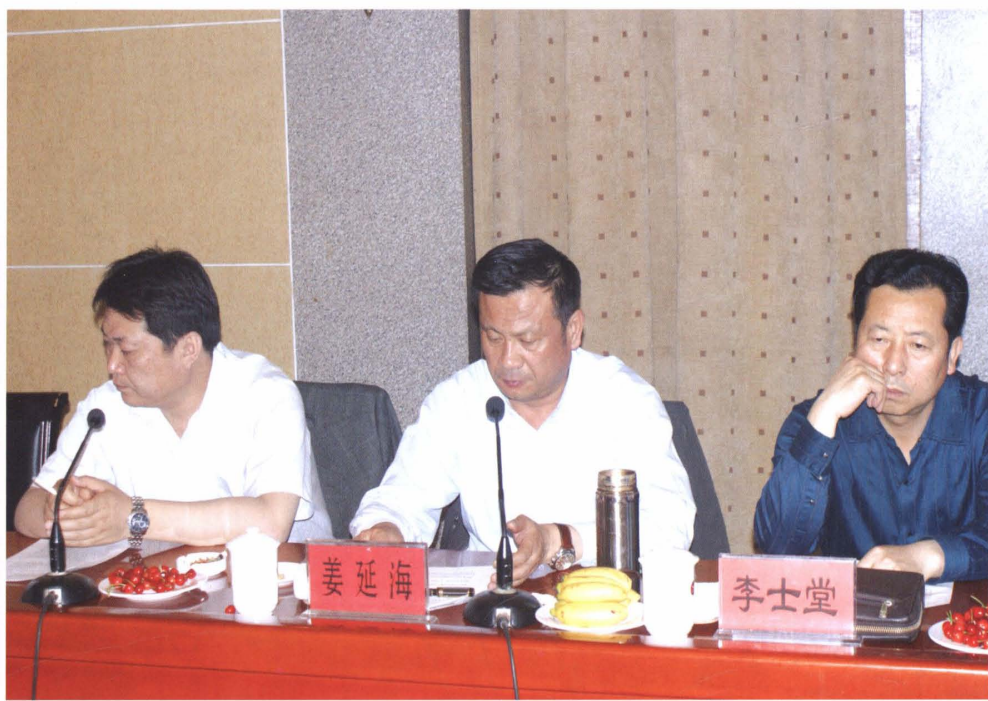
淄博市农业综合开发办公室领导到高青检查指导工作