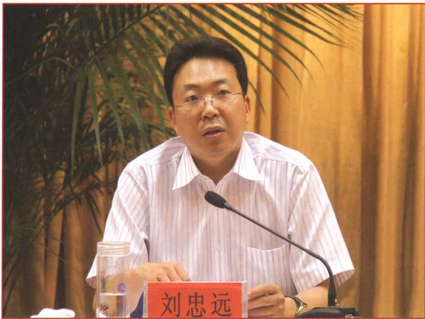
中共高青县委副书记、高青县人民政府县长 刘忠远