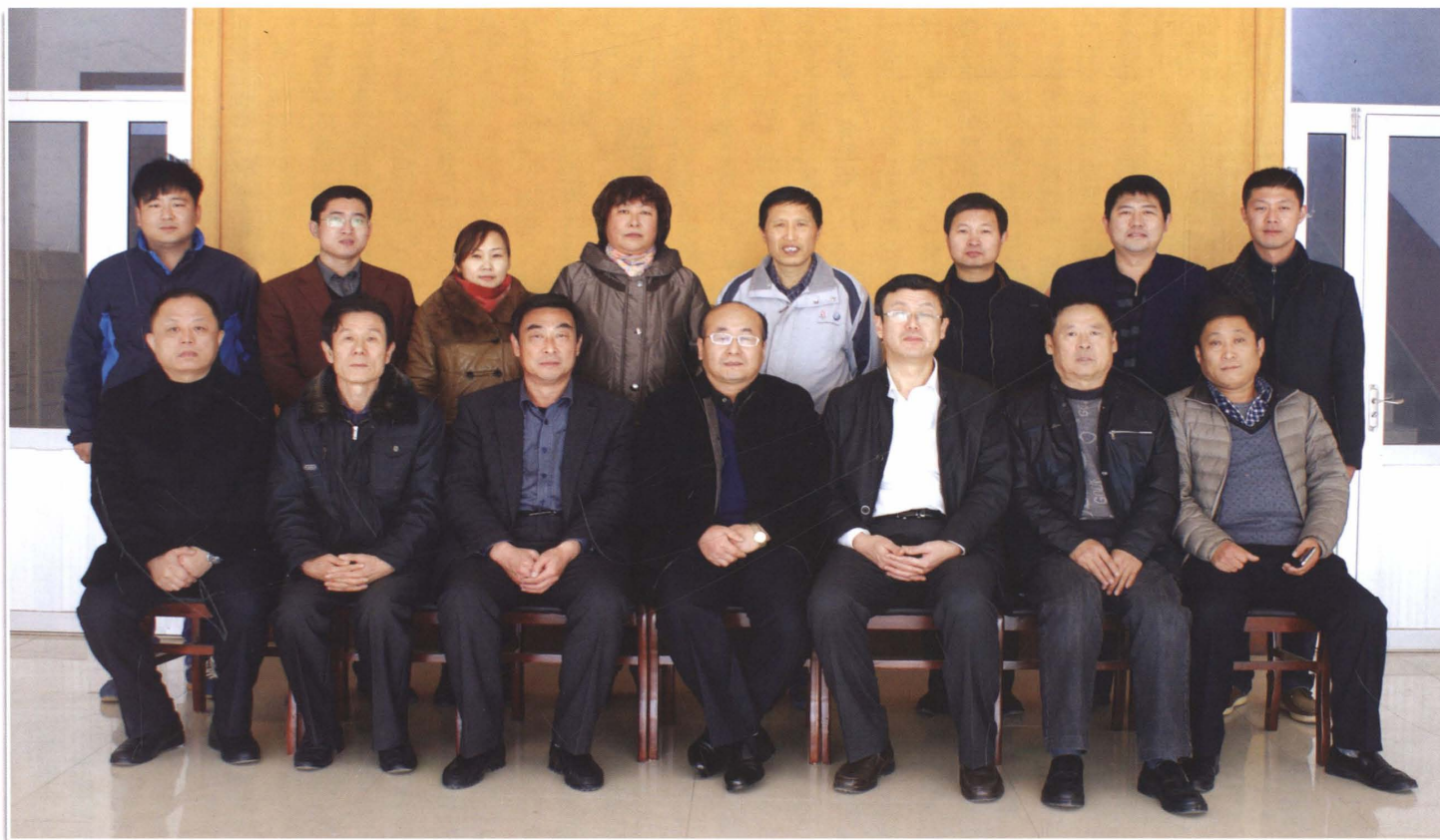
高青县农业综合开发办公室全体人员