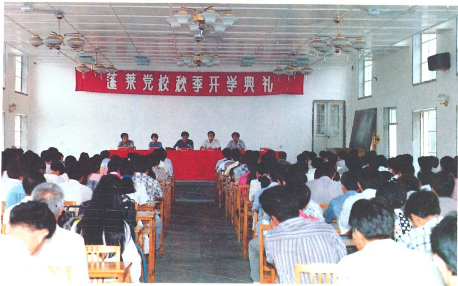
中共蓬莱市委党校秋季开学典礼在校礼堂举行