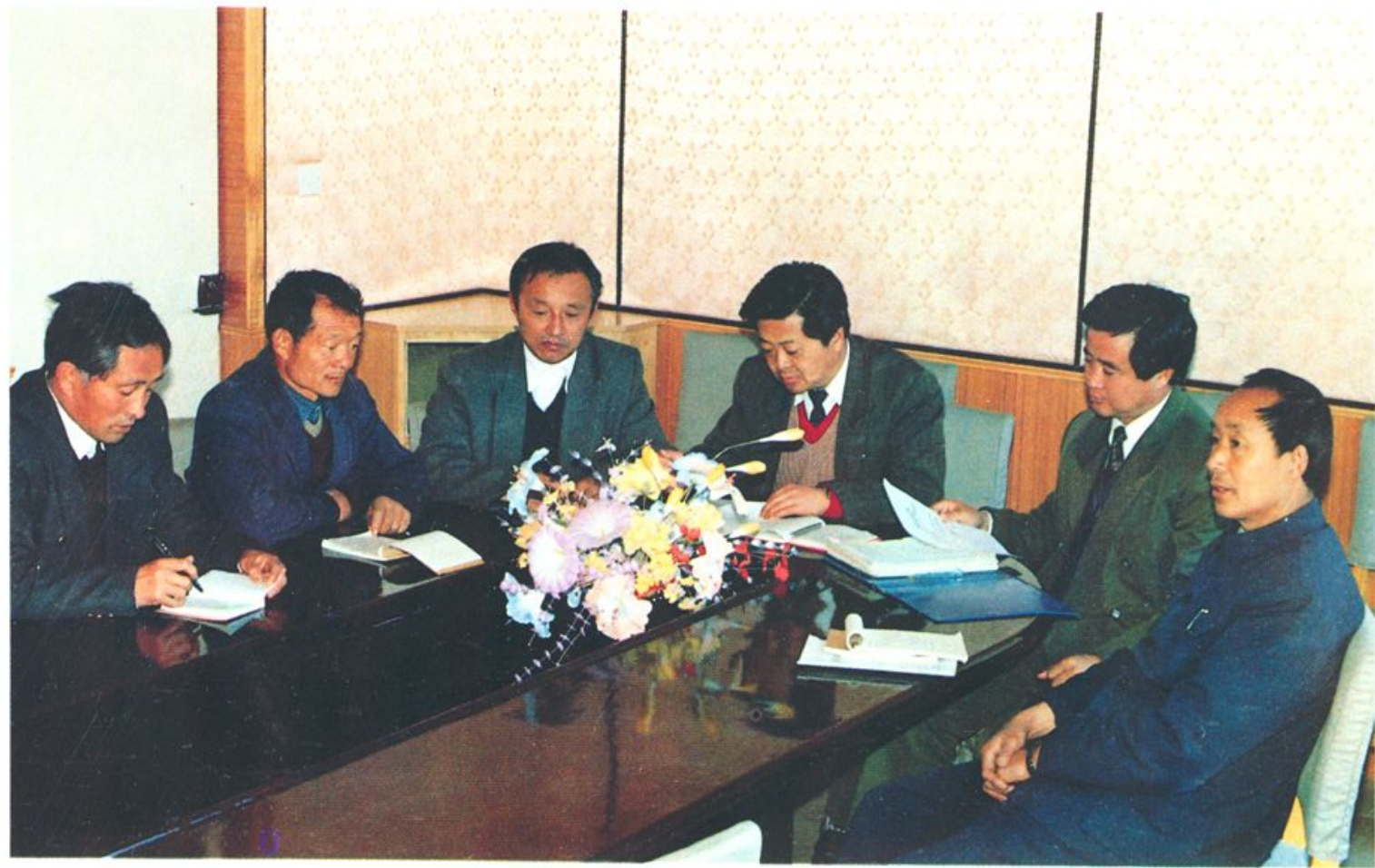
中共蓬莱市委党校领导班子在研究工作