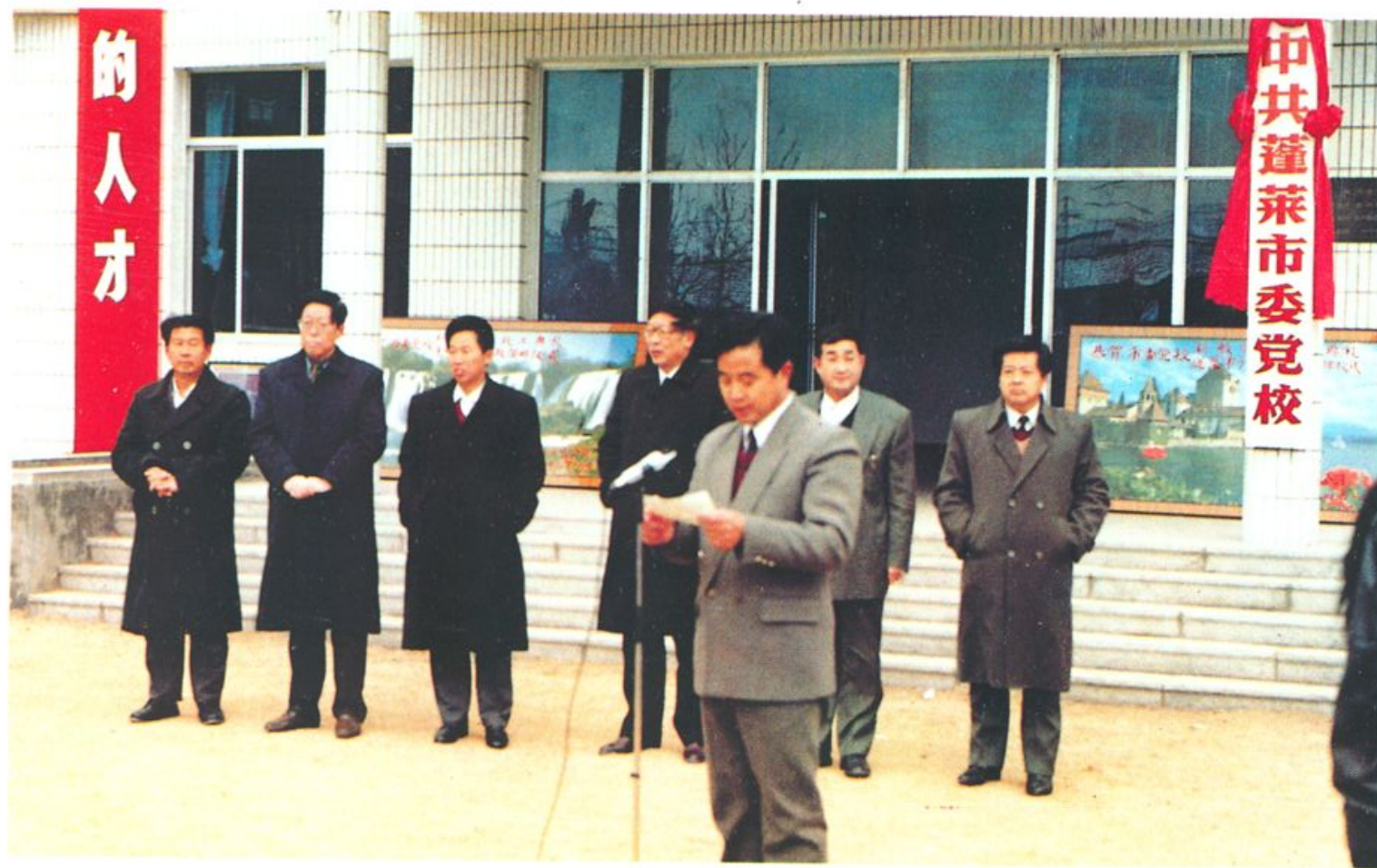
中共蓬莱市委党校教学办公楼竣工典礼仪式