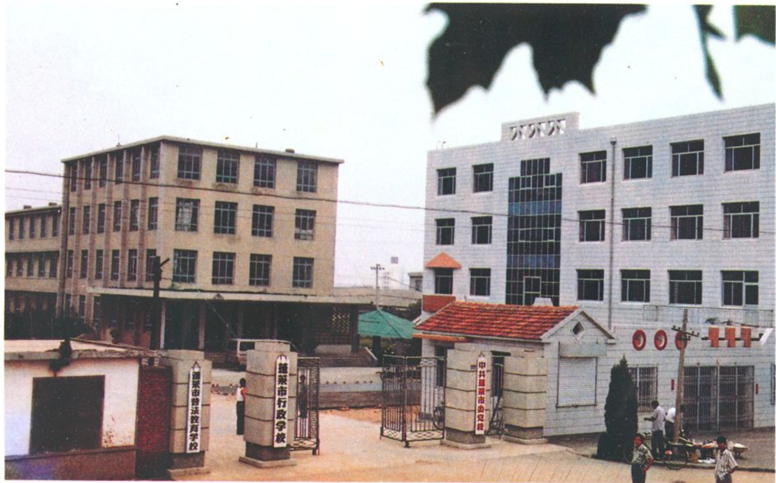
中共蓬莱市委党校校园一角