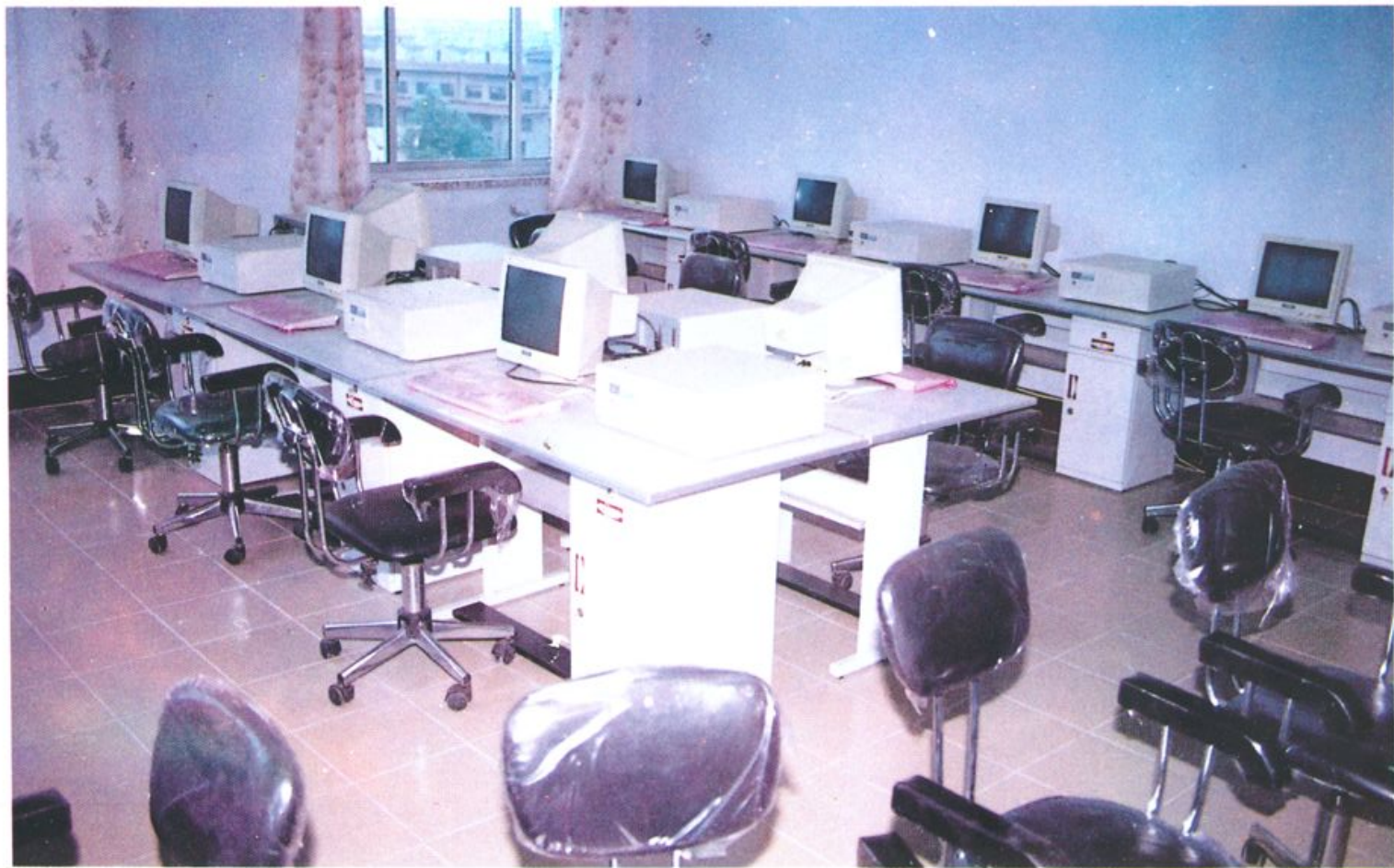
中共蓬莱市委党校微机室一角