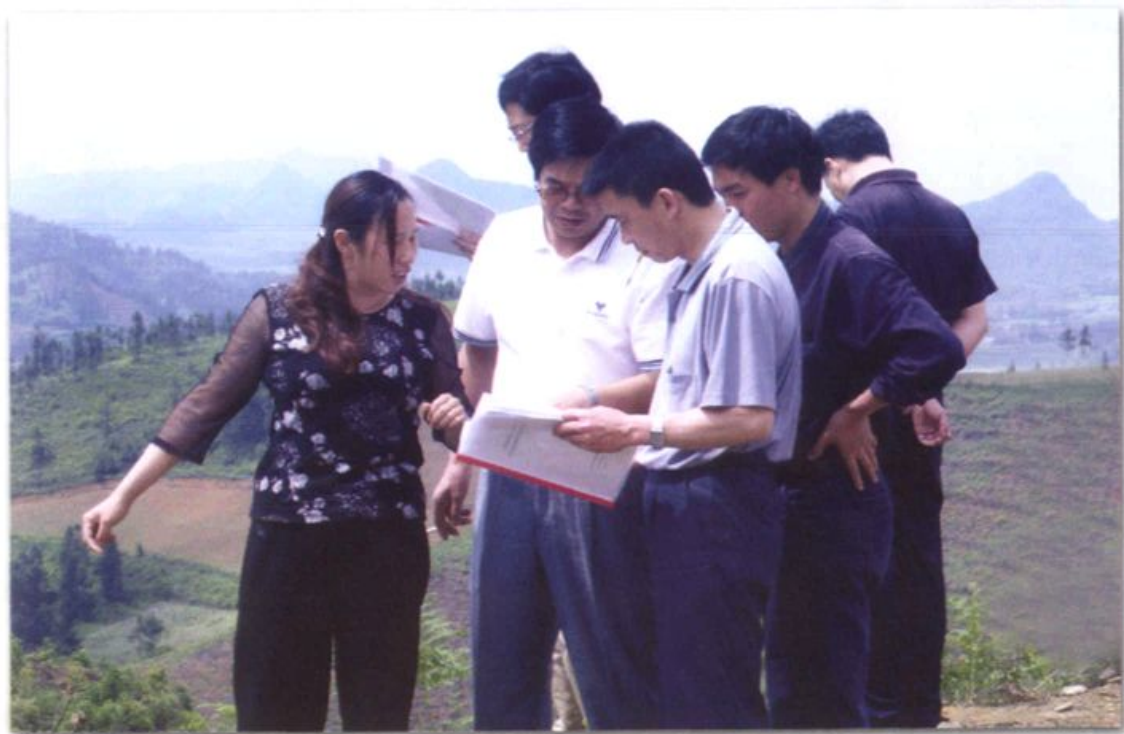
云南省林业厅项目检查组在州、县林业局有关领导陪同下对金城林场实施的防护林工程建设进行检查指导