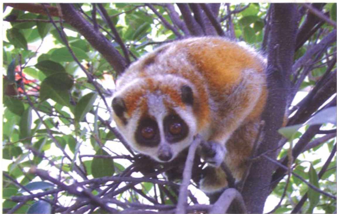
国家一级保护动物——蜂猴