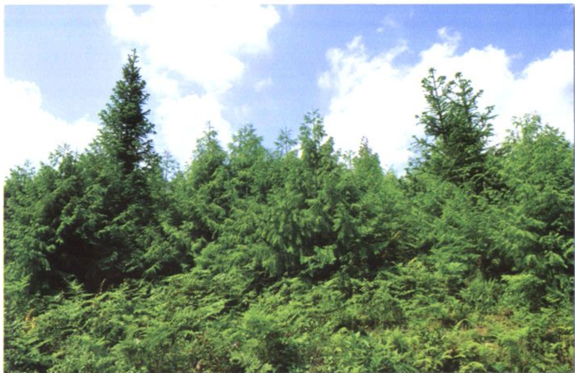
国家一级保护植物——秃杉种植基地