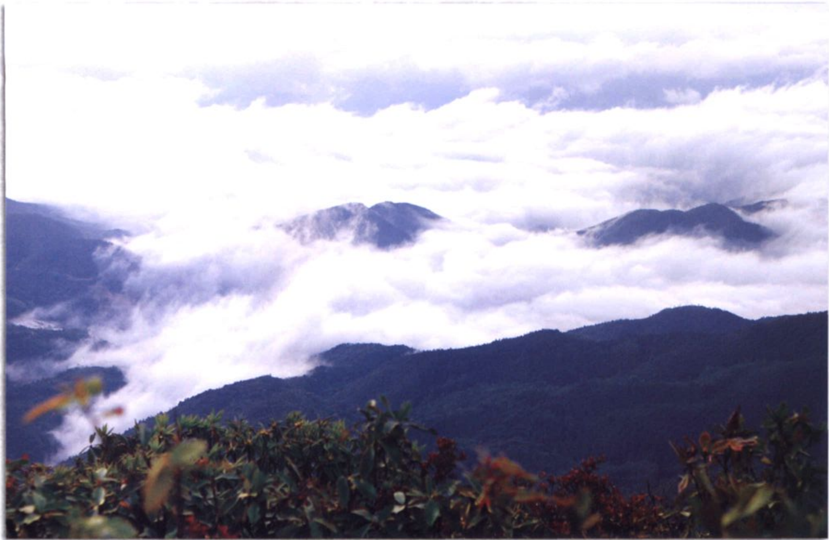
马关老君山省级自然保护区风光——云海