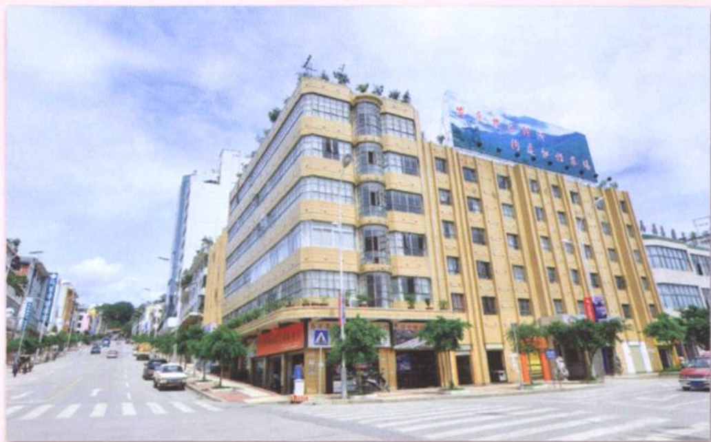
金城林场综合办公楼