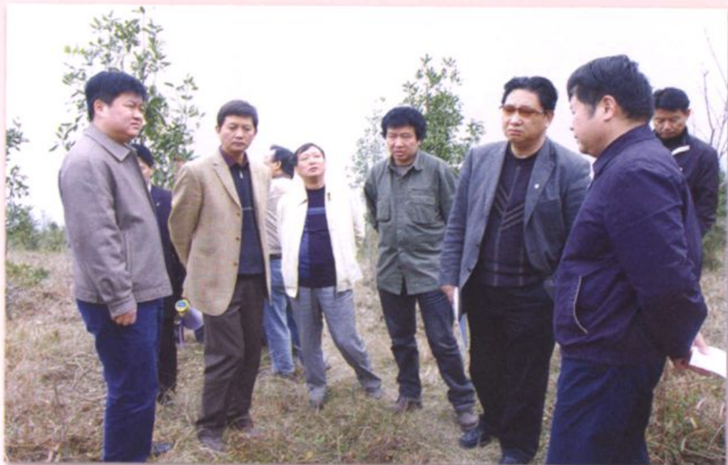
2008年3月3日，云南省政协副主席、省林业厅党组书记白成亮（右三）在文山州政协主席王云凌（右二）、副州长胡荣（左二）及马关县县委副书记、县长兰朝明（左一）等领导陪同下到林场调研