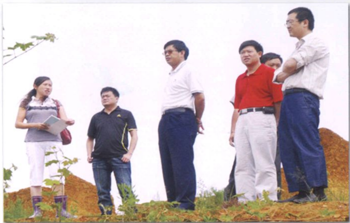
由文山州发改委、林业局组成的检查验收组对金城林场木兰科樟科良种基地和达号林区公路两个中央扶持项目进行检查验收