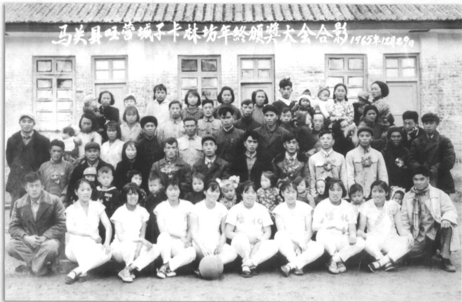
城子卡林场 1965 年颁奖大会合影