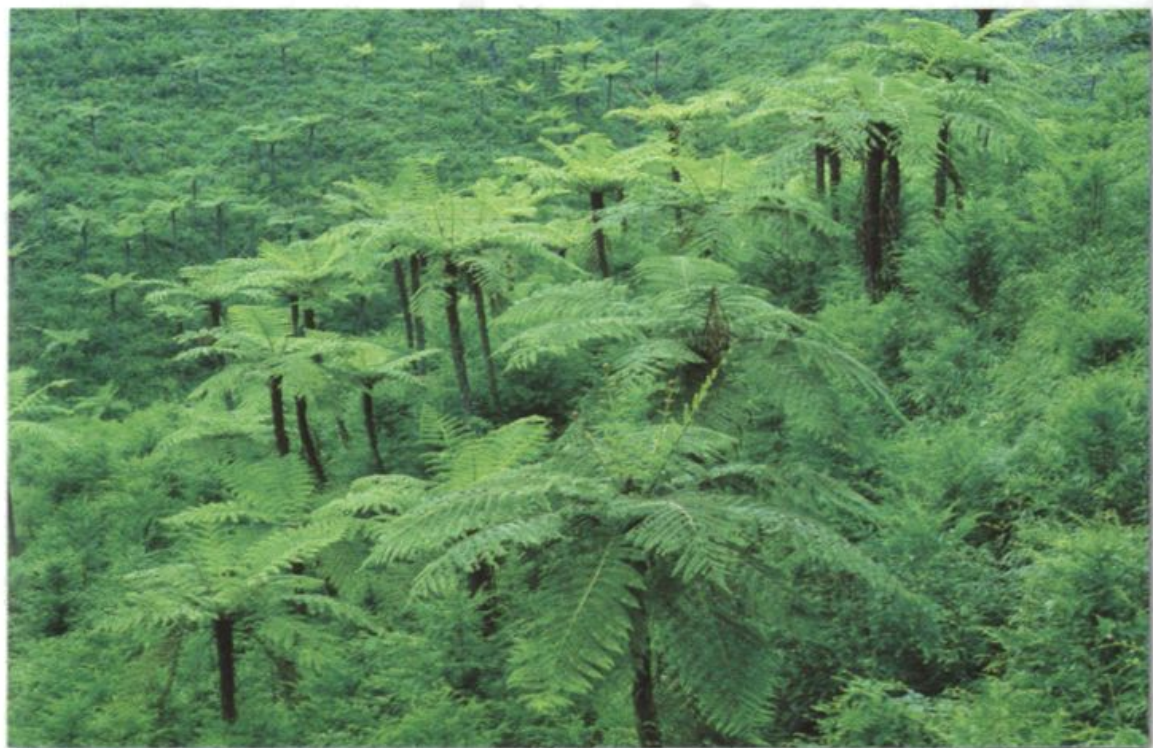
国家二级保护植物——桫欏