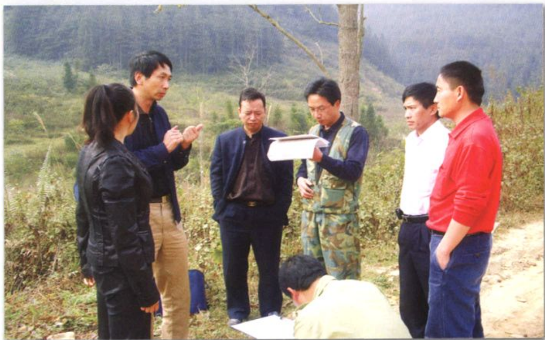
云南省林业厅重点公益林检查组到金城林场对公益林的管护及资金使用情况进行检查指导