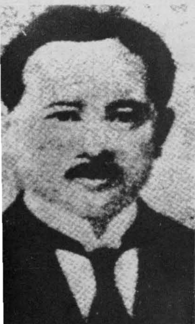
宋庆龄父亲宋耀如