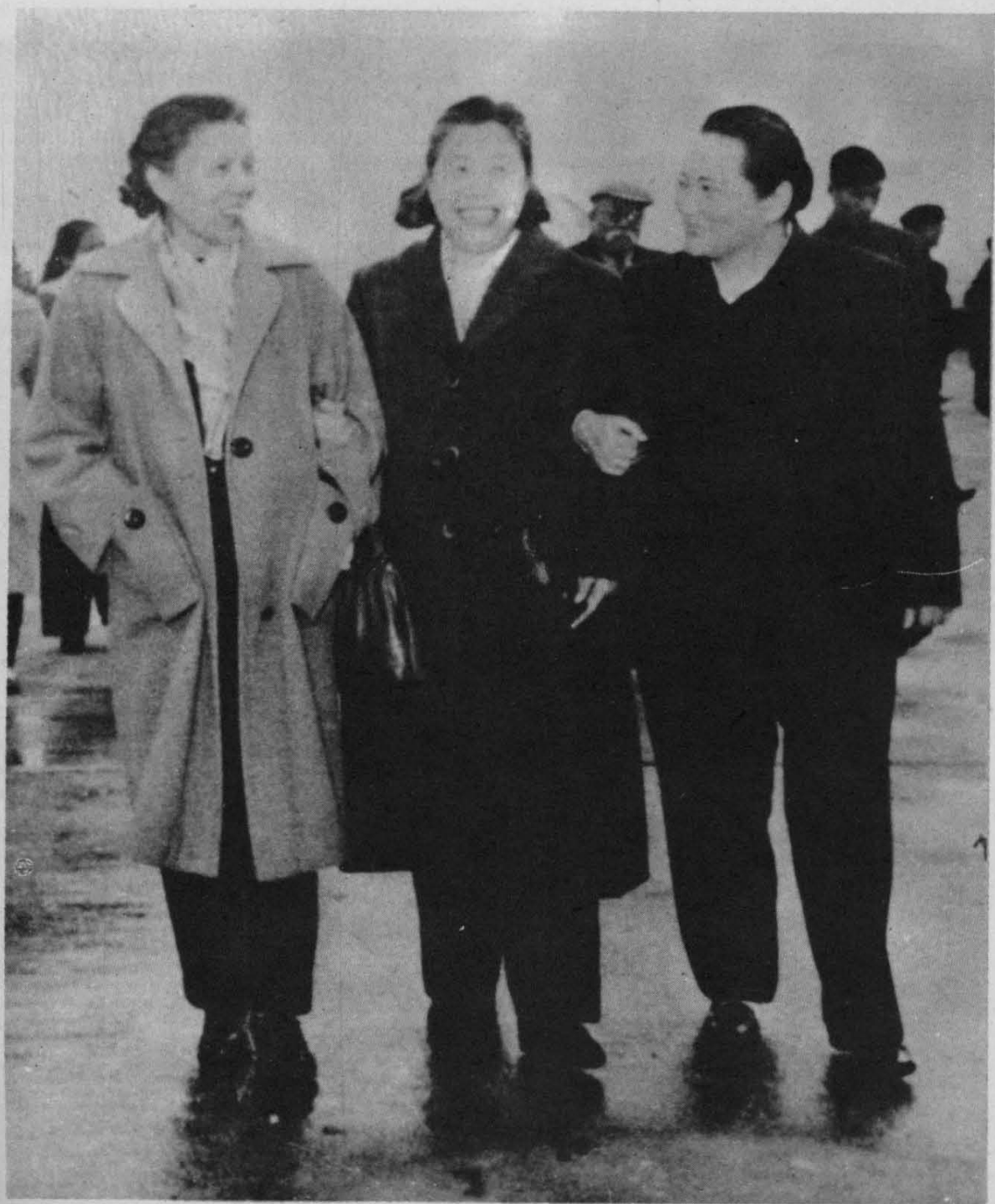
1960年4月，第二届全国人民代表大会第二次会议期间，宋庆龄和蔡畅、邓颖超在一起。