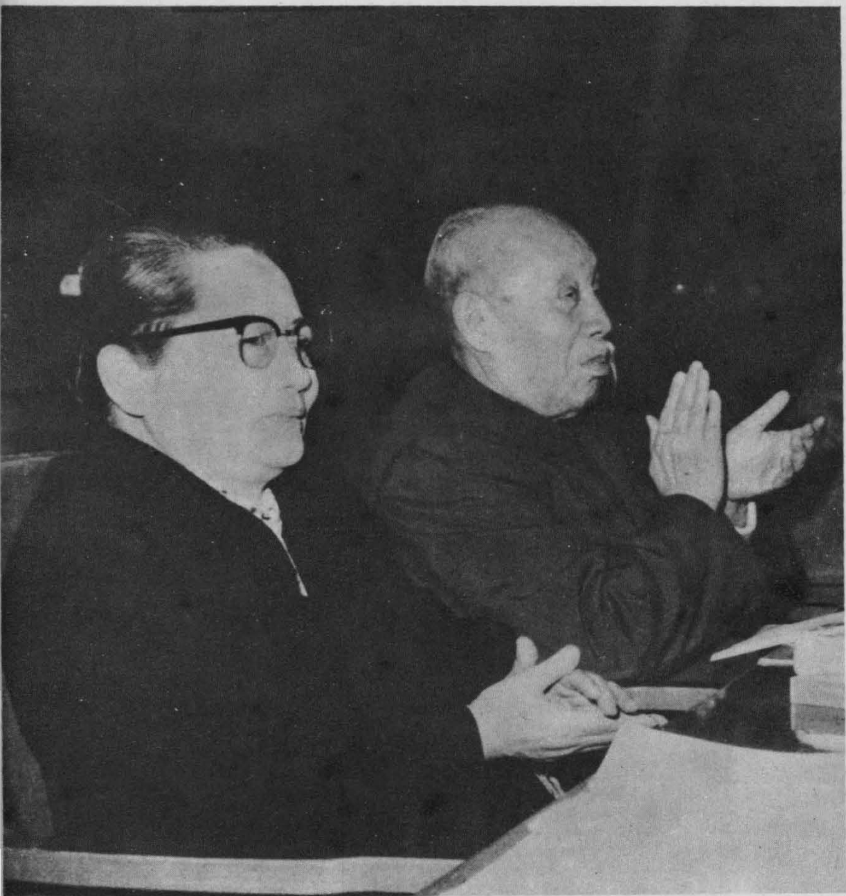
1965年1月，在第三届全国人民代表大会主席台上。在这次大会上，宋庆龄再次当选为中华人民共和国副主席。