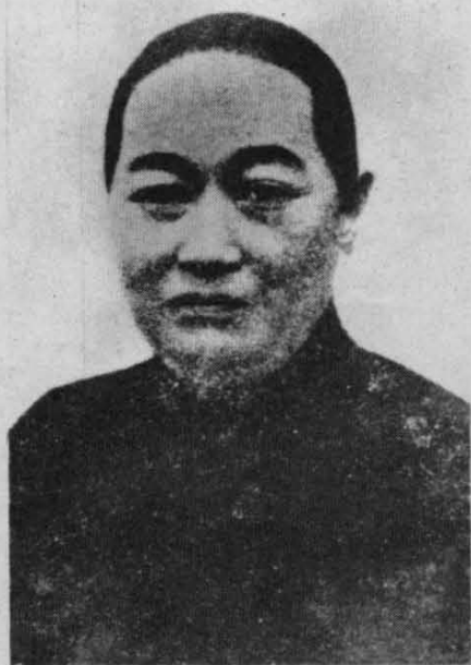
宋庆龄母亲倪桂珍