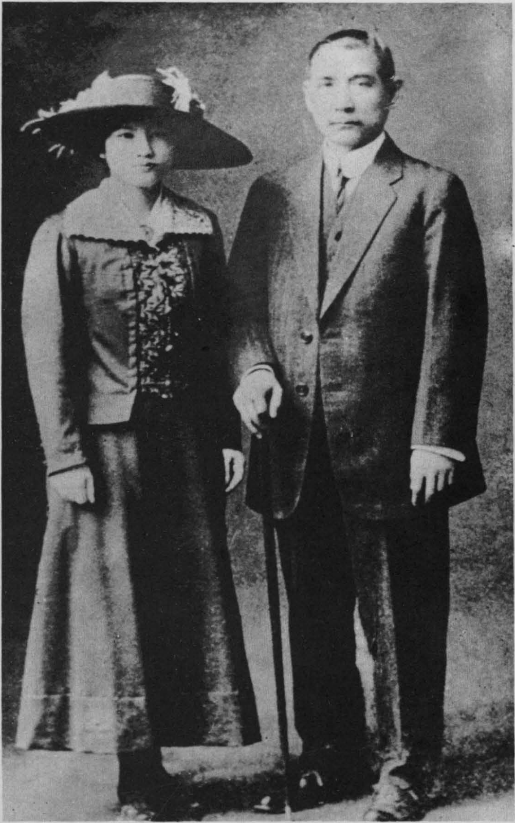
宋庆龄与孙中山婚后合影（一九一五年）