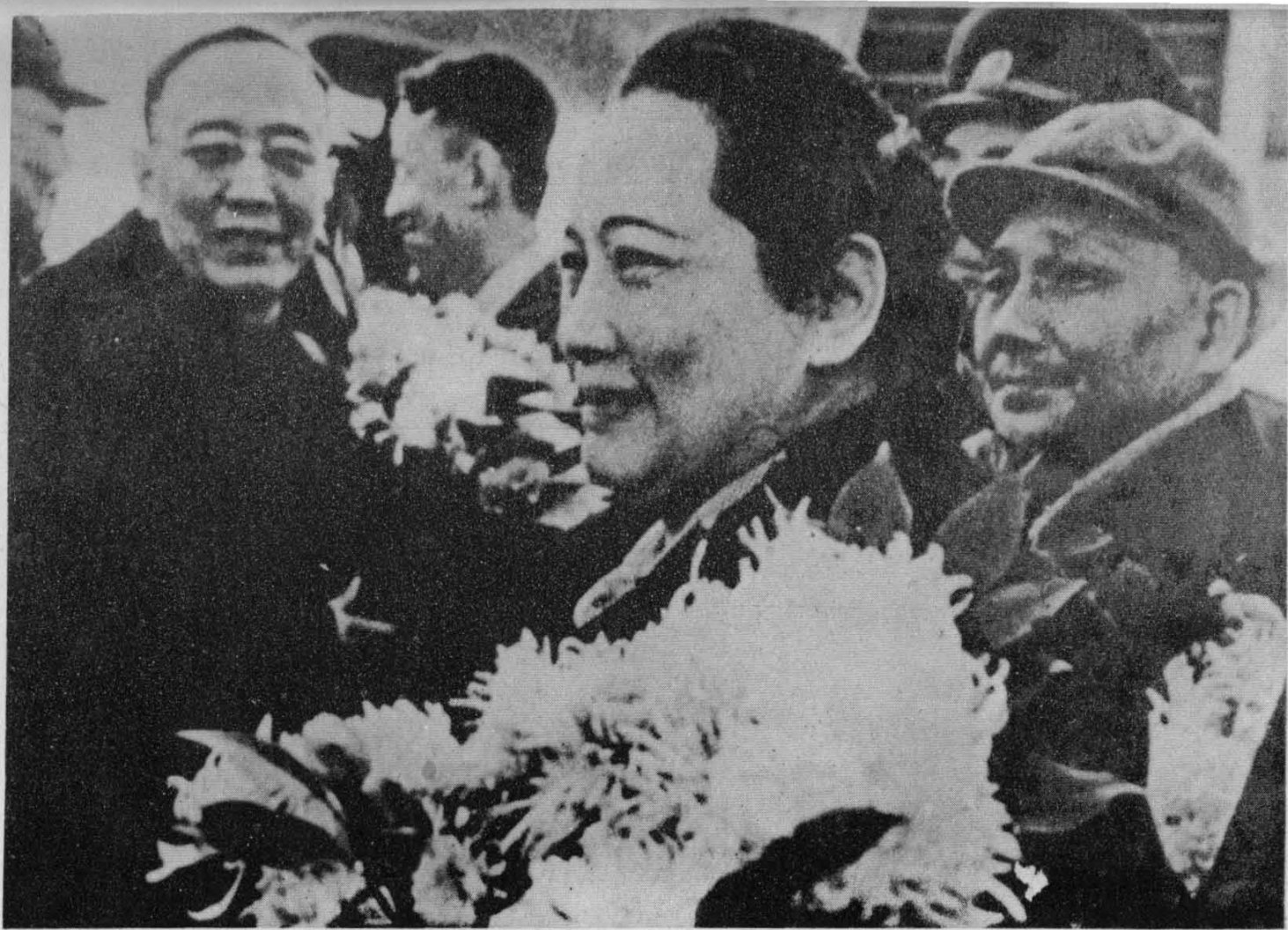
1957年11月，宋庆龄作为中国代表团成员，出席在莫斯科召开的社会主义国家共产党和工人党代表会议。中国代表团访苏归来，受到邓小平等党和国家领导人的热烈欢迎。