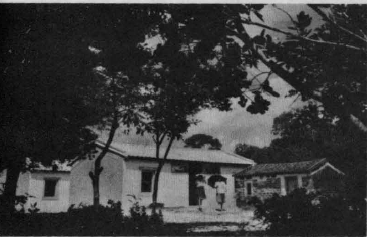
宋庆龄同志祖居（1985年重建）