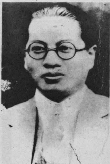
韩裕丰保存的宋子文照片（韩裕丰旅居马来西亚时收到宋子文所寄的照片。）