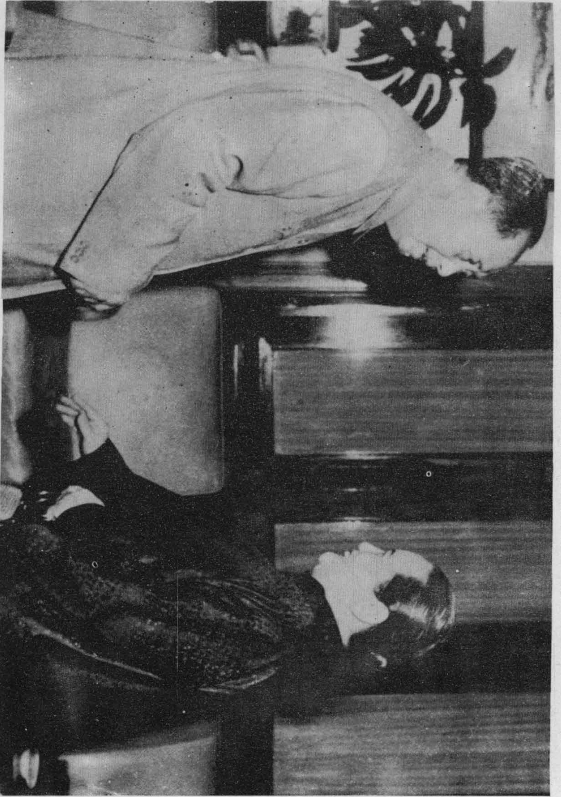
毛泽东到北京宋庆龄的住所看望宋庆龄。