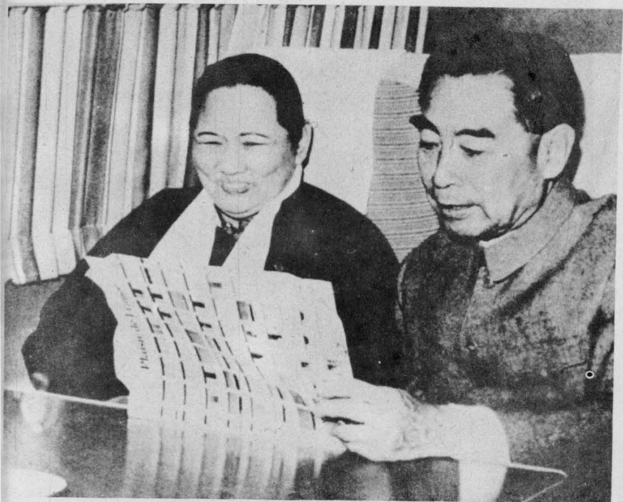
1964年2月，宋庆龄副主席和周恩来总理、陈毅副总理对锡兰进行国事访问，这是出访途中在专机上。