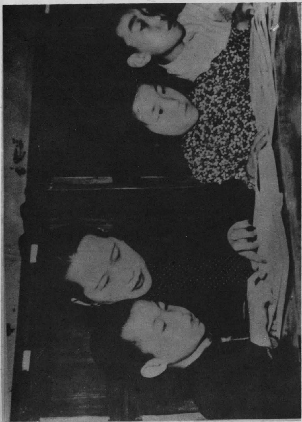
1947年，宋庆龄在指导识字班的孩子读书。