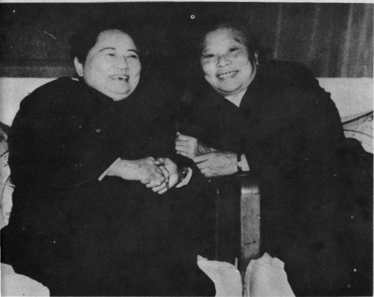
1980年，宋庆龄和康克清合影。