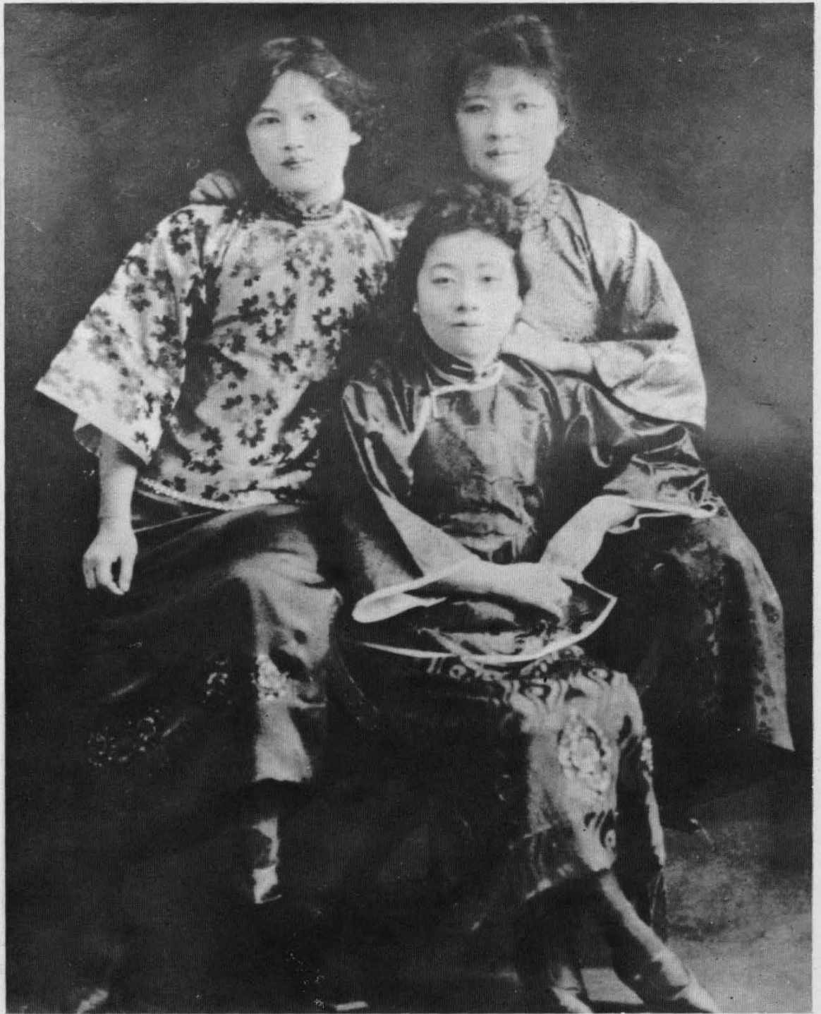
在美国威斯里安女子学院学习时的宋庆龄、 宋霭龄（中）、宋美龄（右）。