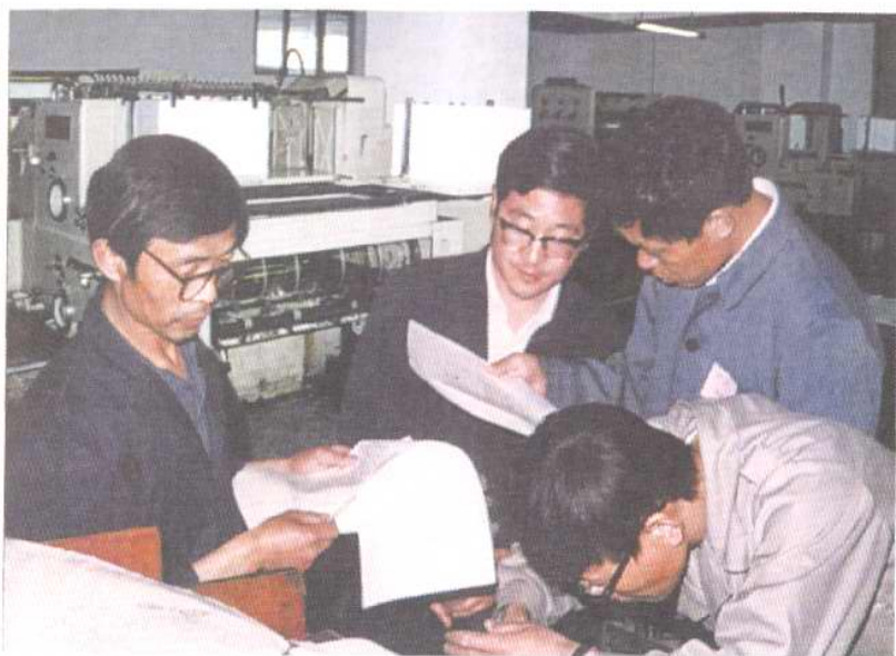
天津新华印刷一厂的职工，在研究印刷质量