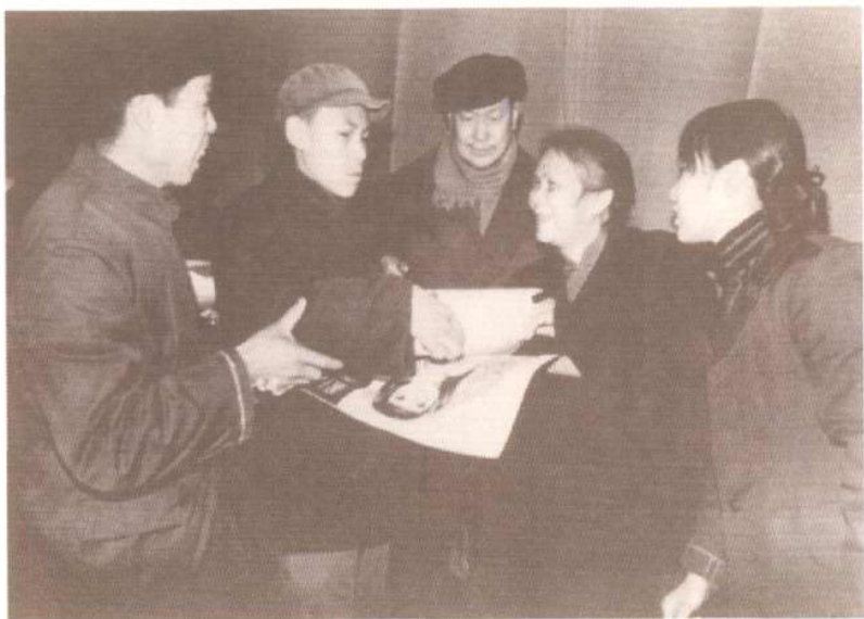
新蕾出版社自建社起经常重视组织青少年作文竞赛活动，以提高青少年的写作水平。图中是80年代初该社领导向获奖的盲童赠送奖品