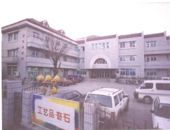
天津人民美术出版社外景

1949年1月19日、2月19日，新华书店天津分店第一、第二门市部先后开业。图为第二门市部50年代初店堂内、外景