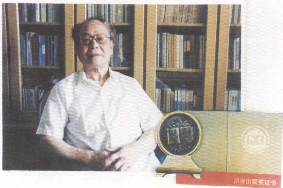
1995年，天津市著名出版家徐柏容荣获全国出版韬奋奖