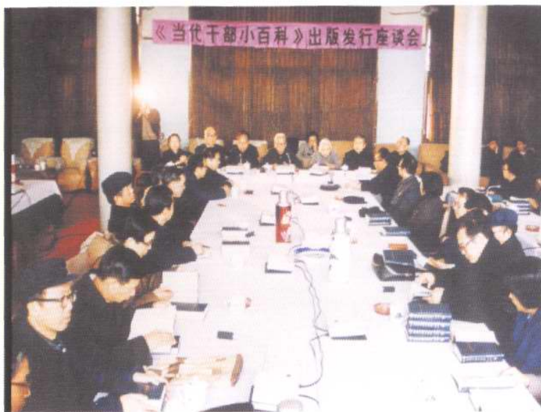
天津人民出版社经常举办本版图书座谈会，以推动名牌图书的出版。图为1986年3月，该社在中央党校举办的《当代干部小百科》出版发行座谈会