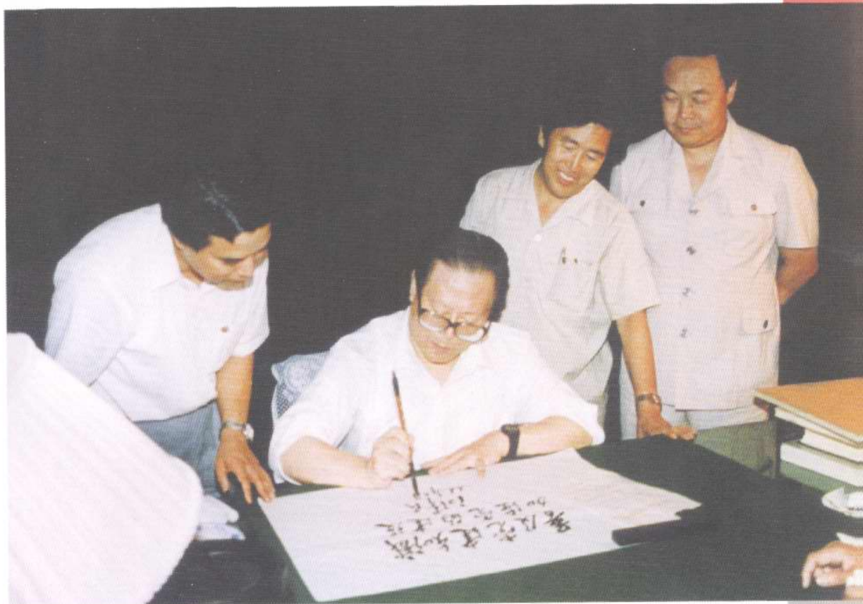
1991年7月29日，中共中央总书记江泽民为天津《支部生活》题词：“普及党建知识 加强党的建设”