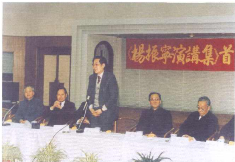
世界物理诺贝尔奖获得者杨振宁教授(左2)于1988年参加南开大学出版社举办的《杨振宁演讲集》首发式