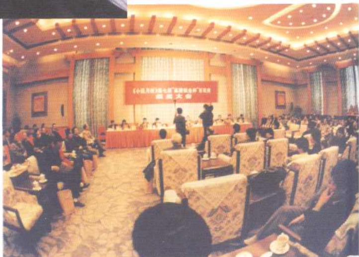
1997年11月，百花文艺出版社在北京人民大会堂举办《小说月报》第七届百花奖颁奖大会