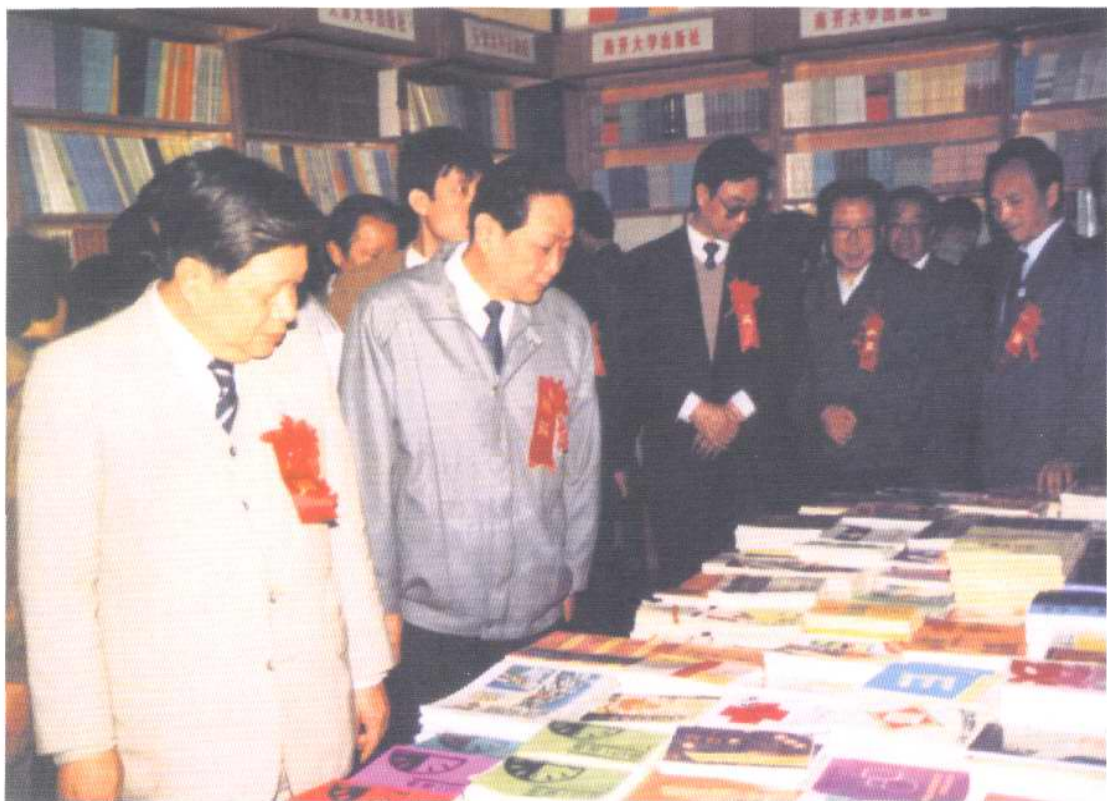
1992年5月，中共中央政治局委员、天津市委书记谭绍文（左2）、中共中央宣传部常务副部长徐惟诚（左1）、中共天津市委常委刘峰岩（左3）等视察'92天津图书音像交易会