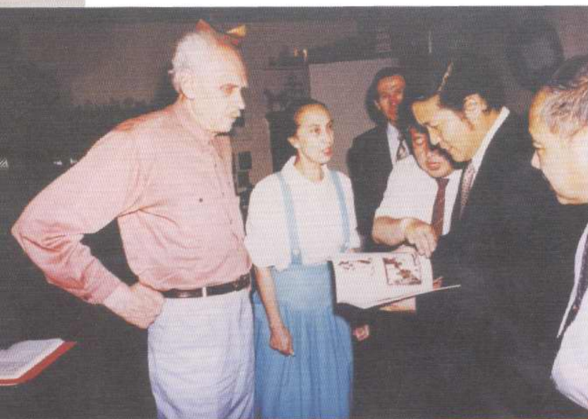
天津人民美术出版社在国内美术界中率先派员走出国门组织稿件。图为1997年7月该社领导在俄罗斯列宾美术学院与院长叶里米耶夫（左1）联系工作