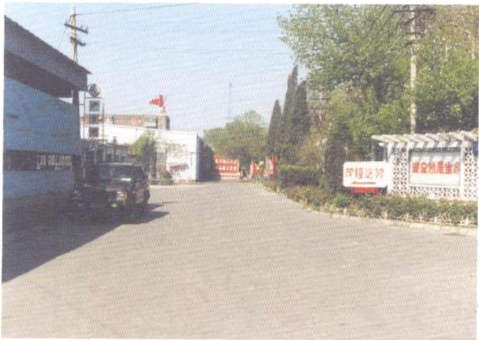
天津新华印刷二厂外景