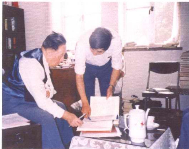
1992年秋天,天津科学技术出版社编辑在向中国科学院院士吴阶平教授(左1)请教问题