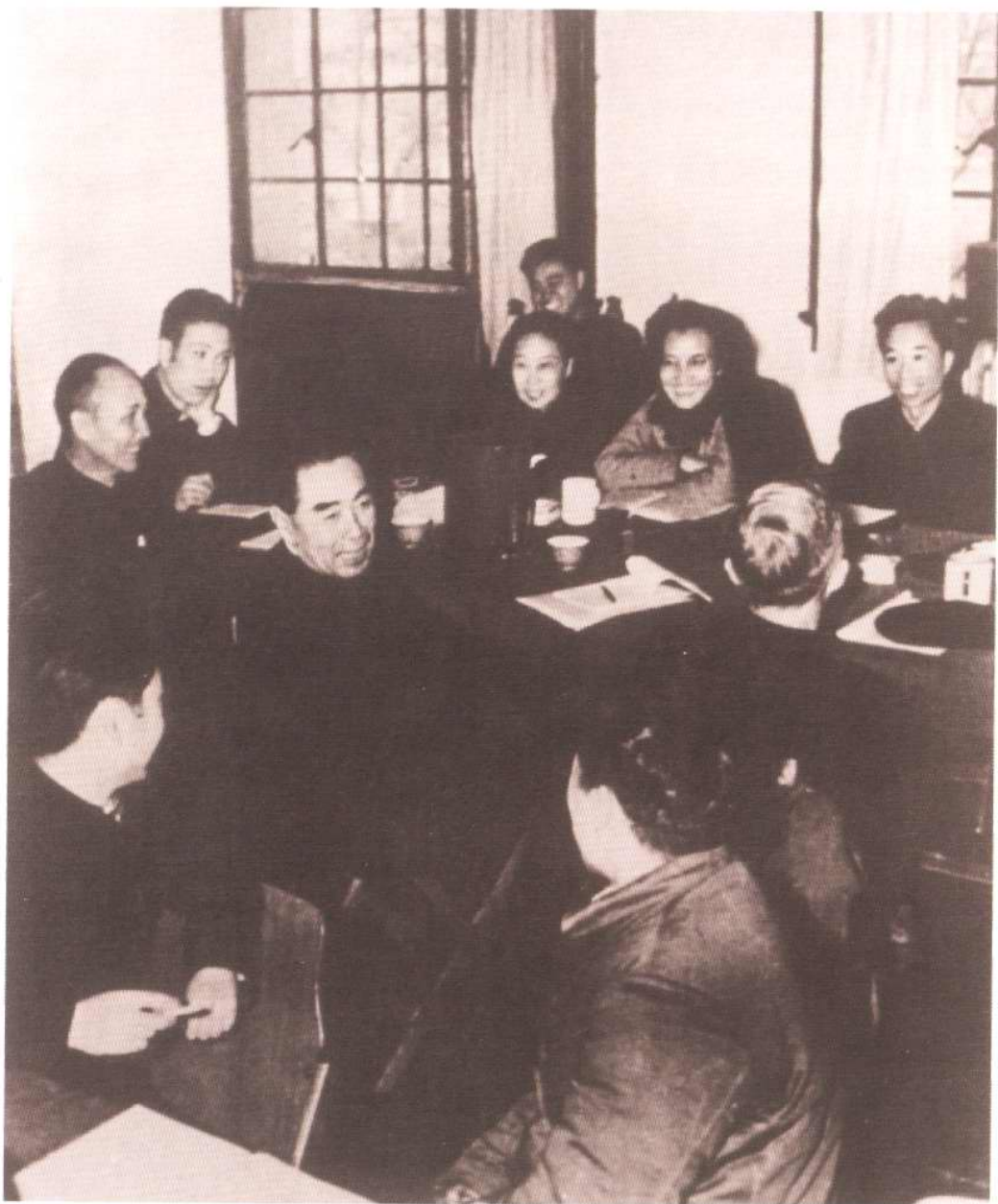
1954年，中共天津市第一次党代会期间，国务院总理周恩来与天津宣传系统代表亲切交谈。后排（右1）为林呐（后任百花出版社社长）