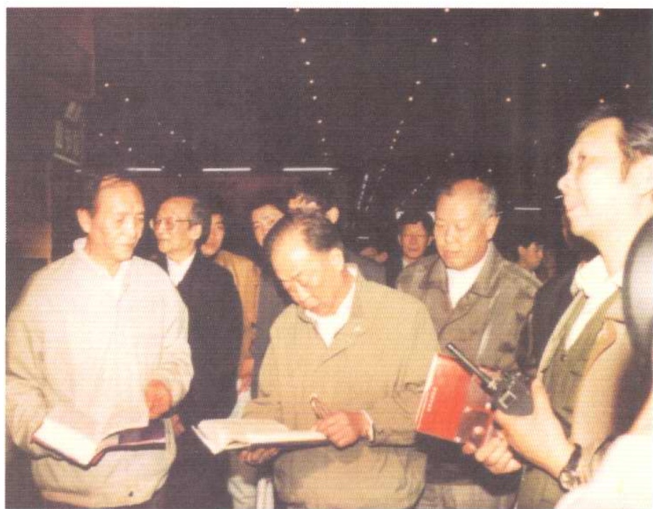
1992年5月，中共天津市委副书记、市长聂壁初（中），在市委宣传部部长谢国祥（左2）、市新闻出版局领导郝志崇（右2）、陈旭（左1）陪同下，参观'92天津图书音像交易会