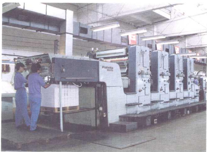
天津美术印刷厂印刷车间。图为该厂引进的德国普兰尼塔大全开四色胶印机